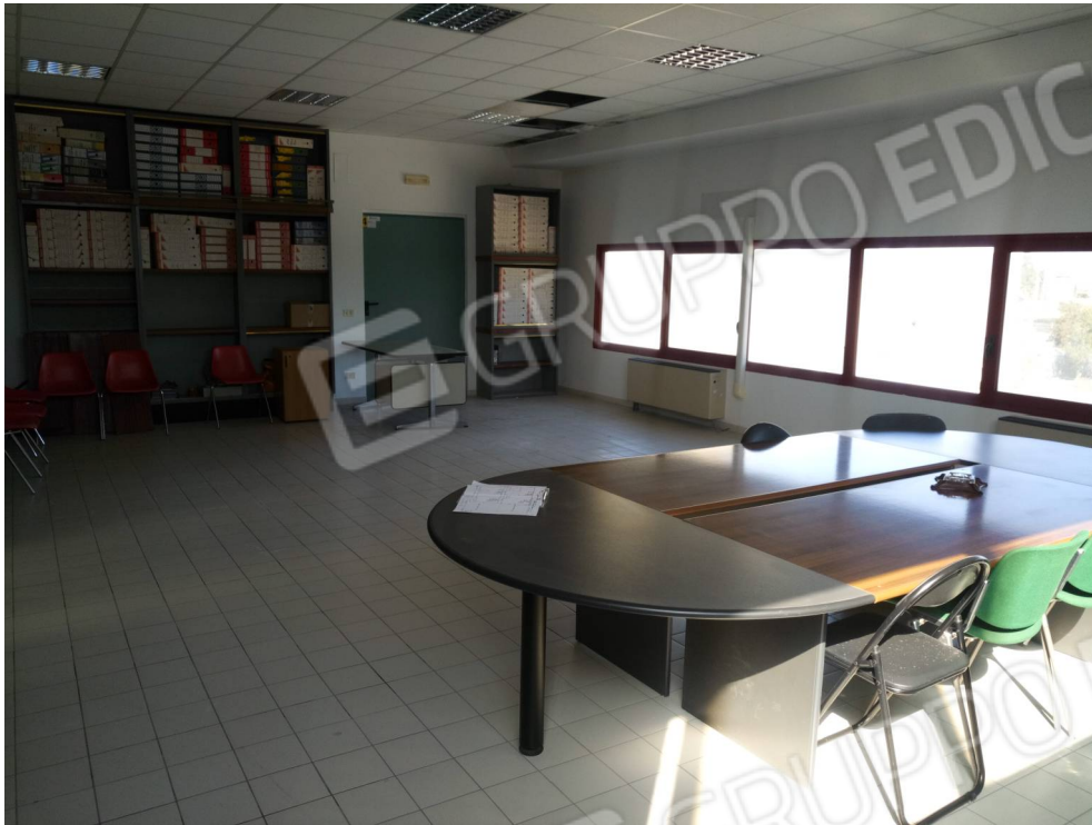
foto 9: piano primo - sala riunioni con porta REI di accesso al filtro scala esterna di sicurezza