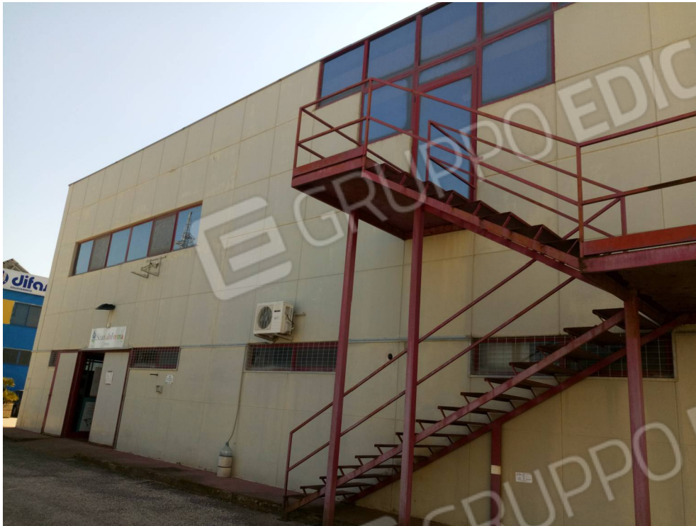
foto 1: prospetto Nord - particolare scala di sicurezza lotto1 e 2