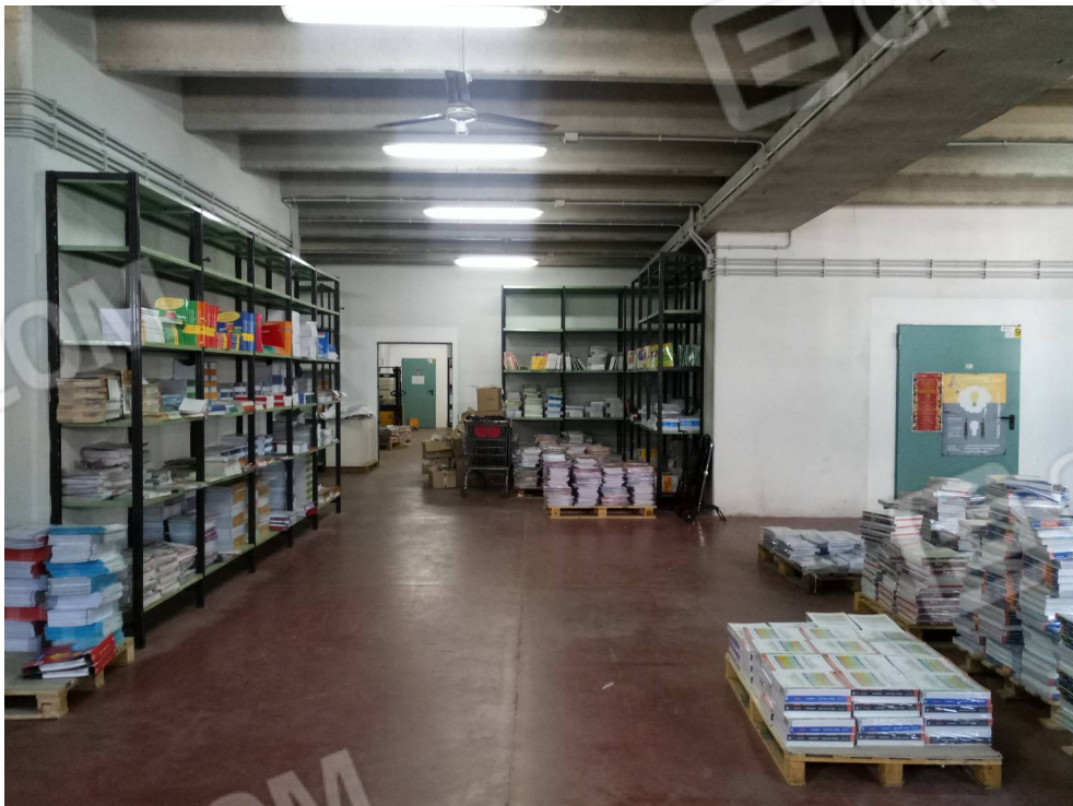
foto 6: piano terra – vano principale con varco di comunicazione con lotto 2 sullo sfondo