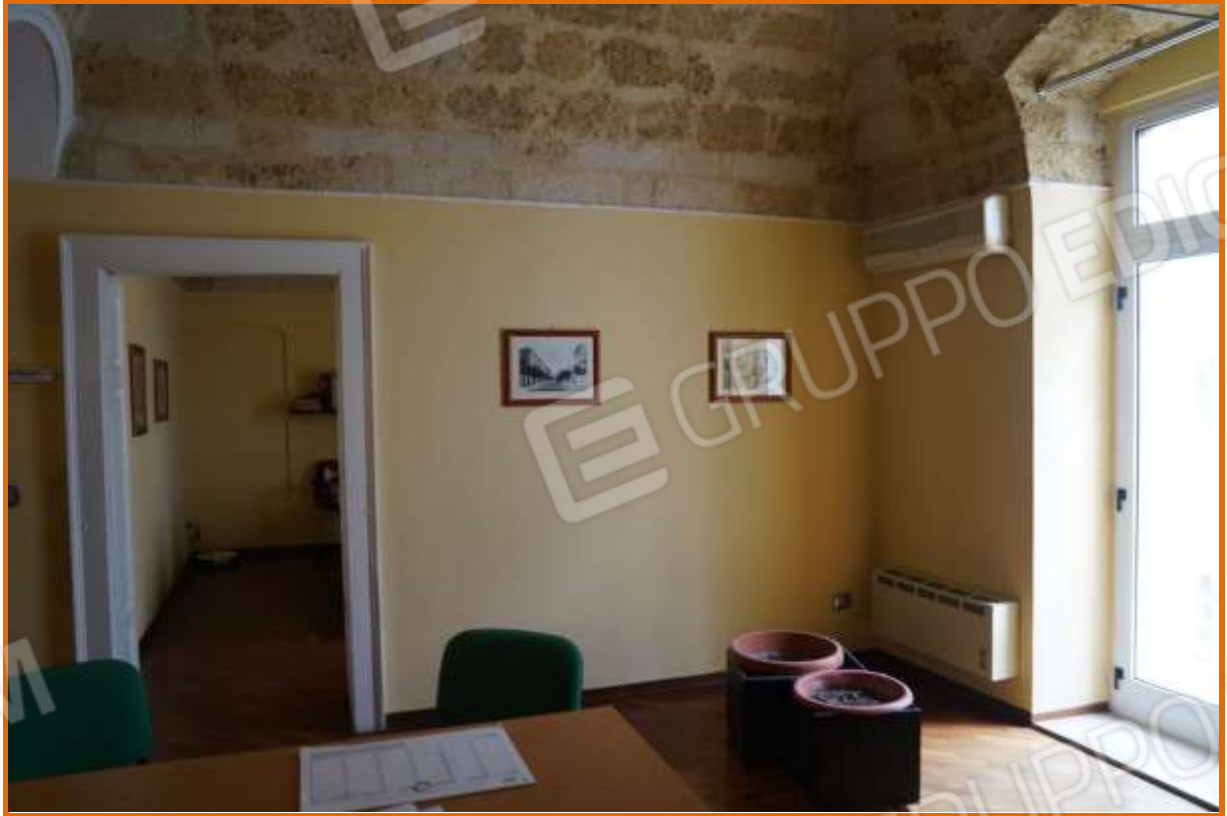
FOTO n° 17. Come foto n° 16. Vista verso la direzione nord-est. A destra è visibile il finestrone che prospetta con balcone su cortile interno. Frontalmente è visibile l'apertura di porta che immette alla seconda sala riunioni.