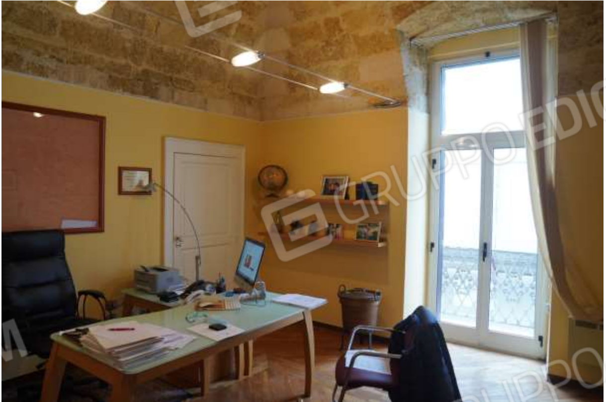
FOTO n° 8. Come foto n° 7. Vista verso la direzione sud-ovest. Il finestrone visibile sulla parete di compagno prospetta con un balcone sulla via Carducci.