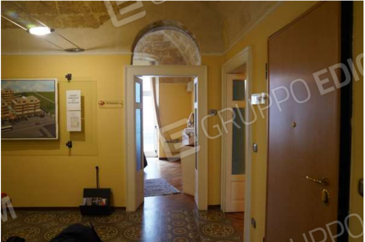
FOTO n° 6. Come foto n° 5.-ovest. In primo piano a destra è visibile il portoncino di ingresso; frontalmente è visibile l'apertura di porta che immette al vano contiguo adibito a studio professionale; lateralmente a destra è visibile l'altra apertura di porta che immette alla sala riunioni.