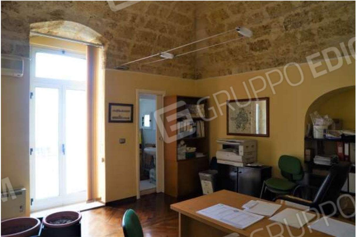
FOTO n° 16. Secondo vano ad uso studio professionale. Vista verso la direzione sud-est. Il finestrone prospetta con un balcone verso un cortile interno. Sulla stessa muratura di compagno è visibile un'apertura di porta che immette ad un bagno doppio servizio.