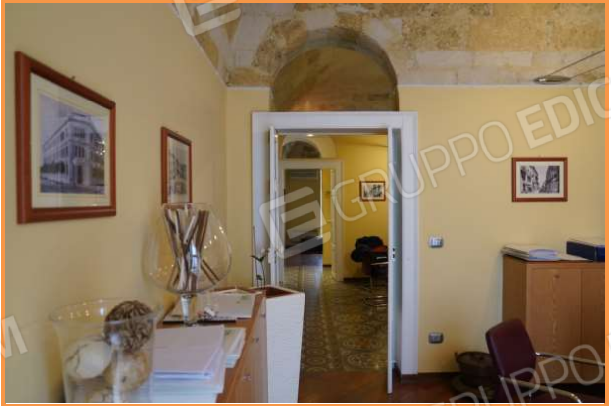
FOTO n° 9. Come foto n° 7, vista verso l'ingresso-segreteria, nella direzione est.