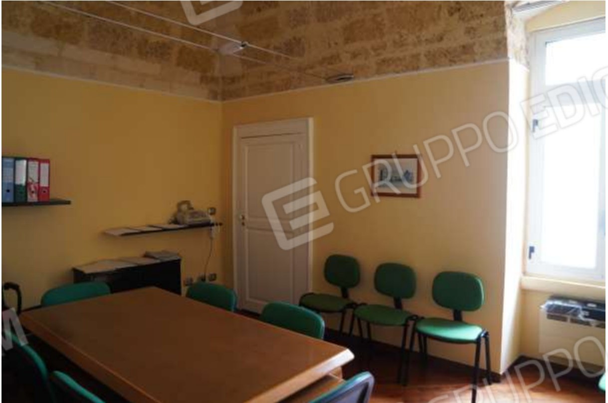
FOTO n° 19. Seconda sala riunioni, contigua al secondo vano studio. Vista verso direzione nord-est.