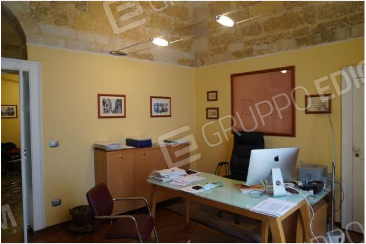
FOTO n° 7. Vano studio professionale contiguo al vano ingresso-segreteria. Vista verso la direzione sud-est.