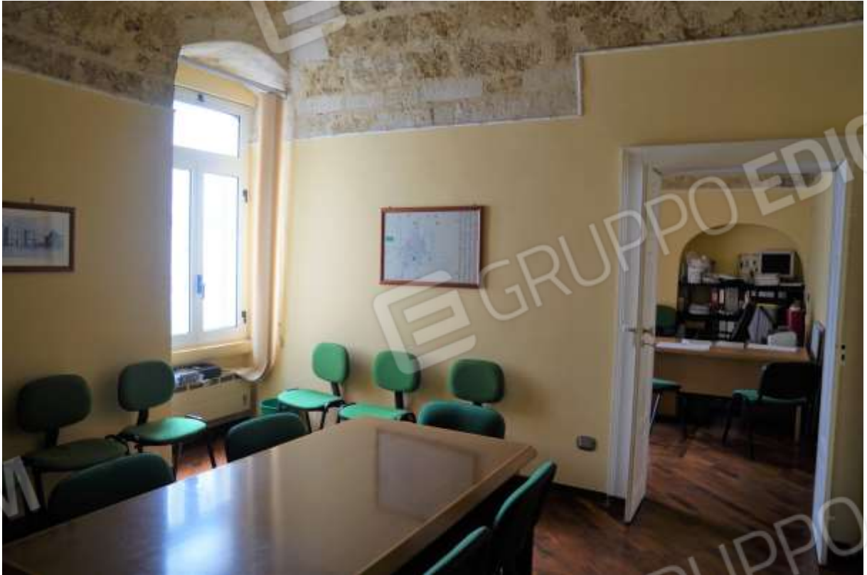
FOTO n° 20. Come foto n° 19. Vista verso la direzione sud-est. La finestra prospetta sul cortile interno. L'apertura di porta mostra la parete di fondo del contiguo vano studio.