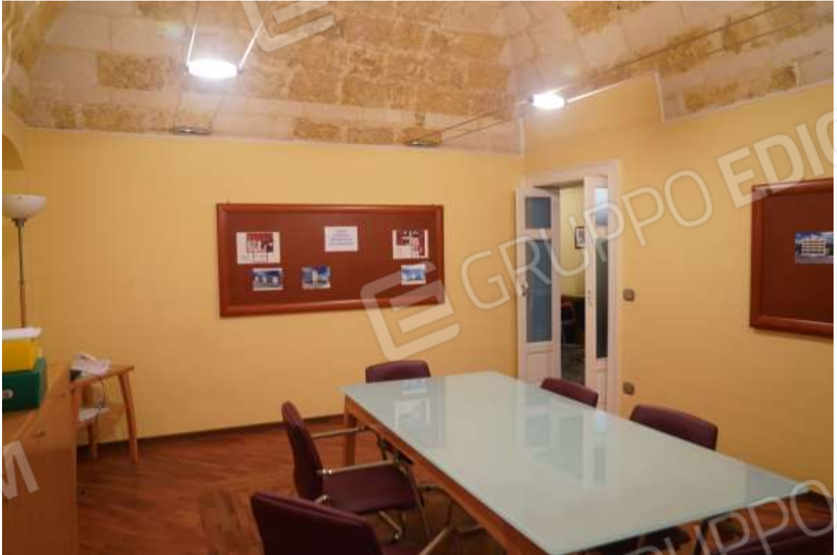
FOTO n° 11. Come foto n° 10. Vista verso la direzione sud-est. L'apertura di porta immette al vano ingresso-segreteria.