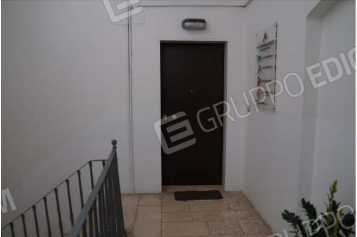
FOTO n° 4. Ballatoio di arrivo del primo piano. Vista verso la direzione sud del portoncino di accesso all'unità staggita.