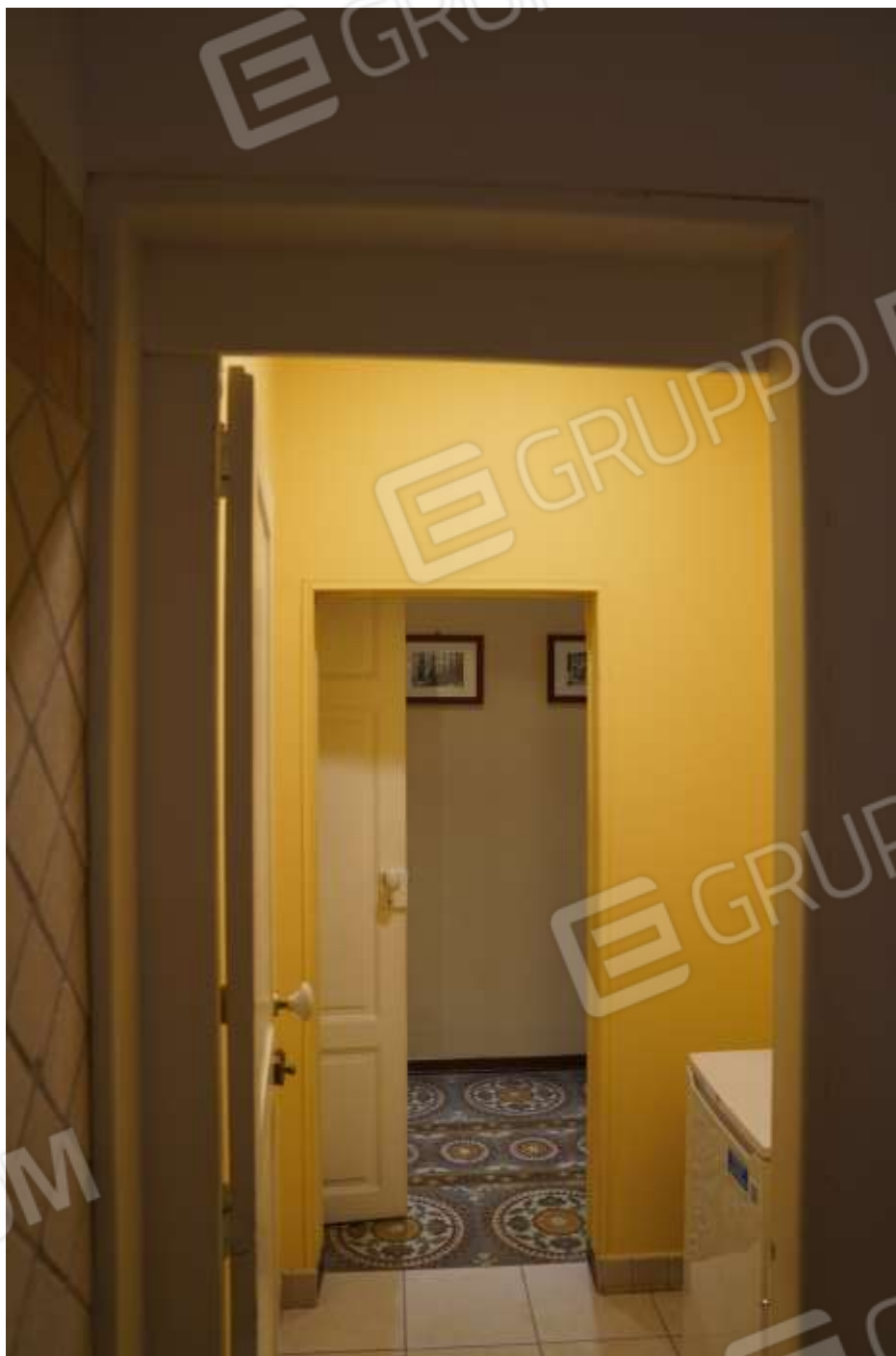
FOTO n° 14. Come foto n° 13, vista verso la direzione nord dal bagno verso l'antibagno e verso il corridoio.