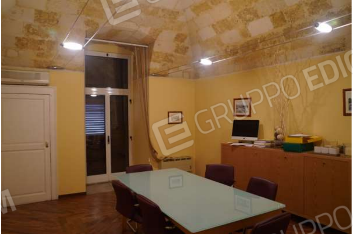
FOTO n° 10. Vano adibito a sala riunioni, accessibile dall'ingresso-segreteria. Vista verso la direzione nord-ovest. Il finestrone visibile sulla parete di compagno prospetta con un balcone sulla via Carducci. Lo stipo a muro che è chiuso dalla porta in legno di colore bianco contiene la caldaia termica murale per la produzione dell'acqua calda sanitaria e dell'impianto di riscaldamento.