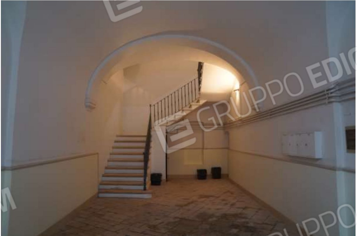
FOTO n° 3. Edificio con accesso dal civico 17 di via Carducci. Particolare dell'androne e del corpo scala. Vista verso la direzione est.