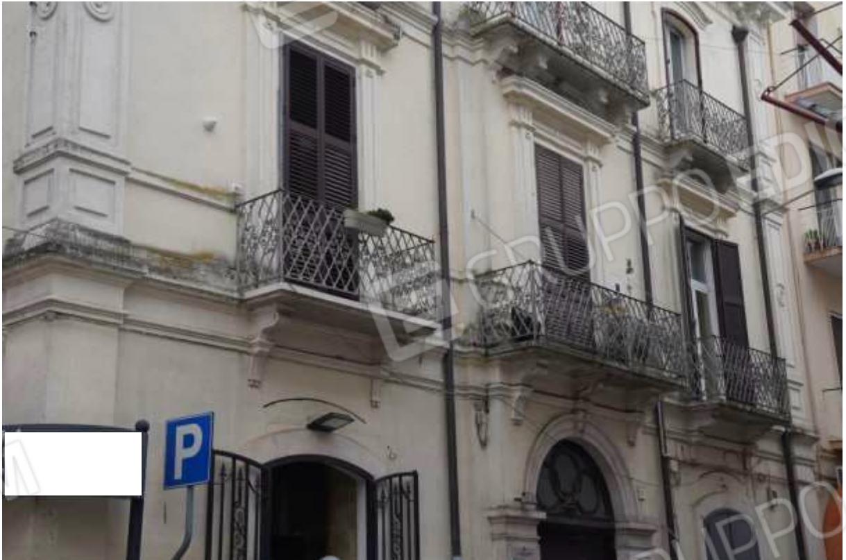
FOTO n° 2. Come foto n° 1. Particolare del prospetto di primo piano sulla via Carducci. I finestroni afferenti all'unità staggiata sono quello centrale e quello contiguo, a destra di chi osserva.