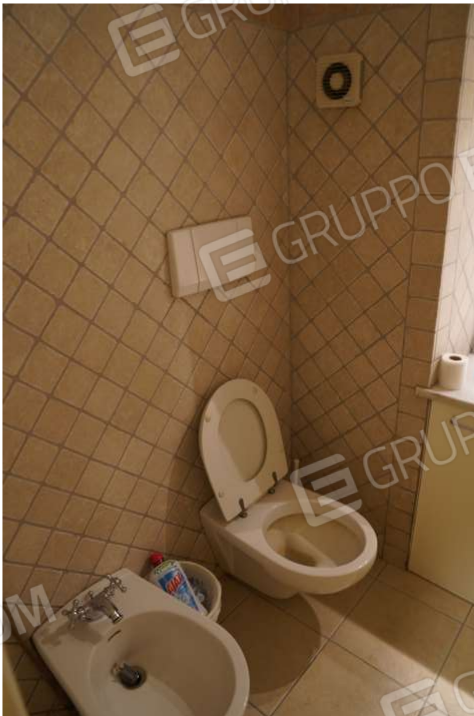
FOTO n° 15. Vano bagno, particolari. Vista verso la direzione sud-est.