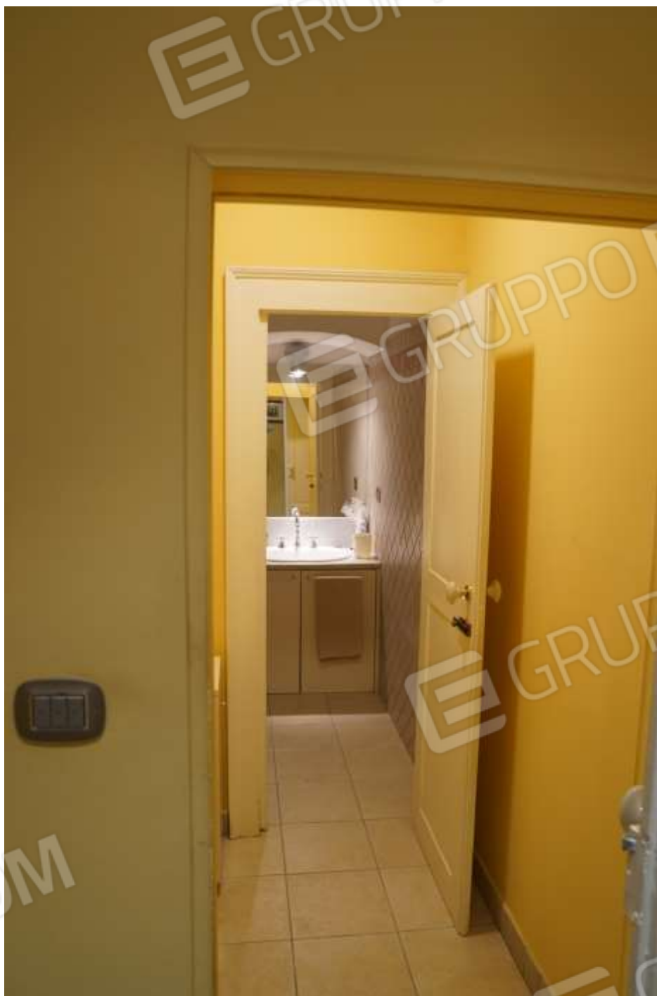
FOTO n° 13. Vista verso la direzione sud, dal corridoio verso l'antibagno ed il bagno.