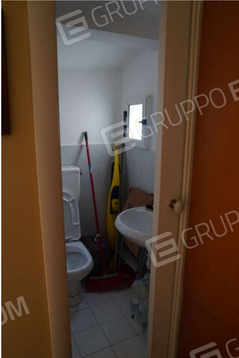
FOTO n° 18. Vano bagno-doppio servizio. Particolari. Vista verso la direzione est.