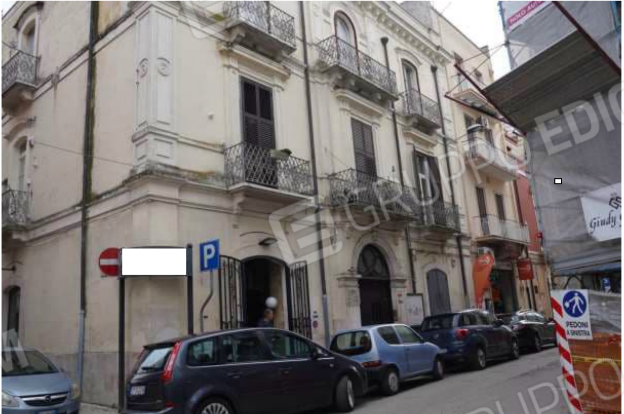
FOTO n° 1. Gioia Del Colle. Edificio con accesso dal civico 17 di via Carducci. L'unità immobiliare staggita è sita al primo piano. Vista verso la direzione sud-est, lungo la via Carducci.