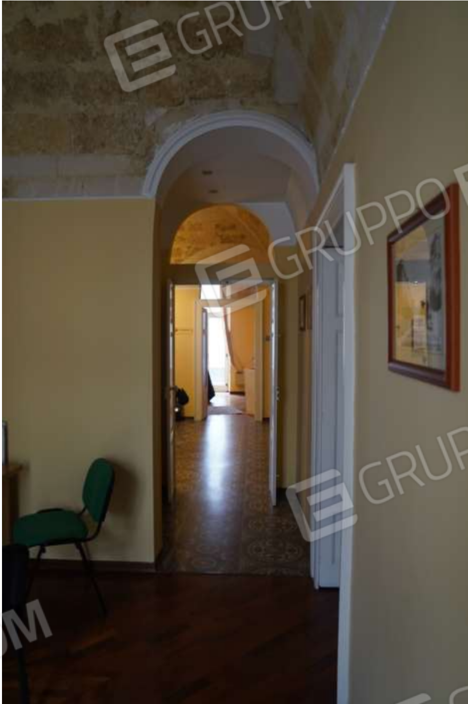
FOTO n° 12. Corridoio che disimpegna l'ingresso-segreteria e immette al vano bagno e ad un secondo vano adibito a studio professionale. Vista dal vano adibito a studio verso il corridoio; vista verso la direzione ovest. Sul fondo è visibile il passaggio attraverso il vano segreteria-ingresso ed oltre è visibile la porta di accesso al vano studio professionale.