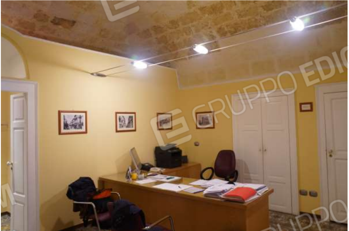
FOTO n° 5. Vano ingresso all'unità staggiata, vista verso la direzione sud-est. Destinazione d'uso, segreteria. A mano sinistra si intravede l'apertura di porta che immette al corridoio.