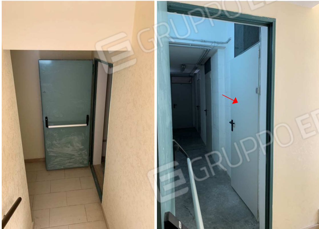
Foto nn. 9-10. Piano S1. Locale cantina