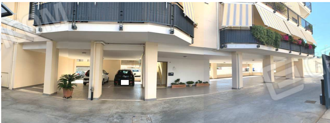
Foto nn. 1-2-3-4. Locale cantina al piano S1 (fg. n. 1 ptc. n. 3146 sub. n. 60) scala B, sito in Bari Palese (BA) al Vico XX Vittorio Emanuele nn. 29/31