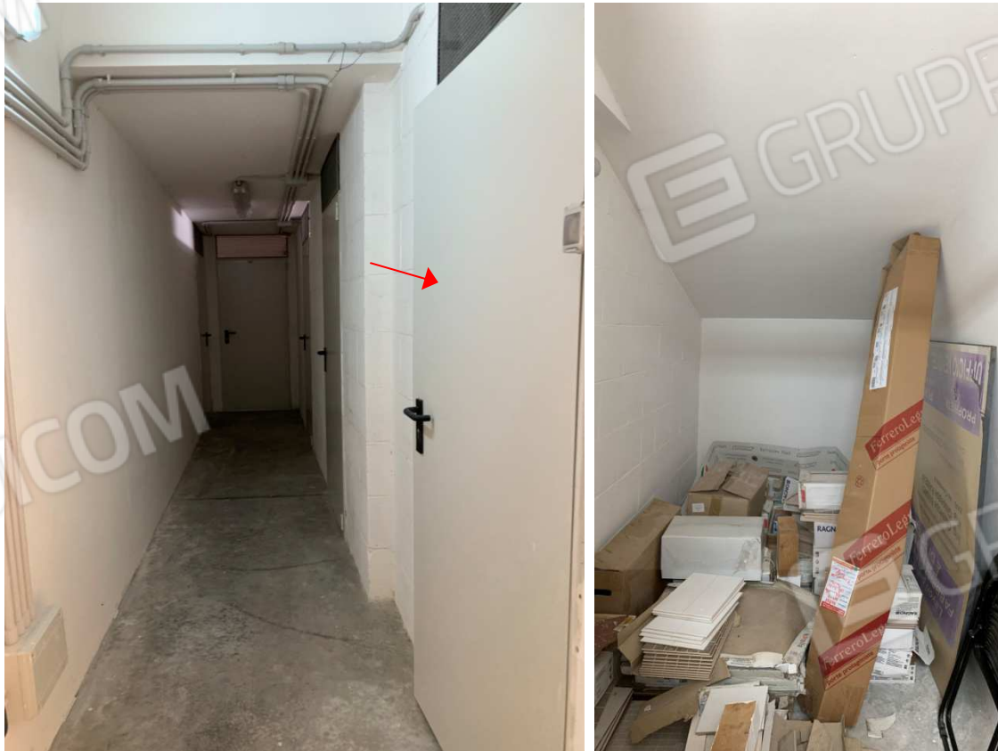
Foto nn. 11-12. Piano S1. Locale cantina