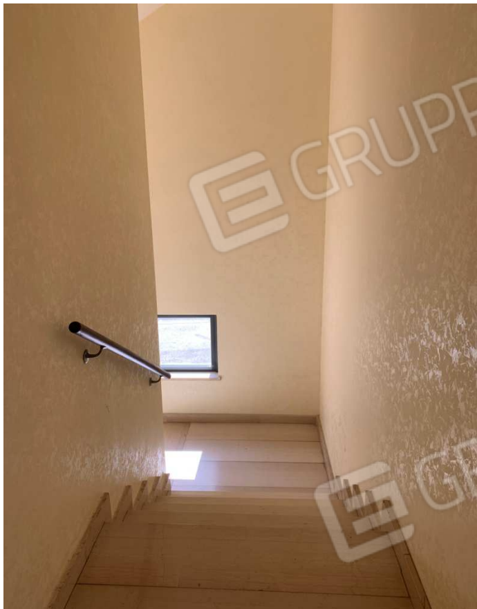
Foto nn. 5-6-7-8. Corpo scala B