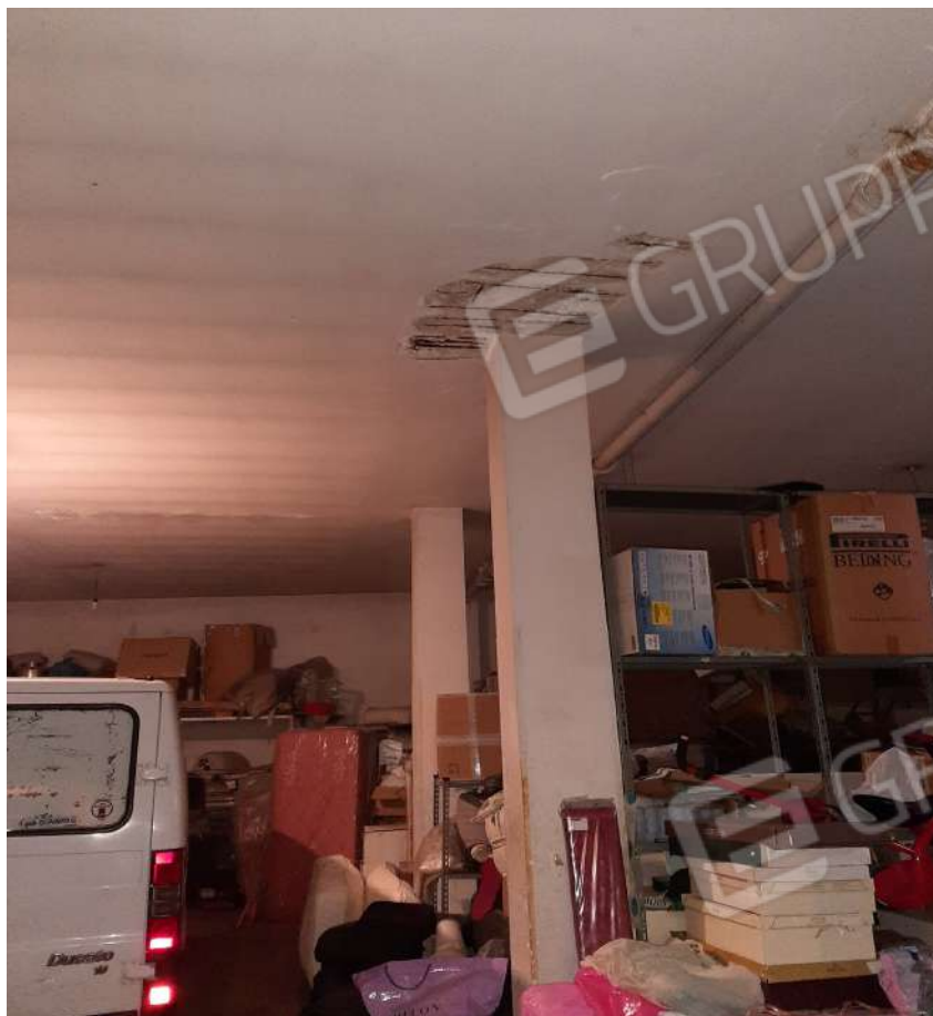
Foto n. 10 Fondo del locale