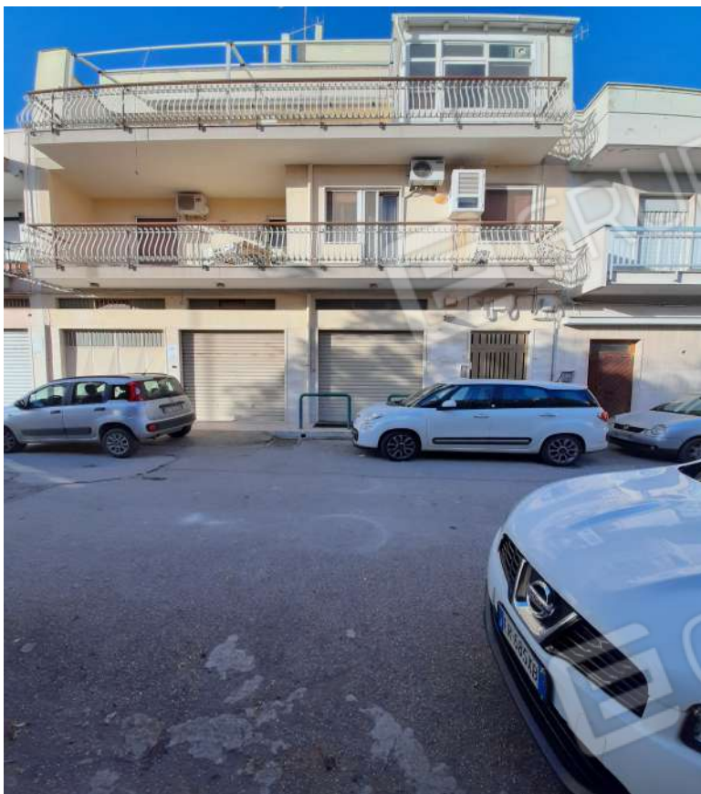
Foto n. 0 Prospetto