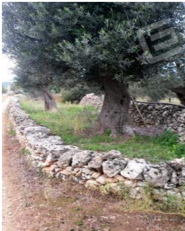
figura 12: lato est p.lla 84