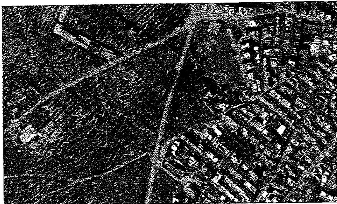
VISTA SATELLITARE - UBICAZIONE DEL TERRENO

In data 01.08.2013 si è dato inizio alle operazioni peritali rilevando quanto di seguito descritto dove, per una maggiore comprensione, si farà riferimento alla fotografia satellitare in basso ed all'estratto di mappa catastale (cfr. Allegato 1) rappresentato a pagina 3 della relazione.