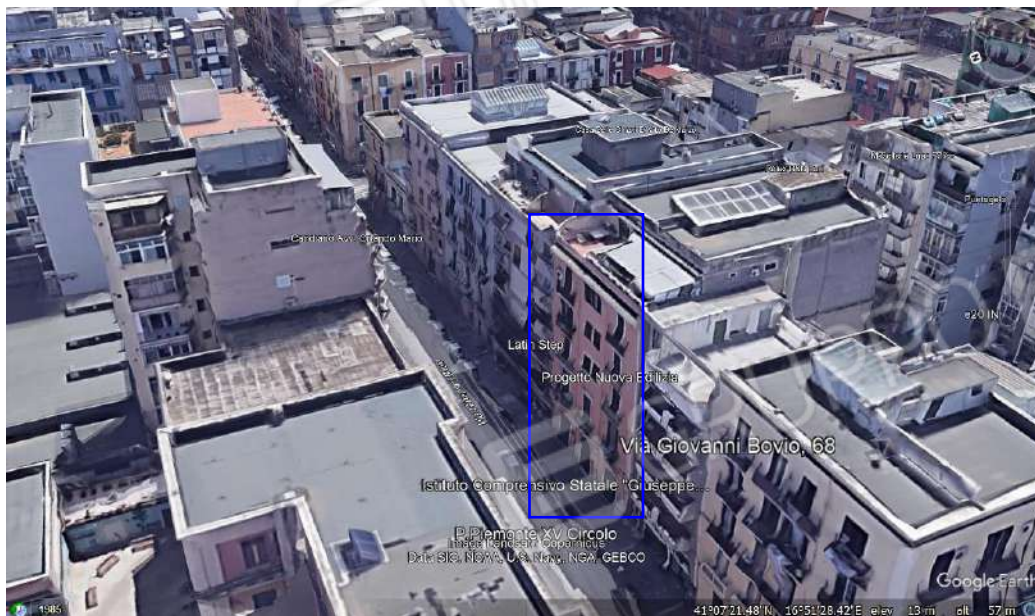
Immagine A. Prospetto principale, Via Bovio n. 68 Bari