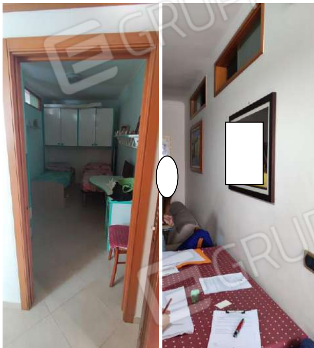
Foto nn. 6, 7. Stanza da letto ragazzi inglobata nel vano cucina/soggiorno

Componente della Commissione Forense presso l'Ordine degli Ingegneri della Prov. di Bari