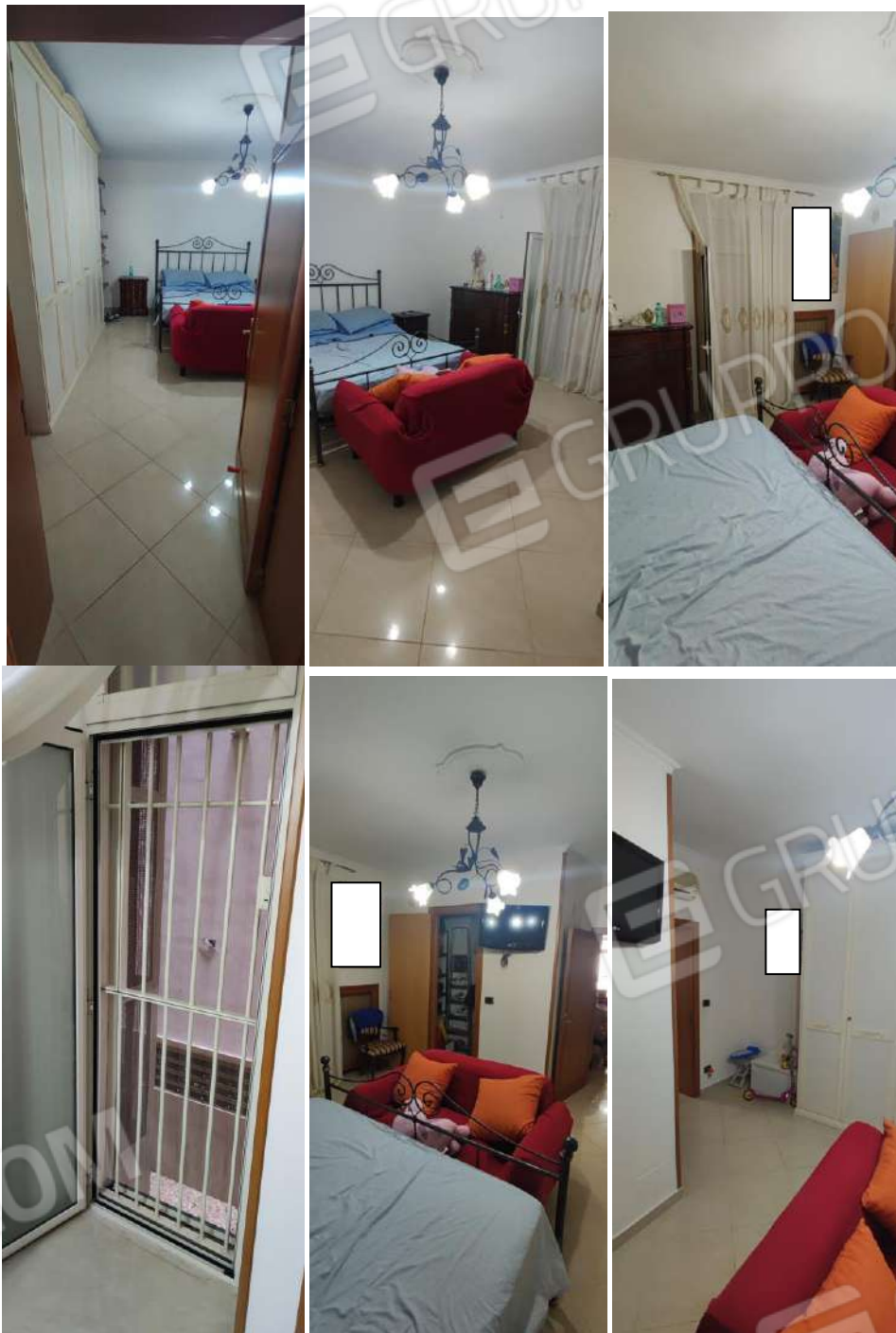
Foto nn.11, 12, 13, 14, 15, 16. Stanza da letto matrimoniale che ingloba il vano ripostiglio

Componente della Commissione Forense presso l'Ordine degli Ingegneri della Prov. di Bari