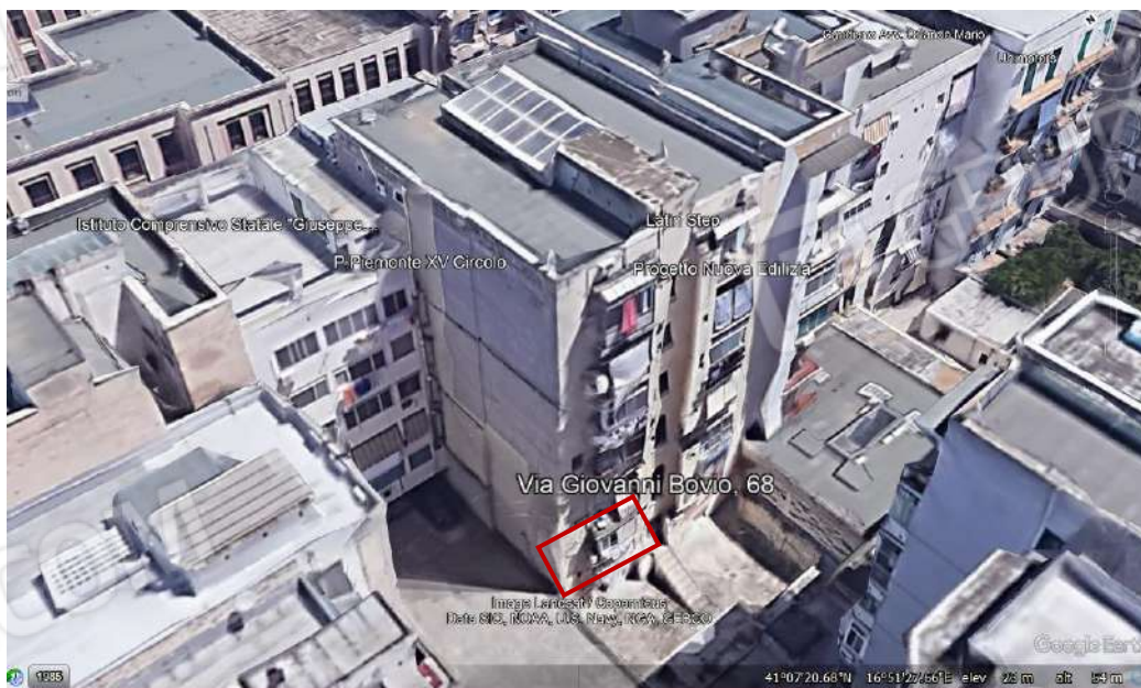
Immagine B, Google Earth. Individuazione dell'immobile sul prospetto atrio interno, Via Bovio n. 68 Bari