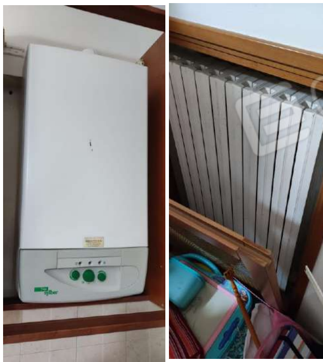
Foto nn. 19, 20. Caldaia e corpo radiante