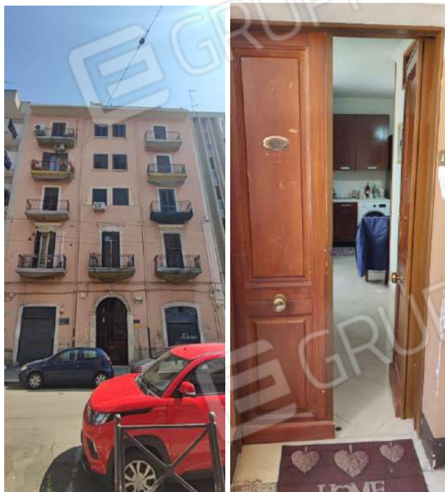
Foto nn. 1, 2. Prospetto condominio, ingresso appartamento

Componente della Commissione Forense presso l'Ordine degli Ingegneri della Prov. di Bari