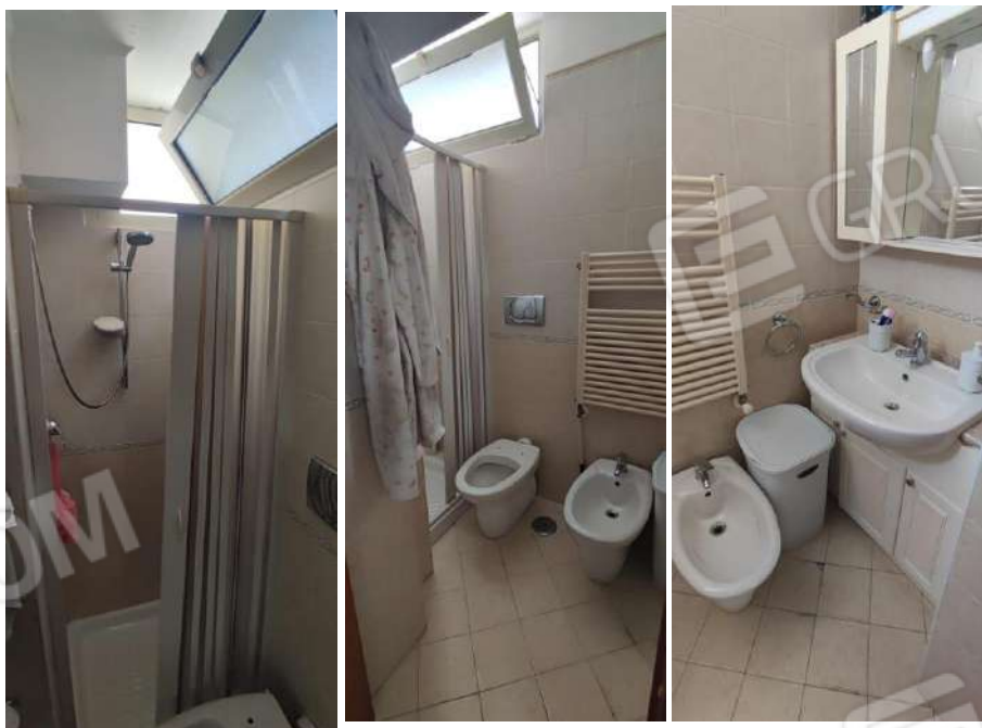
Foto nn. 8, 9, 10. Bagno, ampliato, su parte del balcone; il restante è verandato