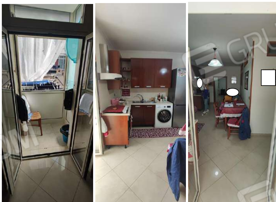
Foto nn. 3, 4, 5. Balcone in parte verandato, cucina soggiorno che inglobano la camera da letto ragazzi