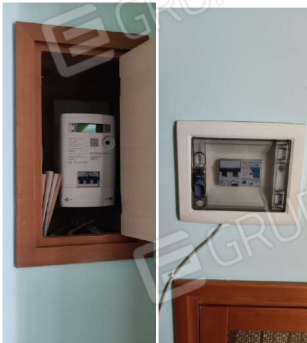
Foto nn. 17, 18. Contatore energia e relativo quadro elettrico

Componente della Commissione Forense presso l'Ordine degli Ingegneri della Prov. di Bari