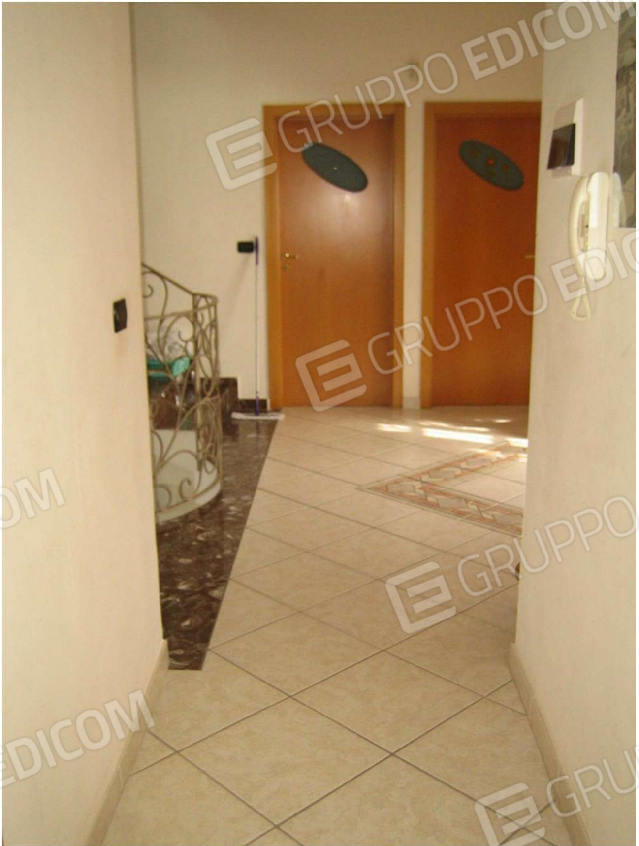
Foto n° 32 – disimpegno A22 al piano primo dell'Immobile pignorato