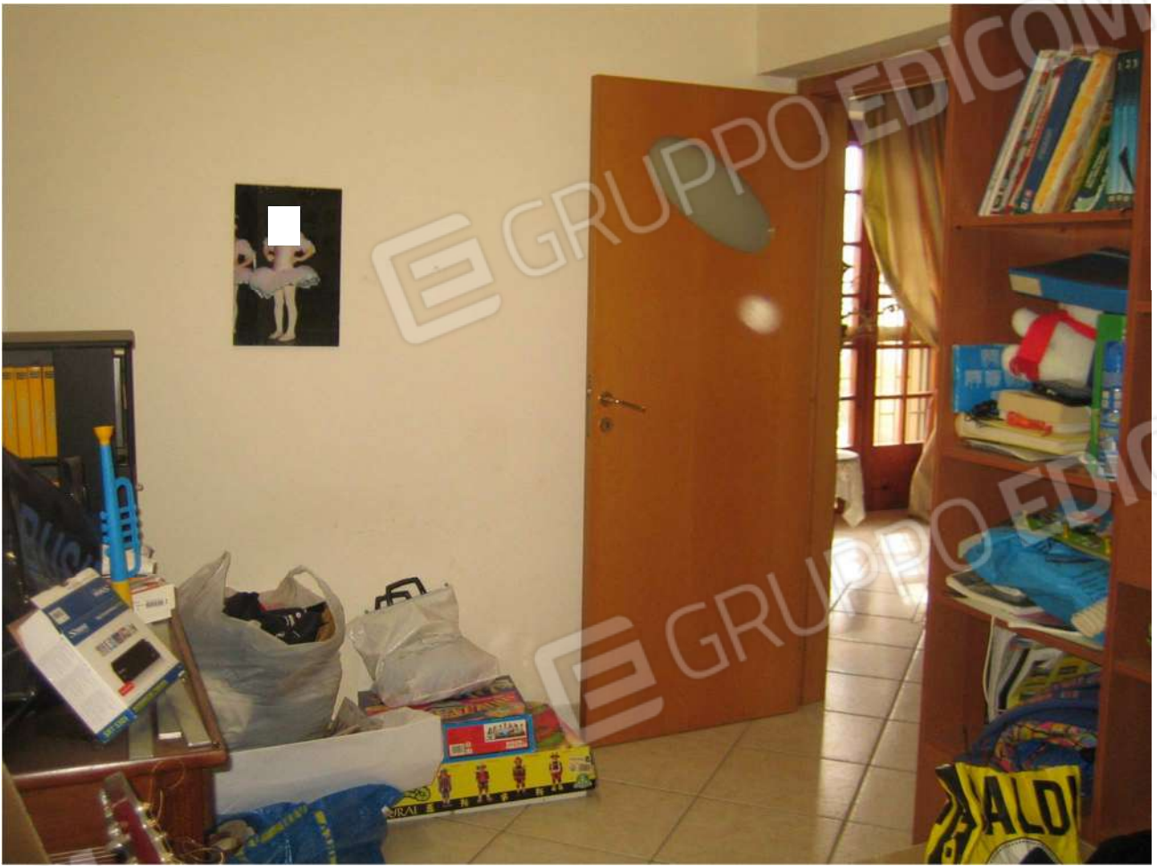
Foto n° 29 – vano letto A18 al piano primo dell'Immobile pignorato