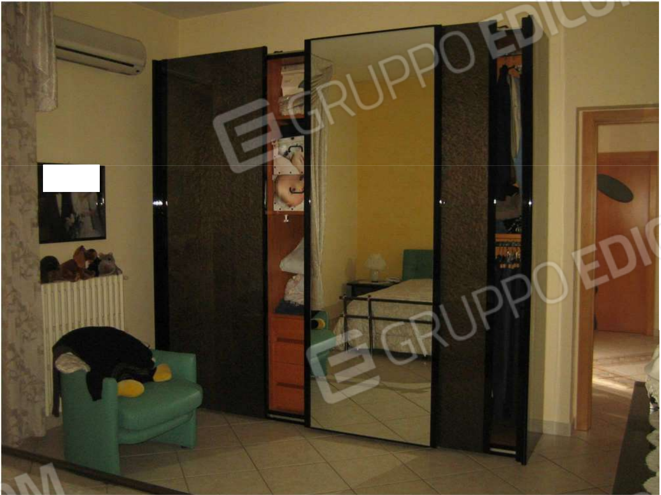
Foto n° 24 – vano letto A14 al piano primo dell'Immobile pignorato