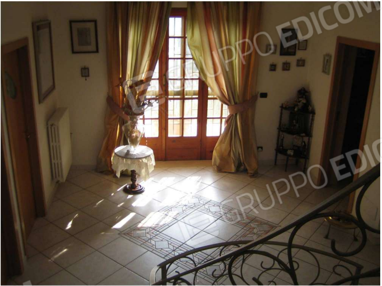
Foto n° 21 – vano ingresso A12 al piano primo dell'Immobile pignorato