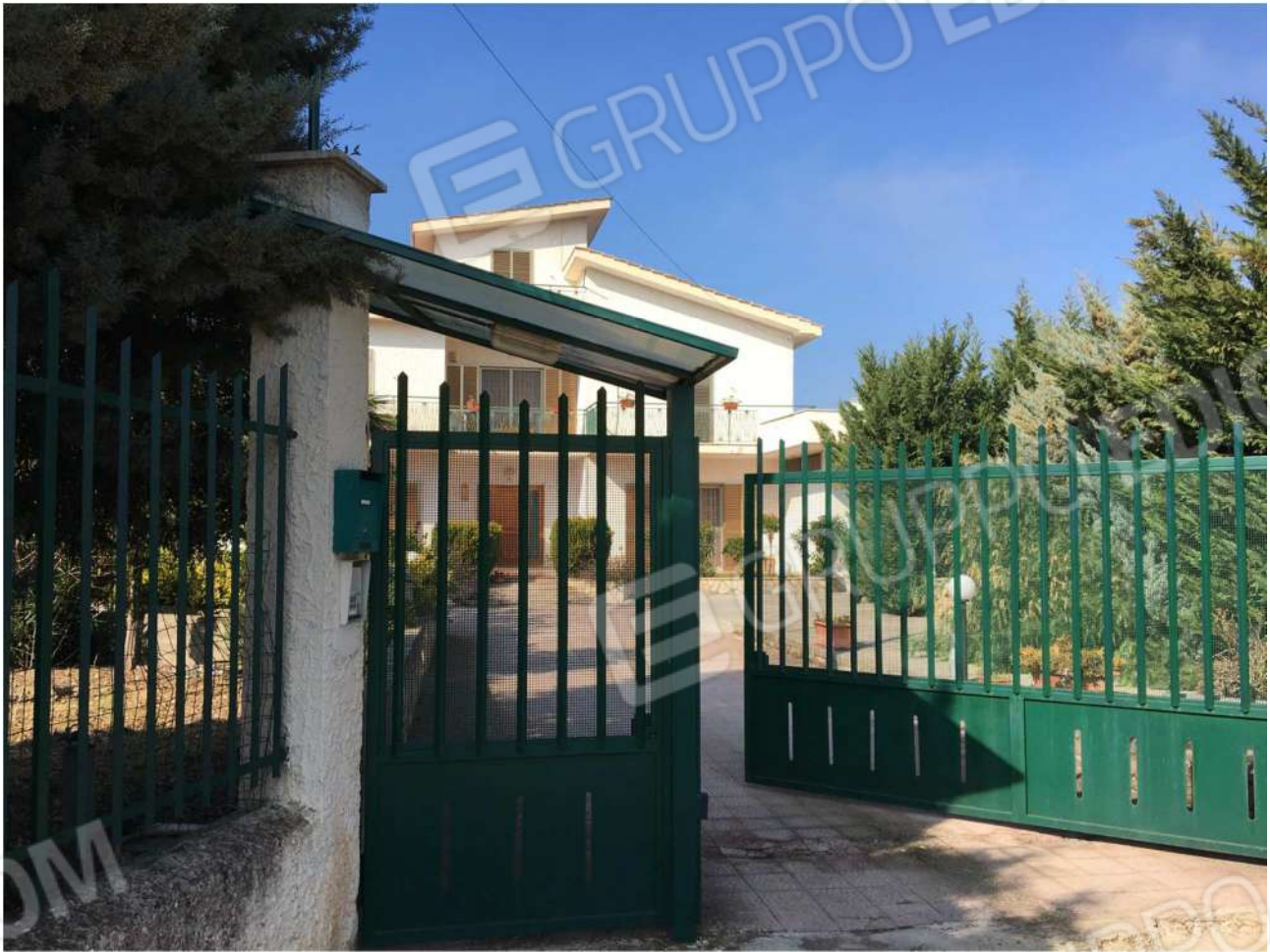
Foto n° 2 - Cannello di ingresso all'immobile pignorato – S.P. 91 Bitonto S.Spirito (BA)