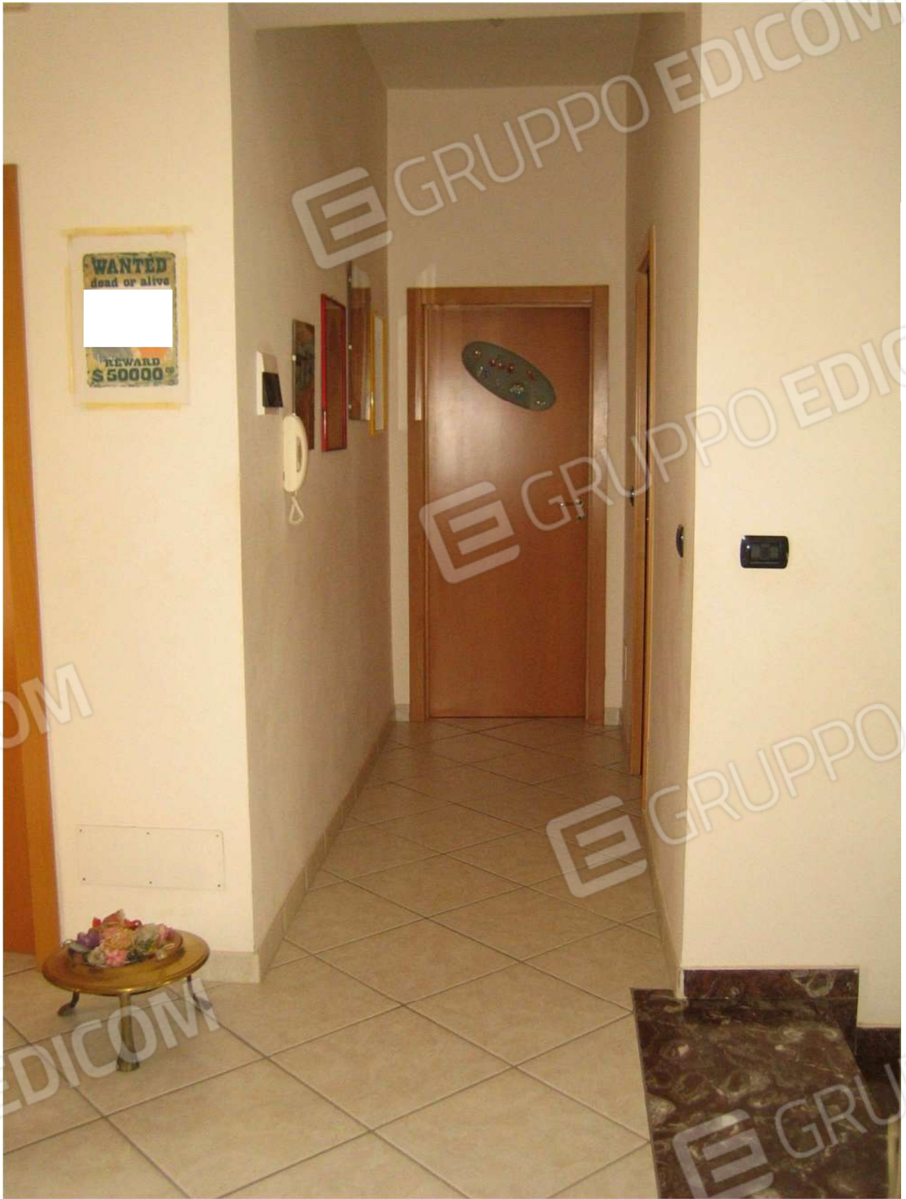
Foto n° 31 – disimpegno A22 al piano primo dell'Immobile pignorato

GRUPPO EDICOM ORDINE DEGLI INGEGNERI INGEGNERE ANNA FRANCESCA DE SANTIS Sez. A - 7356 CIVILE AMBIENTALE INDUSTRIALE INFORMAZIONE PROVINCIA DI BARI Francesca De Santis