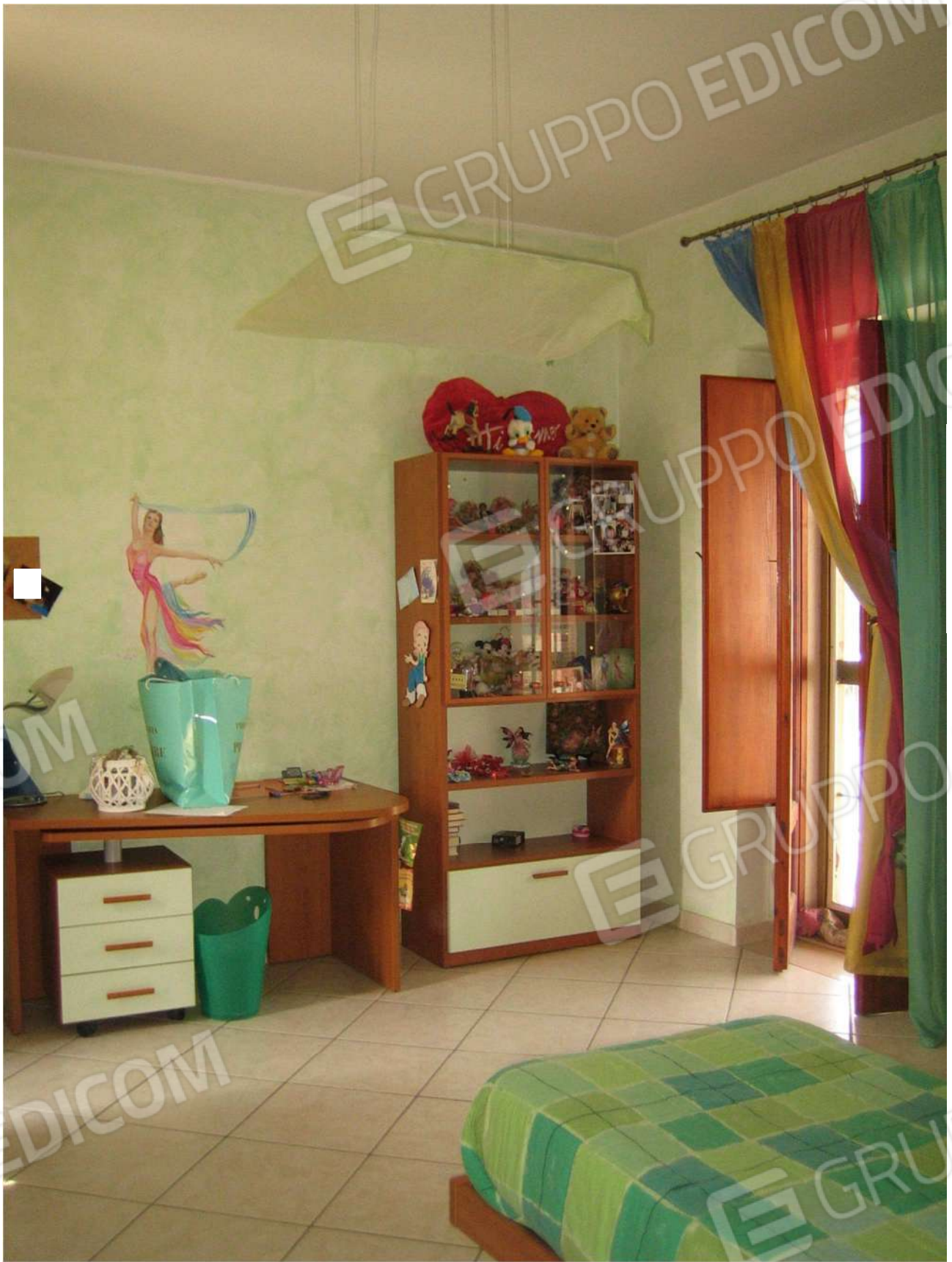
Foto n° 35 – vano letto A24 al piano primo dell’Immobile pignorato