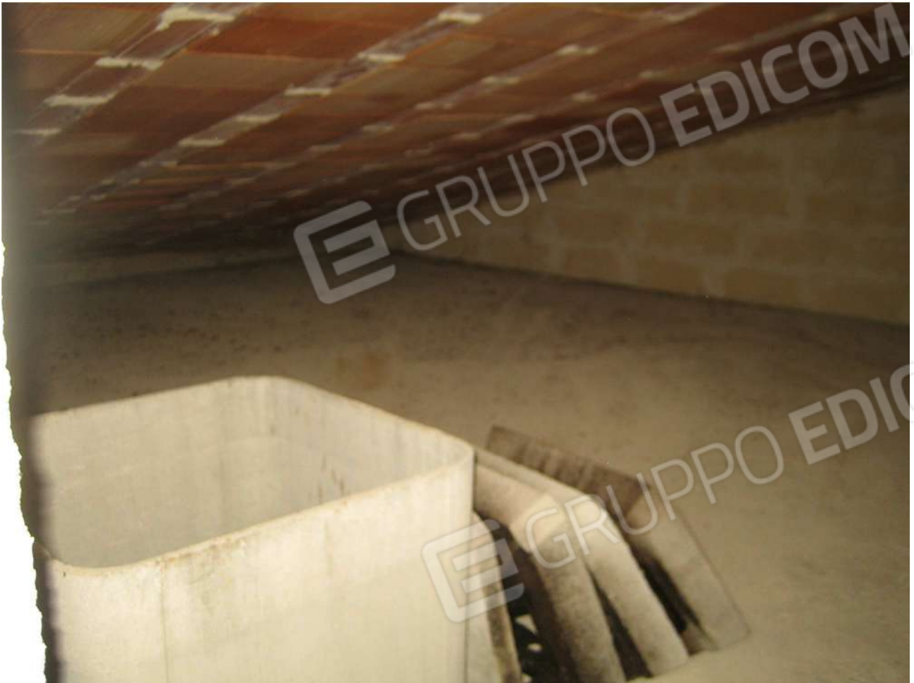
Foto n° 45 – sottotetto dal lastrico solare A29 dell'Immobile pignorato