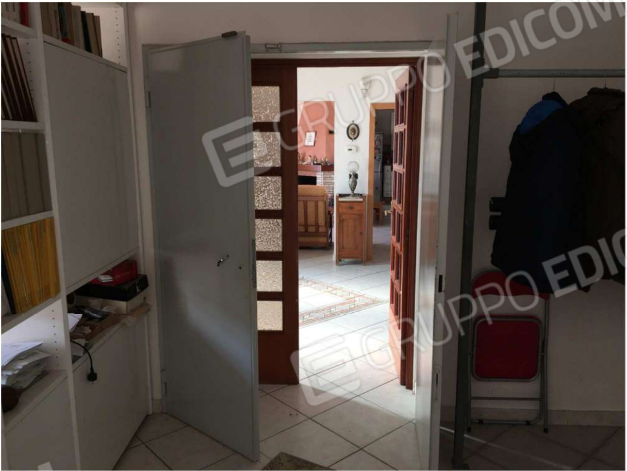
Foto n° 20 – porta di separazione tra ingresso A2 e vano A7 (vista da A7) al piano rialzato dell'Immobile pignorato