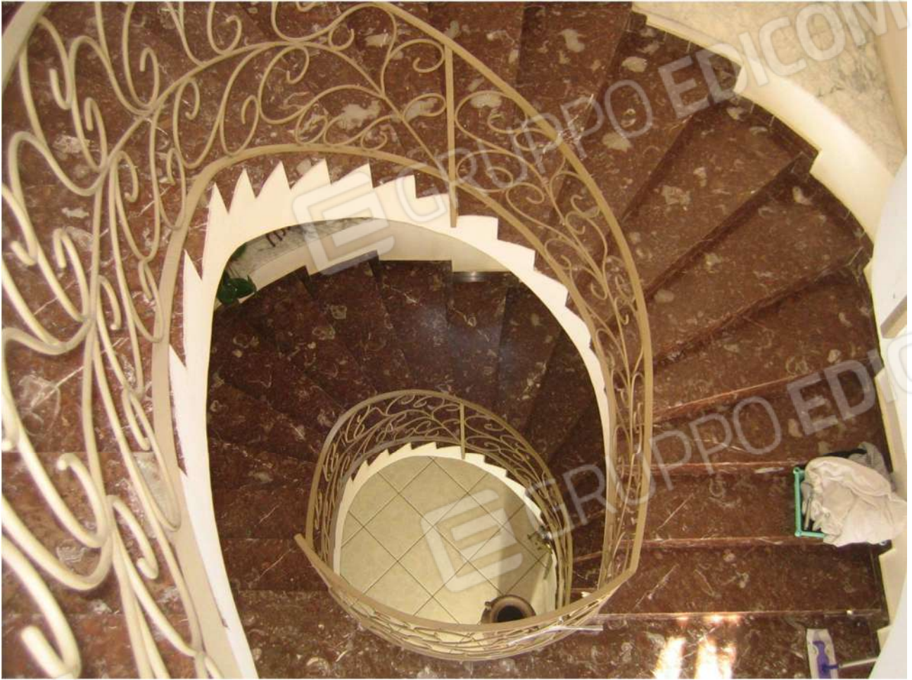
Foto n° 50 – vano scala dell’Immobile pignorato (vista dal piano secondo)