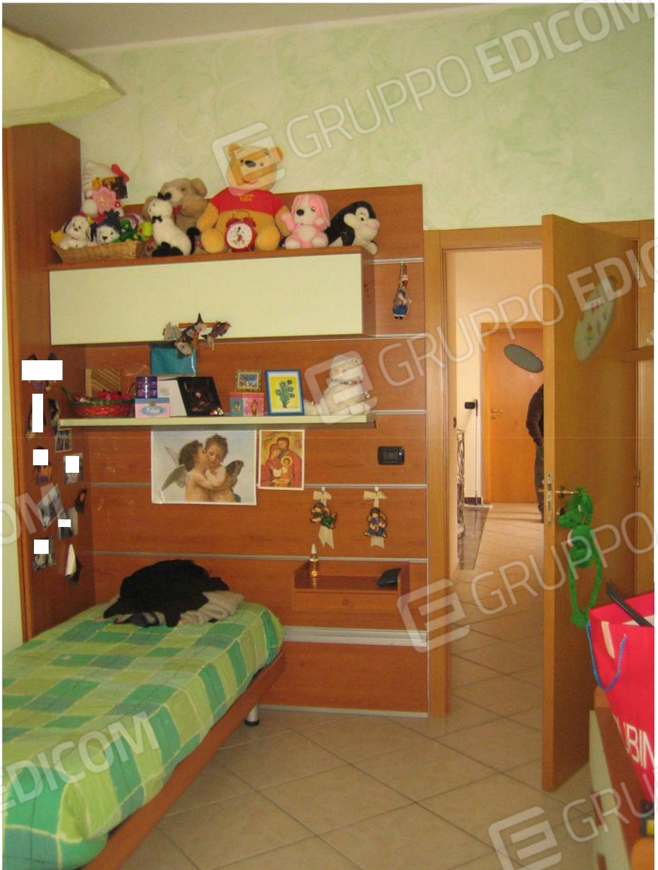
Foto n° 36 – vano letto A24 al piano primo dell’Immobile pignorato