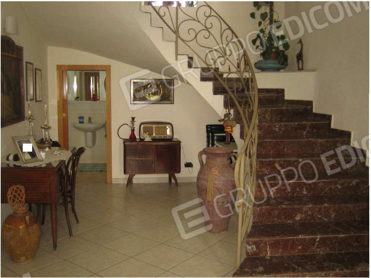
Foto n° 7 - vano ingresso A2 e vano scala dell'immobile pignorato