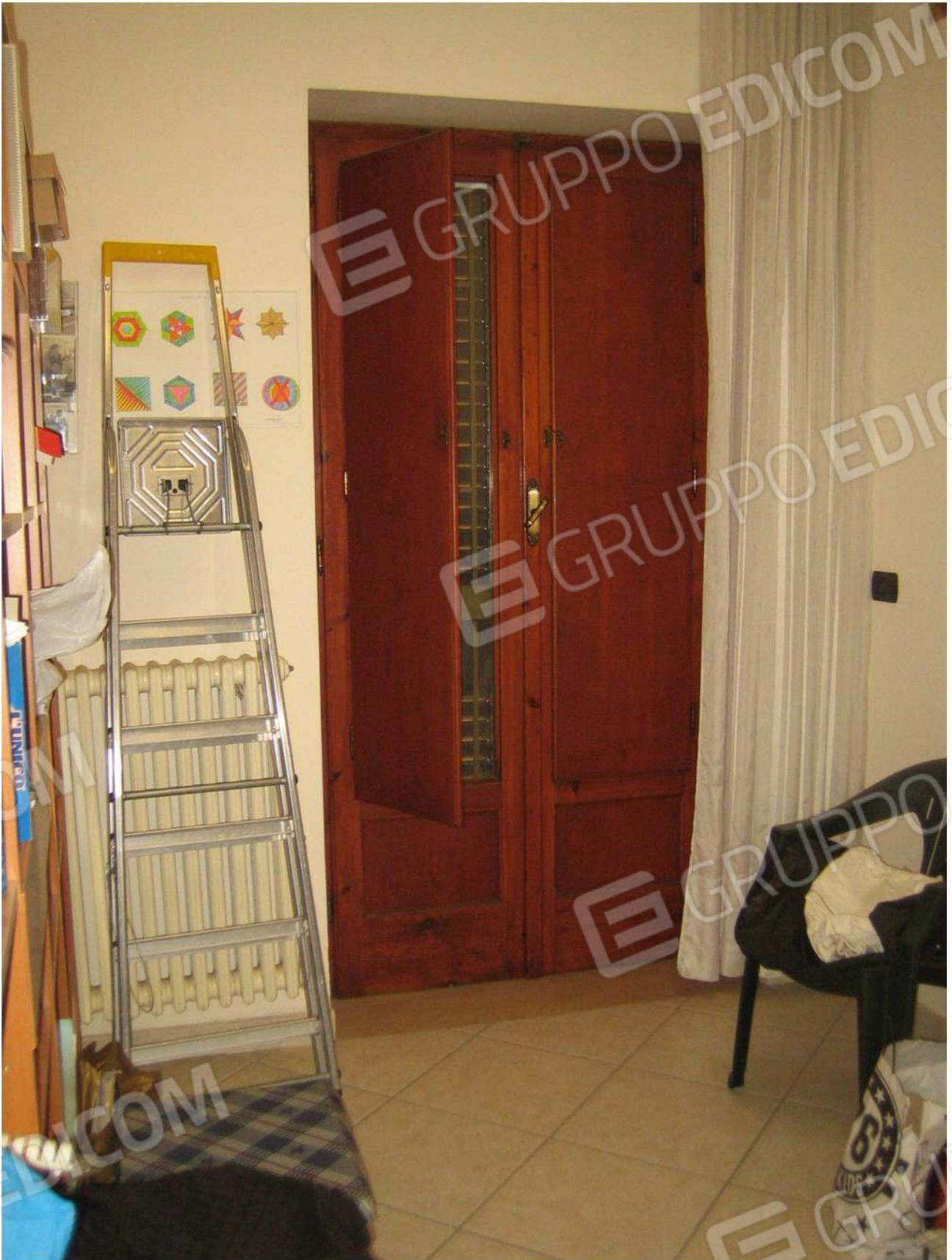
Foto n° 28 – vano letto A18 al piano primo dell'Immobile pignorato