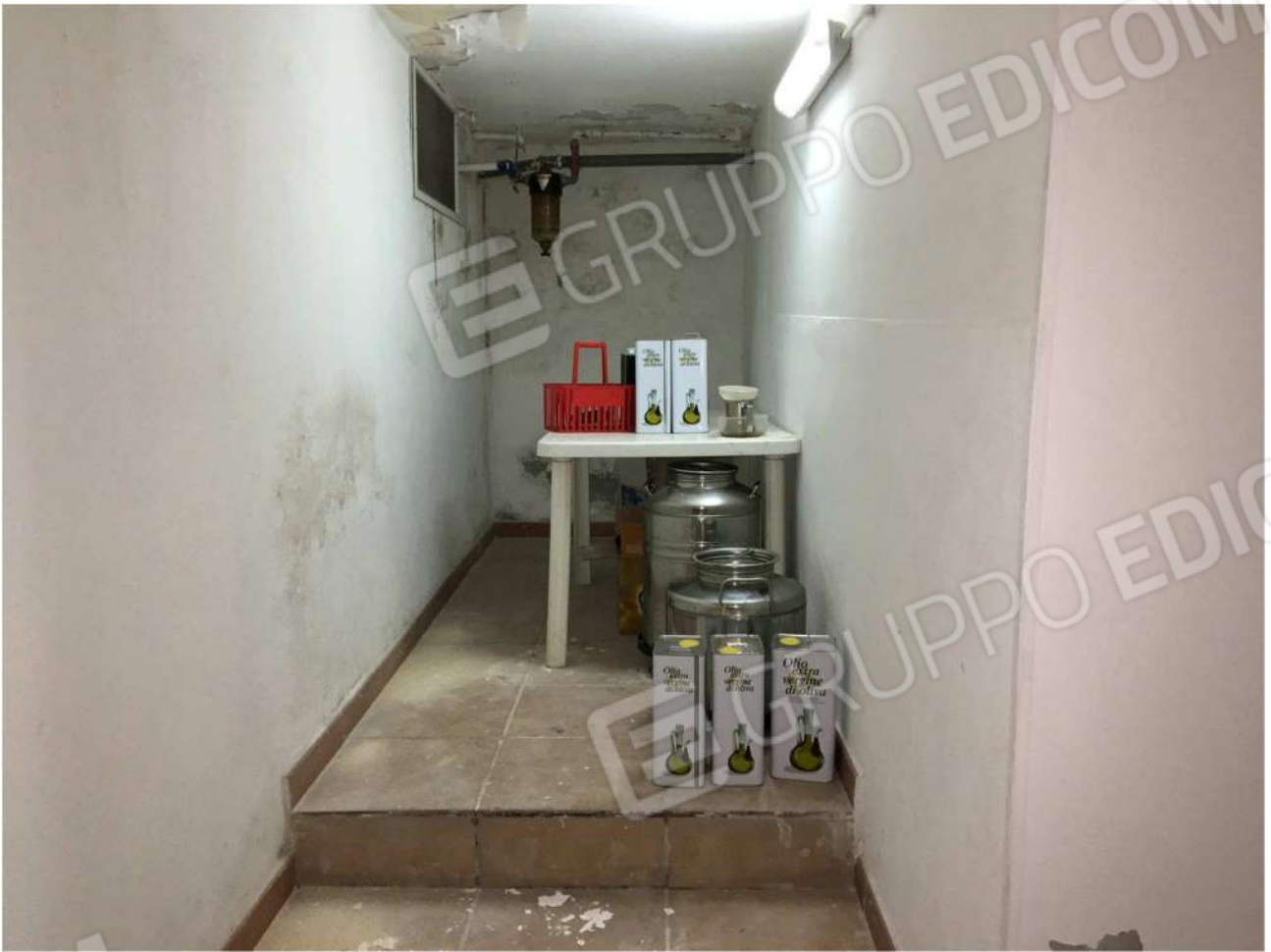
Foto n° 15 - vano deposito A9 al piano seminterrato dell'Immobile pignorato