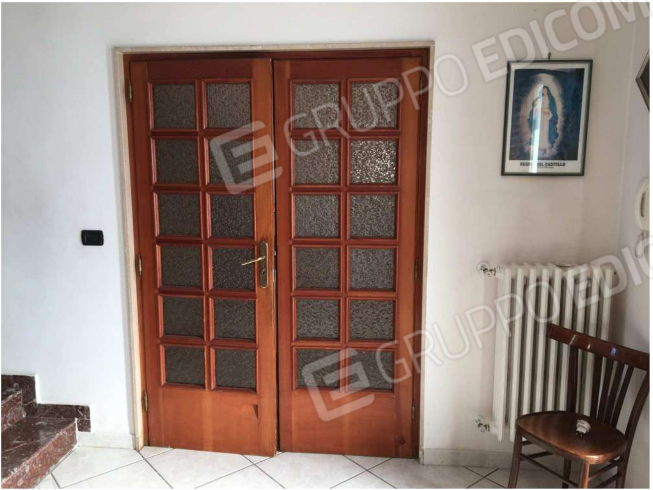
Foto n° 19 – porta di separazione tra ingresso A2 e vano A7 (vista da A2) al piano rialzato dell'Immobile pignorato