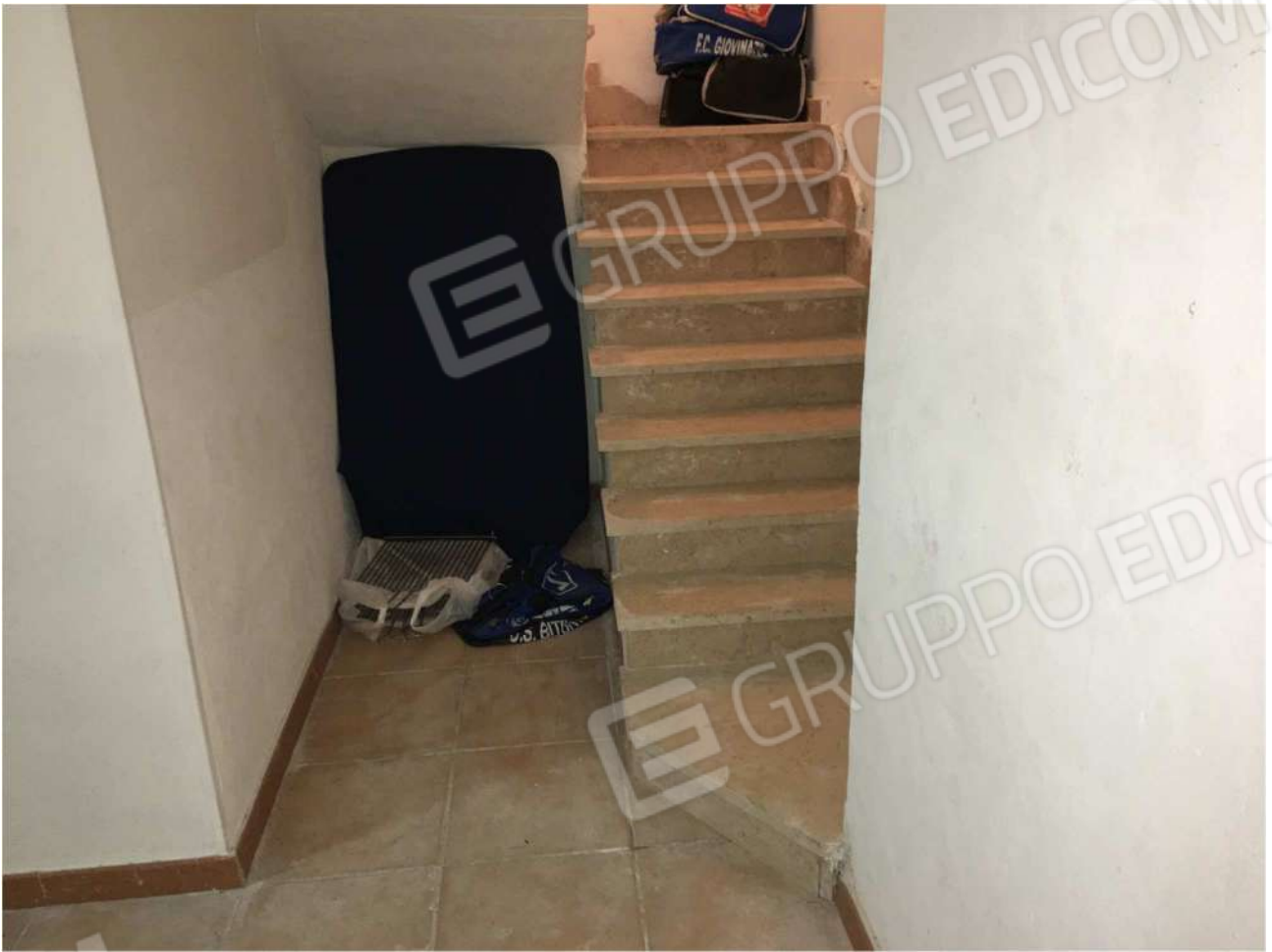
Foto n° 14 - scala A10 dal piano rialzato al piano seminterrato dell'Immobile pignorato