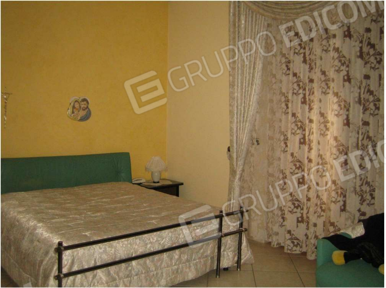
Foto n° 23 – vano letto A14 al piano primo dell'Immobile pignorato