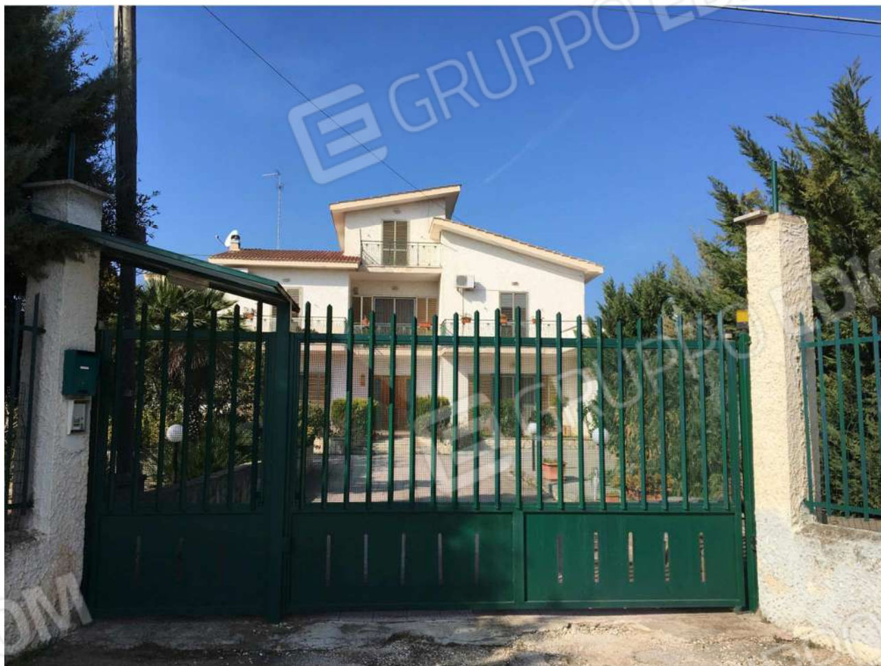
Foto n° 1 - Cancellone di ingresso all'immobile pignorato – S.P. 91 Bitonto S.Spirito (BA)