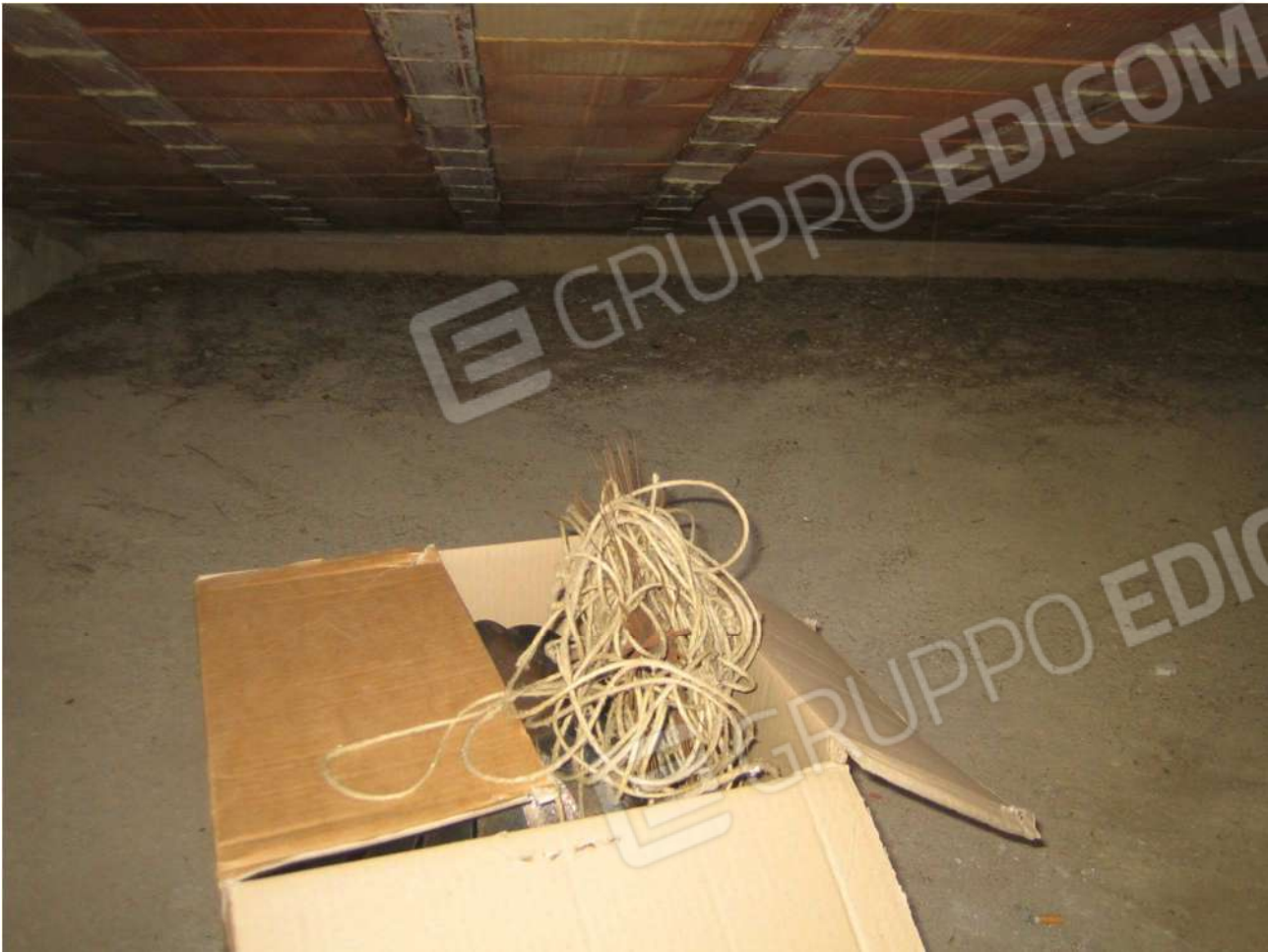
Foto n° 48 – sottotetto dal lastrico solare A30 dell'Immobile pignorato