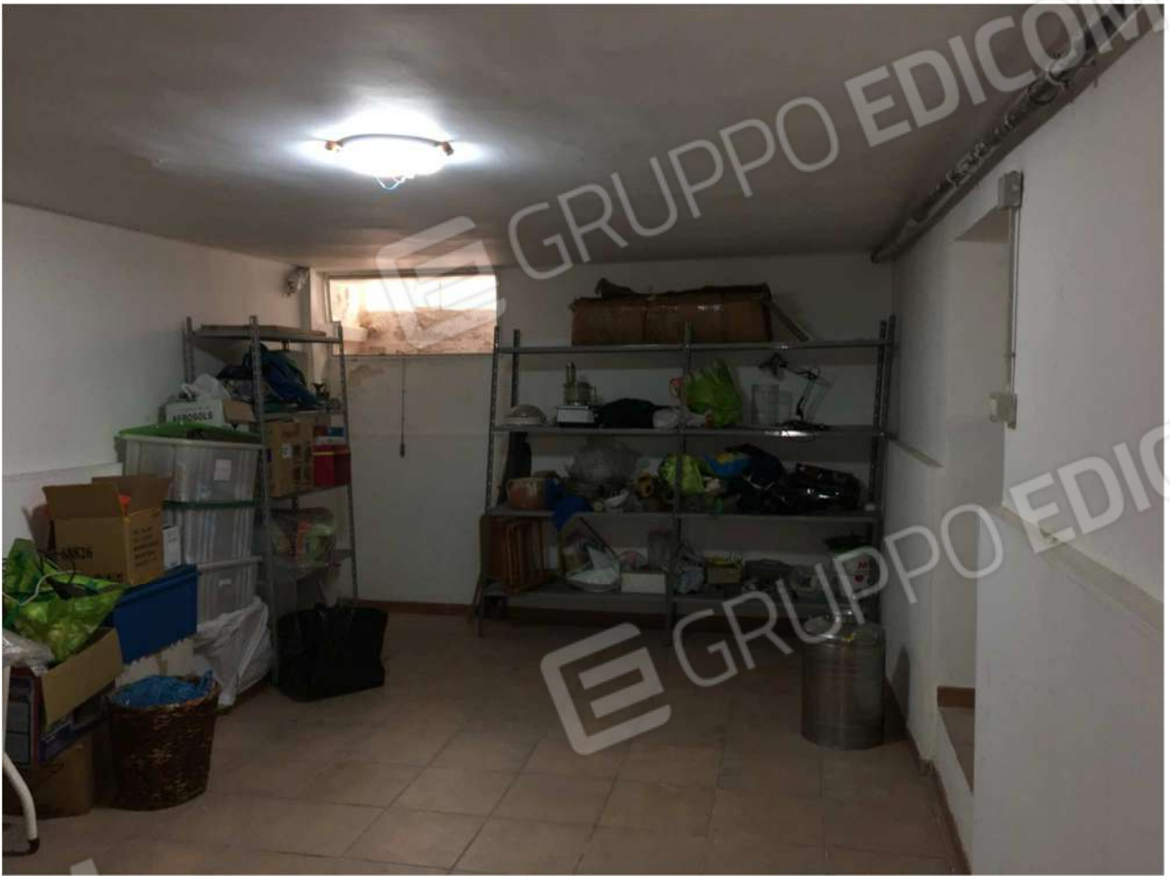
Foto n° 17 - vano deposito A9 al piano seminterrato dell'Immobile pignorato