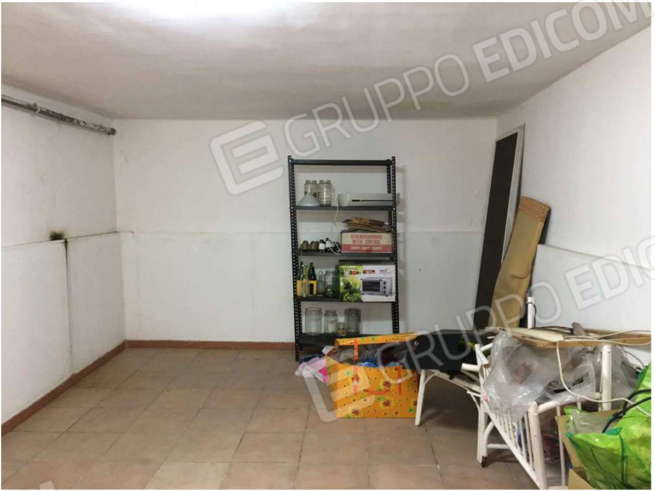
Foto n° 16 - vano deposito A9 al piano seminterrato dell'Immobile pignorato