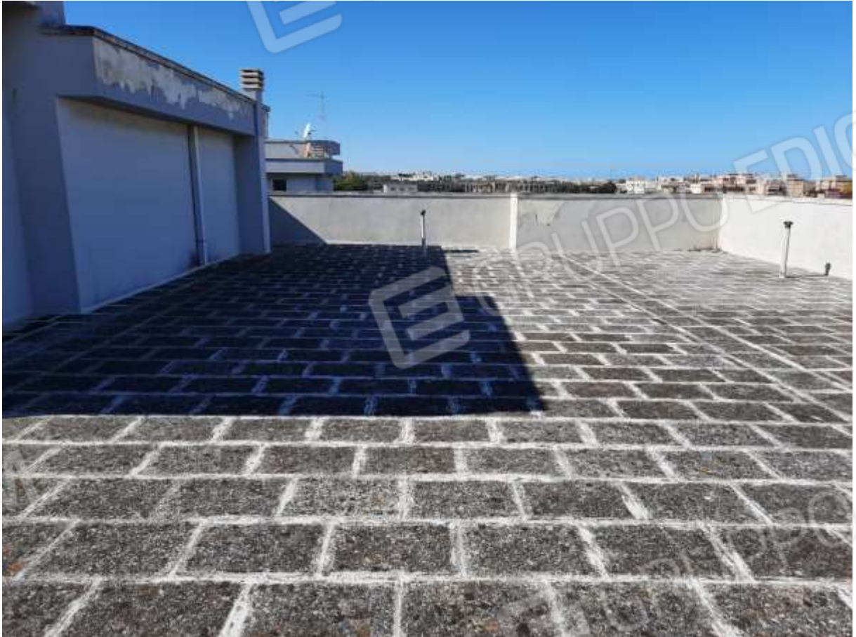
FOTO n° 5. Come foto nn° 2-3-4. Vista verso la direzione nord della porzione nord-est del lastrico solare.