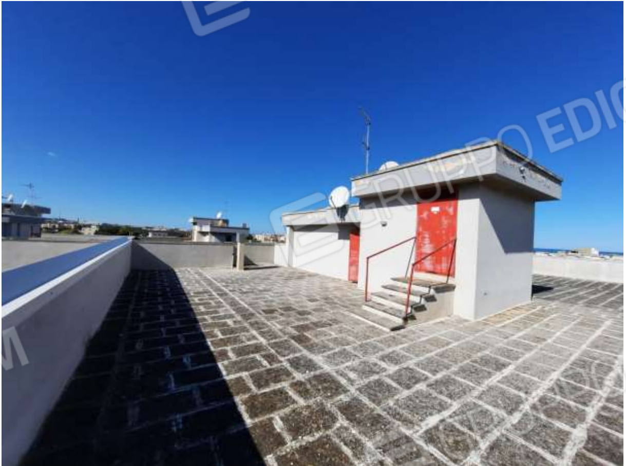
FOTO n° 2. Lastrico solare dell'edificio con accesso dal civico 8 di via G. Antonelli. Vista del torrino scala e del torrino ascensore, verso la direzione nord.