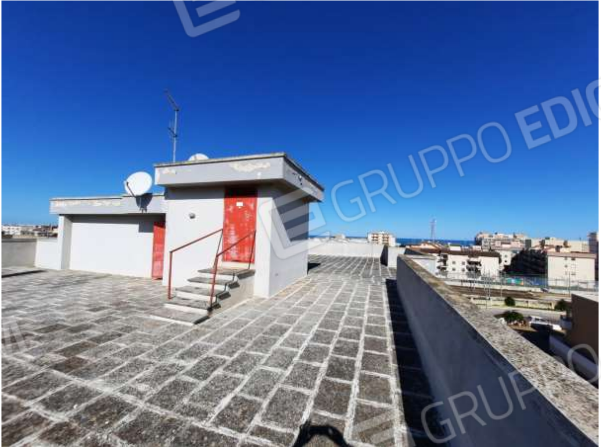
FOTO n° 4. Come foto n° 2 - 3. Vista della parte retrostante il torrino, verso la direzione est.