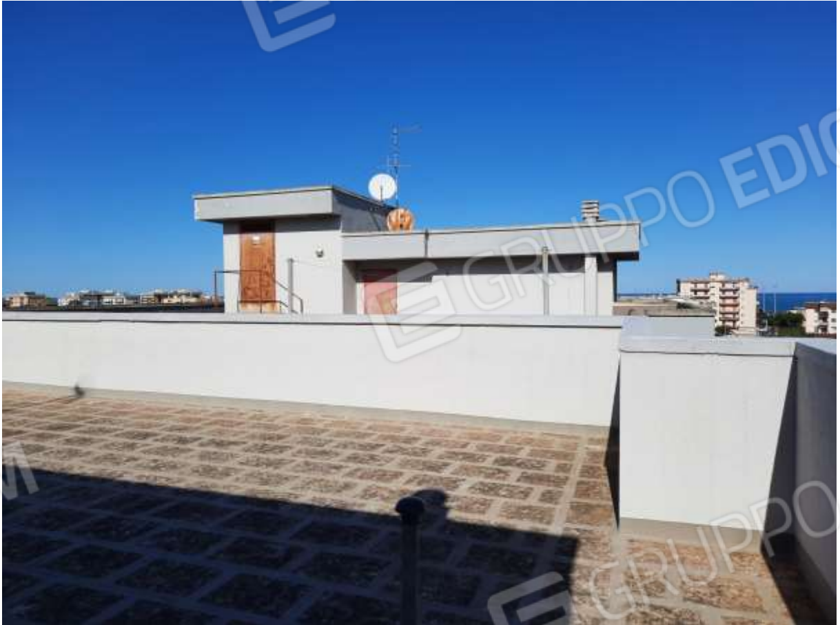
FOTO n° 5. Come foto nn° 2-3-4. Vista verso la direzione est della parte di lastrico solare confinante con il lastrico solare del contiguo edificio con accesso dal civico 5 di via Raimondi.