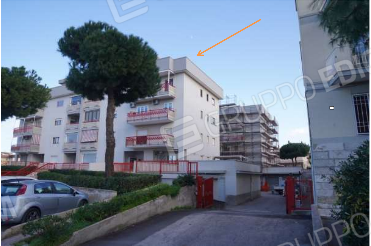
FOTO n° 1. Monopoli. Edificio con accesso dal civico 3 di via F. Raimondi. L'unità immobiliare staggita costituisce il lastrico solare di copertura dell'edificio condominiale pluripiano visibile in primo piano.