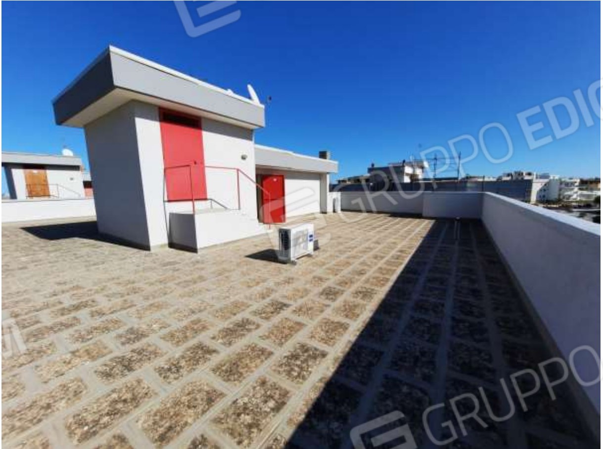
FOTO n° 3. Come foto n° 2. Vista della porzione di lastrico solare antistante i torrini, verso la direzione sud.