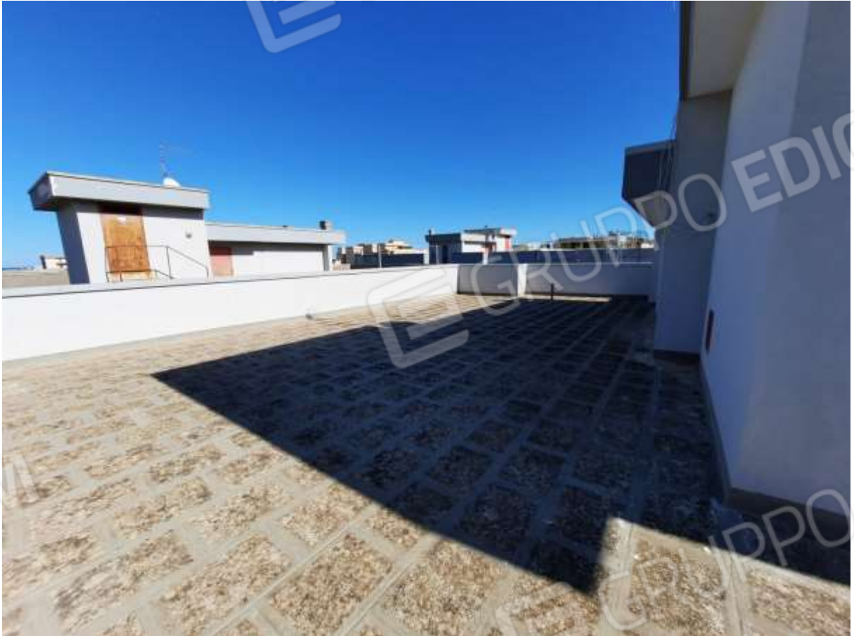
FOTO n° 4. Come foto n° 2 - 3. Vista della parte retrostante i torrini, verso la direzione sud-est.