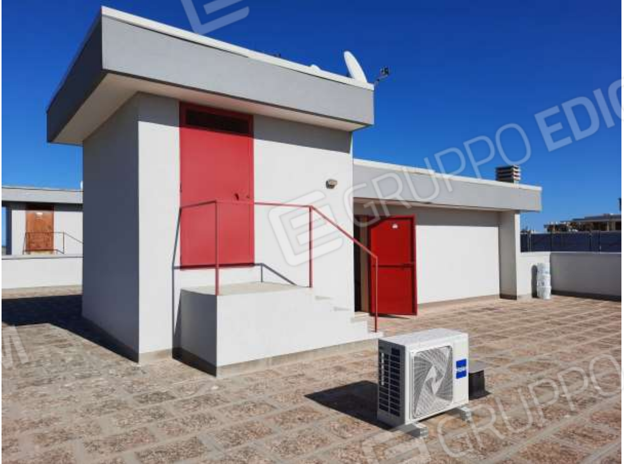
FOTO n° 2. Lastrico solare dell'edificio con accesso dal civico 3 di via Raimondi. Vista del torrino ascensore e del torrino scala, verso la direzione sud-est.