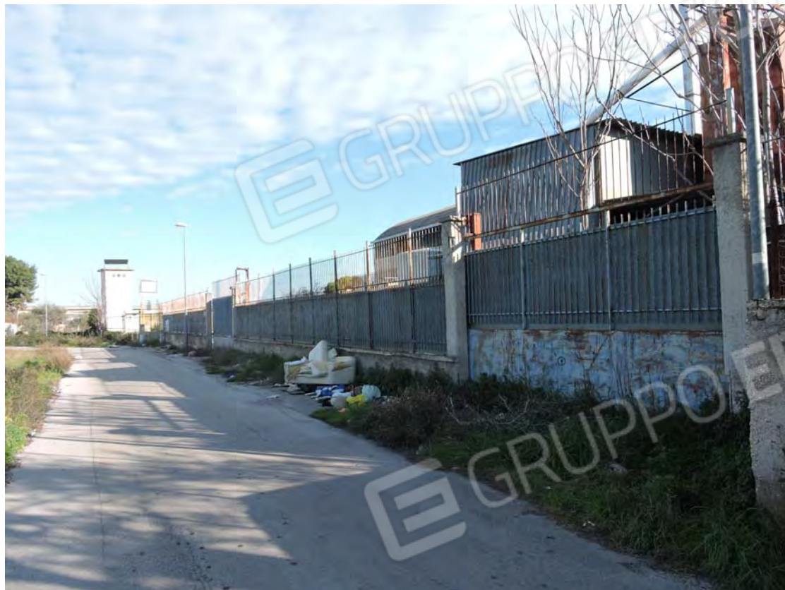
Strada Fondo Capillo del Campo