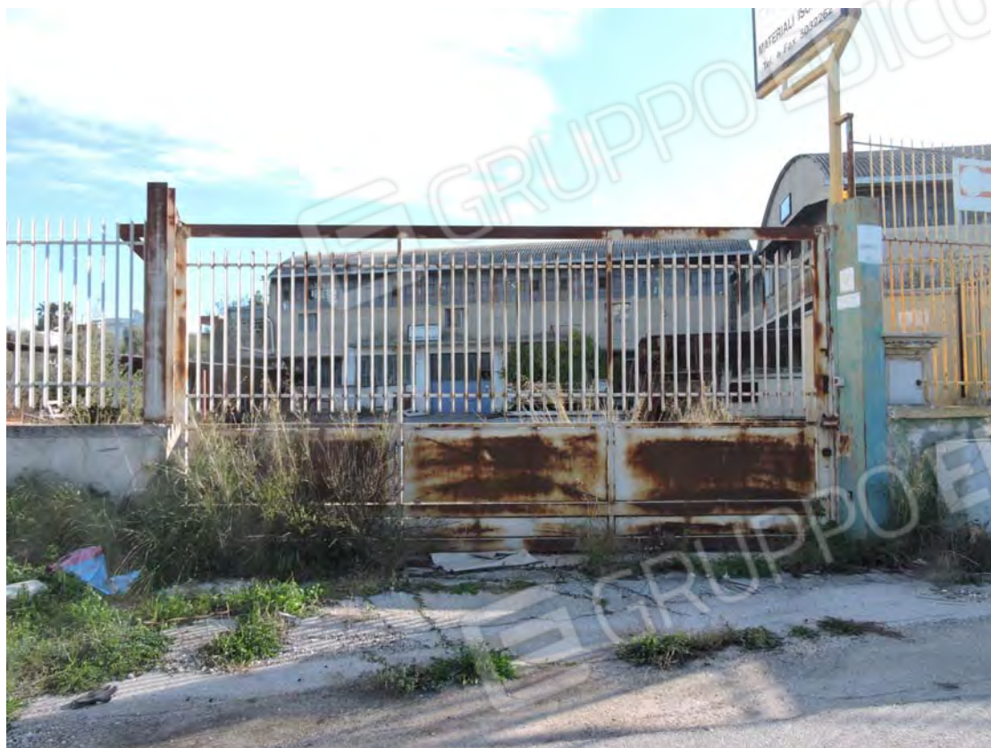
Accesso – strada Fondo Capillo del Campo