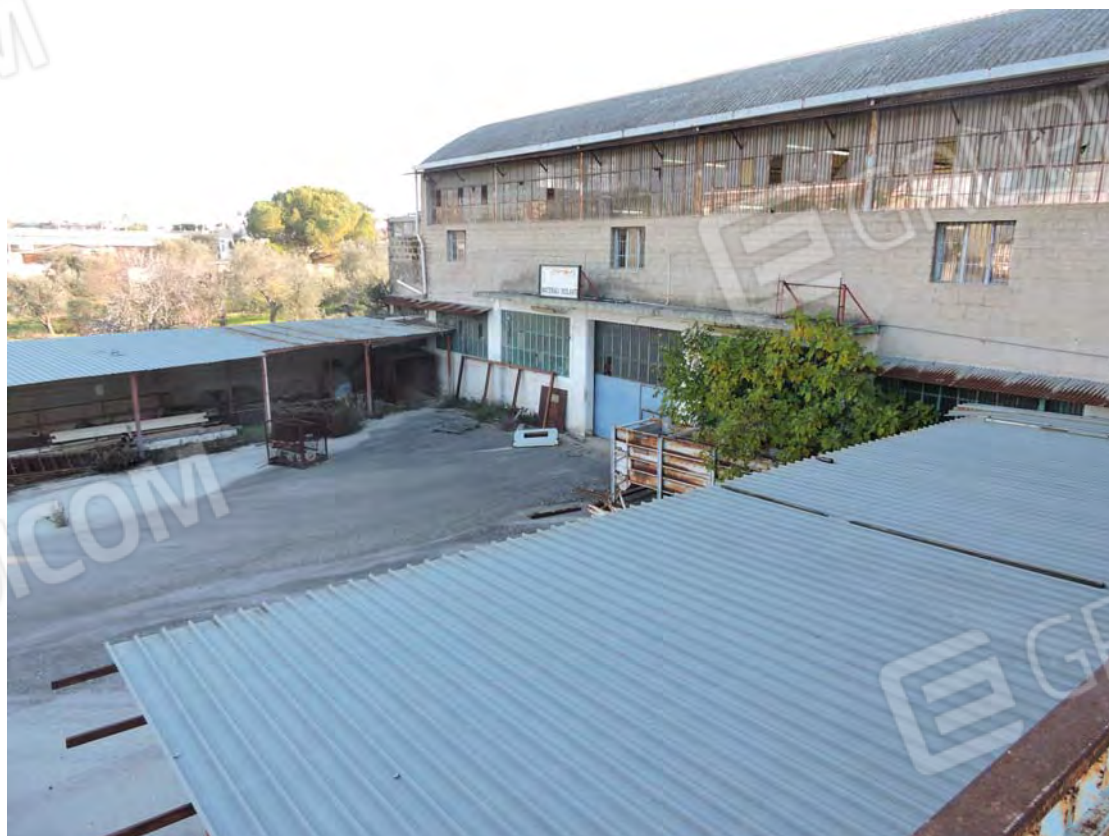
Pertinenza esterna con tettoie abusive