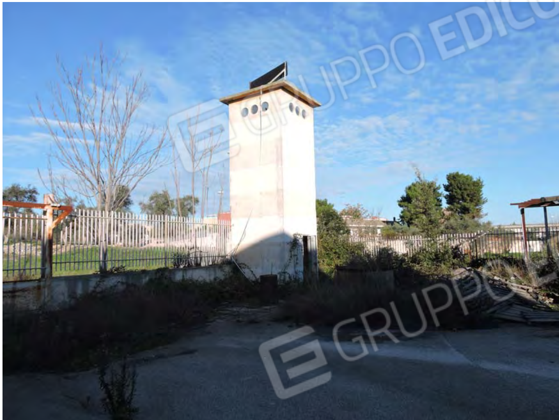
Ex cabina elettrica – p.IIa 82