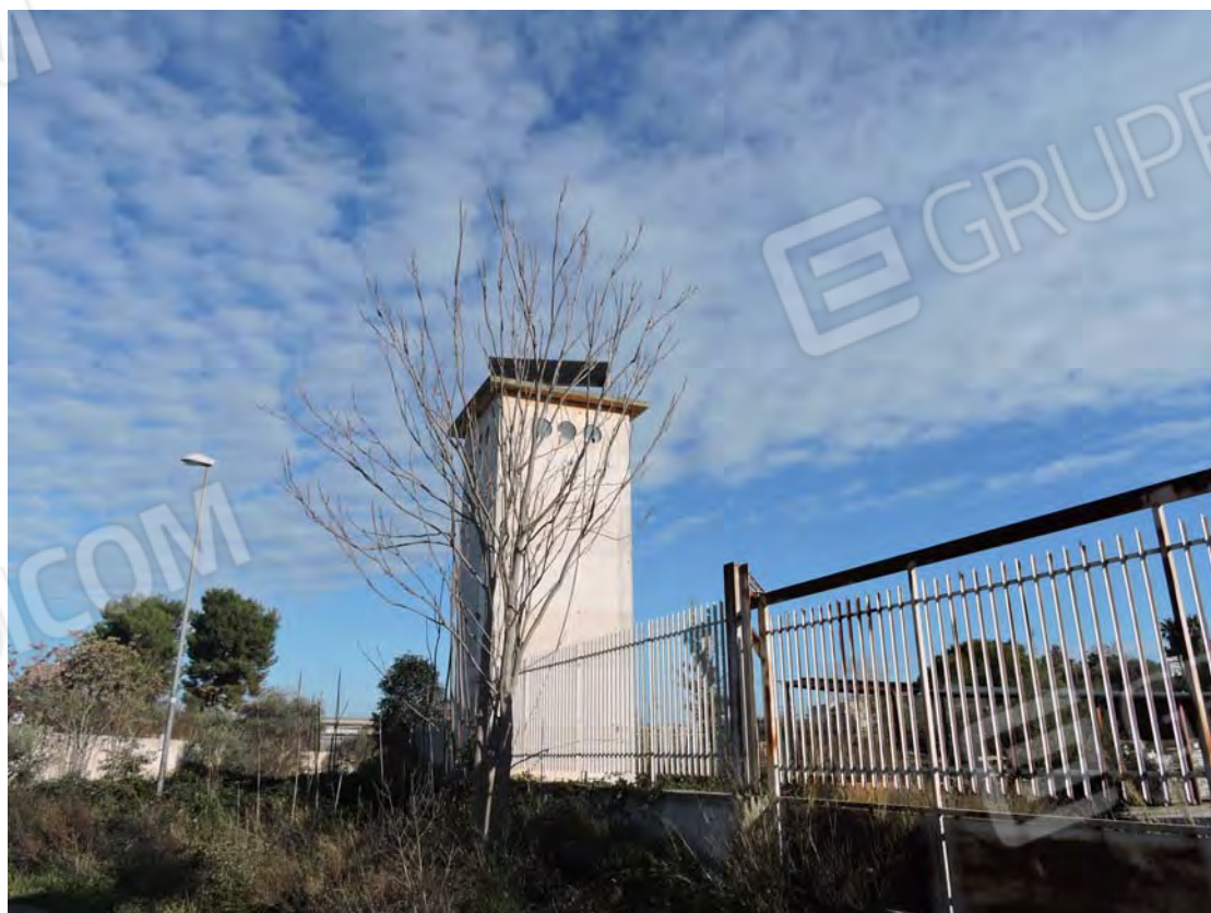
Ex cabina elettrica – p.IIa 82