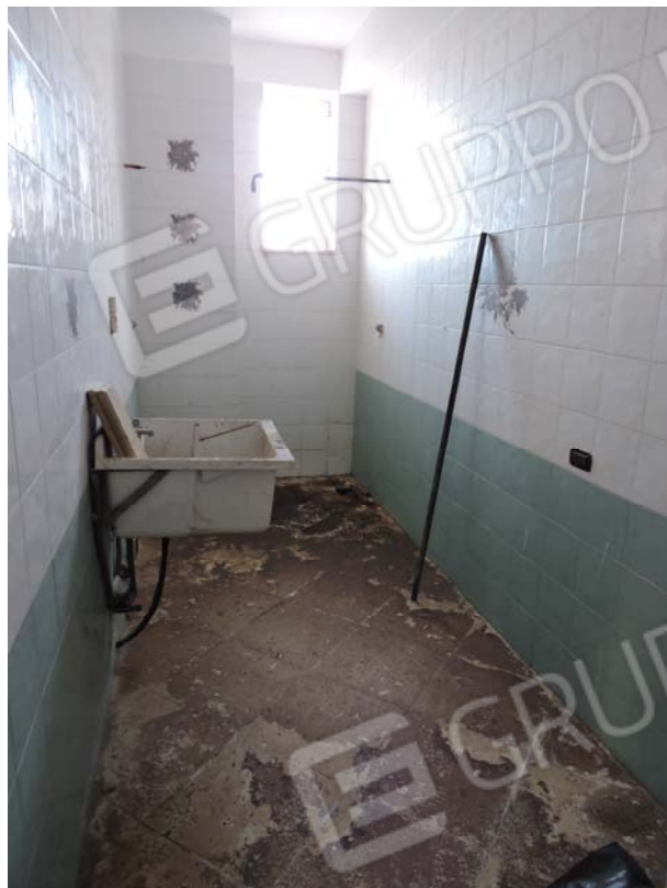
WC piano S1