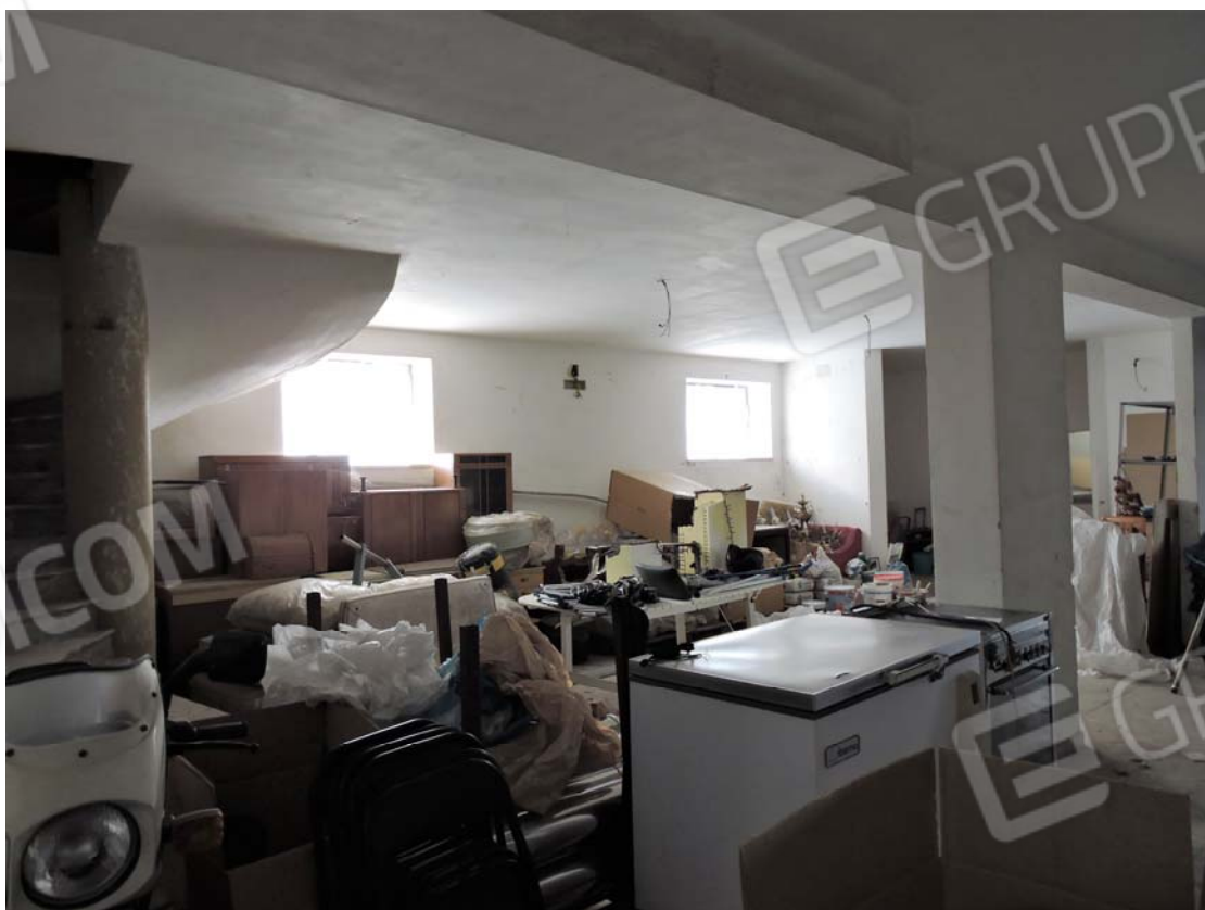
Interno piano S1