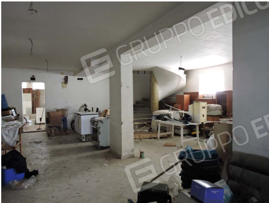
Interno piano S1