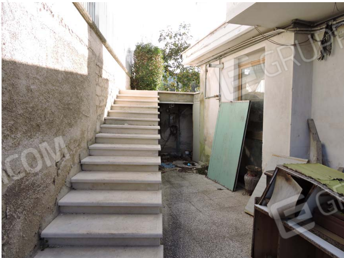
Scala di collegamento tra piano S1 e livello zero