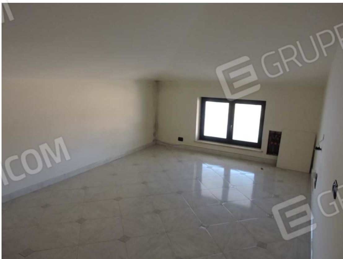
Altra stanza soffitta