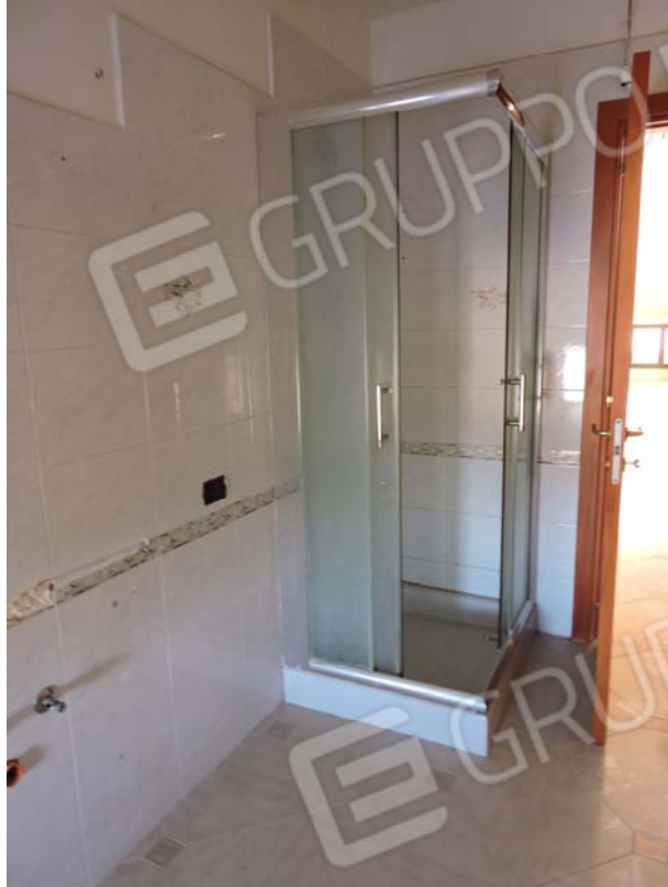
Altro bagno soffitta