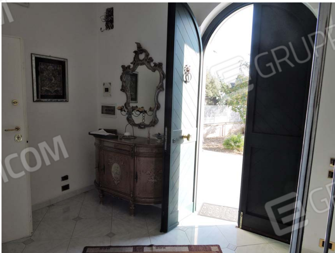
Ingresso piano rialzato