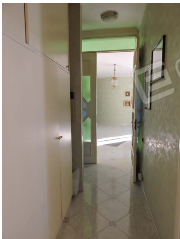
Disimpegno notte piano rialzato