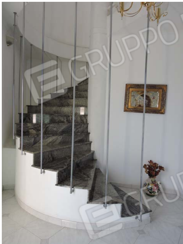
Scala alla soffitta