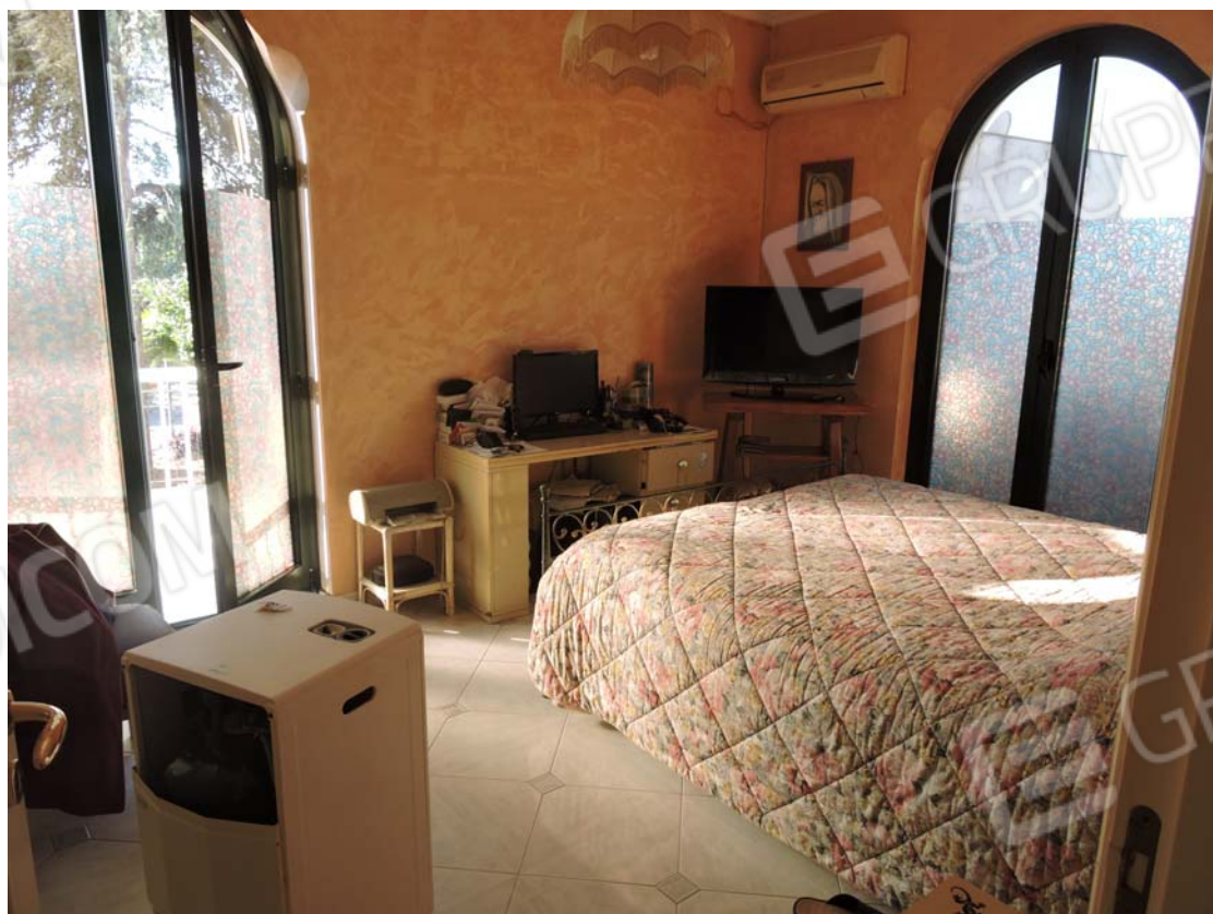
Altra camera piano rialzato