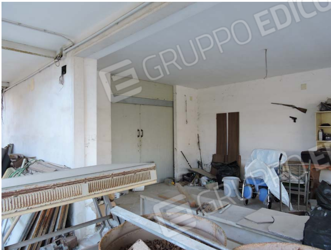
Patio coperto (volumetria acquisita)