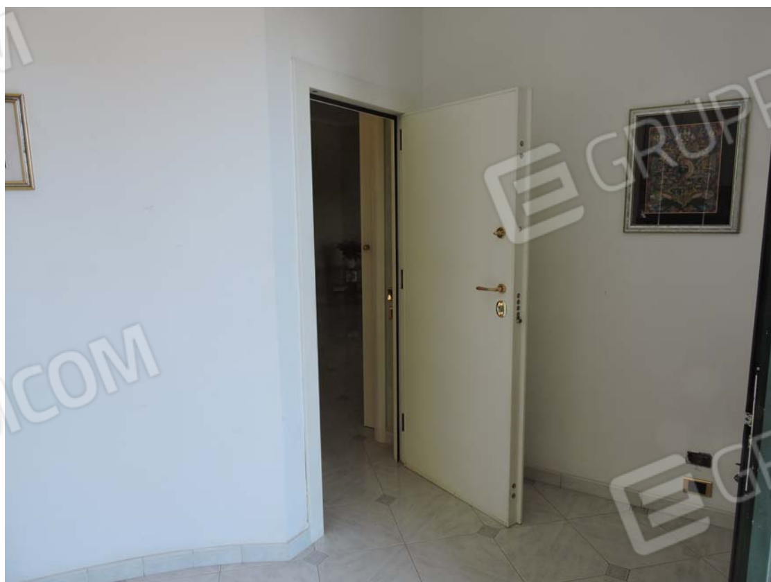
Porta di ingresso al piano rialzato