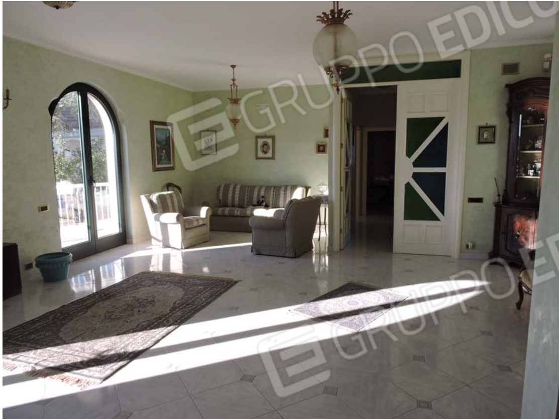
Zona giorno piano rialzato