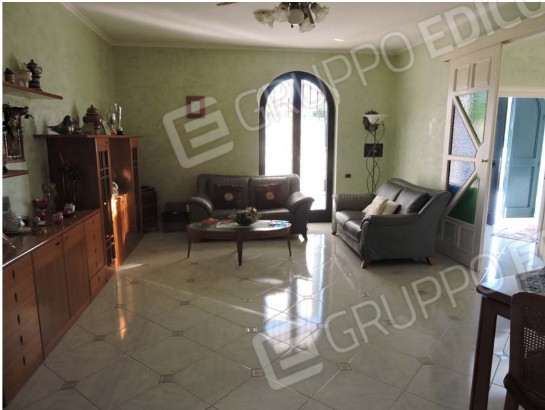
Zona giorno piano rialzato