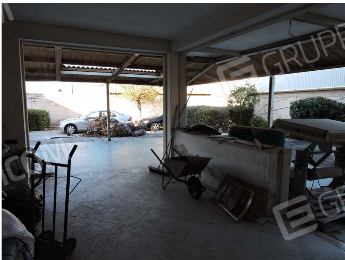
Patio coperto (volumetria acquisita)