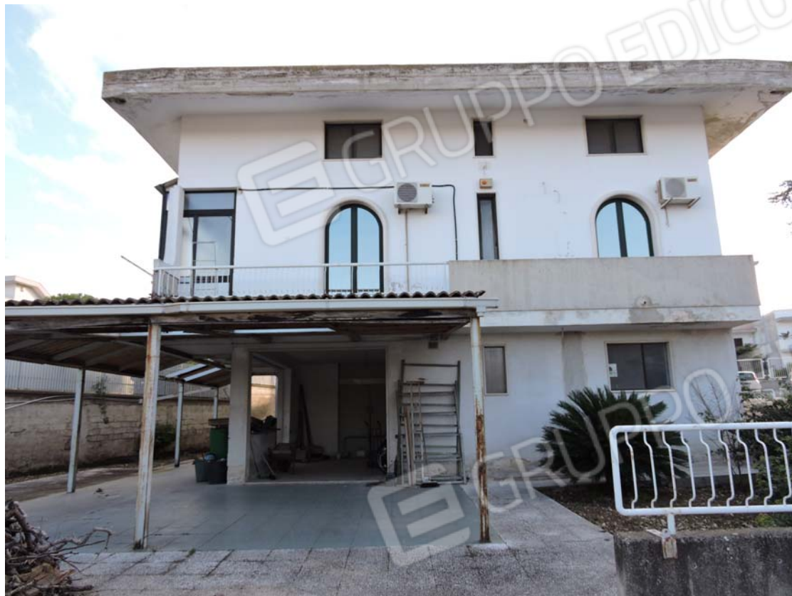
Prospetto posteriore con tettoie abusive