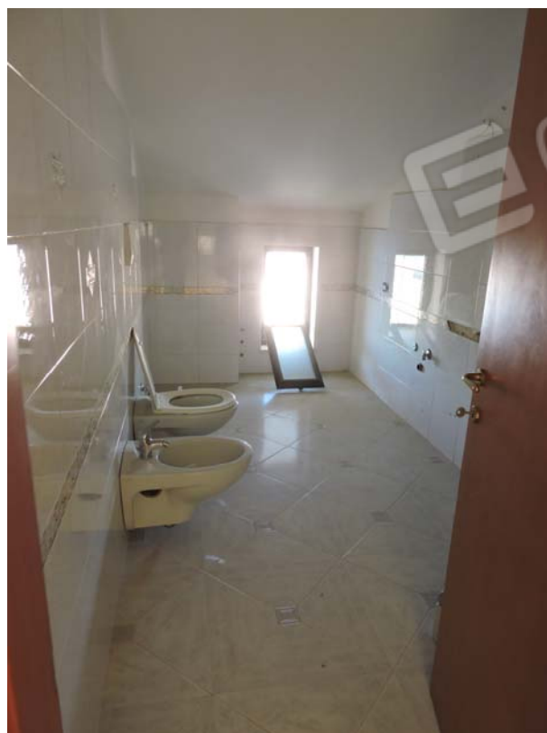
Altro bagno soffitta