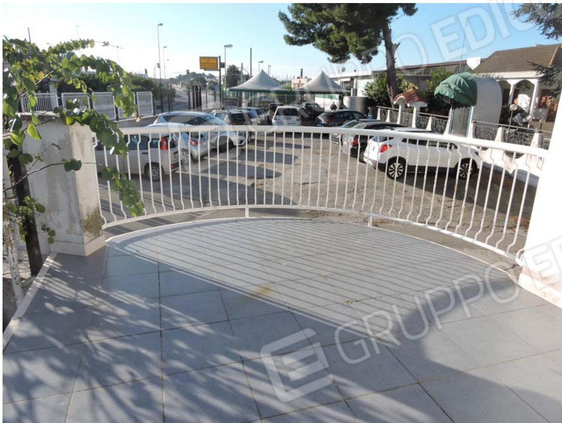
Parte di terrazza non riportata nelle planimetrie