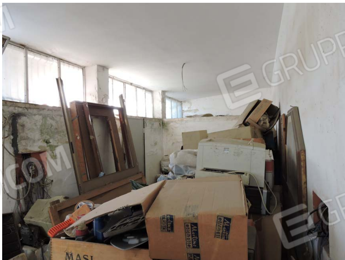
Vano sottostante terrazza non riportato nelle planimetrie