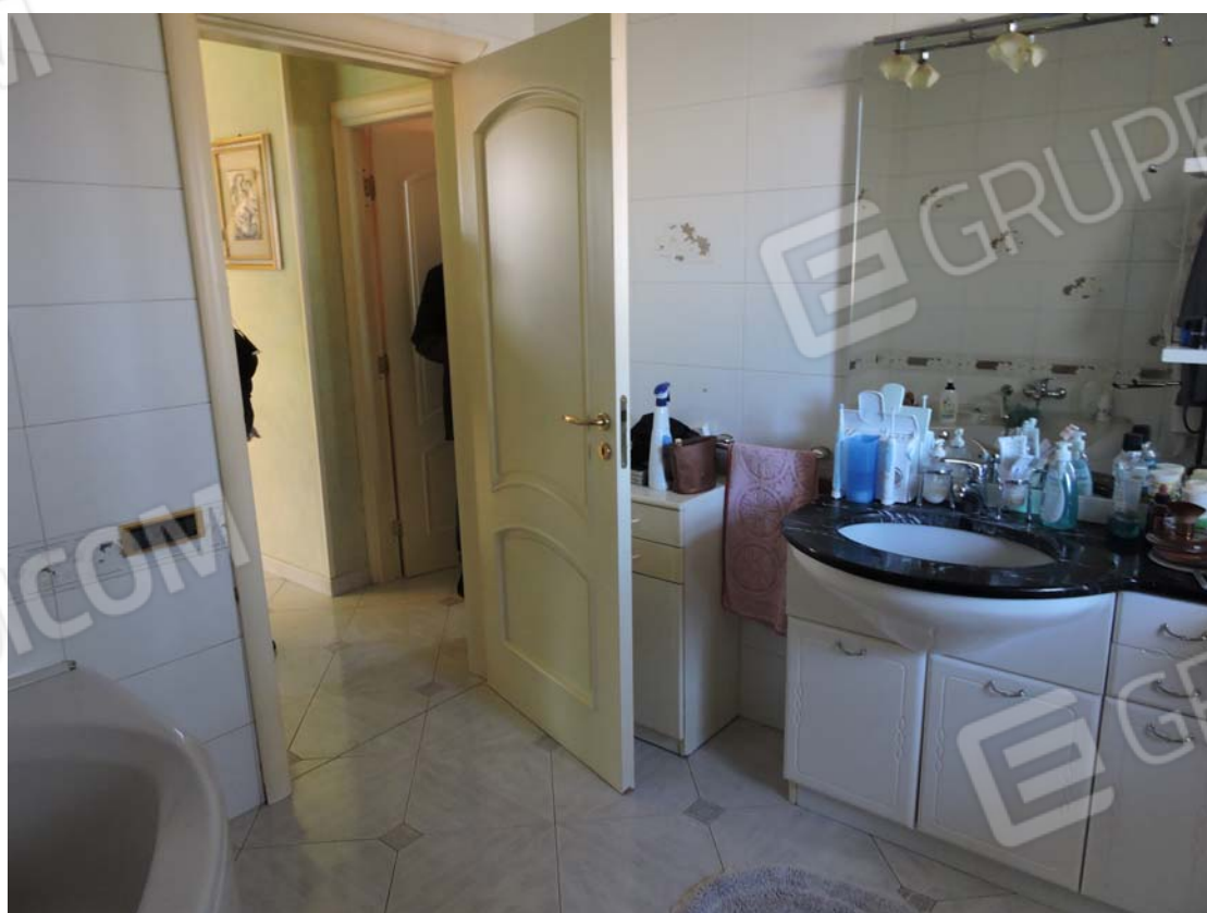
Bagno principale piano rialzato