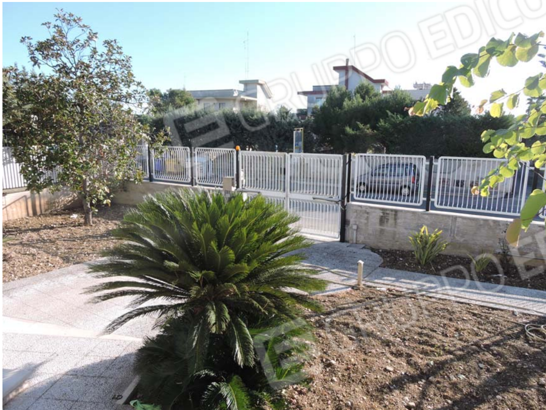
Parte anteriore (particella 745)