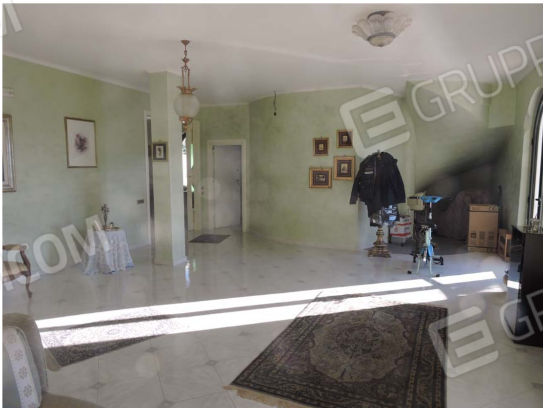
Zona giorno piano rialzato