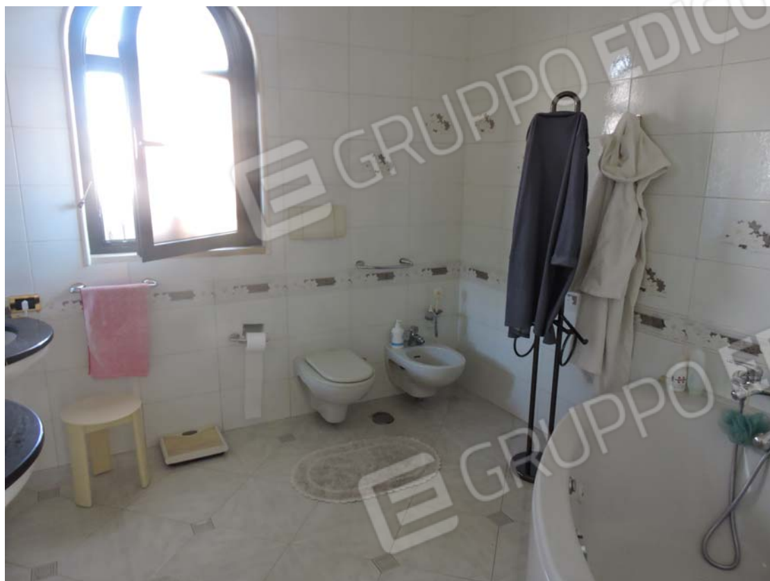
Bagno principale piano rialzato