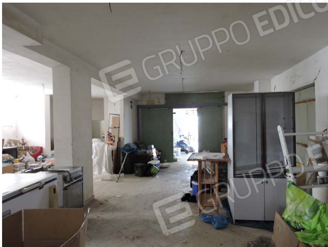
Interno piano S1