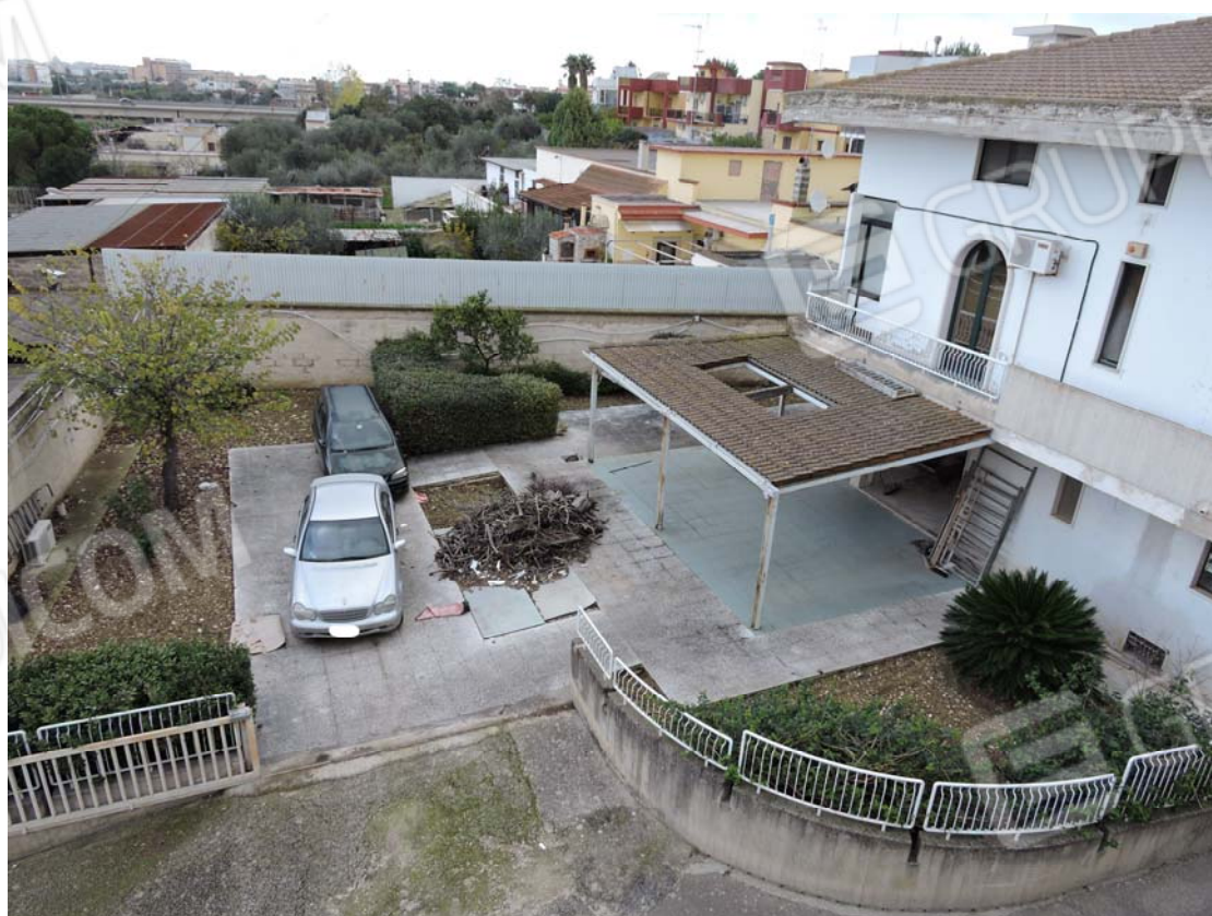
Evidenza dell'accesso posteriore tramite la particella 84