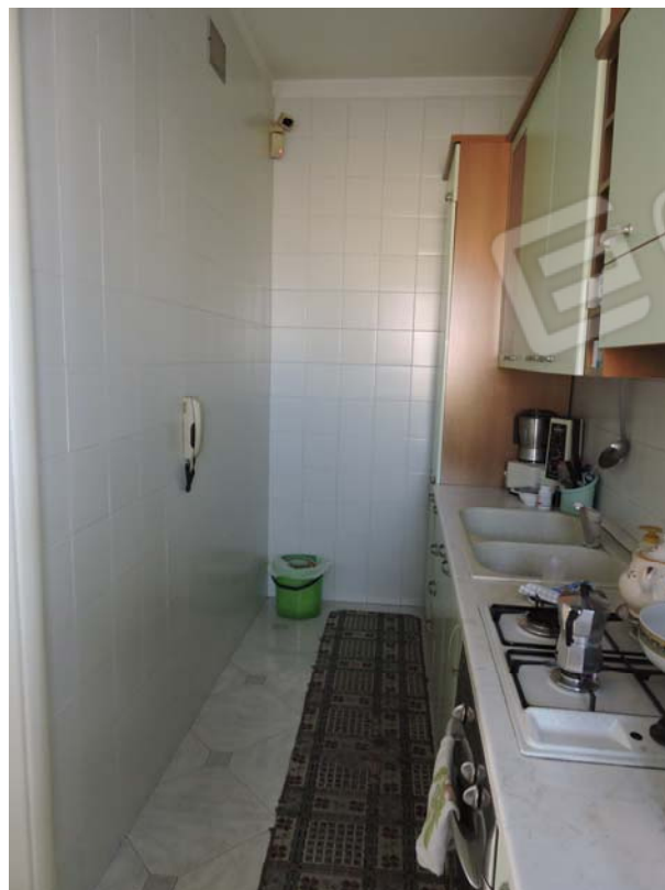
Cucina piano rialzato