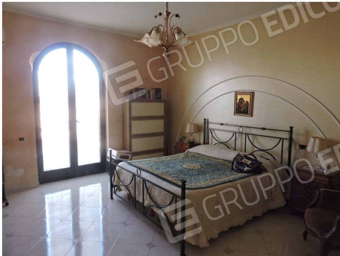
Camera piano rialzato