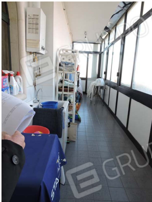
Veranda abusiva piano rialzato