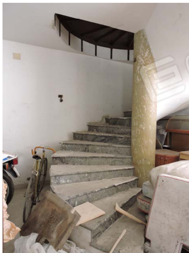
Collegamento verticale occluso tra piano S1 e piano rialzato