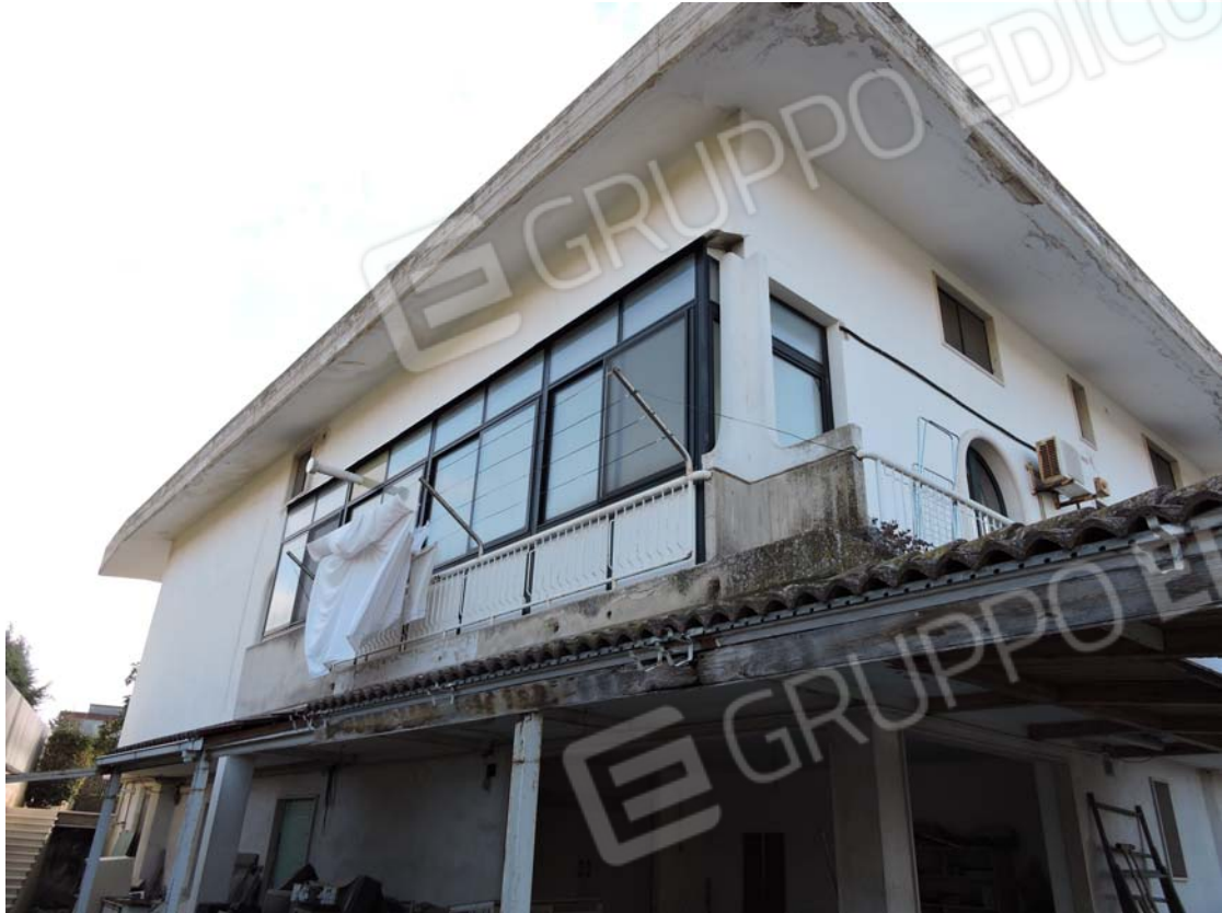
Prospetto laterale nord con veranda abusiva