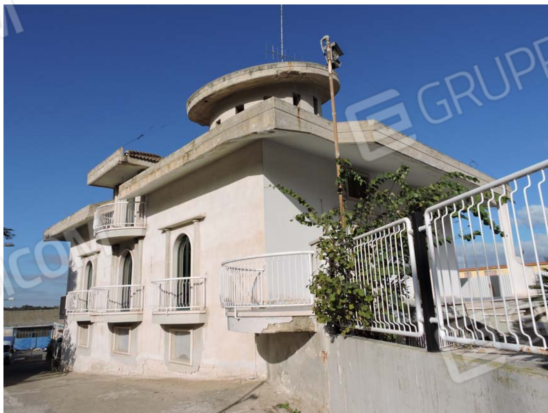
Prospetto laterale sud