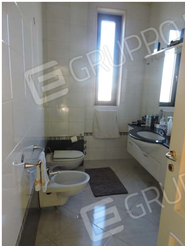
Altro bagno piano rialzato