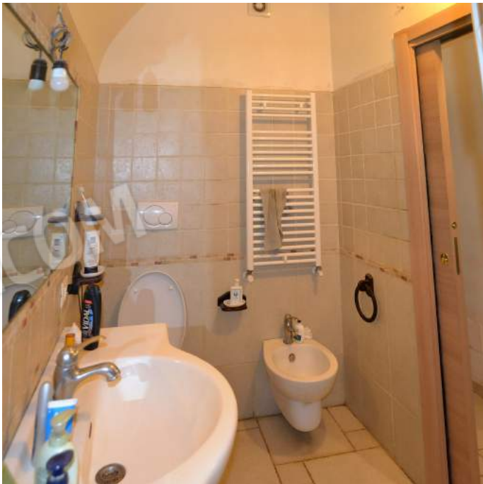
20-21 – Il bagno al piano terra