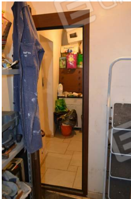
16 – La porta della centrale termico-idrica verso il disimpegno