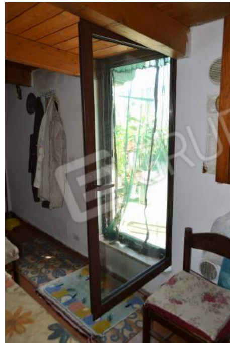
46 – La porta di accesso al terrazzo dalla soffitta