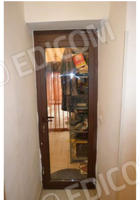
14 – La porta d'ingresso alla centrale termico-idrica dell'abitazione