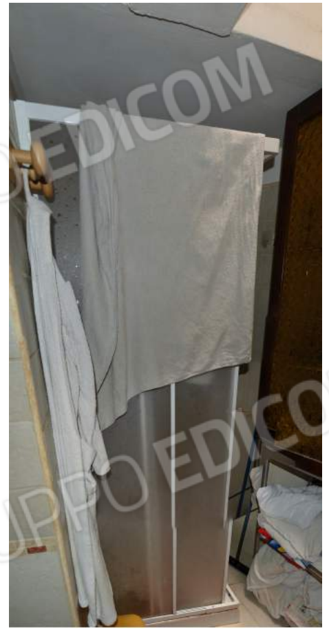
38-39 – Il bagno del secondo piano