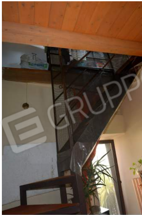
42-43 – La scaletta metallica che conduce alla soffitta