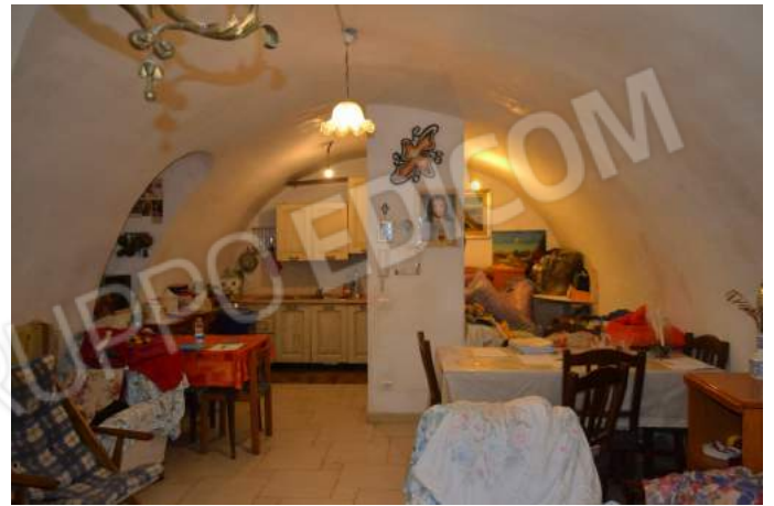
07 – Il soggiorno con la zona della cucina sul fondo