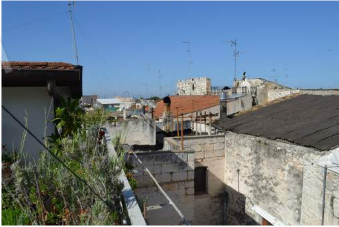
49-50 – Il terrazzo, l'affaccio su via Sant'Antonio