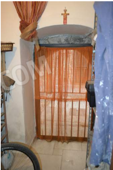
15 – La porta di accesso da via Sant'Antonio (civico n. 7) alla centrale termico-idrica