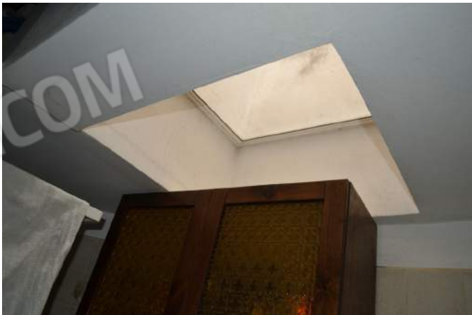
40 – Particolare del lucernario su pozzo di luce all'interno del bagno al secondo piano