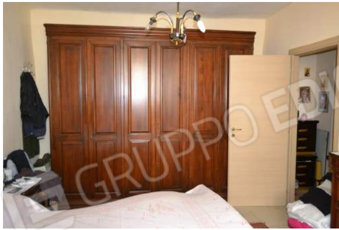
33-34-35-36 – La camera da letto matrimoniale al secondo piano