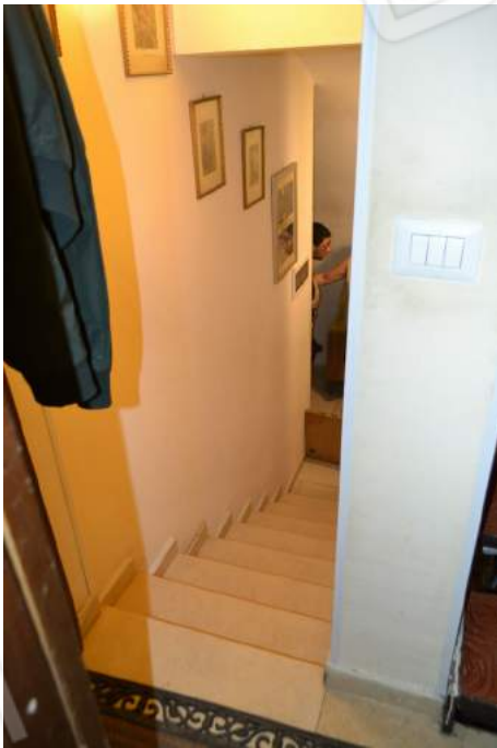
06 – L'ingresso, con a sinistra la rampa di scale che conduce al piano terra ribassato