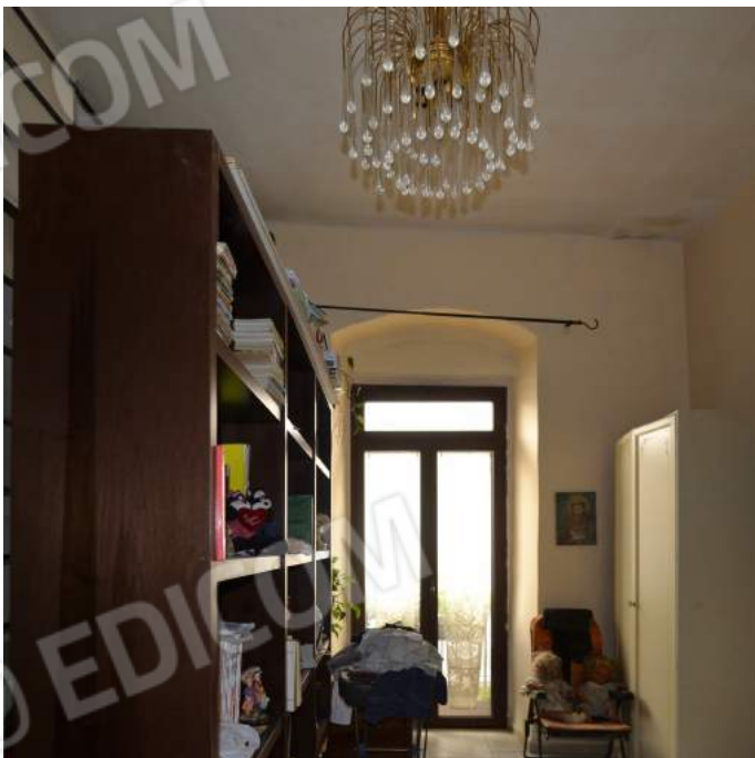
25 – Il soggiorno al primo piano verso la portafinestra che affaccia su via Sant'Antonio