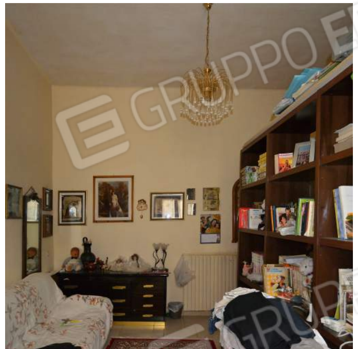
26 – Il soggiorno al primo piano verso la parete ad ovest