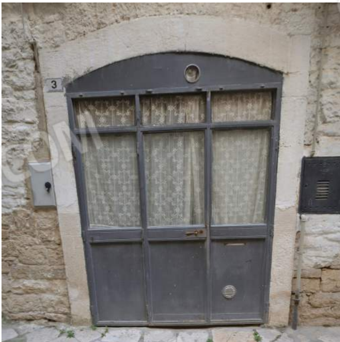
04 – L'ingresso al civico n. 3