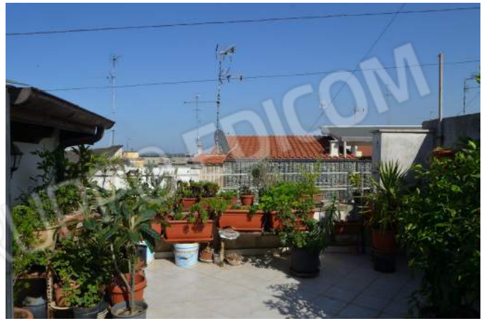
48 – Il terrazzo, verso est