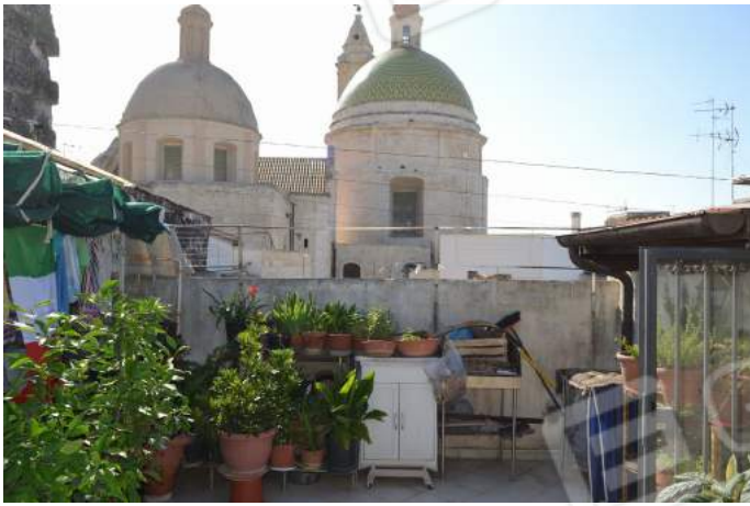
47 – Il terrazzo, verso ovest