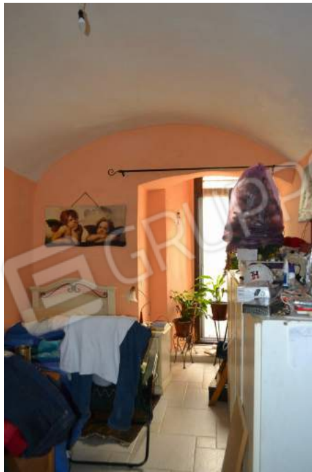
28 – La camera da letto singola verso la portafinestra su via Sant'Antonio