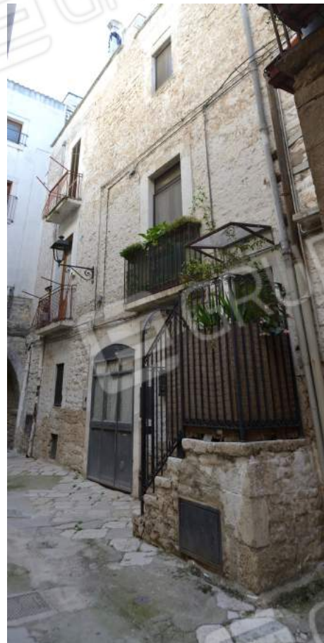
05 – Vista, da cielo a terra, dell'abitazione