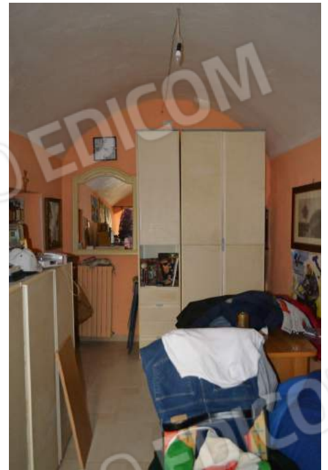
29 – La camera da letto singola verso la parete ad ovest