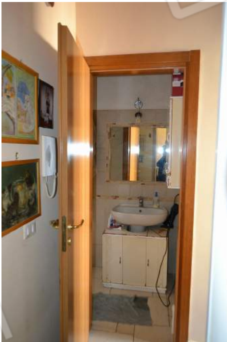
37 – L'ingresso al bagno del secondo piano dal disimpegno