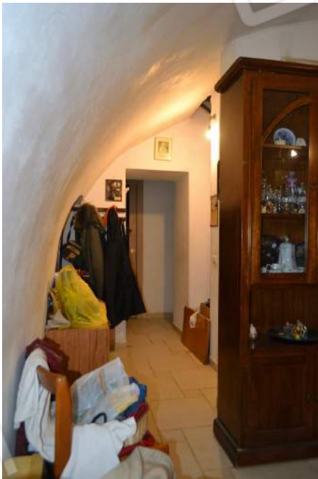
12-13 – Il disimpegno al piano terra ribassato