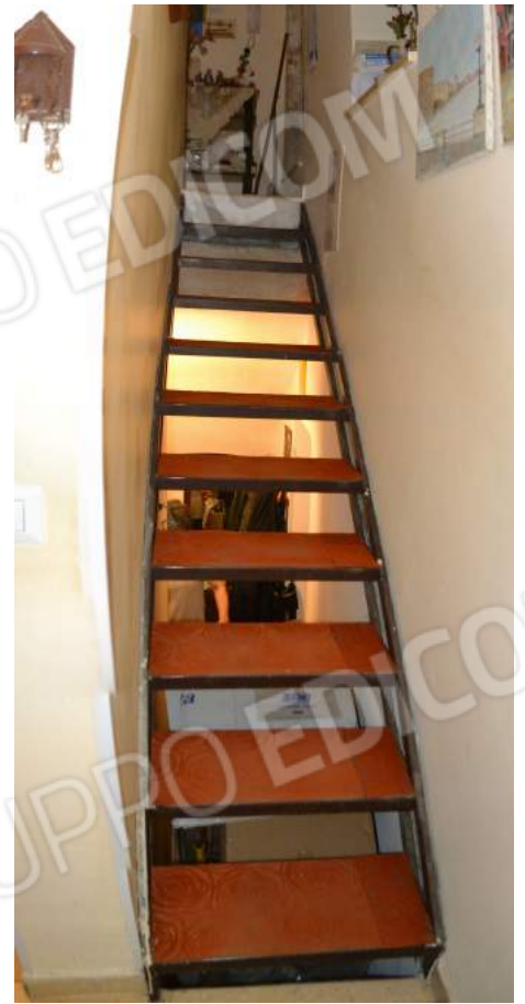
24 – La rampa di scale verso il primo piano, dal pianerottolo all'ingresso