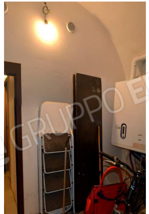
17 – La centrale termico-idrica verso la parete ad ovest