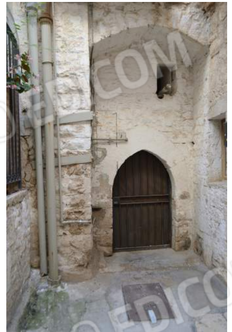
03 – L'ingresso al civico n. 7