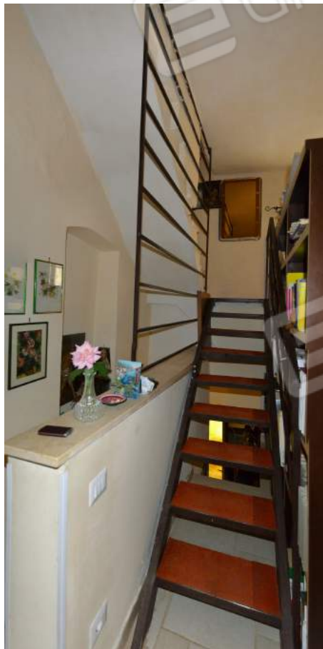
31-32 – Le due rampe di scale che collegano primo e secondo piano