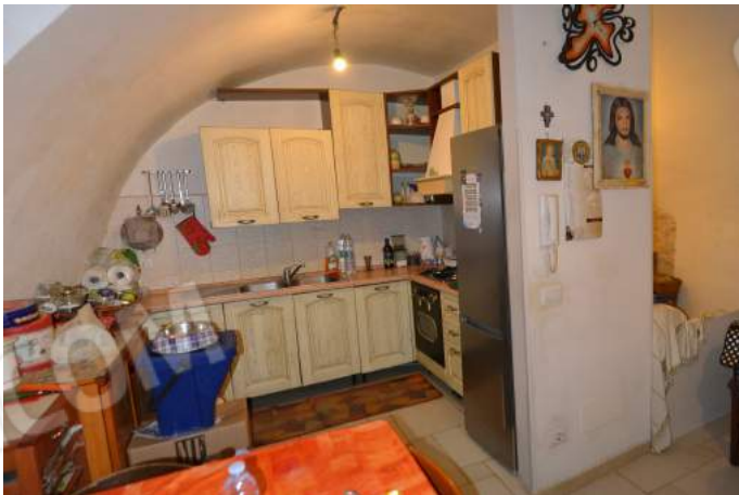
08-09 – La cucina con a sinistra la finestra su via Sant'Antonio