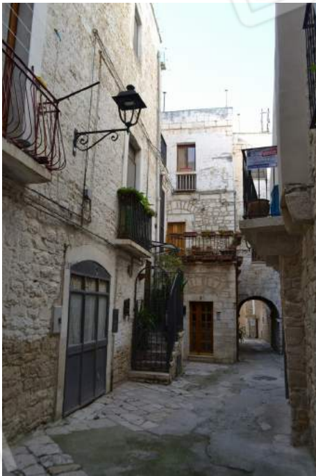
01 – Inquadramento (a sinistra) dell'abitazione giungendo da via Sant'Antonio