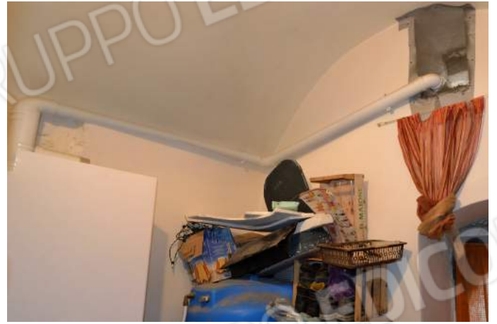
19 – Particolare del tubo di scarico della caldaia verso l'esterno