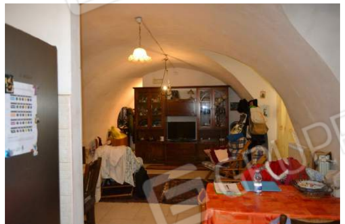
11 – La parete a nord del soggiorno