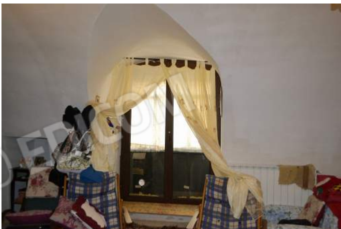
10 – Il portone di accesso al soggiorno da via Sant'Antonio al civico n. 3