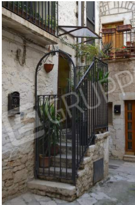
02 – L'ingresso principale dell'immobile al civico n. 5