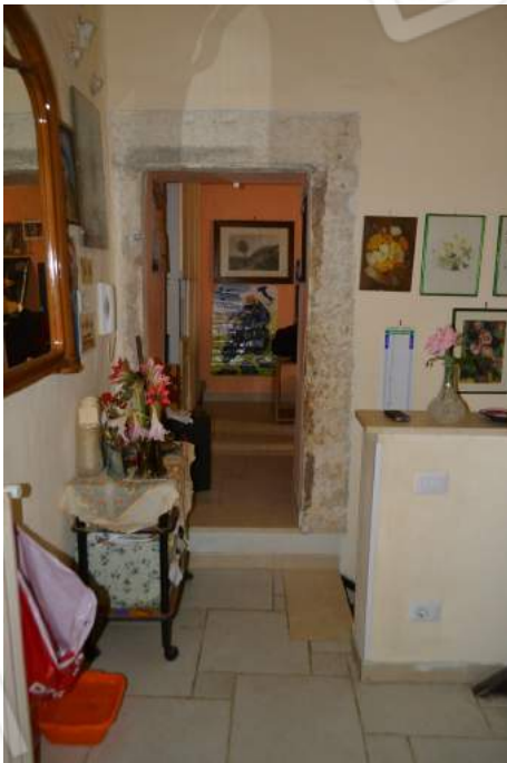
27 – Il soggiorno al primo piano verso la camera da letto singola