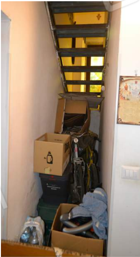
22 – Il sottoscala al piano terra