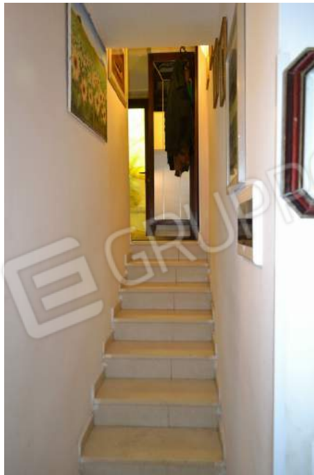
23 – La rampa di scale verso il pianerottolo d'ingresso