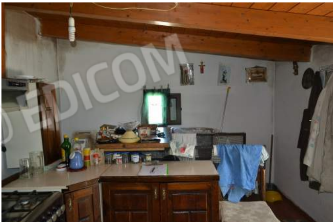
44-45 – La soffitta al terzo piano