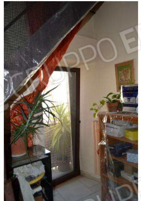
41 – La porta finestra del vano al secondo piano dove è presente la scala metallica che conduce alla soffitta