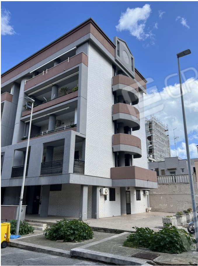
Foto 3 – Vista prospetto principale e laterale fabbricato condominiale in Bari alla Via Vincenzo Bellezza angolo Via Lucio Silano.