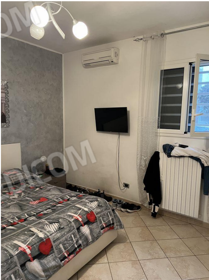
Foto 12 - Vista interna stanza da letto LM