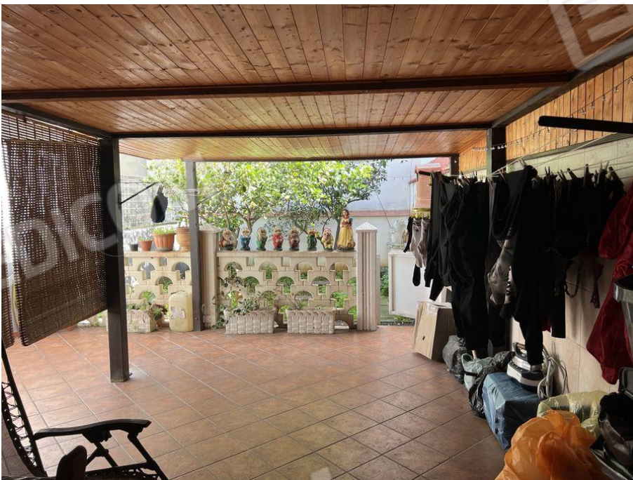
Foto 24 – Vista cortile esterno coperto da tettoia con struttura in metallo e legno