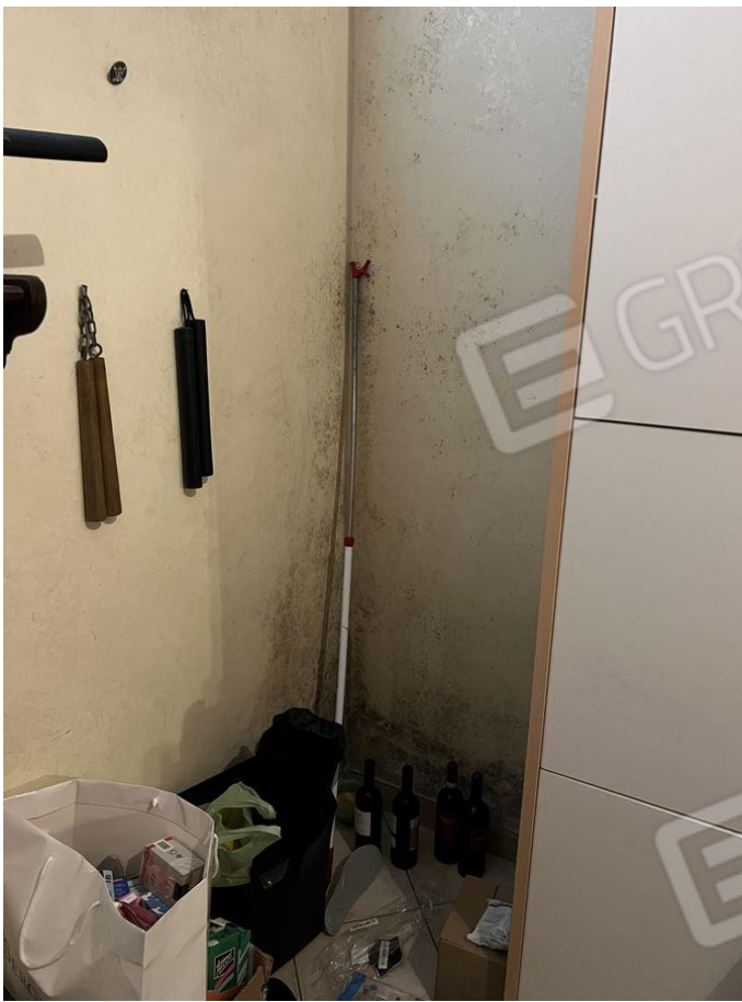
Foto 19 – Particolare angolo parete esterna verso il porticato condominiale con presenza di muffe