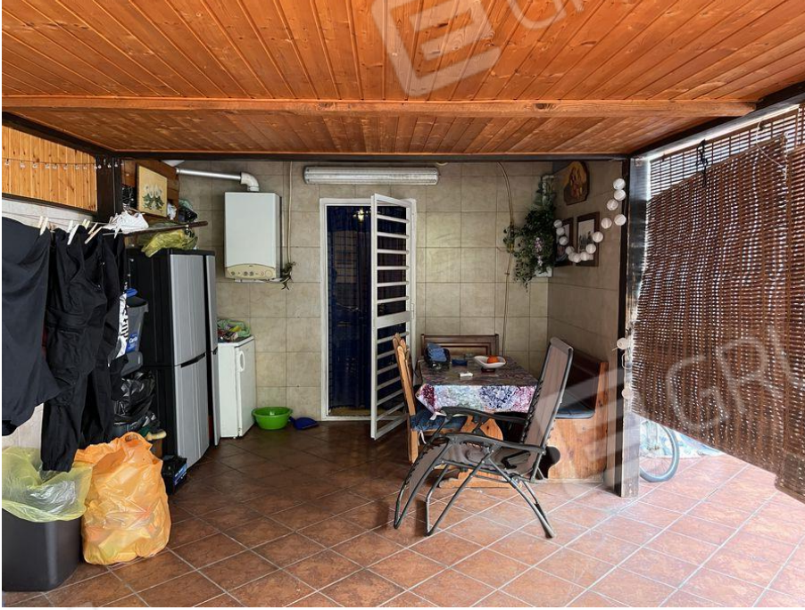
Foto 23 – Vista cortile esterno coperto da tettoia con struttura in metallo e legno