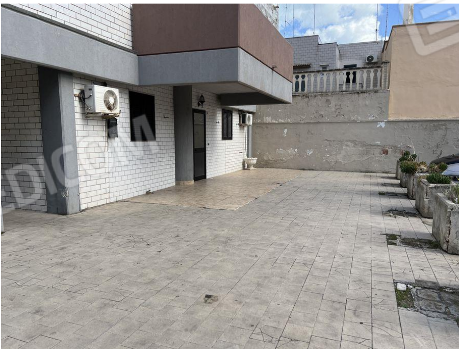
Foto 4 – Vista prospetto laterale fabbricato condominiale in Bari alla Via Vincenzo Bellezza da cui ha accesso diretto l'appartamento fg. 7 p.lla 547 sub. 53.