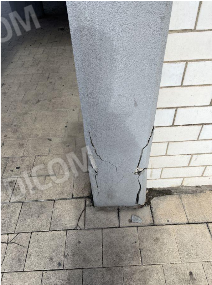
Foto 30 – Particolare lesioni dovuti alla ossidazione dei coprifermo su pilastro d'angolo a piano terra dell'appartamento fg. 7 p.lla 547 sub. 53