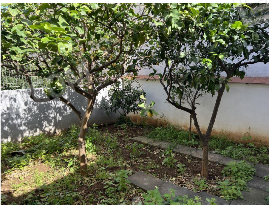
Foto 26- Vista giardino