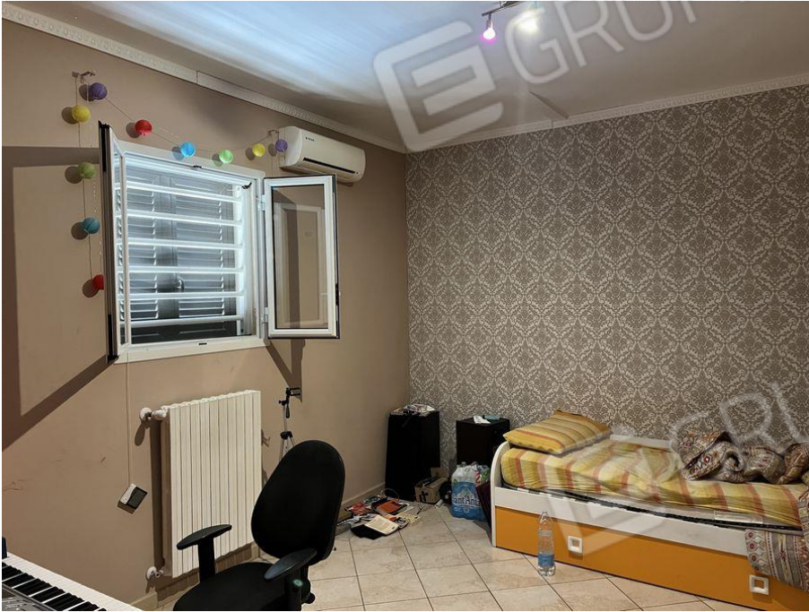
Foto 15 - Vista interna stanza da letto L2