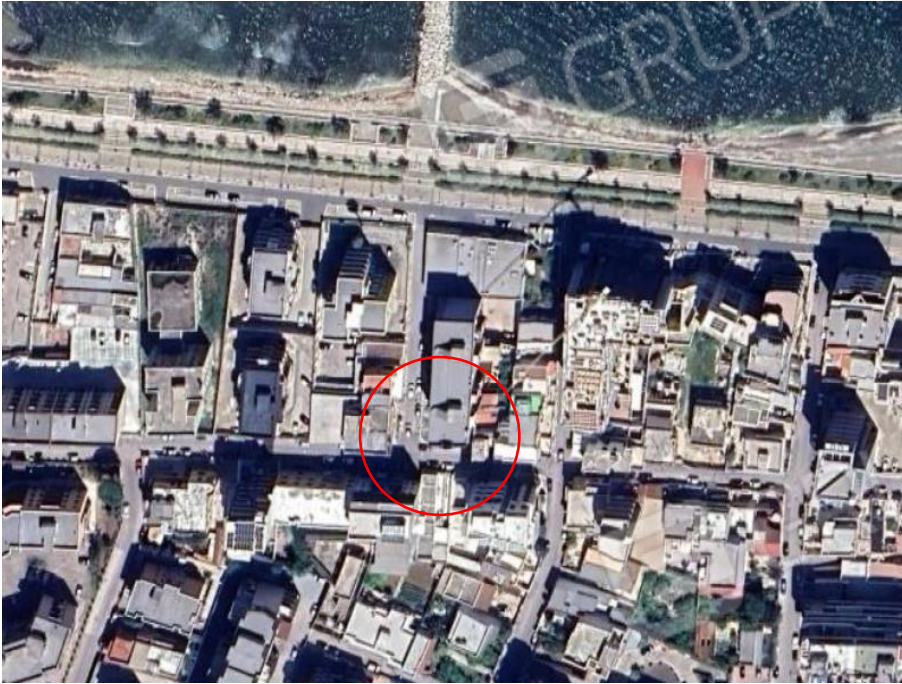
Foto 1- Vista satellitare con inquadramento del fabbricato in Bari alla Via Vincenzo Bellezza angolo Via Lucio Silano.