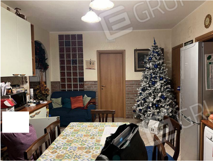
Foto 11 - Vista interna cucina pranzo verso la stanza da letto L1