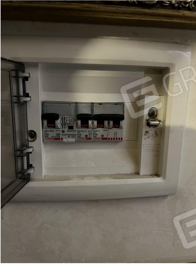
Foto 29 – Particolare quadro elettrico appartamento fg. 7 p.lla 547 sub. 53