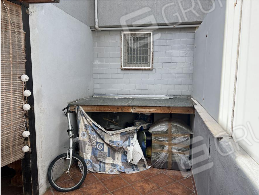
Foto 25 – Vista Pensilina con struttura in legno posta a ridosso della parete del bagno.