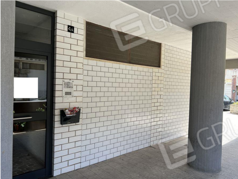
Foto 5 – Vista dal porticato condominiale dell'appartamento fg. 7 p.lla 547 sub. 53 e dell'androne condominiale cui al civico 4/A di Via Lucio Silano