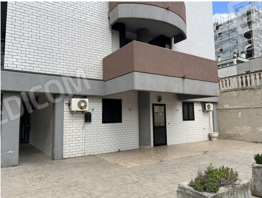
Foto 6 – Vista prospetto laterale fabbricato condominiale in Bari alla Via Vincenzo Bellezza da cui ha accesso diretto l'appartamento fg. 7 p.lla 547 sub. 53