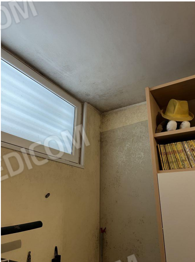
Foto 20 – Particolare angolo parete esterna e soffitto verso il porticato condominiale con presenza di muffe