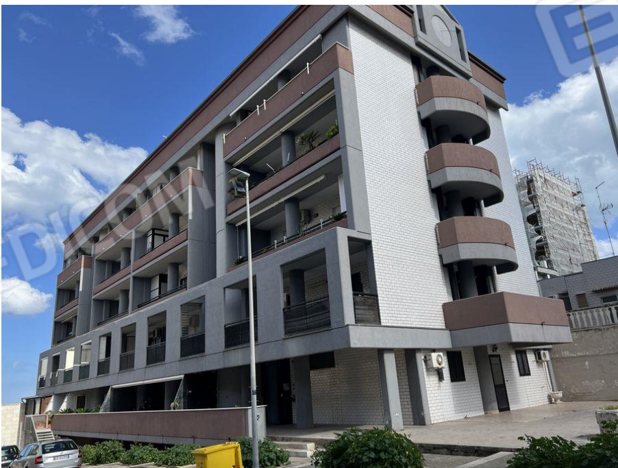
Foto 2 – Prospetto principale e laterale fabbricato condominiale in Bari alla Via Vincenzo Bellezza angolo Via Lucio Silano.