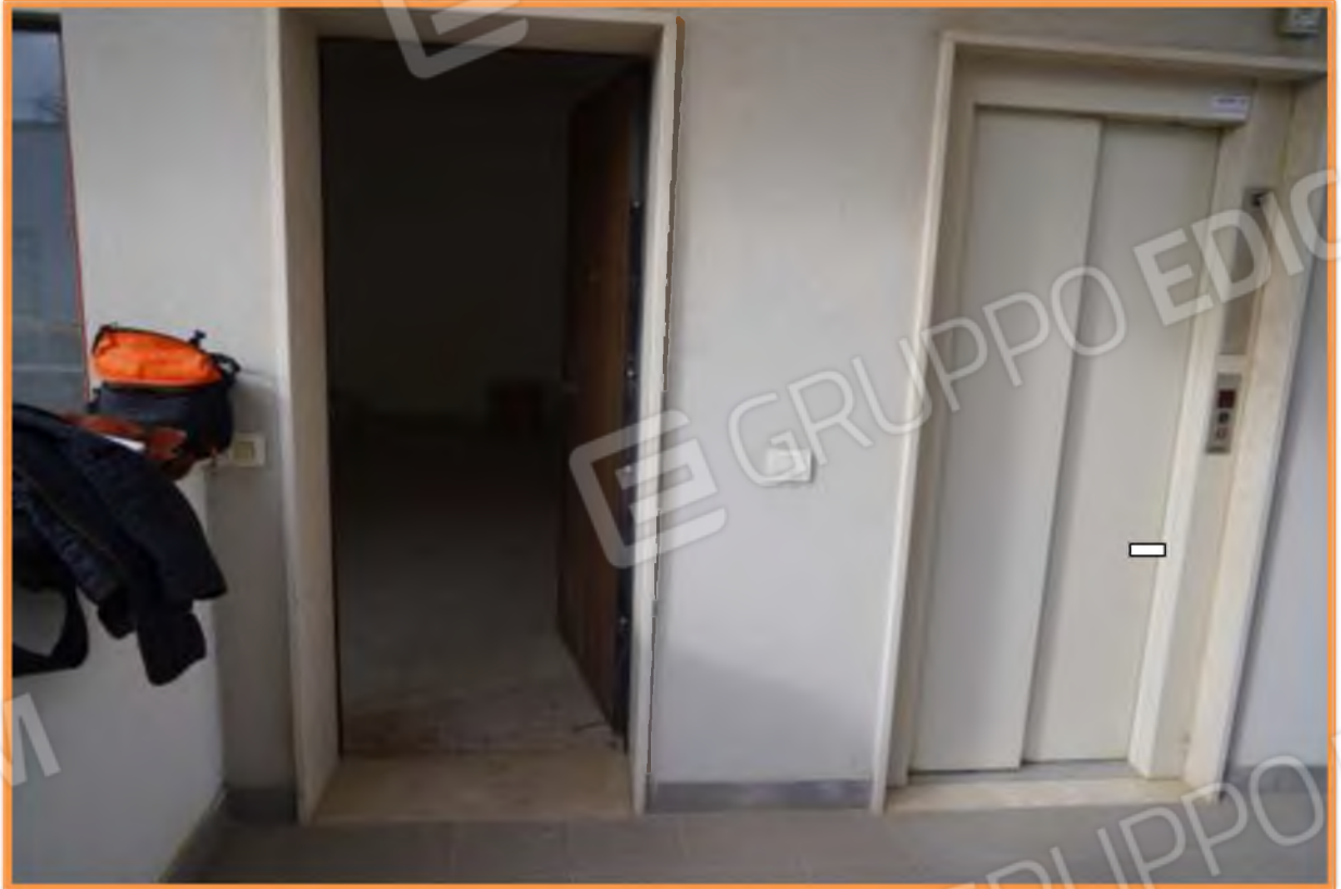
FOTO n° 4. Piano terra. Portoncino di ingresso all'unità staggiata. Vista verso la direzione ovest.