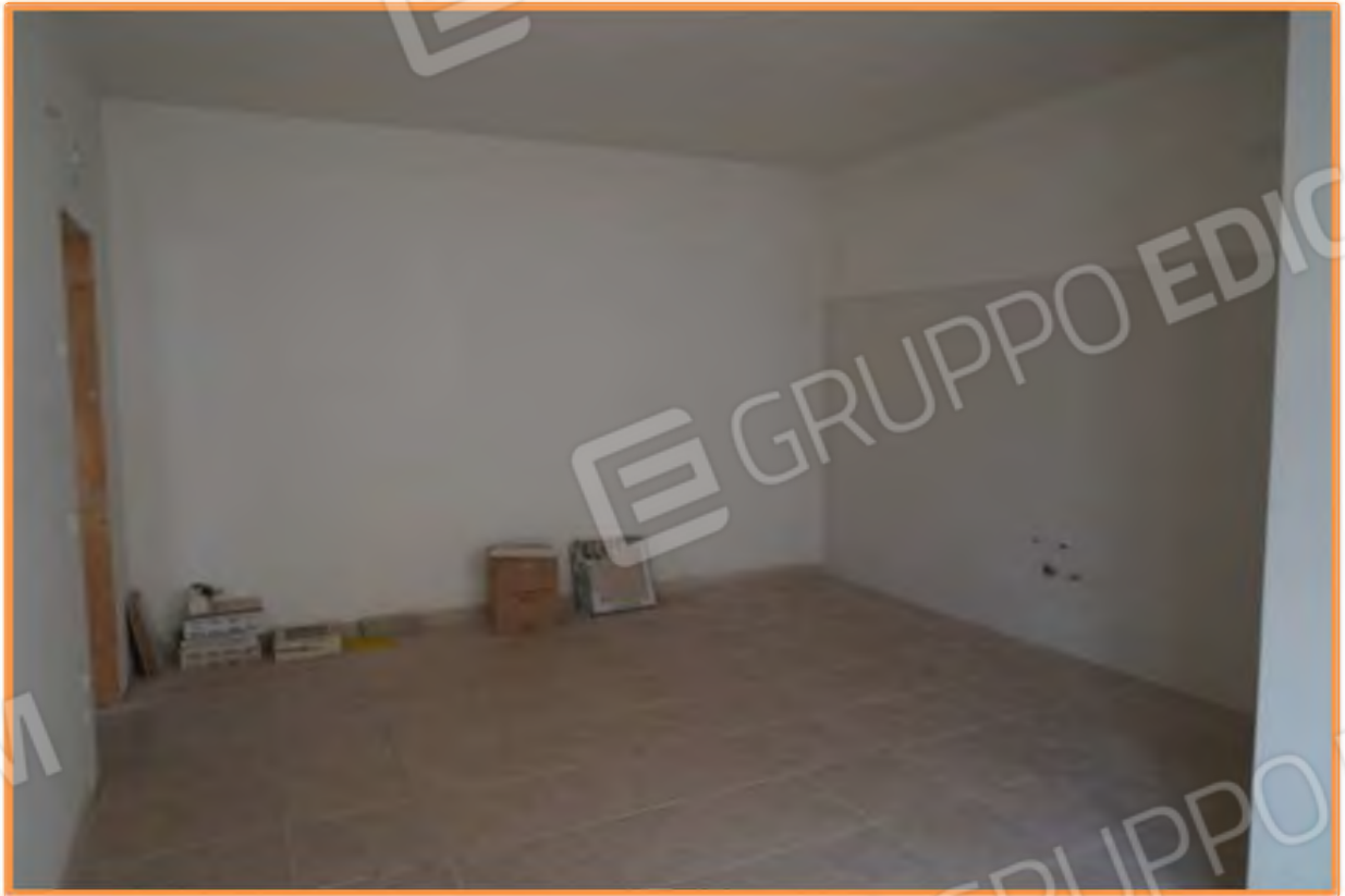
FOTO n° 6. Piano terra. Vano open space: ingresso-soggiorno e cucina. Vista verso la direzione nord-ovest. A destra è visibile la parete attrezzata per la cucina. L'apertura di porta a sinistra immette alla zona notte.