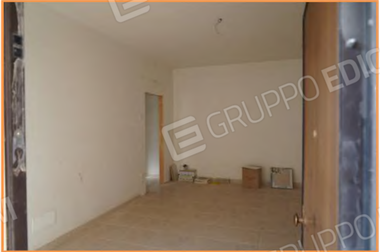
FOTO n° 5. Piano terra. Vano open space: ingresso-soggiorno e cucina. Vista verso la direzione ovest.