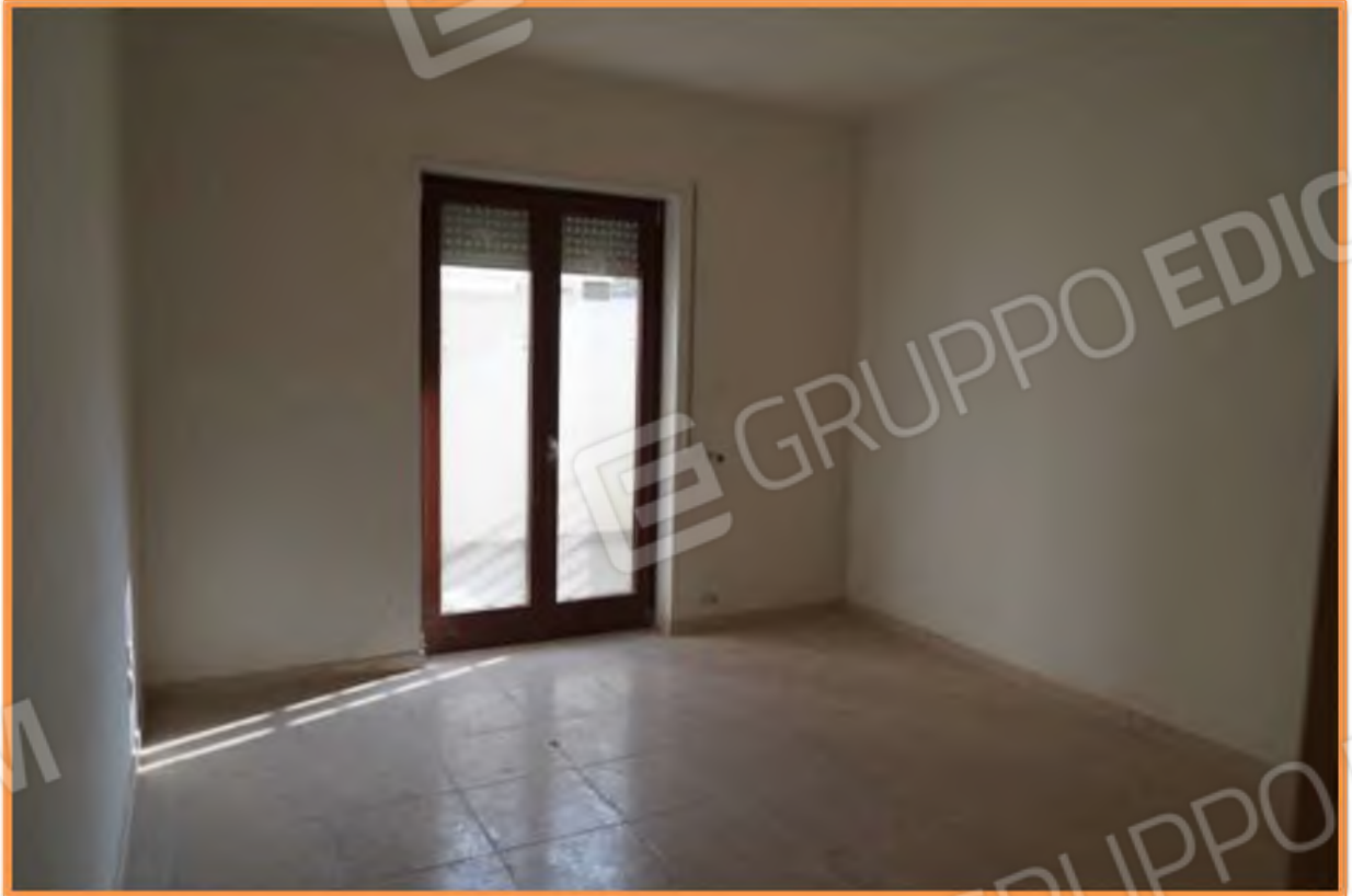
FOTO n° 12. Camera, vista verso la direzione sud-ovest. Il finestrone immette sulla terrazza a livello.