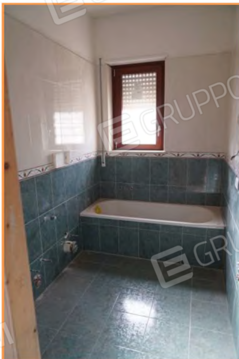
FOTO n° 11. Vano bagno, vista verso la direzione sud. Il finestrino si affaccia sulla via Lucania.