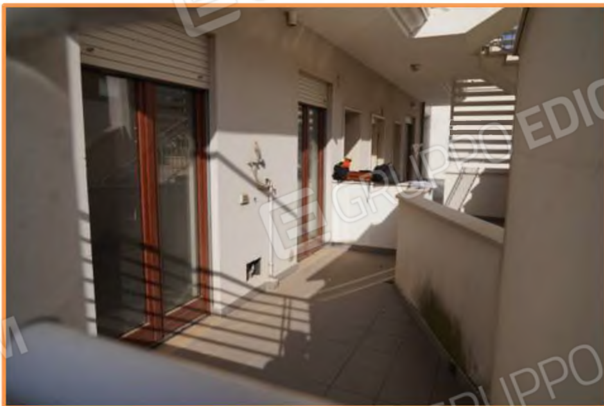
FOTO n° 13. Terrazza a livello di piano terra. Vista verso la direzione nord.