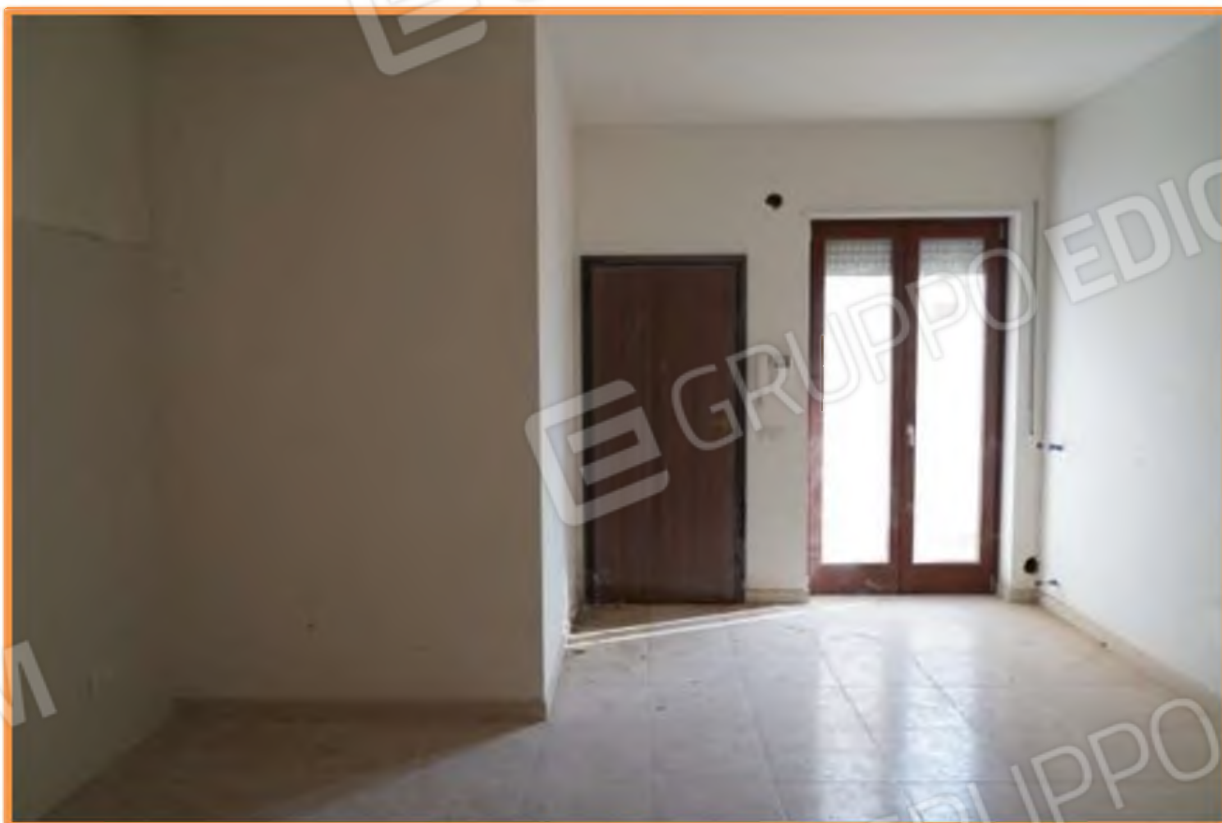
FOTO n° 7. Come foto nn° 5 - 6. Vista verso la direzione est, verso il portoncino di ingresso. A sinistra è visibile parte della parete attrezzata a cucina e frontalmente è posto il finestrone che immette alla terrazza a livello.