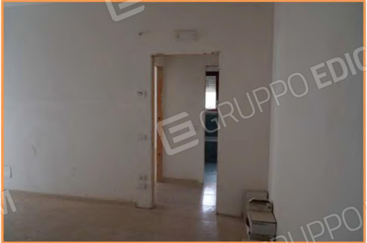
FOTO n° 9. Zona di passaggio dall'open space alla zona notte. La zona centrale è il disimpegno che distribuisce a una camera e al bagno Vista verso la direzione sud.