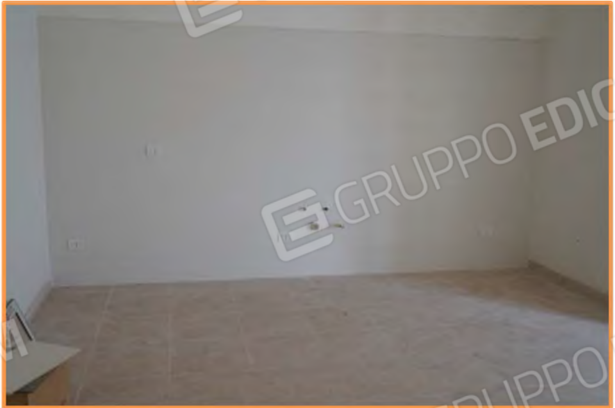
FOTO n° 8. Particolare della parete attrezzata a cucina. Vista verso la direzione nord.