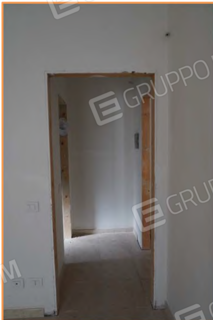
FOTO n° 10. Disimpegno interposto tra l'open space e la zona notte. Vista verso la direzione ovest. Frontalmente a chi entra si accede al bagno; lateralmente a sinistra si accede alla camera.