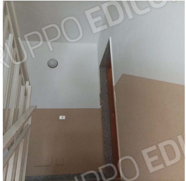
Scala condominiale di accesso all'appartamento privo di ascensore.