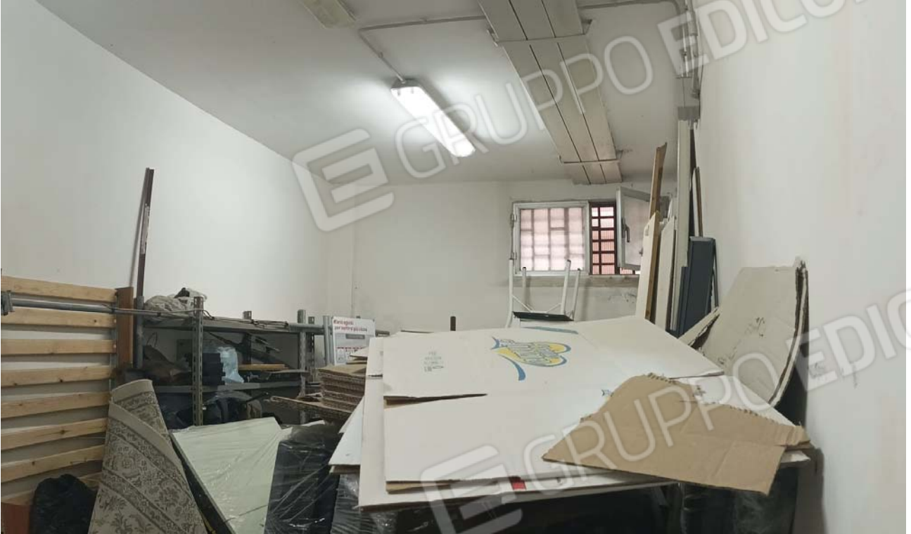
DEPOSITO al piano seminterrato