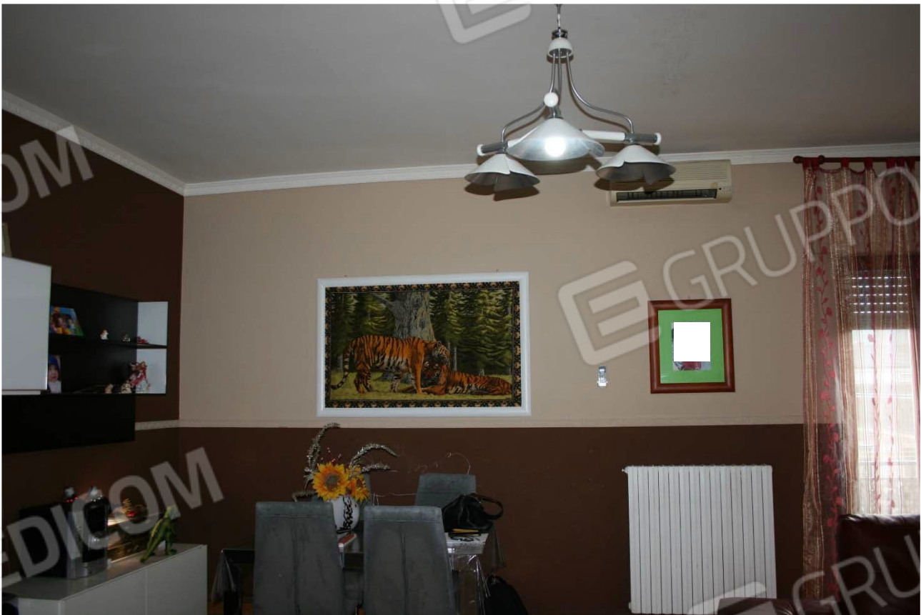
Ambiente unico soggiorno/salotto