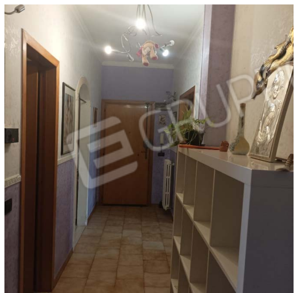
vista verso porta ingresso