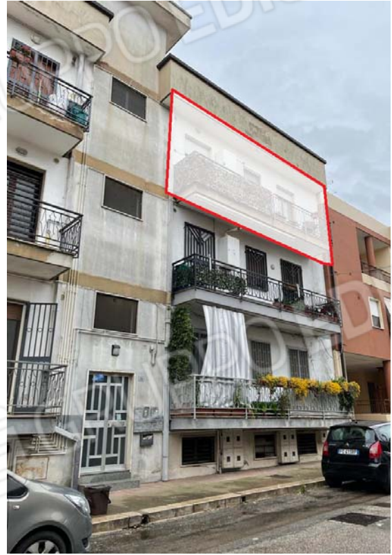
Evidenziato l'appartamento oggetto di Perizia al secondo piano sopra il piano rialzato