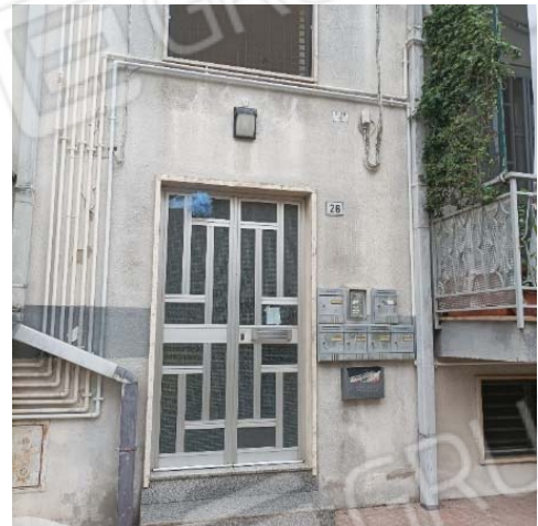
Il portone di accesso