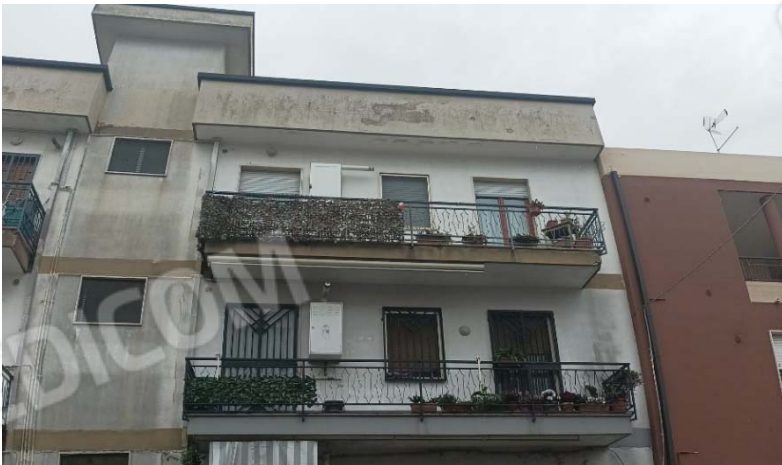
Il secondo piano