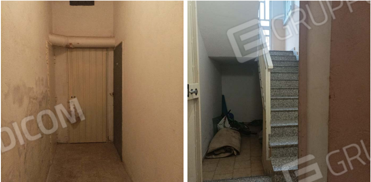
Porta di accesso al deposito e ingresso dal portone condominiale