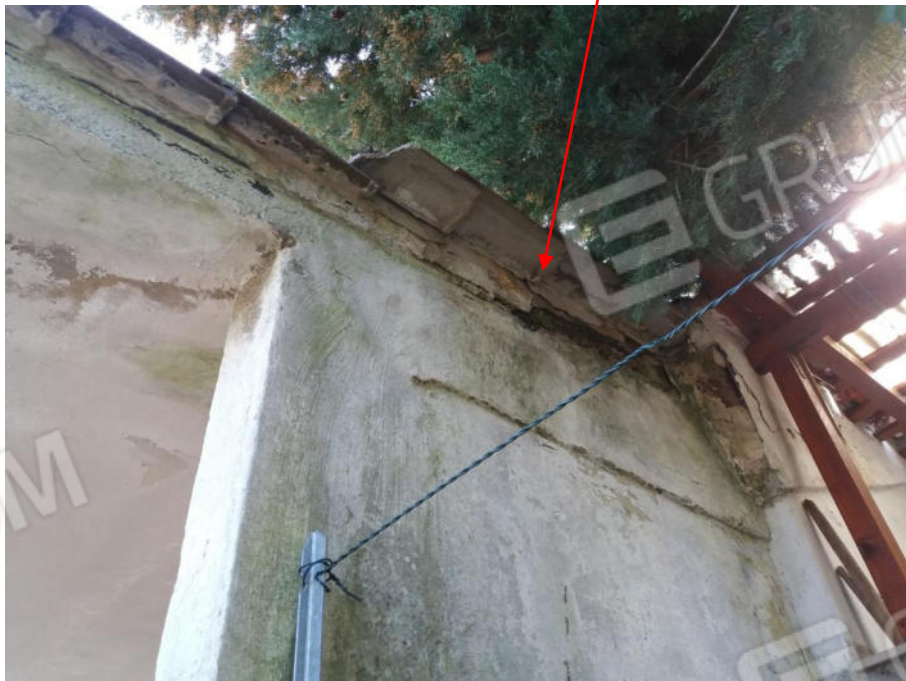
Foto n. 11 Particolare del quadro umido dovuto ad infiltrazioni per mancanza di manutenzione