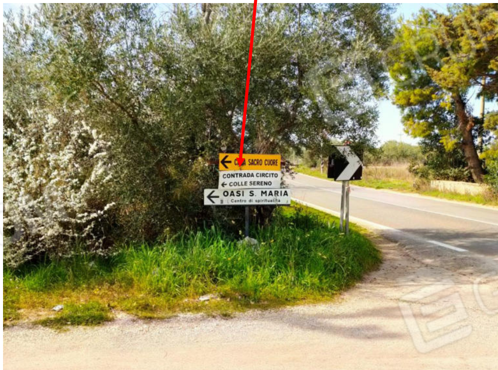
Foto n. 2 Indicazione stradale.