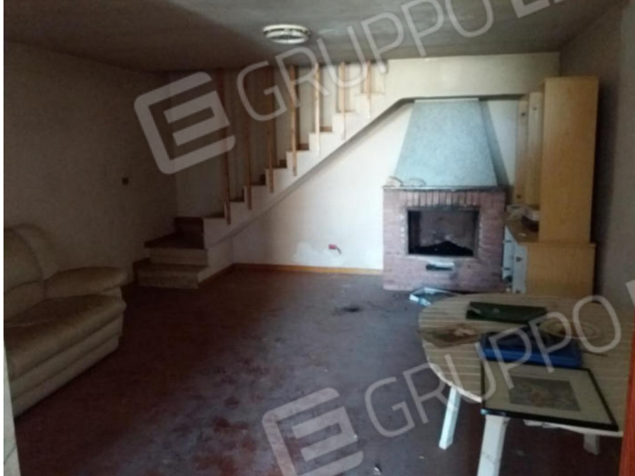
Foto n. 18 Soggiorno con camino e scala di accesso al piano primo