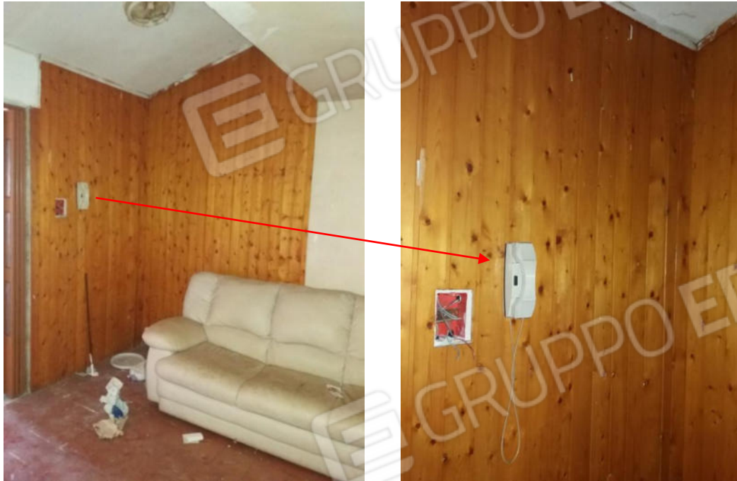
Foto n. 20-21 Predisposizione citofono e quadretto elettrico interno divelto