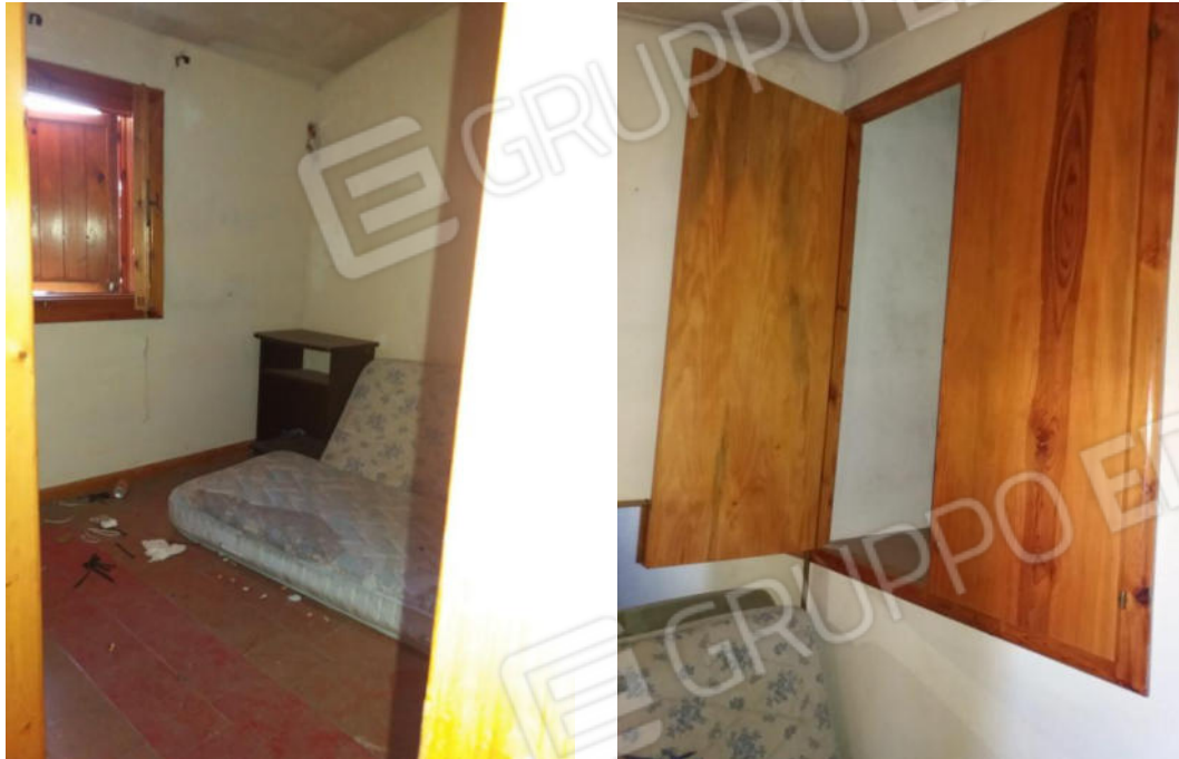
Foto n. 31-32 Camera da letto con finestra e armadio a muro sulla parete opposta