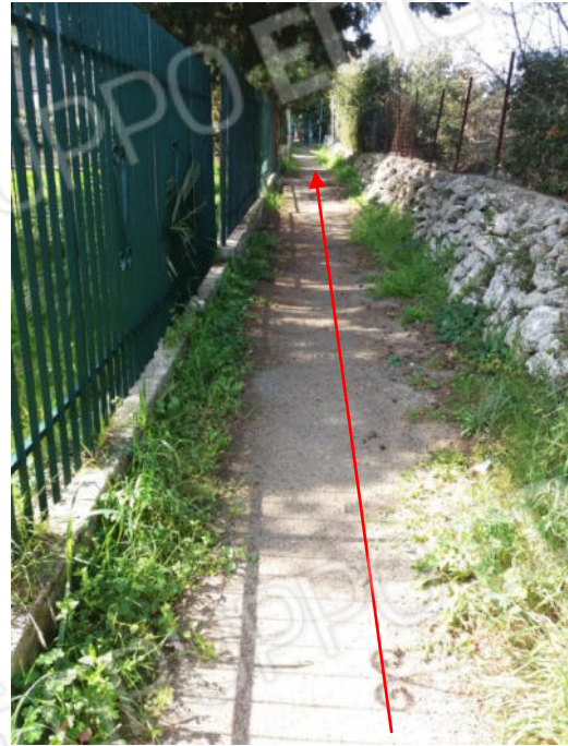
Foto n. 5 - 6 Particolare della stradina di accesso che costeggia l'intero lotto del residence