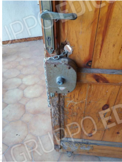
Foto n. 12 - 13 Particolare della porta di ingresso in legno forata e tenuta chiusa con una catena priva di lucchetto