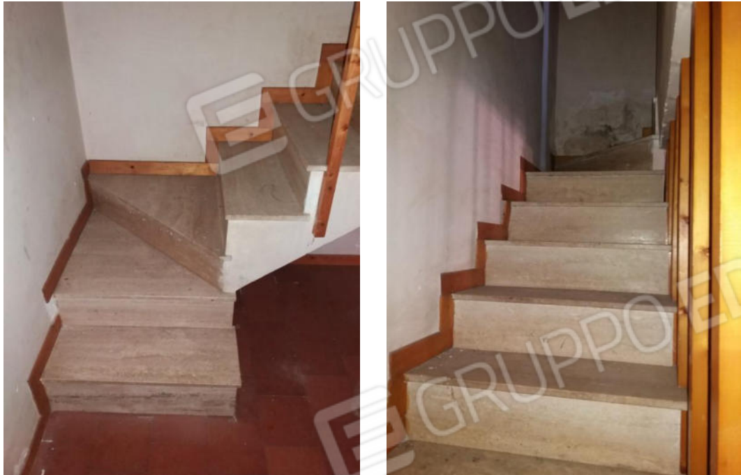
Foto n. 24-25 Scala di accesso al piano primo dal soggiorno