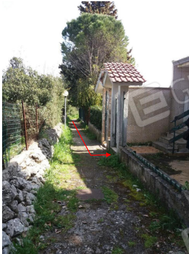
Foto n. 7 Ingresso all'immobile oggetto di procedura (p.lla 179 sub 10)