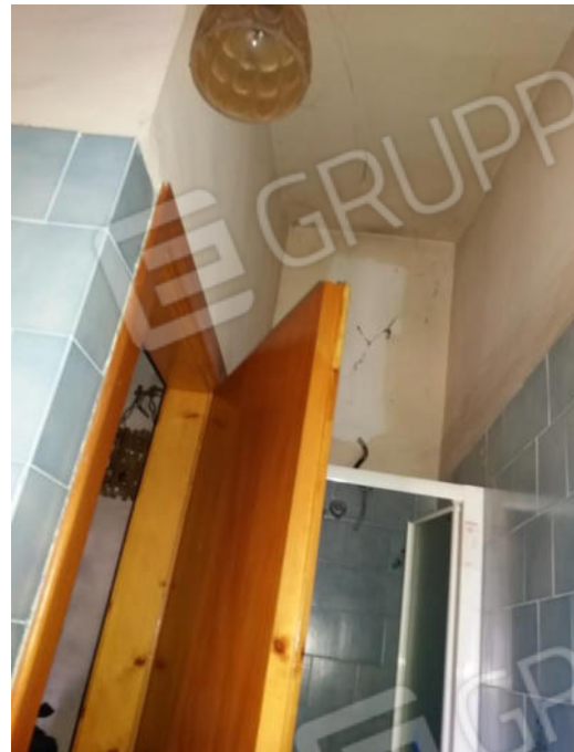
Foto n. 29-30 Box doccia posizionato dietro la porta