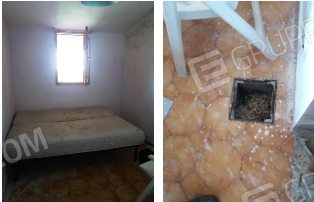
Foto n. 22-23 Camera con accesso dal soggiorno e pozzetto a pavimento dell'impianto elettrico con allacci tagliati