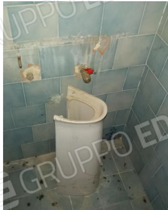
Foto n. 27-28 Bagno con finestra e lavandino rimosso