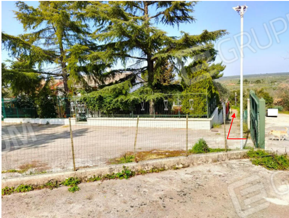
Foto n. 4 Stradina di accesso all'immobile oggetto di procedura che costeggia la recinzione esterna.