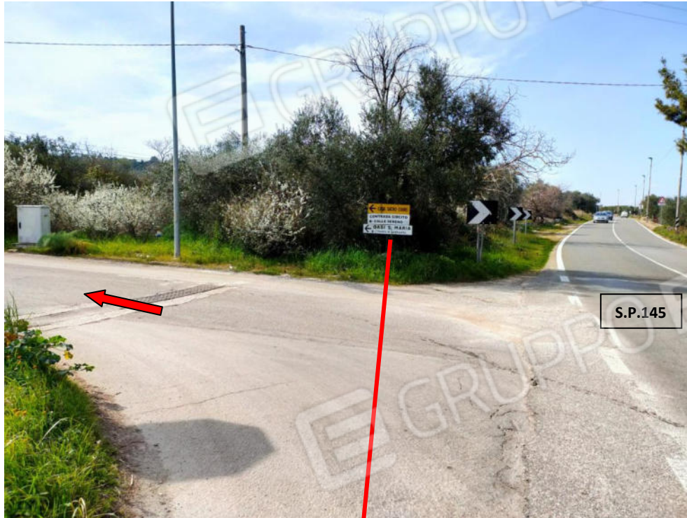
Foto n. 1 Innesto della Contrada Circito Colle Sereno su S.P.145, dalla quale si arriva all'immobile oggetto di procedura esecutiva