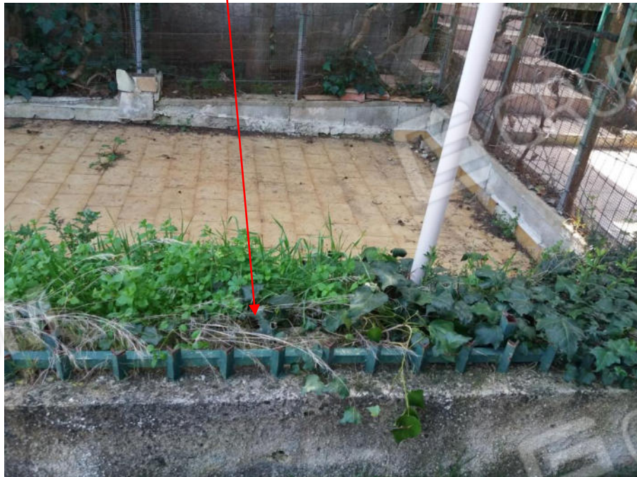
Foto n. 9 Recinzione in ferro di confine sulla stradina di accesso interamente tagliata.