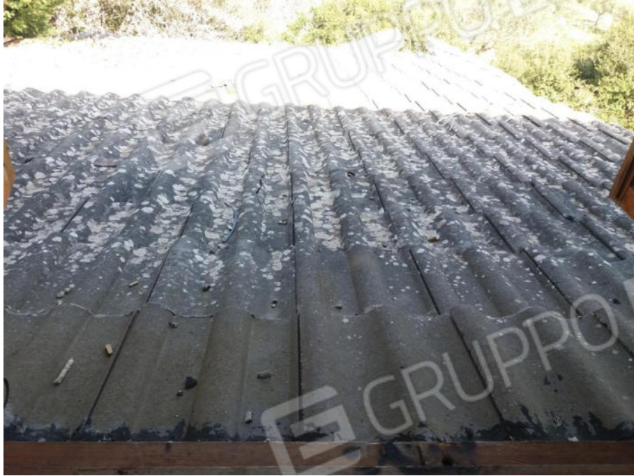
Foto n. 34 Copertura a spiovente con tegole vista dalla finestra della camera al piano primo