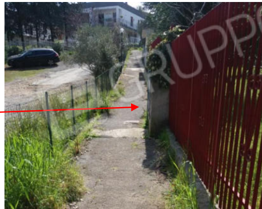
Foto n. 35 Quadro contatori del condominio (residence) chiuso con lucchetto, ubicato sul vialetto di accesso