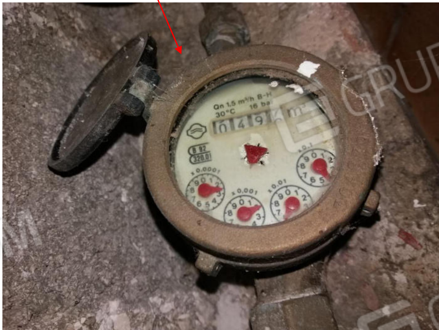
Foto n. 17 Contatore idrico funzionante