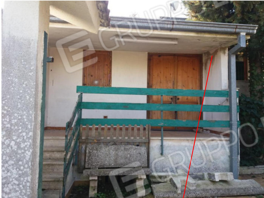
Foto n. 10 Ingresso da veranda rialzata