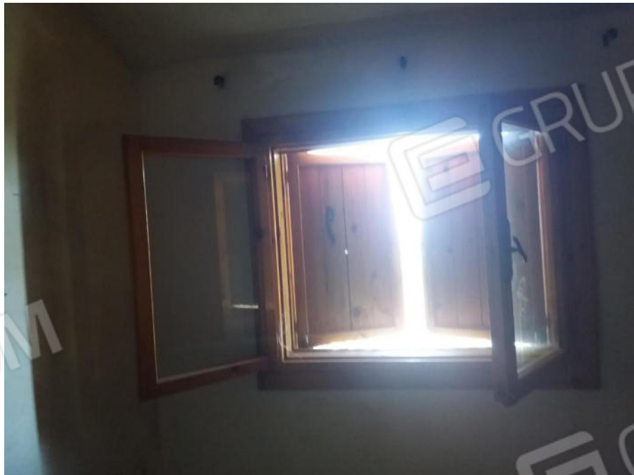
Foto n. 33 Finestra con scuri esterni in legno