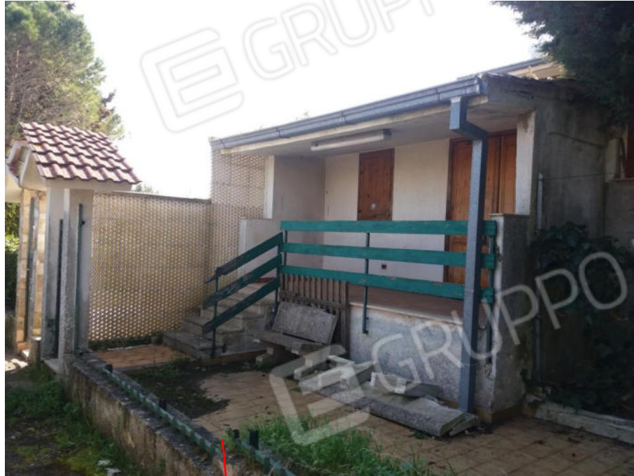
Foto n. 8 Facciata principale esposta a nord-ovest, con cortile pavimentato e veranda.