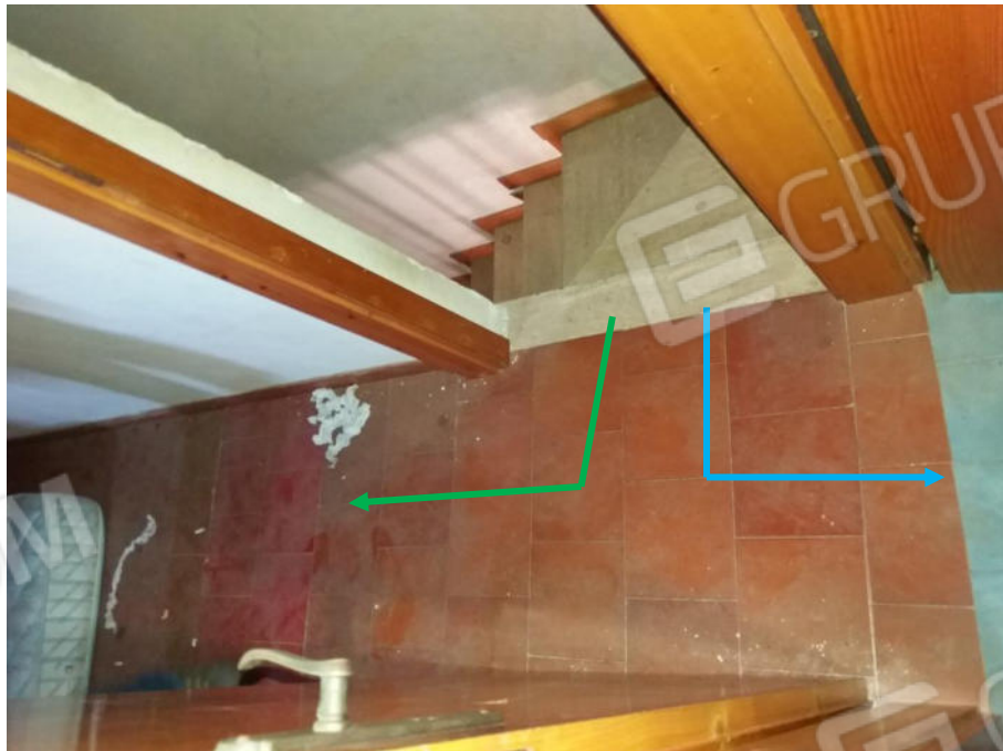
Foto n. 26 Piccolo disimpegno di accesso al bagno (freccia azzurra) e alla camera da letto (freccia verde)