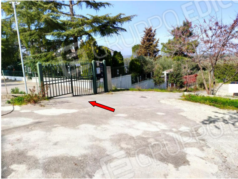
Foto n. 3 Ingresso recintato all'area Residence Circito, con accesso carrabile e pedonale privato, muniti di cancello.