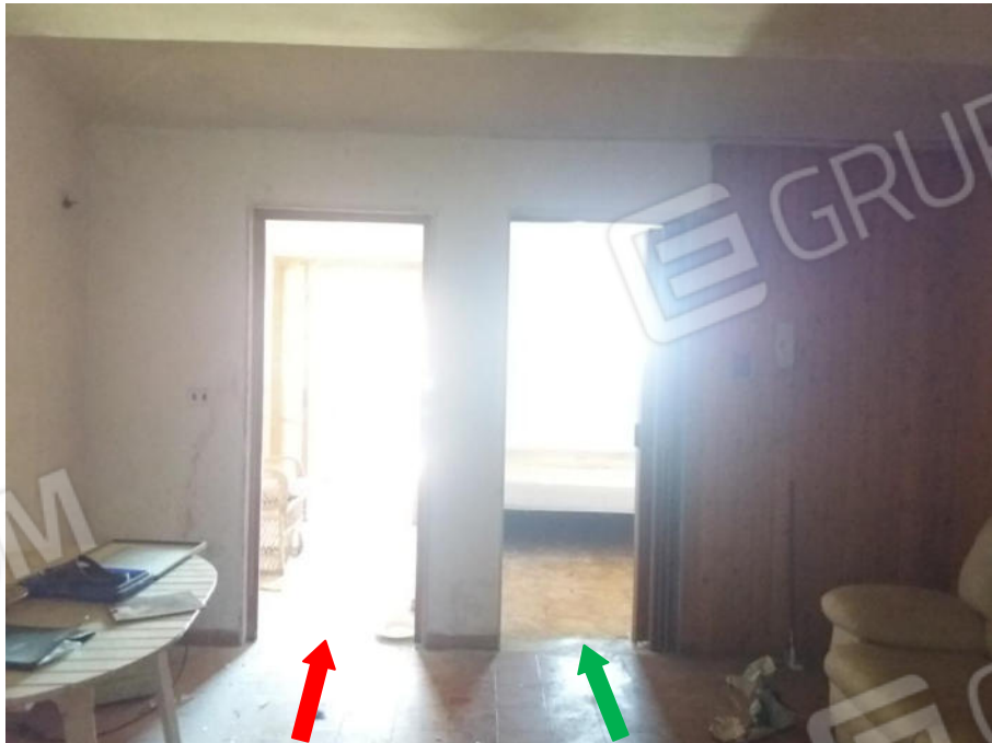
Foto n. 19 Porta di passaggio dal soggiorno all'ingresso-cucinato (freccia rossa) e porta di accesso alla camera (freccia verde)