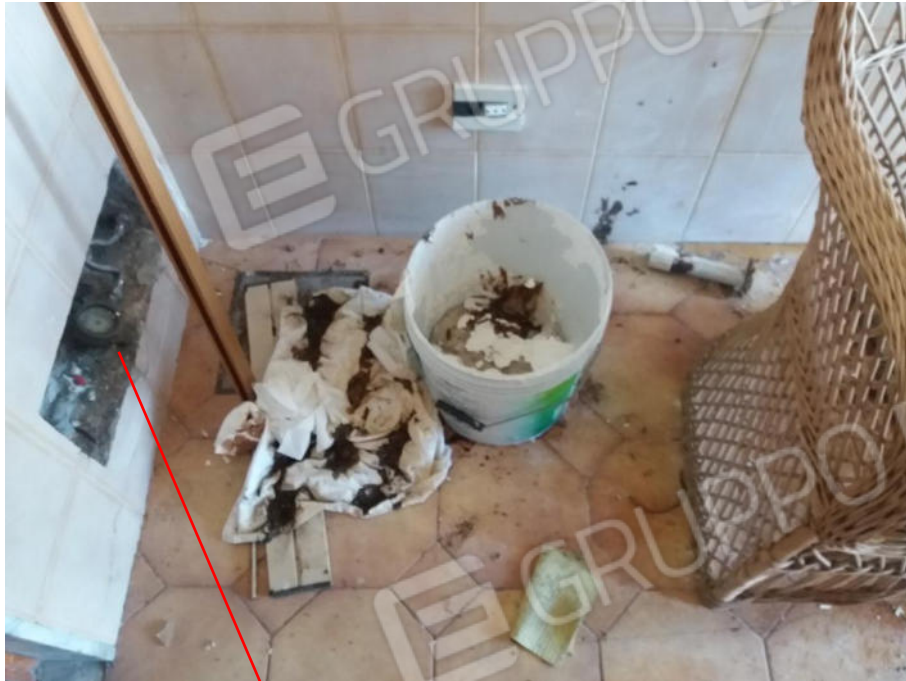
Foto n. 16 Allaccio idrico a muro con contatore