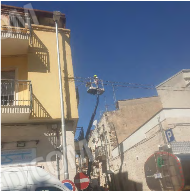
VISTA VERSO LA VIA TRIESTE –E' EVIDENTE L'ACCESSO DELL'OPERATORE IN COPERTURA PER PROVE CARICO