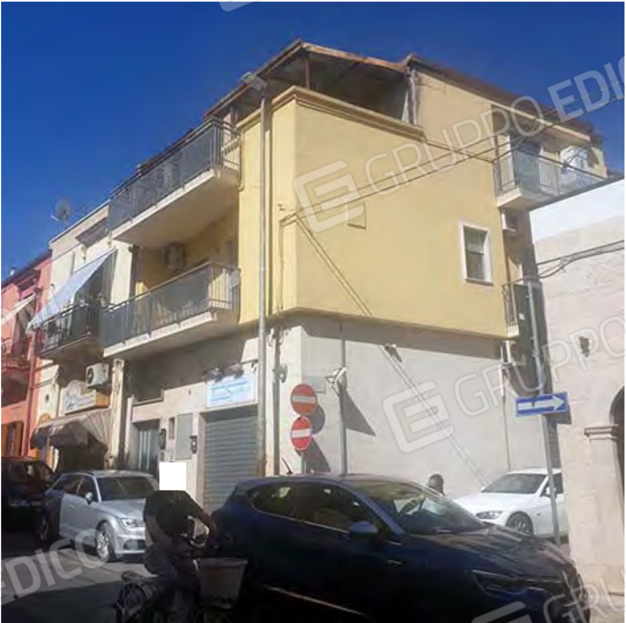
VEDUTA DI INSIEME