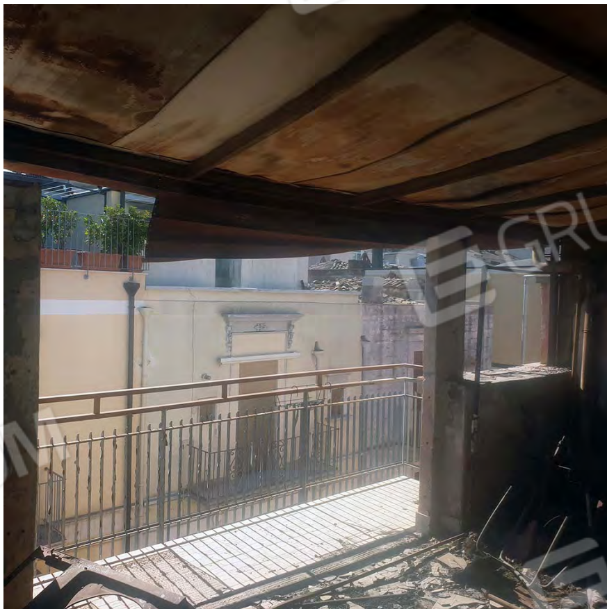
TERRAZZO SUL CORSO TRIPOLI: è evidente la tettoia incendiata , i detriti sulla pavimentazione e lo stato di degrado diffuso