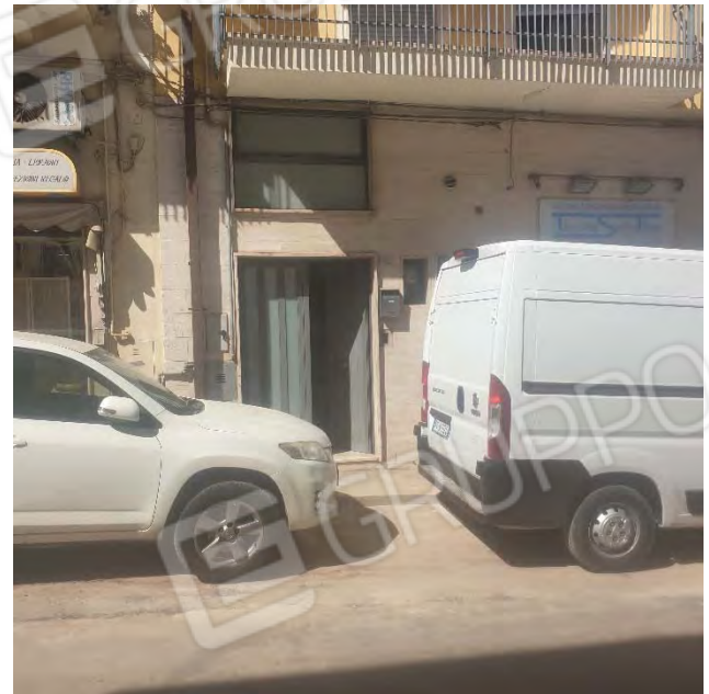
INGRESSO DAL CIVICO 81 VIALE TRIPOLI