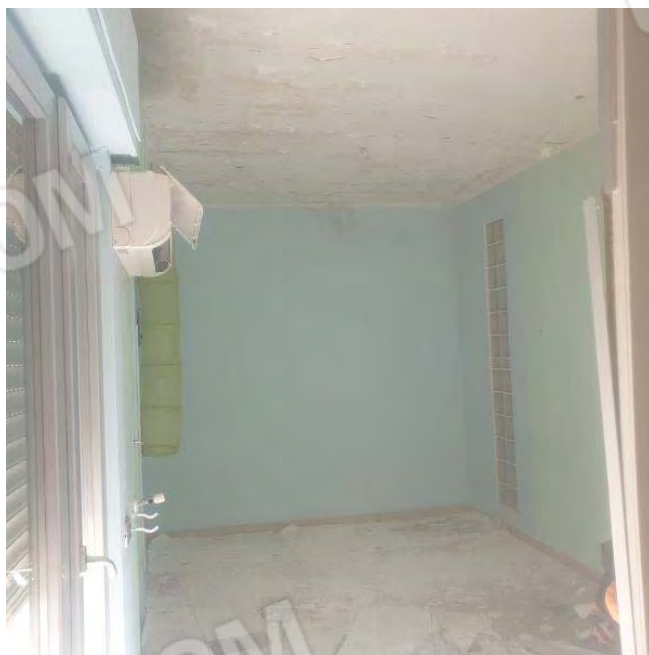
1 PIANO : STANZA CON AFFACCIO SUL CORSO TRIPOLI