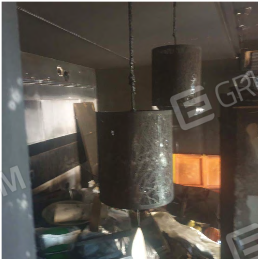
AMBIENTE ORIGINARIAMENTE DESTINATO A CUCINA

DI SEGUITO SONO RIPORTATE LE FOTO DEL PIANO OGGETTO DI INCENDIO EFFETTUATE DURANTE LE PROVE IN PRESENZA DEL TECNICO COMUNALE E DEL DIR TECNICO ED OPERATORI DEL LABORATORIO INCARICATO