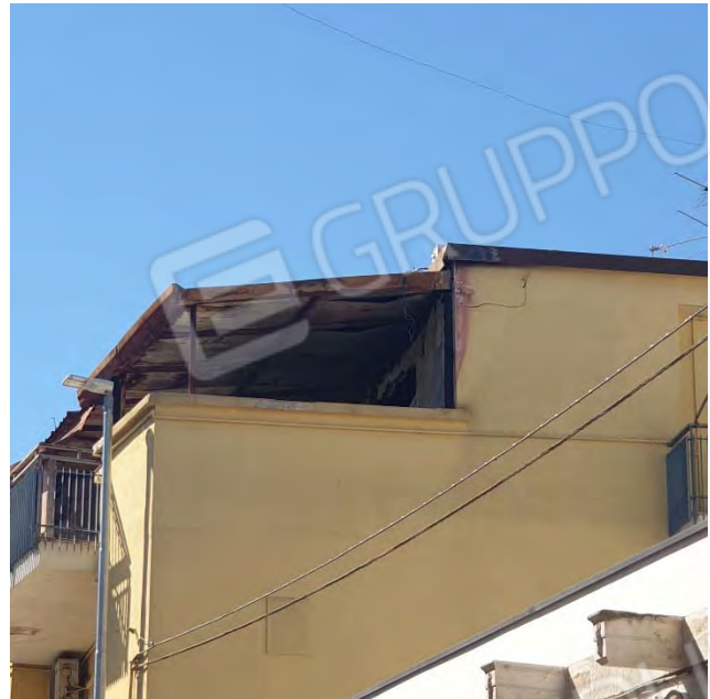
PARTICOLARE ANGOLO CON TETTOIA INCENDIATA