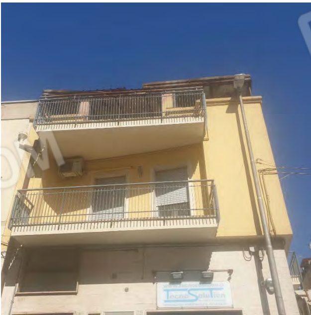
PARTE SUPERIORE DEL PROSPETTO