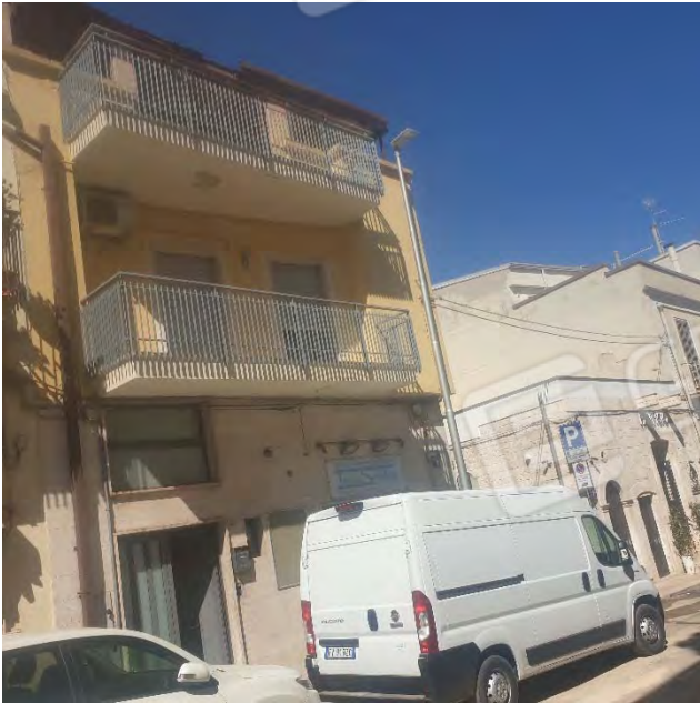
PROSPETTI ESTERNI - VIA TRIPOLI ANGOLO VIA TRIESTE