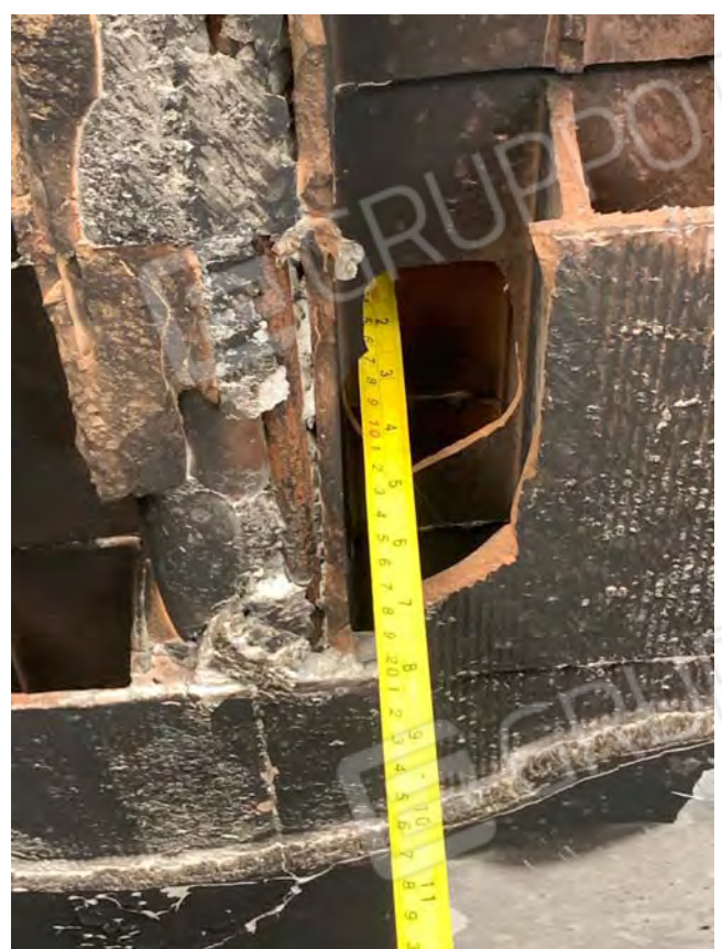
Dettagli del solaio. Degrado strutturale da esposizione ad alte temperature: pignatte esplose