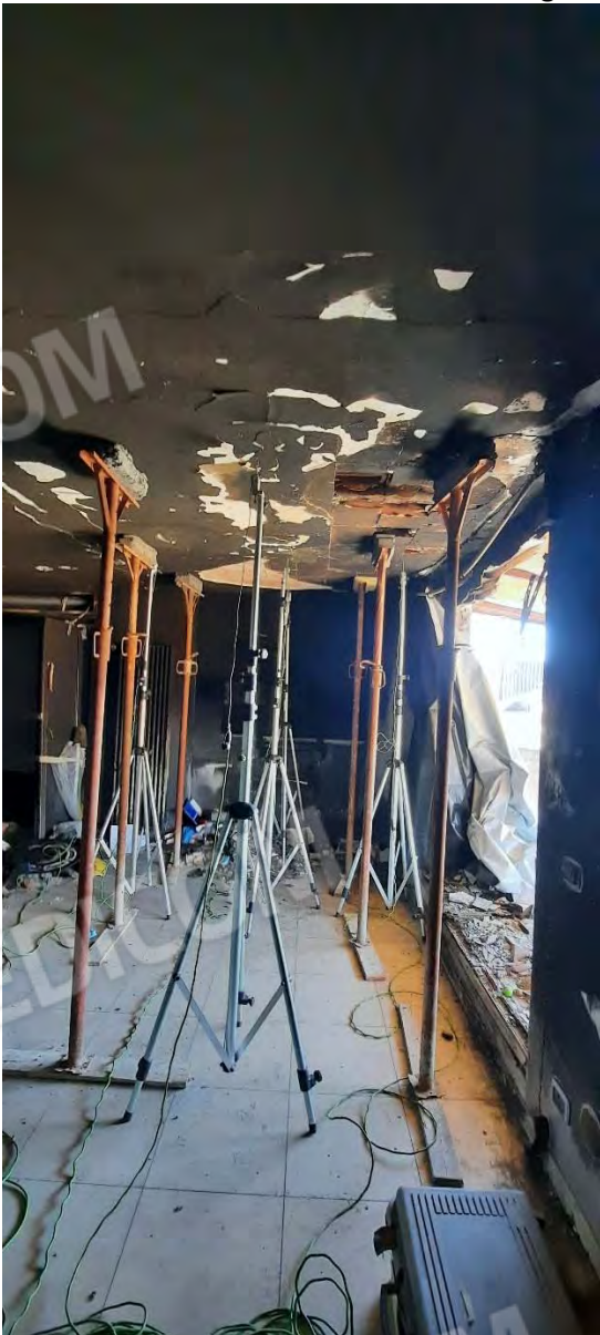
VISTA COMPLESSIVA – SULLA DESTRA IL TERRAZZO