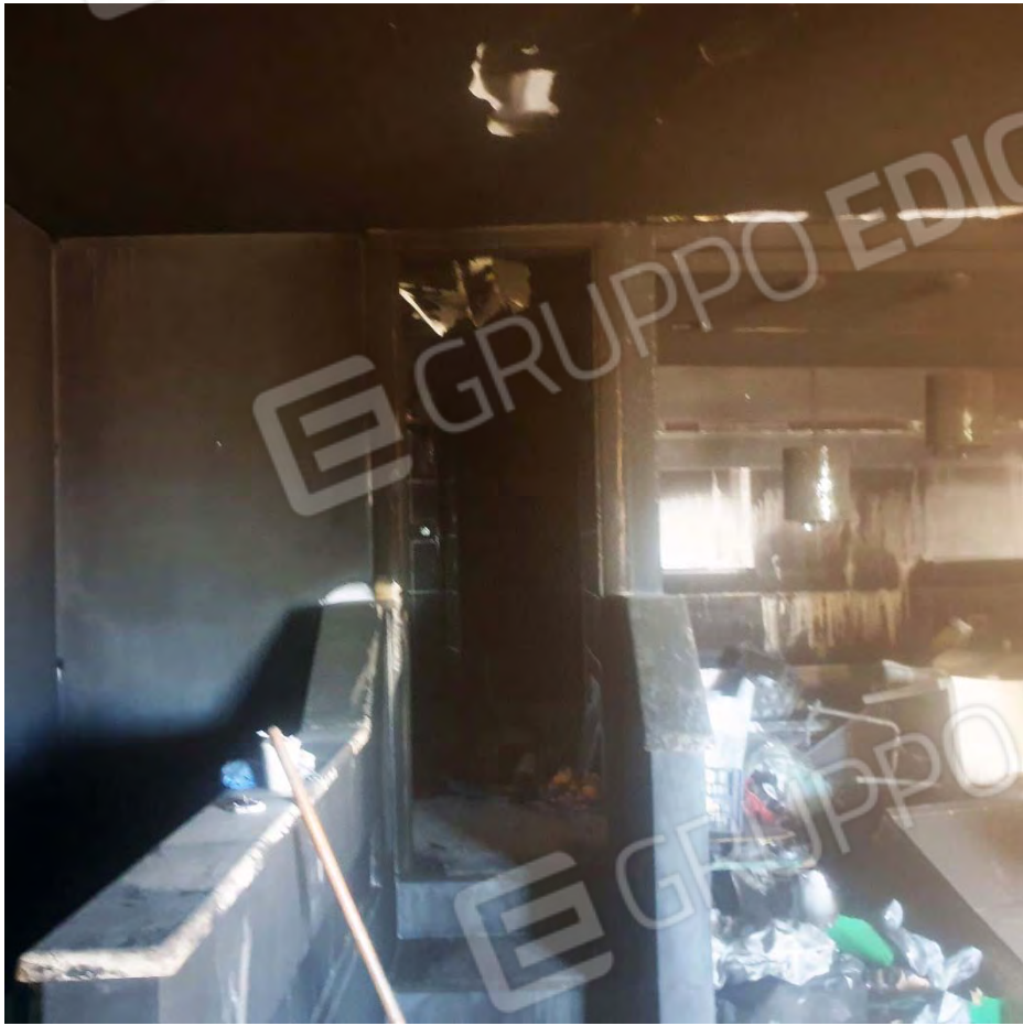
VISTA VERSO IL BAGNO - A DESTRA LA CUCINA