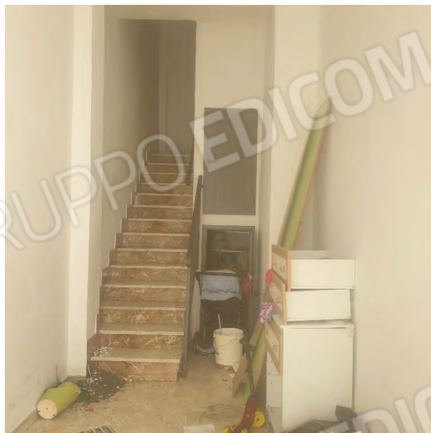
INTERNO CON RAMPA ACCESSO AI PIANI