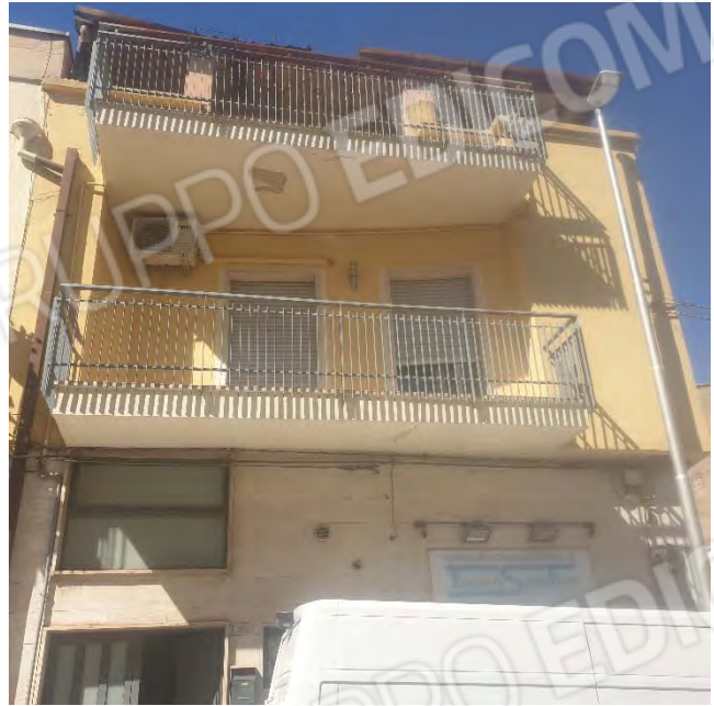
PROSPETTO CORSO TRIPOLI