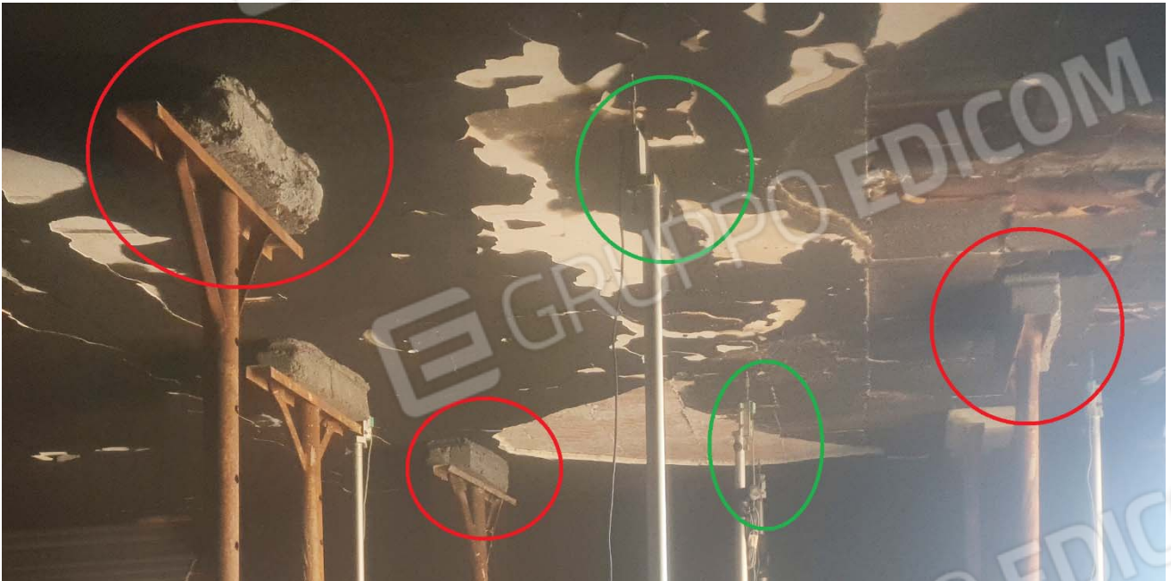
PARTICOLARE DEL SOLAIO OGGETTO DI PROVE SONO EVIDENTI: I PUNTELLI CON LA PARTE SUPERIORE AMMORTIZZATA – segnata in rosso LA STRUMENAZIONE CON I SENSORI – segnata in verde