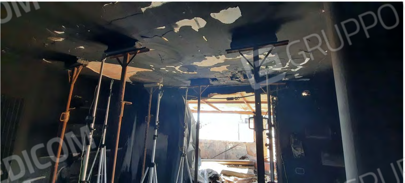
AMBIENTE OGGETTO DI VERIFICHE

E' EVIDENTE LA STRUMETAZIONE ED I PUNTELLI MESSI IN OPERA PER LE PROVE DI CARICO