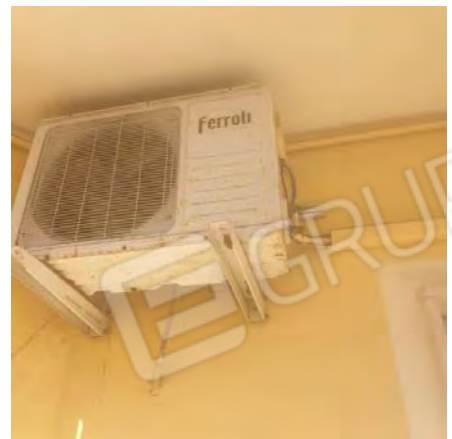
BALCONE SUL CORSO TRIPOLI – IN EVIDENZA : DEGRADO SULLA COPERTURA E UNITA' ESTERNA T.A.