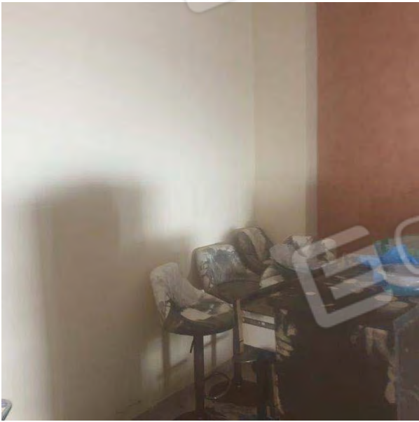
STANZA CON AFFACCIO SULLA VIA TRIESTE