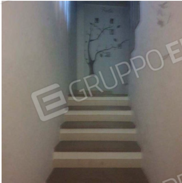
SCALA DI ACCESSO AL SECONDO PIANO OGGETTO DI INCENDIO

DI SEGUITO SONO RIPORTATE LE FOTO DEL PIANO OGGETTO DI INCENDIO EFFETTUATE DURANTE LE PROVE IN PRESENZA DEL TECNICO COMUNALE E DEL DIR TECNICO ED OPERATORI DEL LABORATORIO INCARICATO