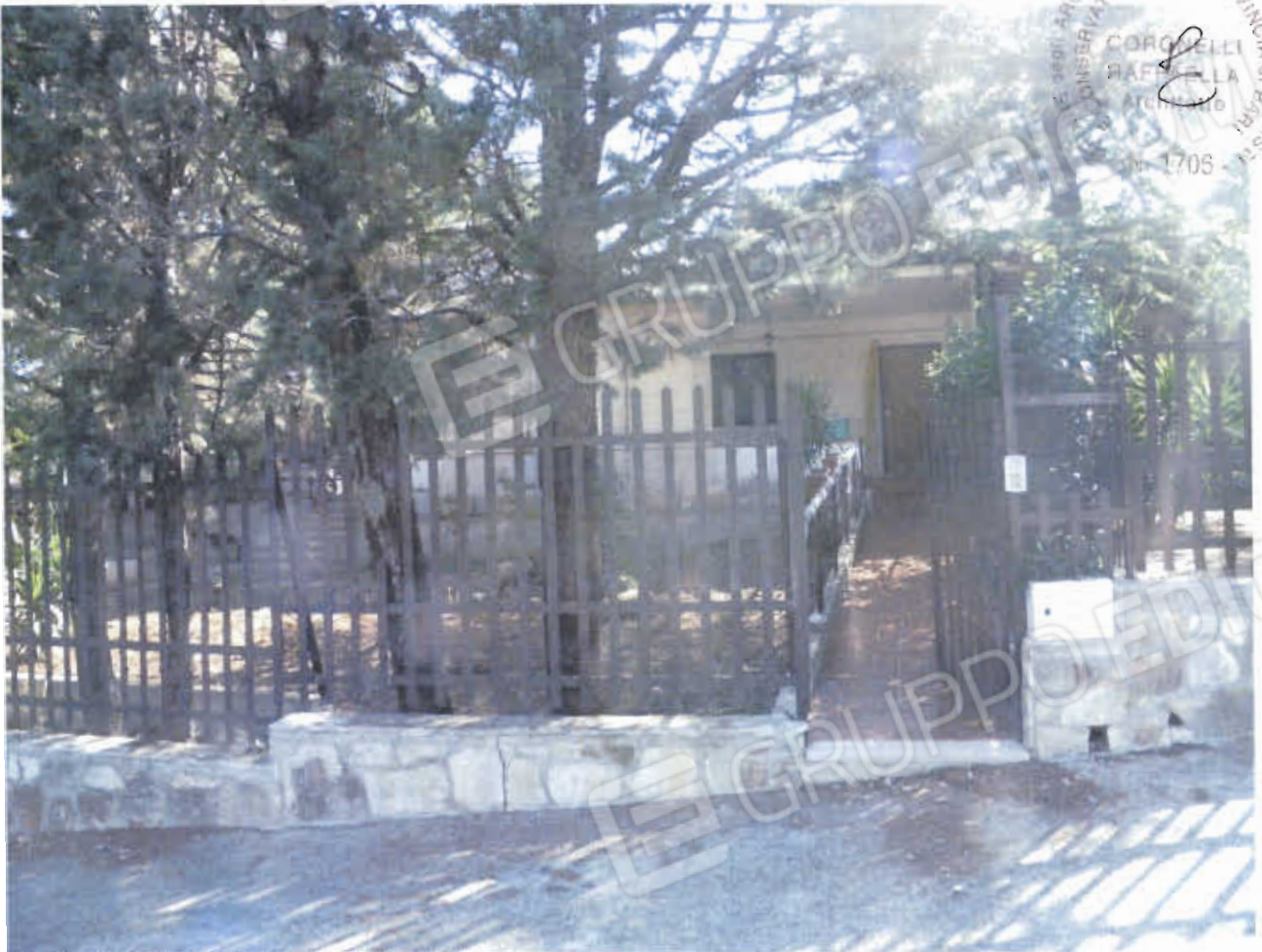
FOTO NN. 5-6: VILLINO IN STIMA VISTO DAL CANCELLO PEDONALE (FOTO IN ALTO); PERCORSO PEDONALE D'ACCESSO AL VILLINO (FOTO IN BASSO)