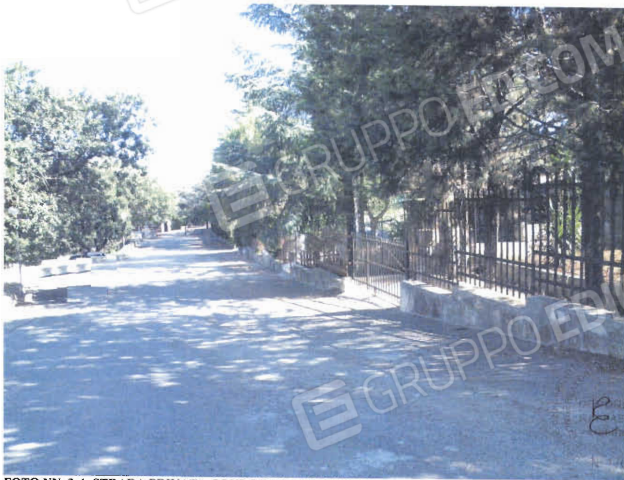
FOTO NN. 3-4: STRADA PRIVATA CONDOMINIALE INTERNA AL COMPLESSO RESIDENZIALE OVE E' POSTO IL VILLINO IN STIMA (FOTO IN ALTO); POSTO AUTO SCOPERTO ANNESSO AL VILLINO OGGETTO DI STIMA VISTO DAL CANCELLO CARRABILE (FOTO IN BASSO).