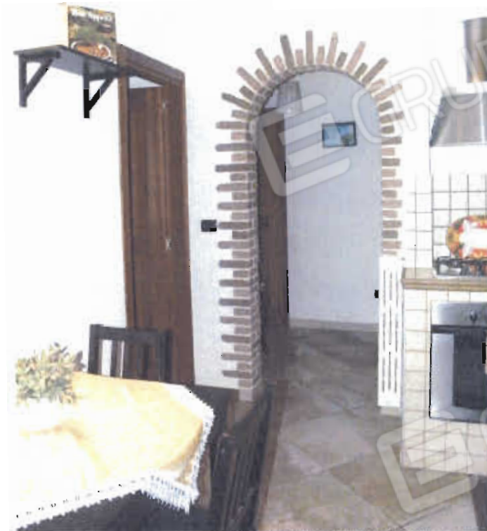
FOTO NN. 15-16: DISIMPEGNO DISTRIBUTORE VISTO DALLA CUCINA-PRANZO (FOTO IN ALTO); RIPOSTIGLIO (FOTO IN BASSO)