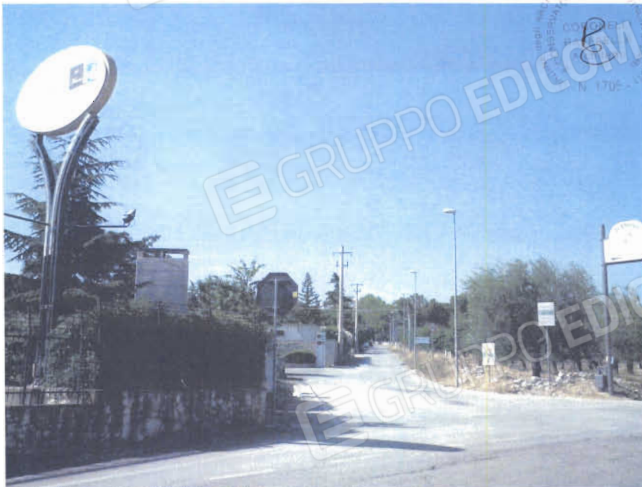
FOTO NN. 1-2: CASSANO DELLE MURGE, ZONA MERCADANTE, NELLE VICINANZE DELLA SALA RICEVIMENTI "IL PORTICO", LOCALITA' TURISTICA OVE E' UBICATO IL VILLINO OGGETTO DI STIMA (FOTO IN ALTO); LOCALITA' LAGOGEMOLO-INCORONATA, RECINZIONE E CANCELLO D'ACCESSO AL COMPLESSO RESIDENZIALE CUI APPARTIENE L'IMMOBILE OGGETTO DI STIMA (FOTO IN BASSO).