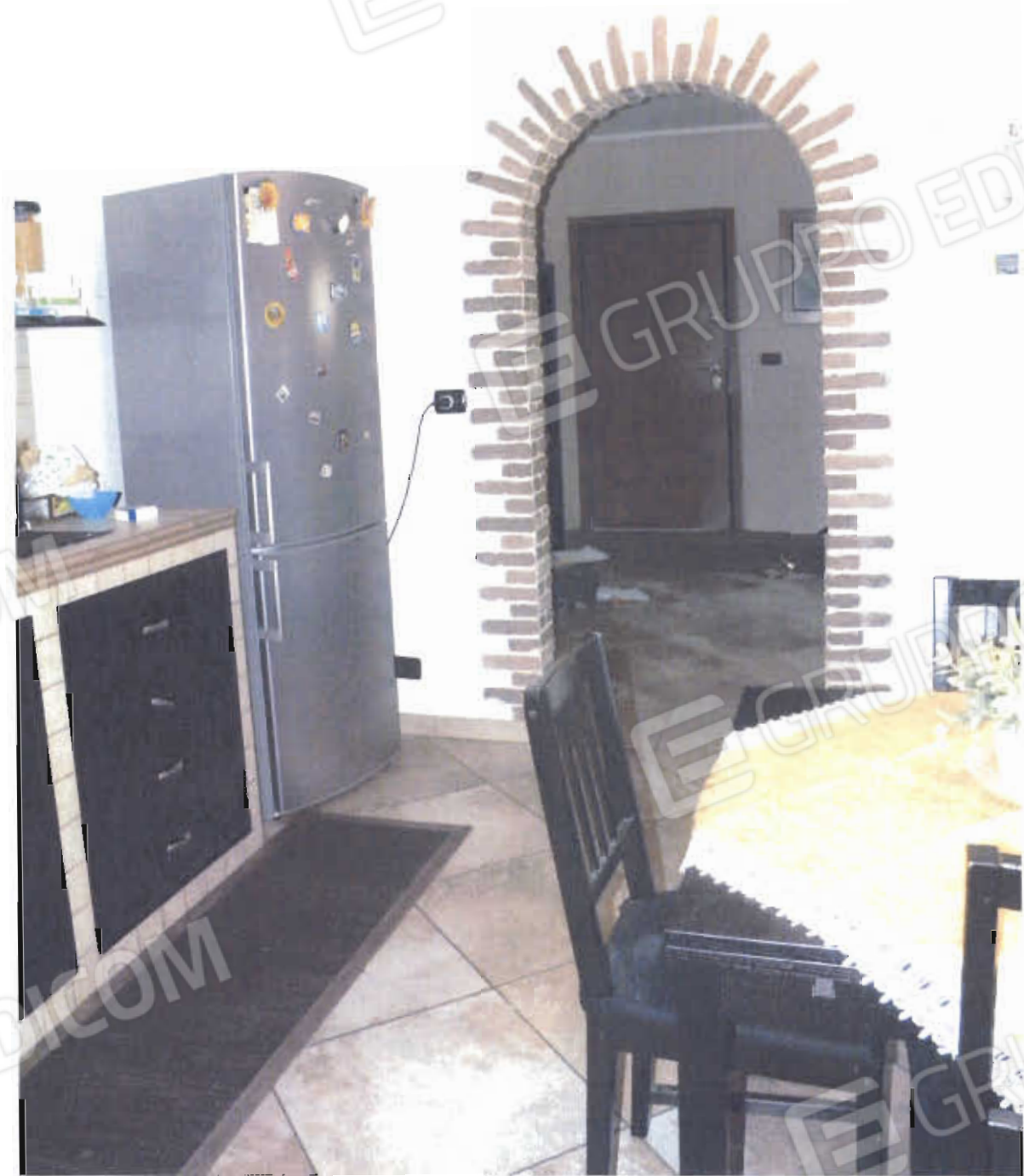
FOTO N. 13: CUCINA-PRANZO (SULLO SFONDO LA PORTA D'ACCESSO AL VILLINO).