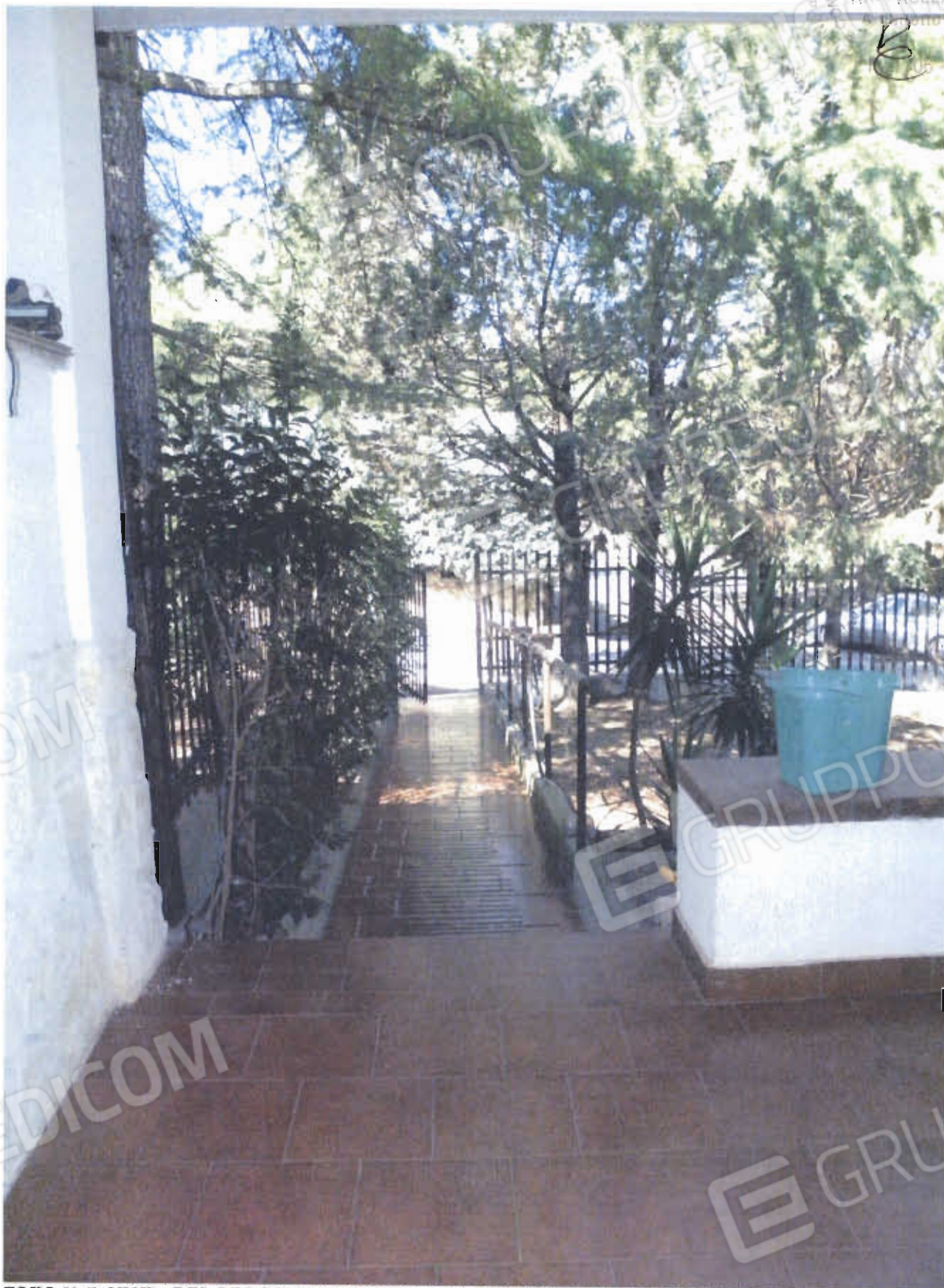
FOTO N. 7: VISTA DEL PERCORSO PEDONALE D'ACCESSO AL VILLINO DALLA VERANDA.