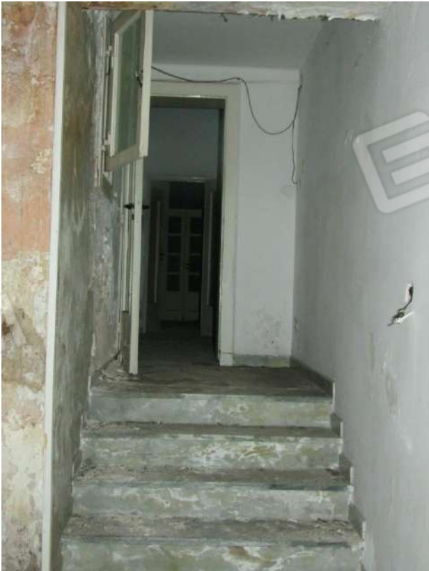
Foto 17 - Vista del disimpegno