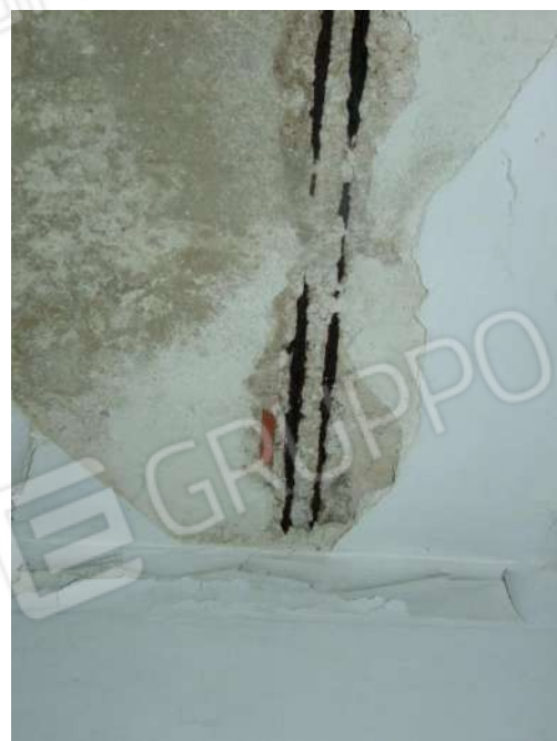
Foto 32 e 33 - Vano 3 - Zone ammalorate con evidenza di ferri di armatura scoperti e arrugginiti