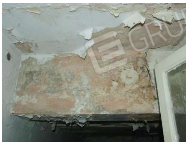
Foto 34 e 35 - Vano 3 e disimpegno - Condizione di degrado degli intonaci