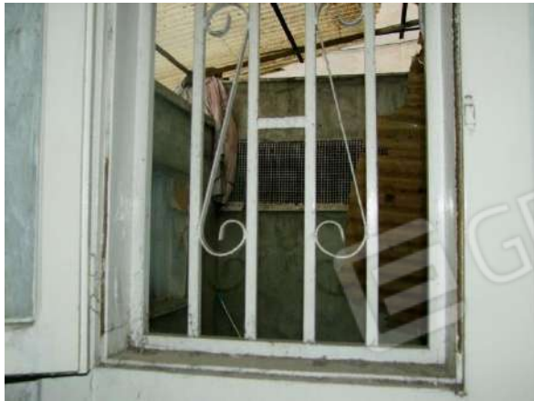
Foto 21 - Vista della finestra nel disimpegno affacciatesi nell'atrio