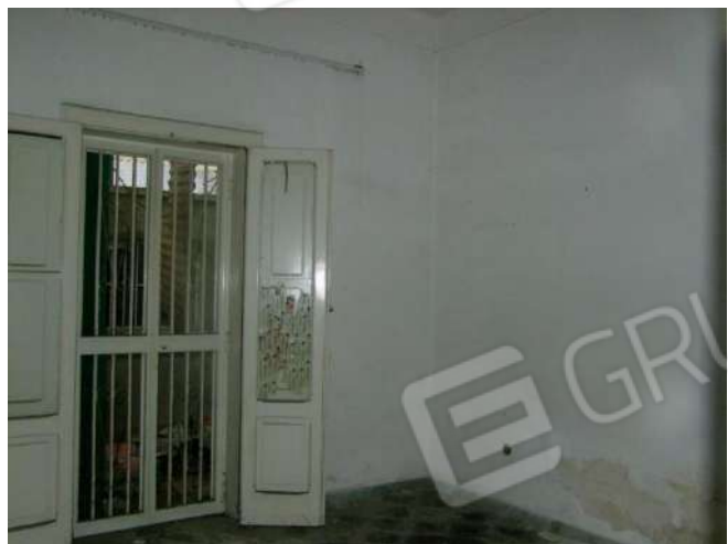
Foto 16 - Vista verso la portafinestra d'accesso all'atrio