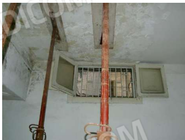
Foto 29 - Particolare infisso esterno