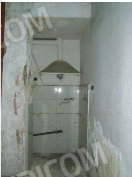
Foto 11 - Vista del cucinino