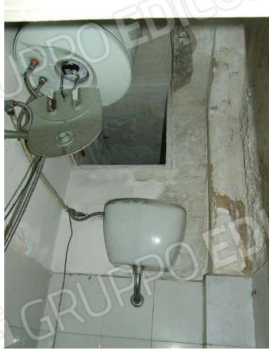
Foto 14 - Vista verso l'apertura sul soppalco del cucinino