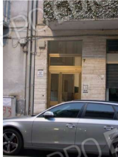
Foto 2 – Portone d'ingresso dell'edificio su via Monsignor Francesco Nitti