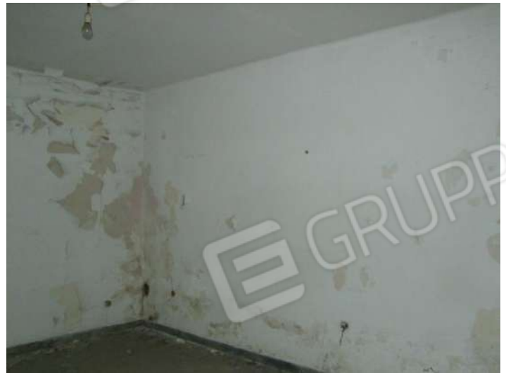
Foto 20 - Vista dell'angolo orientato a Nord-Ovest