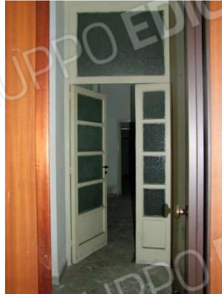
Figura 9 - Vista dall'ingresso verso la vetrata d'accesso al vano 1