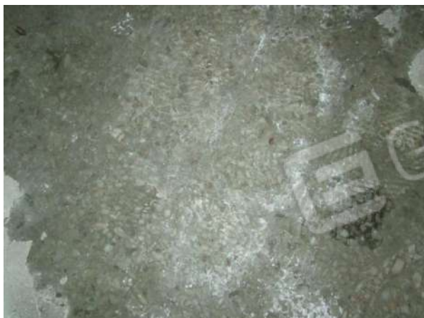
Foto 26 - Particolare pavimentazione