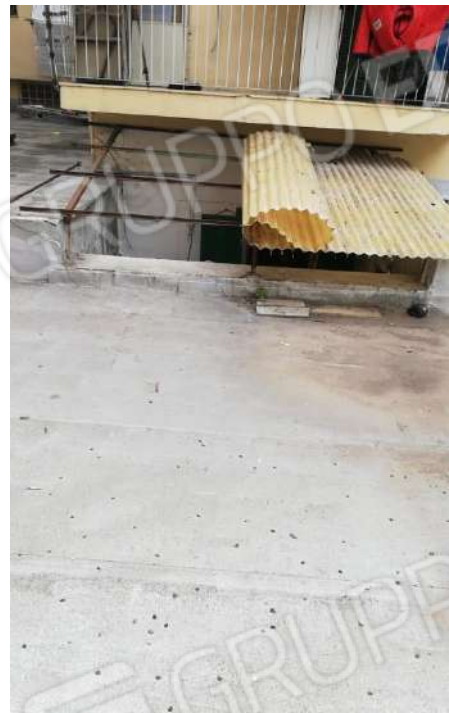
Foto 22 e 23 - Vista dall'alto verso l'atrio e verso il prospetto posteriore dell'edificio. Particolare copertura Vano 3