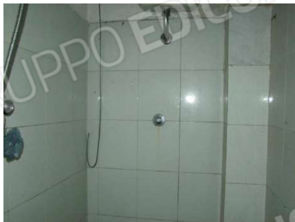
Foto 27 - Particolare rivestimento del bagno