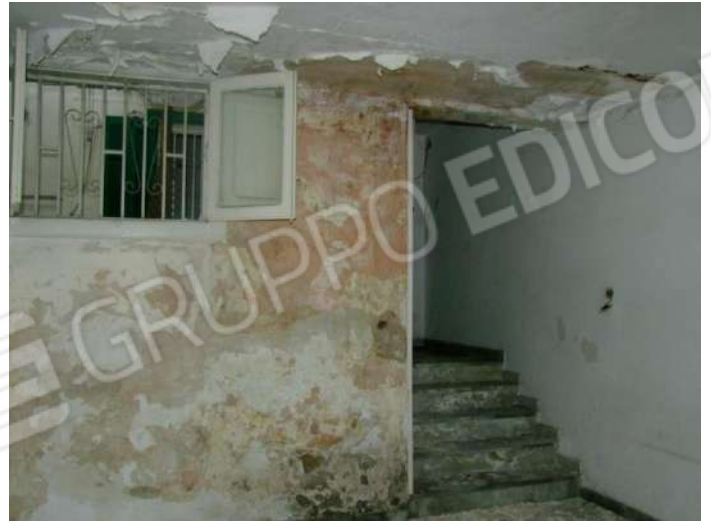
Foto 18 - Vista della scala d'accesso e della parete confinante con l'atrio interno