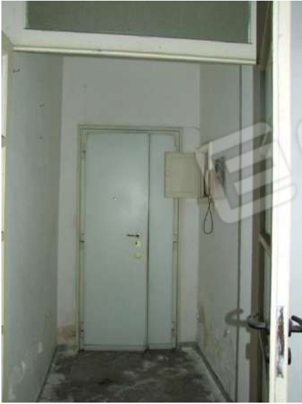
Foto 8 - Vista verso la porta d'ingresso