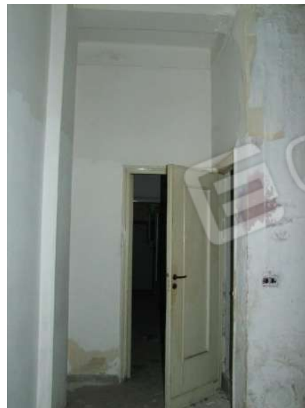
Foto 12 - Vista verso la porta del Vano 2