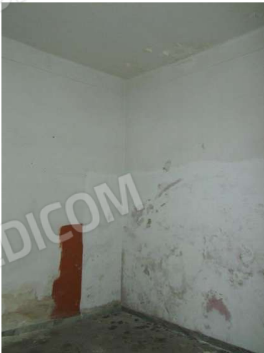
Foto 15 - Vista dell'angolo orientato a Nord-Est