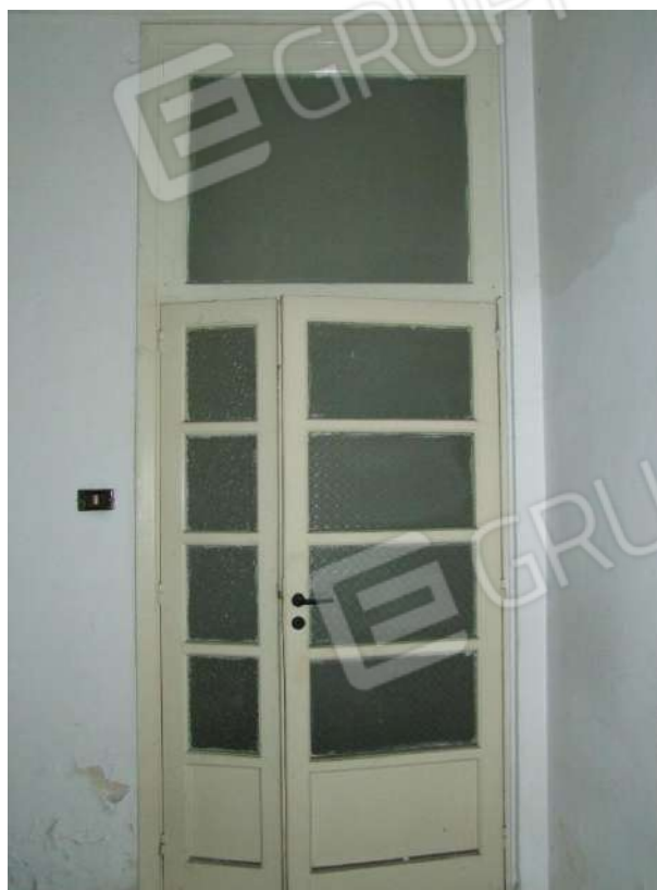
Foto 30 - Particolare infisso interno