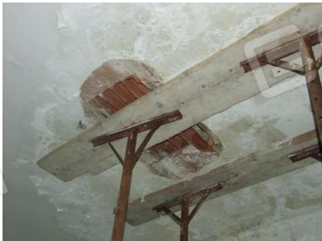
Foto 31 - Vano 1 - Zona ammalorata e puntellata