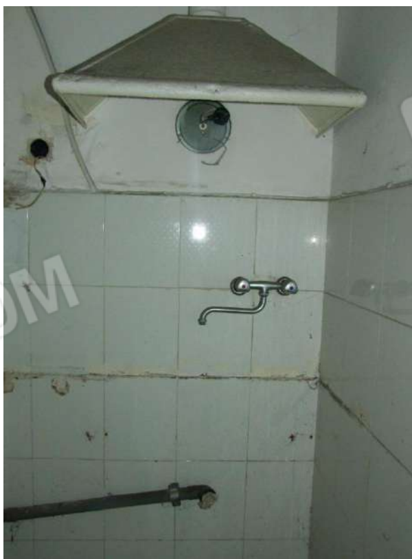
Foto 28 - Particolare rivestimento del cucinino