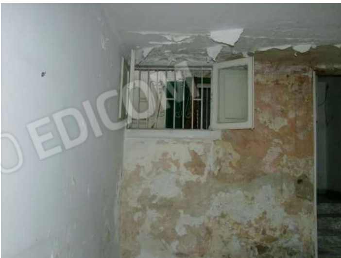
Foto 19 - Vista della parete con la finestra affaccianti sull'atrio interno