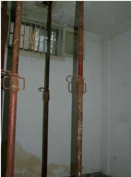
Foto 10 - Vista della parete finestrata orientata a Nord