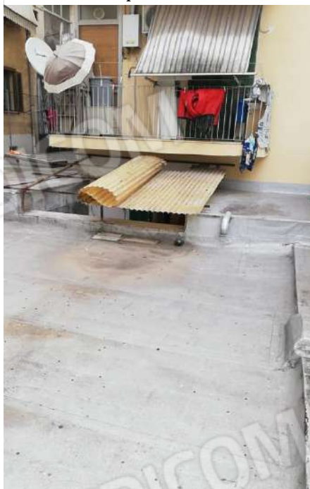
Foto 24 - Vista verso il solaio di copertura del disimpegno