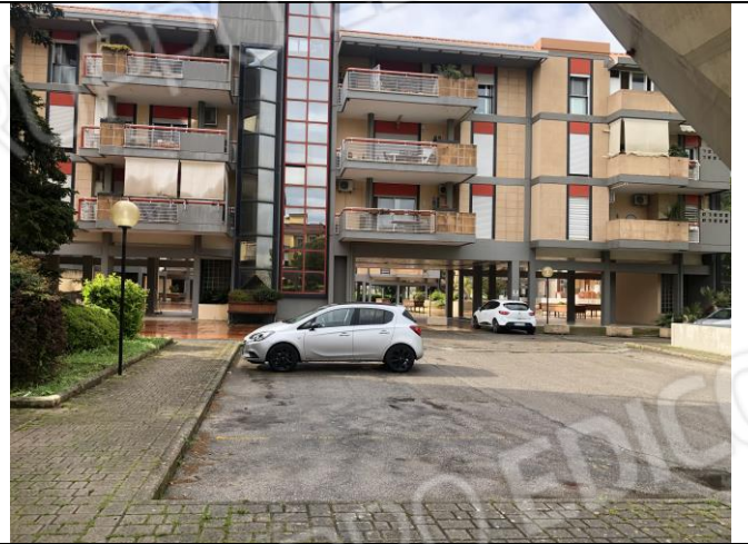
Area a parcheggio del complesso residenziale