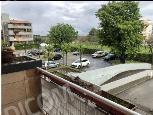
Area pertinenziale del condominio