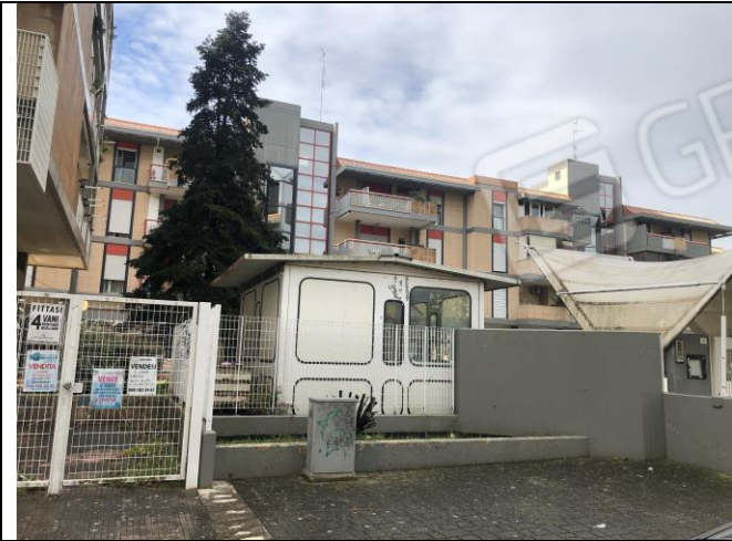
Ingresso del complesso condominiale Parco Eliana