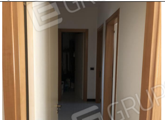
Corridoio di disimpegno