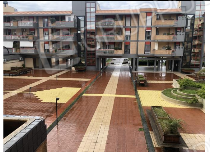
Area pertinenziale del condominio