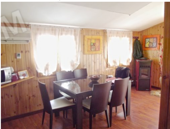
FOTO 10 - Ingresso-Tinello