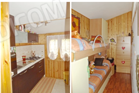
FOTO 11 - Cucinino FOTO 12 - Letto