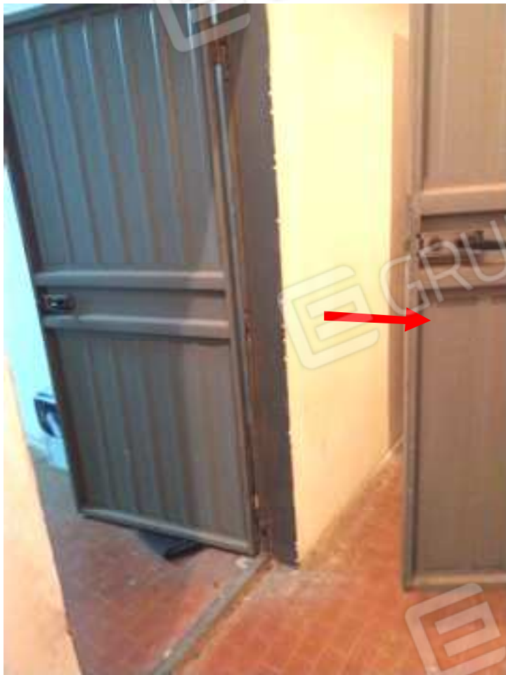
FOTO NN. 77-78: CORRIDOIO D'ACCESSO ALLE CANTINOLE A PIANO SEMINTERRATO (FOTO IN ALTO) ACCESSO ALLA PRIMA CANTINOLA PERTINENZIALE ALL'APPARTAMENTO IN STIMA (FOTO IN BASSO)