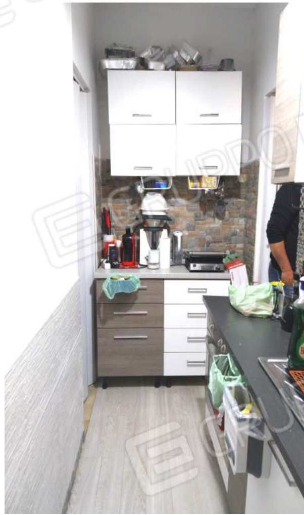
FOTO NN. 22-23-24: VISTE D'INSIEME DEL CUCININO ATTREZZATO DI DEPOSITO/DISPENSA CUI SI ACCEDE DA UNA PORTA A SOFFIETTO(FOTO IN ALTO); DEPOSITO/DOSPENSA (FOTO IN BASSO)