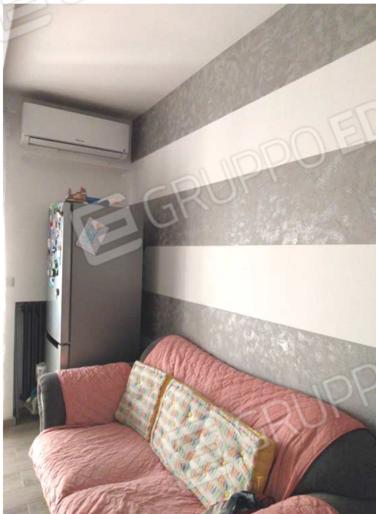
FOTO NN. 20-21: PRANZO: PARTICOLARE (FOTO IN ALTO); CUCININO ATTIGUO AL PRANZO (FOTO IN BASSO)