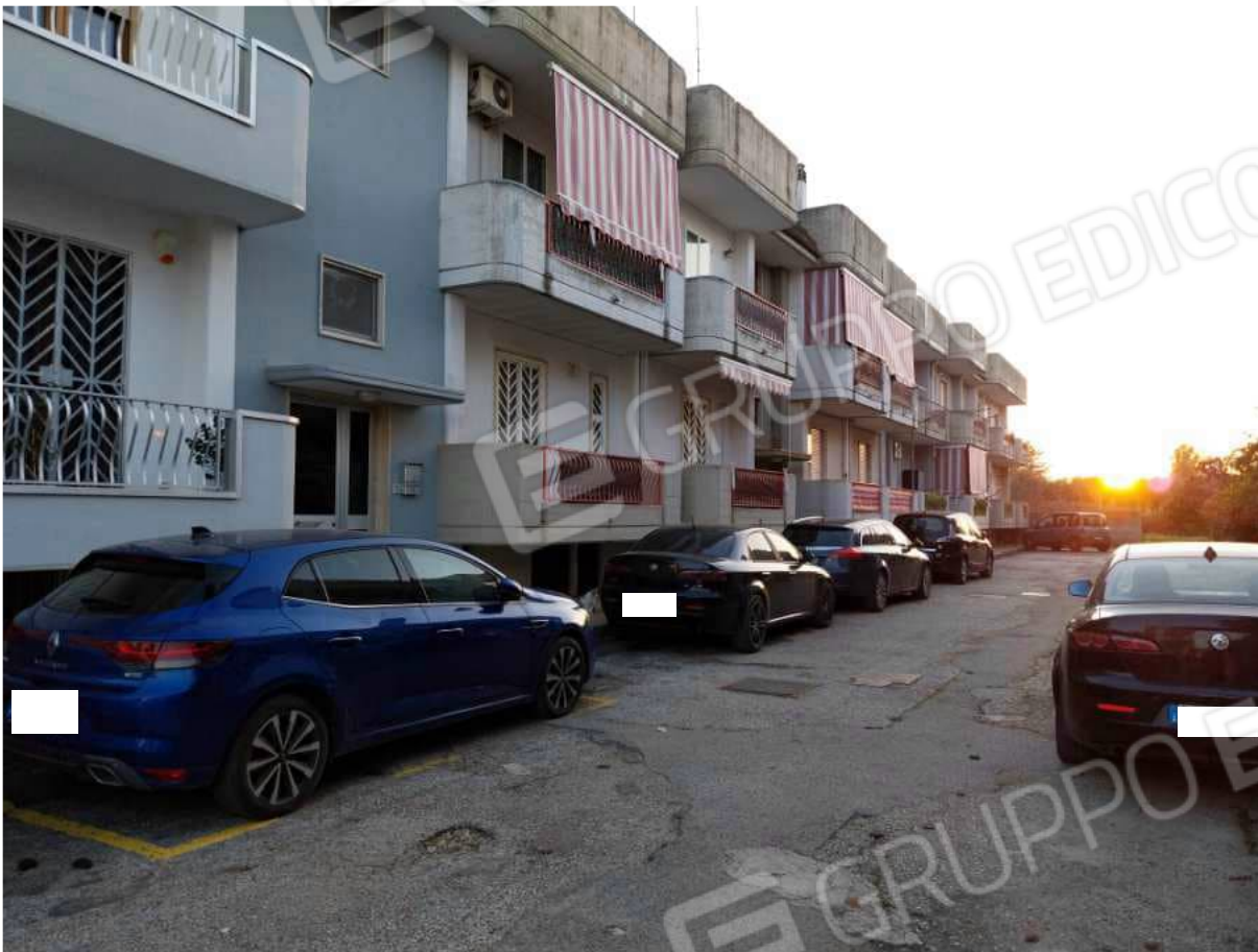
FOTO NN.7-8: STABILE CONDOMINIALE OVE A PRIMO PIANO E' POSTO L'IMMOBILE IN STIMA. PORTONE D'ACCESSO AL CIV.51A