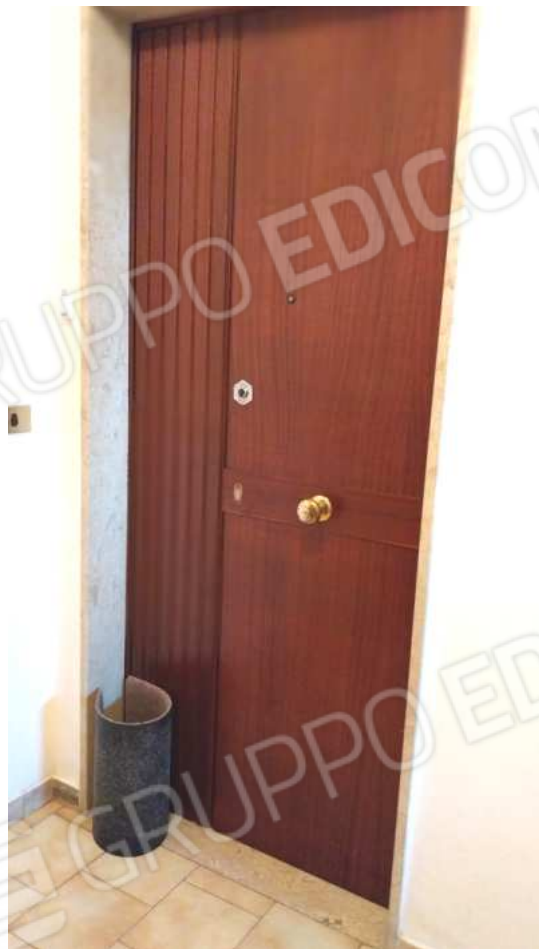
FOTO NN. 11-12-13: PIANEROTTOLO CONDOMINIALE E PORTA D'ACCESSO ALL'IMMOBILE IN STIMA(FOTO IN ALTO); INTERNO DELL'APPARTAMENTO:PORTA D'ACCESSO (FOTO IN BASSO)