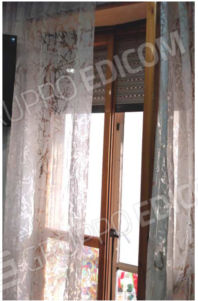
FOTO NN. 25-26-27: PRANZO: PORTAFINESTRA D'AFFACCIO SU BALCONE RETROPOSTO L'IMMOBILE(FOTO IN ALTO); PORTAFINESTRA D'AFFACCIO VISTA DAL BALCONE (FOTO IN BASSO)