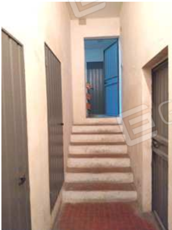
FOTO NN. 75-76: SCALE E CORRIDOIO D'ACCESSO A PIANO SEMTERRATO OVE E' POSTO IL BOX E LE CANTINOLE PERTINENZIALI ALL'APPARTAMENTO IN STIMA (FOTO IN ALTO); A DESTRA LA PORTA D'ACCESSO ALLA PRIMA CANTINOLA (LOCALE CALDAIA) (FOTO IN BASSO)