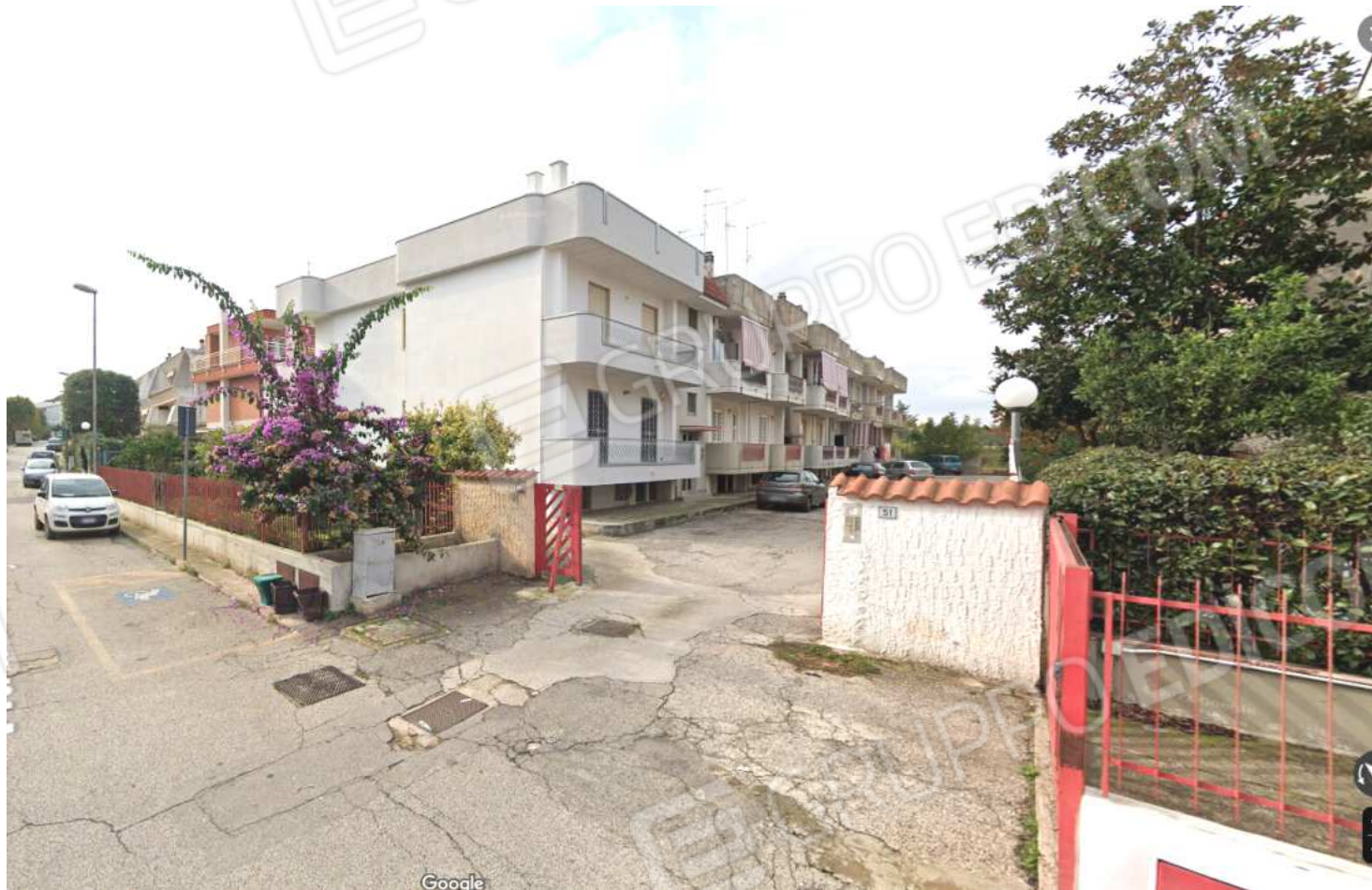
FOTO NN. 3-4: CASSANO DELLE MURGE: VISTE SU VIA XXIV MAGGIO CIV. 51