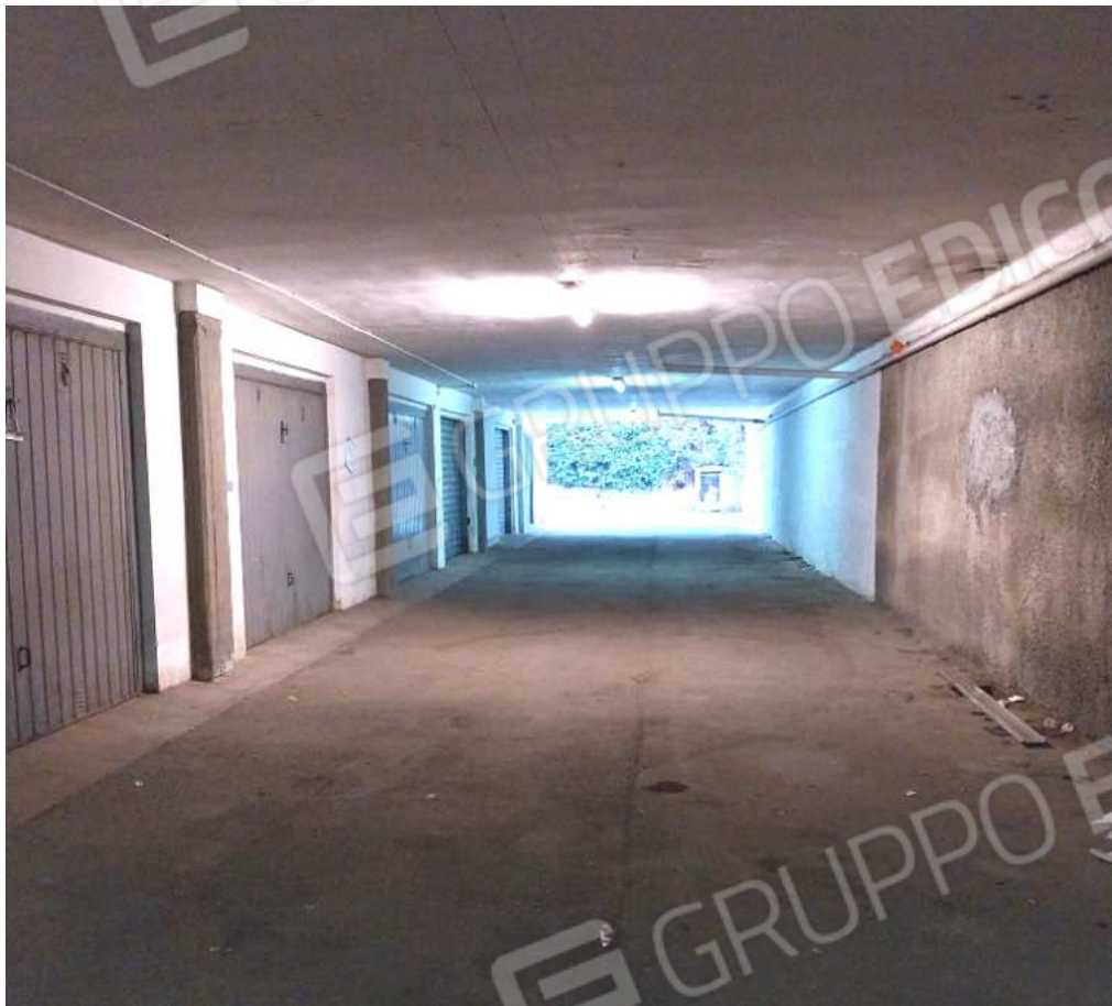
FOTO NN. 69-70: SPAZIO DI MANOVRA. SULLO SFONDO LA RAMPA CARRABILE CONDOMINIALE (FOTO IN ALTO) ACCESSO AL BOX VISTO DALLA RAMPA CARRABILE CONDOMINIALE (FOTO IN BASSO)