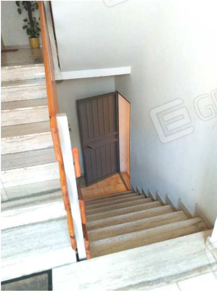
FOTO NN. 56-57: SCALE D'ACCESSO DALL'ANDRONE CONDOMINIALE AL PIANO SEMINTERRATO (FOTO IN ALTO); PORTA D'ACCESSO AL PIANO SEMINTERRATO OVE SONO POSTE LE CANTINOLE E BOX PERTINENZIALI ALL'APPARTAMENTO IN STIMA (FOTO IN BASSO)