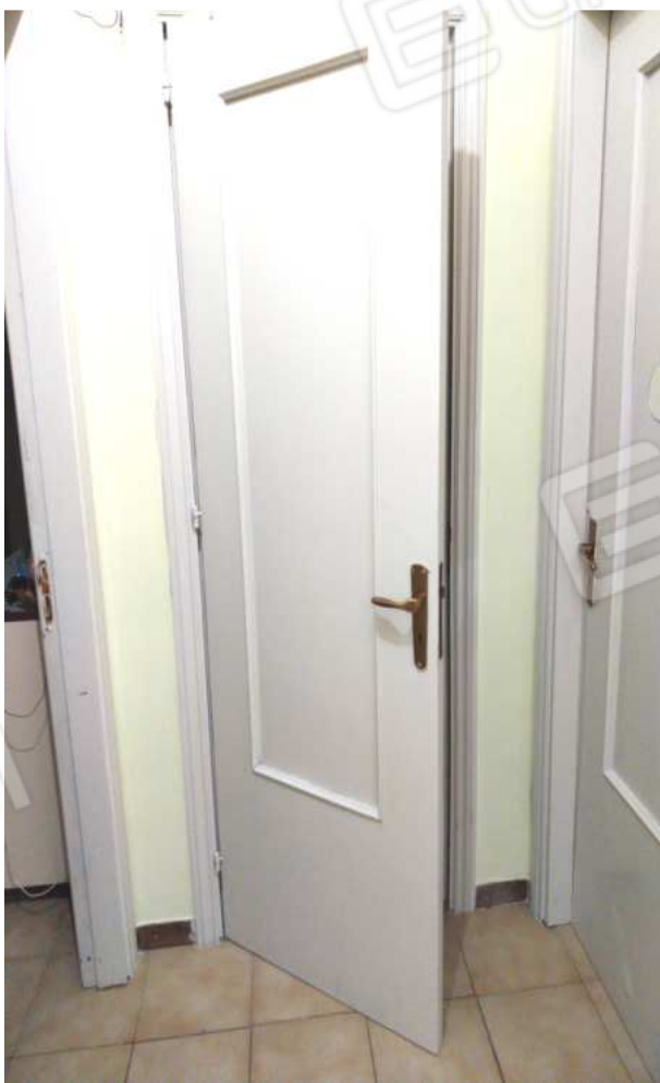
FOTO NN. 43-44: A DESTRA LA PORTA D'ACCESSO ALLA CAMERA DA LETTO FIGLI (FOTO IN ALTO); CAMERA DA LETTO FIGLI (FOTO IN BASSO)