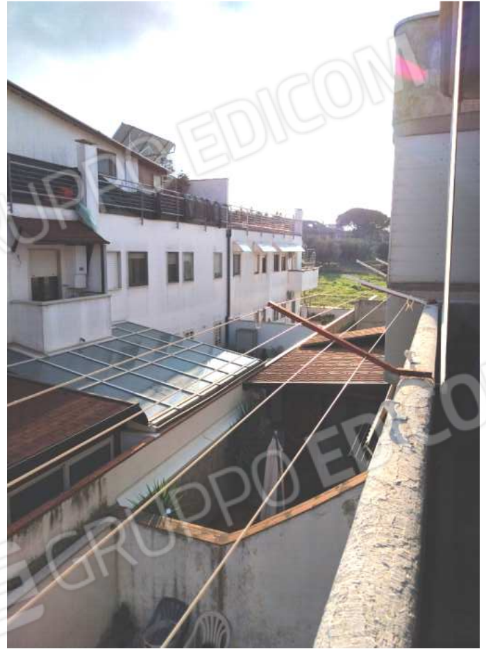
FOTO NN. 28-29-30: BALCONE RETROPOSTO L'IMMOBILE D'AFFACCIO DEL PRANZO, CUCININO, CAMERA DA LETTO MATRIMONIALE ED IL BAGNO A SERVIZIO DELLA CAMERA DA LETTO MATRIMONIALE (FOTO IN ALTO); PARTICOLARE DELLA PAVIMENTAZIONE DEL BALCONE (FOTO IN BASSO)