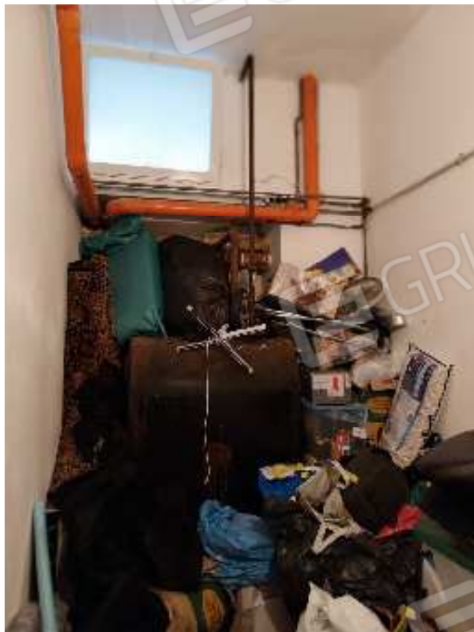
FOTO NN. 79-80: VISTE D'INSIEME DELLA PRIMA CANTINOLA PERTINENZIALE