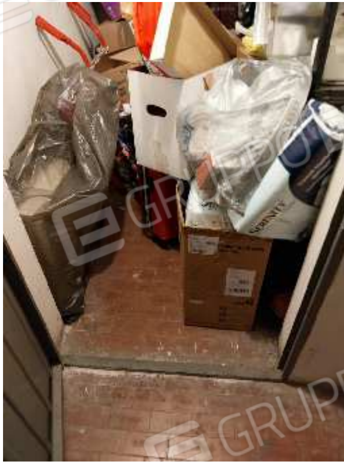
FOTO NN. 84-85-86: TERZA CANTINOLA PERTINENZIALE POSTA A TERMINAZIONE DEL CORRIDOIO ED ADIACENTE ALL'EX LOCALE CALDAIA (FOTO IN ALTO); VISTE D'INSIEME (FOTO IN BASSO)