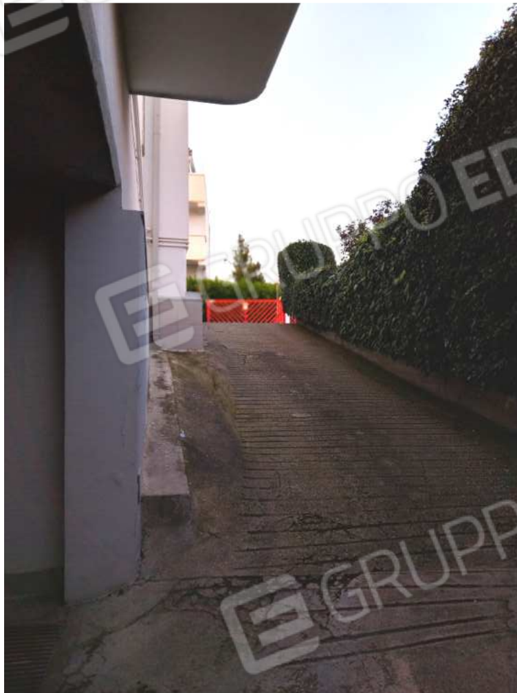
FOTO NN. 71-72: RAMPA CARRABILE CONDOMINIALE VISTA DA A PIANO SEMINTERRATO (FOTO IN ALTO) IMBOCCO DELLA RAMPA CARRABILE CONDOMINIALE POSTO IN PROSSIMITA' DEL CANCESSO D'ACCESSO AL COMPLESSO CONDOMINIALE CUI APPARTIENE L'IMMOBILE IN STIMA (FOTO IN BASSO)