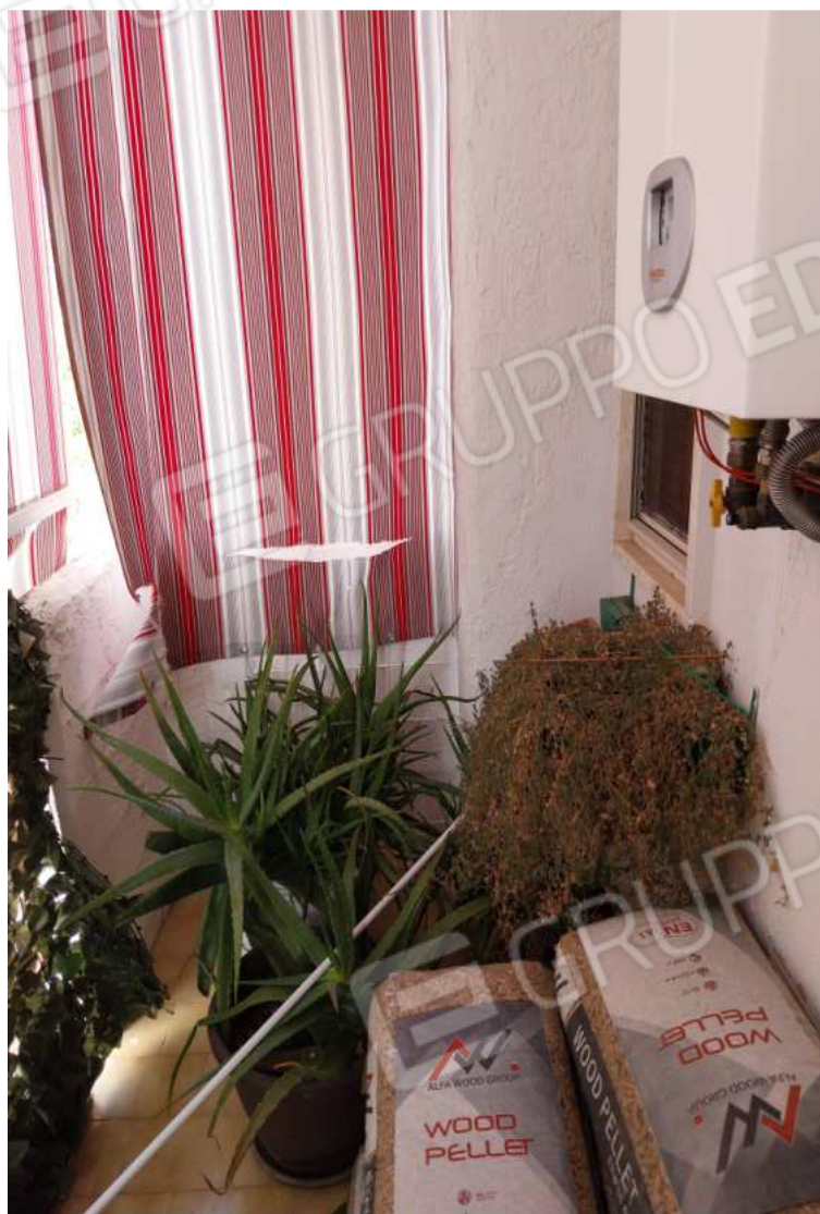
FOTO NN. 49-50: BALCONE PROSPICIENTE IL FRONTE DELL'IMMOBILE, SI NOTA LA FINESTRA D'AFFACCIO DEL BAGNO PADRONALE E LA CALDAIA (FOTO IN ALTO); CALDAIA (FOTO IN BASSO)