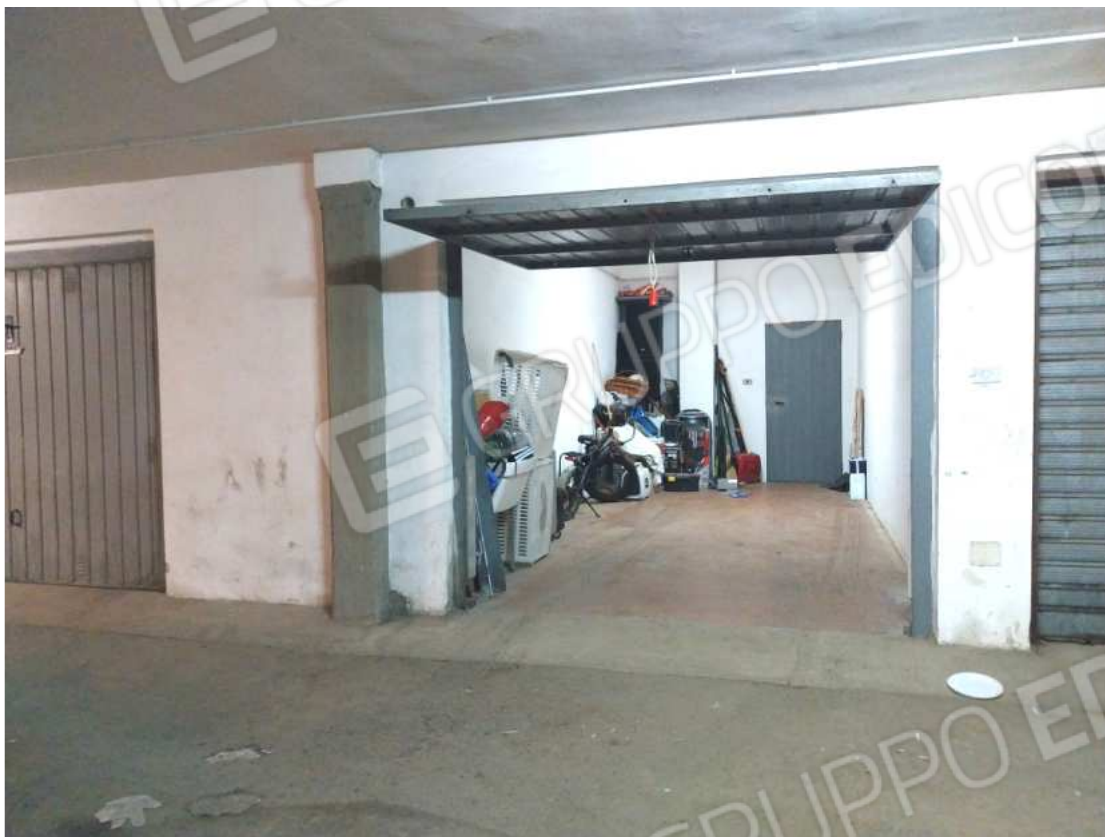
FOTO NN. 67-68: PORTELLONE METALLICO D'ACCESSO AL BOX VISTO DALLO SPAZIO DI MANOVRA CUI SI GIUNGE DALLA RAMPA CARRABILE CONDOMINIALE (FOTO IN ALTO) SPAZIO DI MANOVRA SULLO SFONDO LA RAMPA CARRABILE CONDOMINIALE (FOTO IN BASSO)