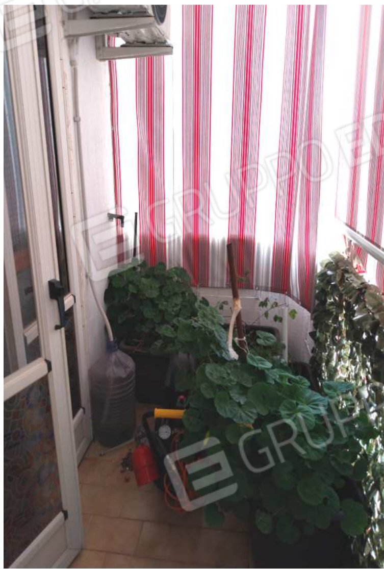
FOTO NN. 47-48: BALCONE PROSPICIENTE LA STRADA PRIVATA D'ACCESSO ALLO STABILE CONDOMINIALE POSTA AL CIV. 51 DI VIA XXIV MAGGIO, D'AFFACCIO ALLA CAMERA DA LETTO FIGLI ED AL BAGNO PADRONALE (FOTO IN ALTO); PARTICOLARE(FOTO IN BASSO)