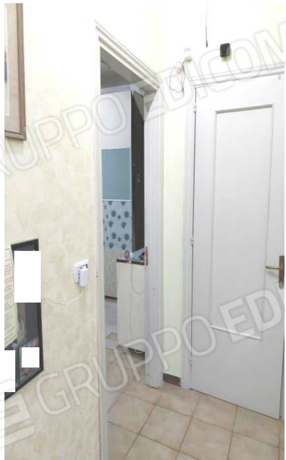
FOTO NN. 33-34-35: DISIMPEGNO ZONA NOTTE VISTO DALLA ZONA GIORNO: A SINISTRA LA PORTA D'ACCESSO ALLA CAMERA DA LETTO MATRIMONIALE (FOTO IN ALTO); CAMERA DA LETTO MATRIMONIALE (FOTO IN BASSO)