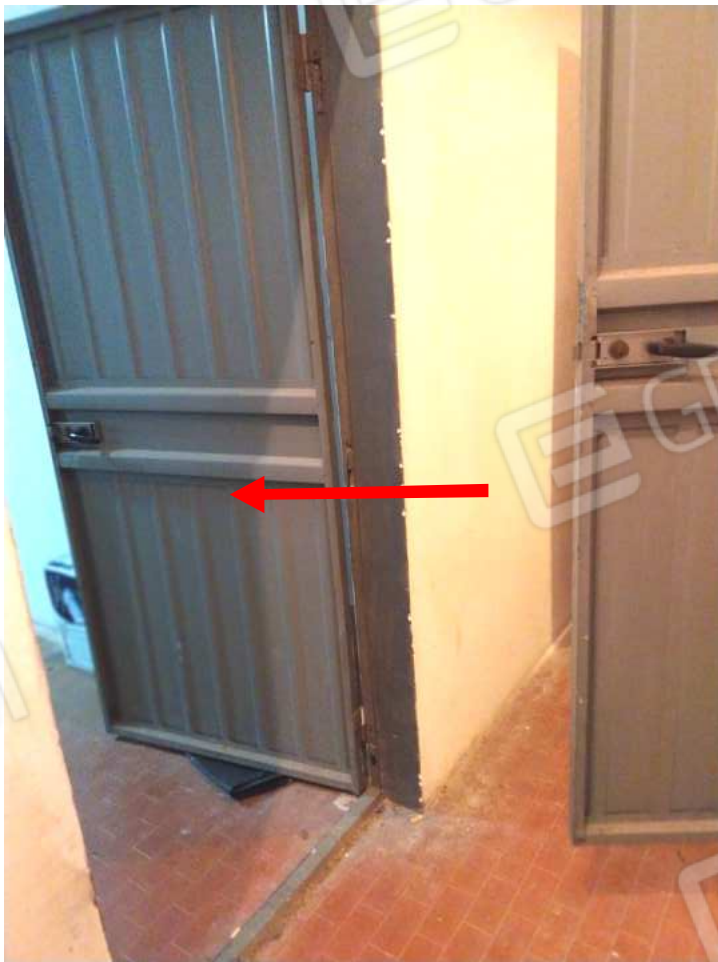
FOTO NN. 61-62-63: A SINISTRA LA PORTA D'ACCESSO AL BOX AUTO PERTINENZIALE ALL'APPARTAMENTO IN STIMA (FOTO IN ALTO) VISTE DEL BOX AUTO, SULLO SFONDO IL PORTELLONE METELICO BASCULANTE (FOTO IN BASSO)