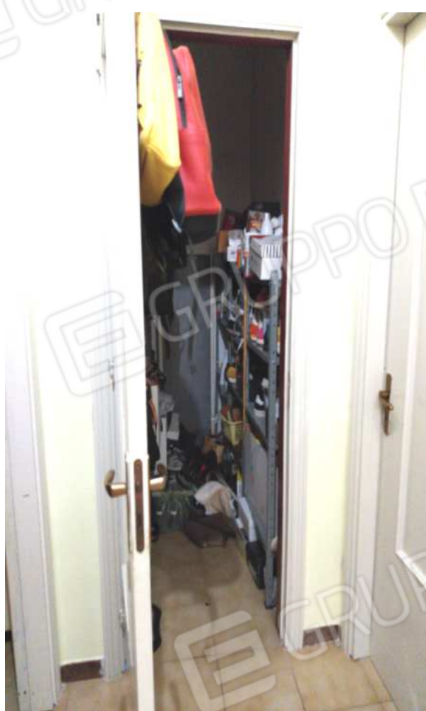
FOTO NN. 41-42: PORTA D'ACCESSO AL RIPOSTIGLIO (FOTO IN ALTO); RIPOSTIGLIO (FOTO IN BASSO)