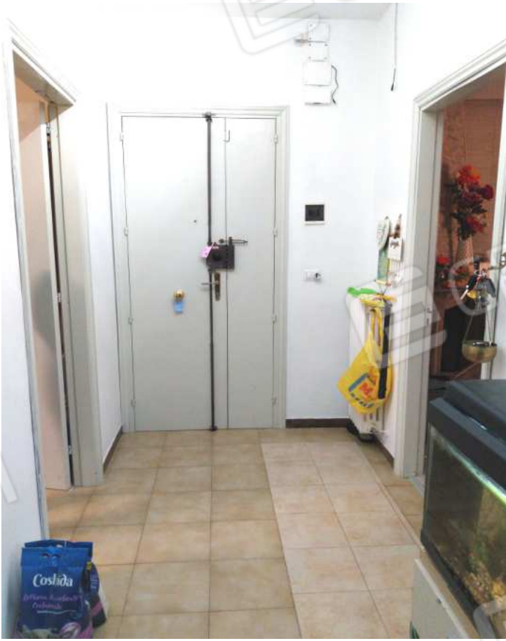
FOTO NN. 14-15: INTERNO DELL'IMMOBILE IN STIMA, DISIMPEGNO DISTRIBUTORE ZONA GIORNO, SULLO SFONDO LA PORTA D'ACCESSO ALL'APPARTAMENTO (FOTO IN ALTO); PRANZO (FOTO IN BASSO)