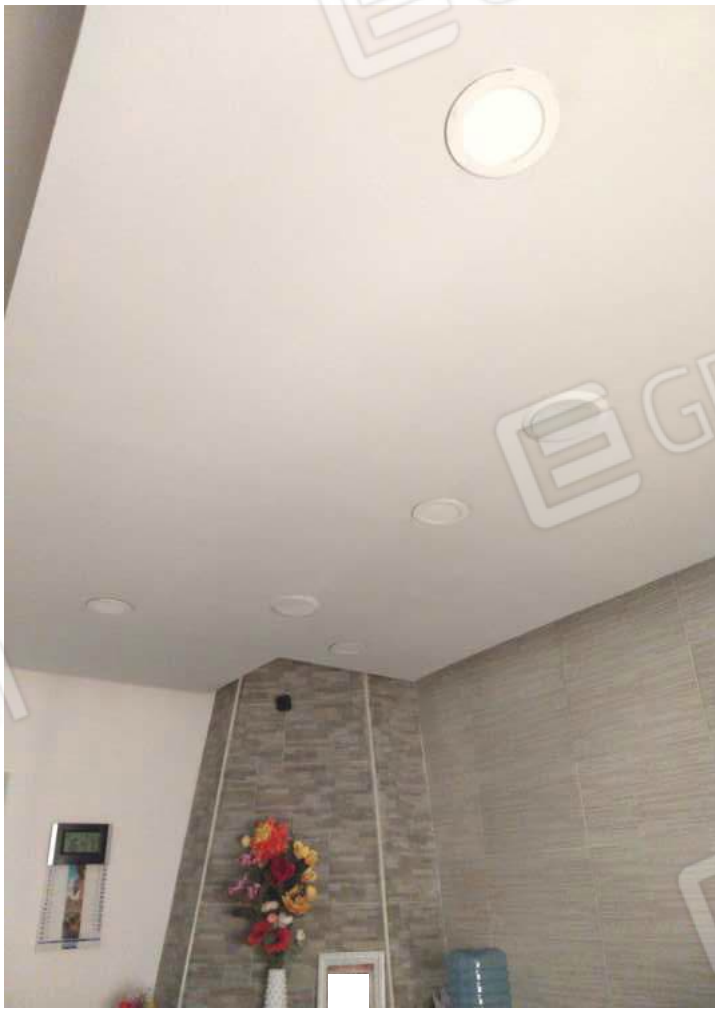
FOTO NN. 18-19: PRANZO: PARTICOLARE DEL CONTROSOFFITTO (FOTO IN ALTO); PARTICOLARE DEL RIVESTIMENTO MURARIO (FOTO IN BASSO)