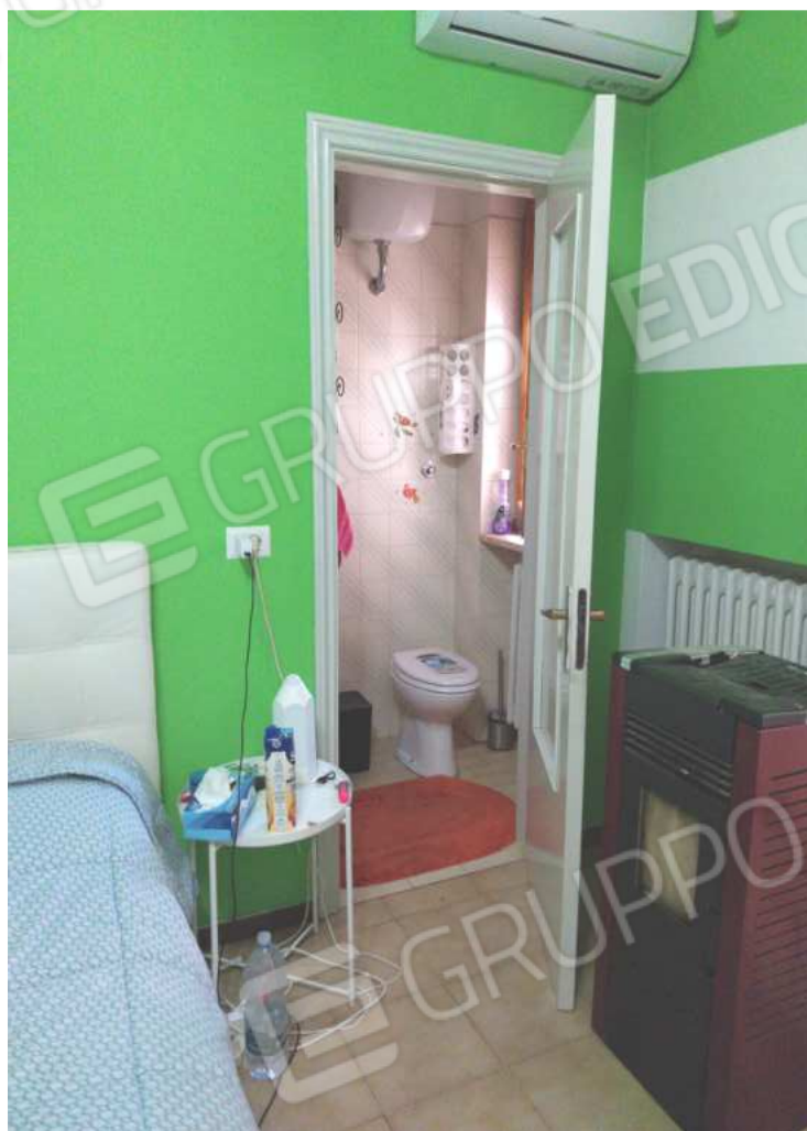
FOTO NN. 38-39-40: PORTA D'ACCESSO AL BAGNO A SERVIZIO DELLA CAMERA DA LETTO MATRIMONIALE (FOTO IN ALTO); VISTE DEL BAGNO A SERVIZIO DELLA CAMERA DA LETTO MATRIMONIALE (FOTO IN BASSO)