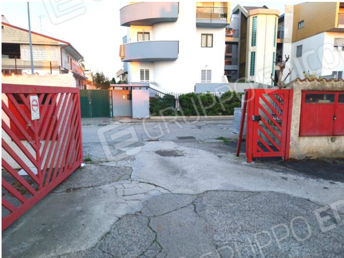
FOTO NN. 73-74: CANCESSO D'ACCESSO AL COMPLESSO RESIDENZIALE CONDOMINIALE CUI APPARTIENE L'IMMOBILE IN STIMA POSTO AL CIV. 51A DI VIA XXIV MAGGIO.