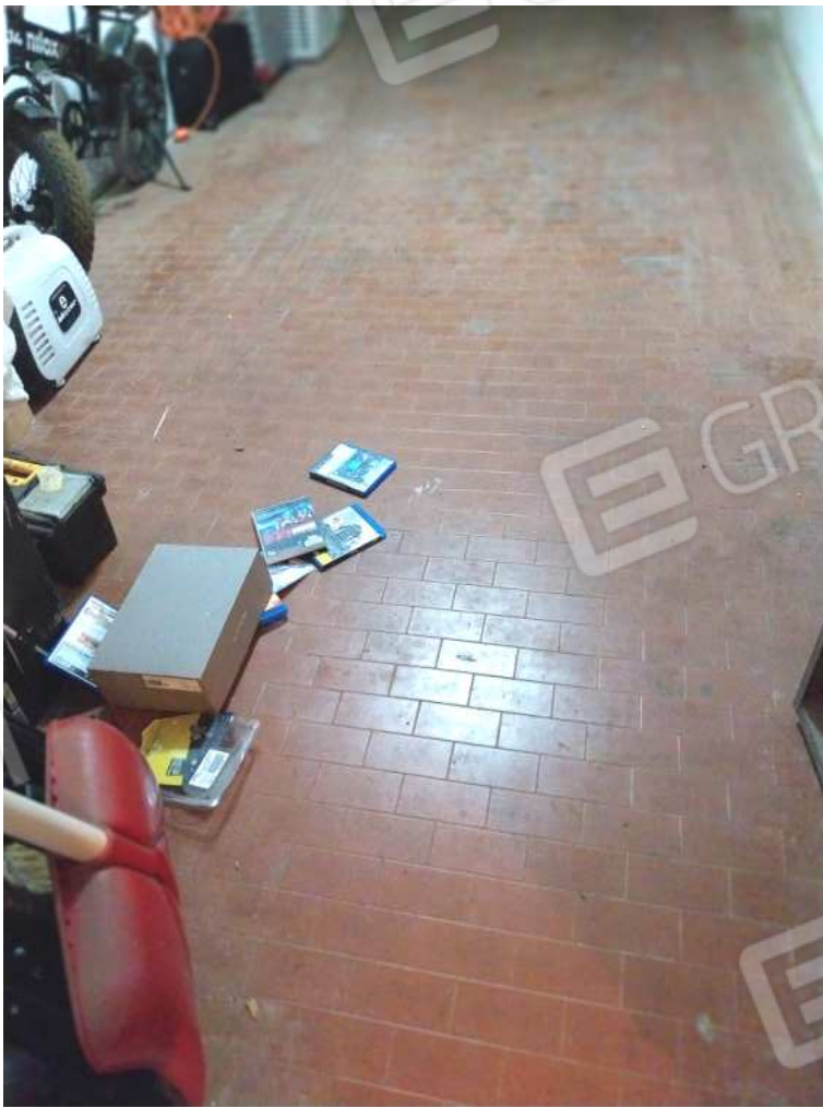
FOTO NN. 64-65-66: BOX PARTICOLARI: PAVIMENTAZIONE (FOTO IN ALTO); PARTICOLARI: FINESTRA, LAVABO (FOTO IN BASSO)