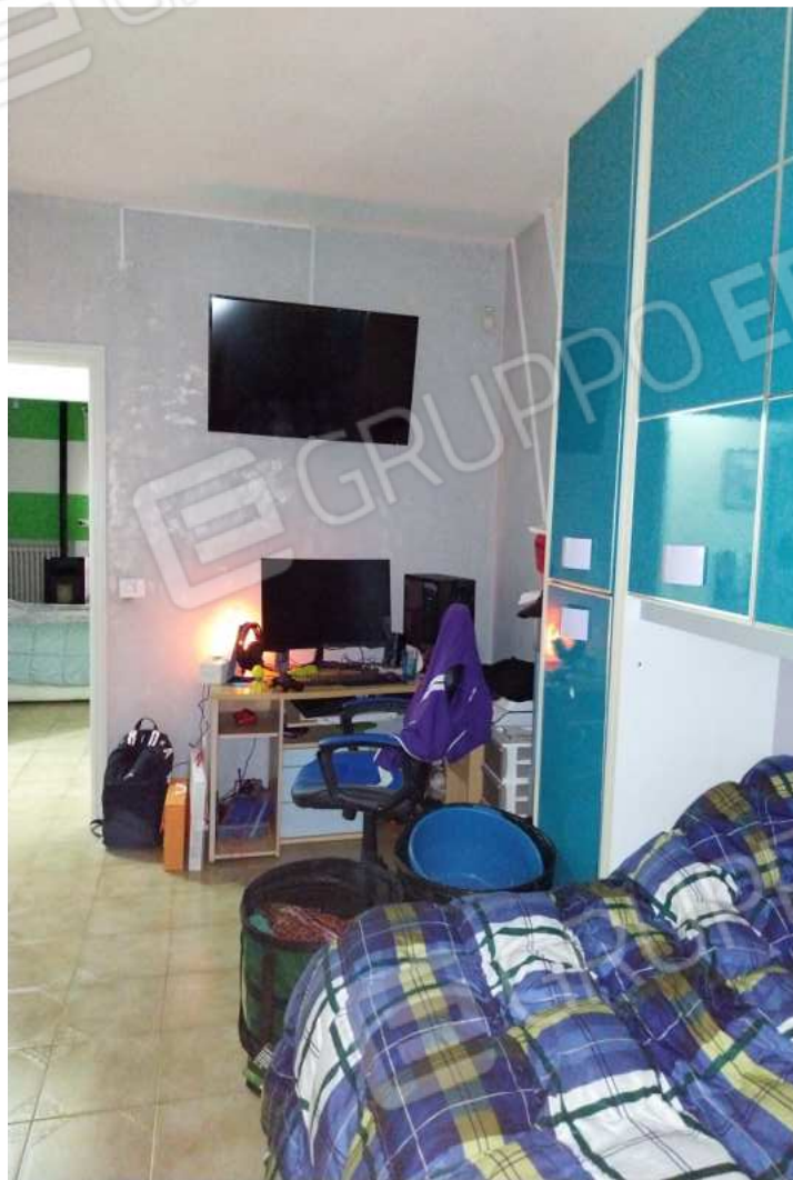
FOTO NN. 45-46: CAMERA DA LETTO FIGLI (FOTO IN ALTO); PARTICOLARE (FOTO IN BASSO)