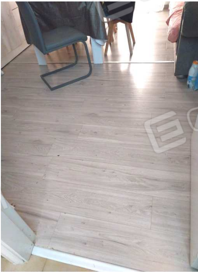
FOTO NN. 16-17: PRANZO: PARTICOLARE (FOTO IN ALTO); PARTICOLARE ANGOLO CAMINO (FOTO IN BASSO)