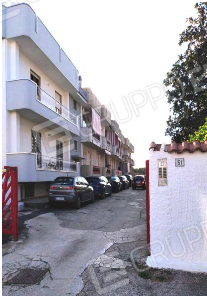
FOTO NN. 5-6: VISTA DELLO STABILE CONDOMINIALE AL CIV. 51A DI VIA XXIV MAGGIO OVE E' POSTO L'IMMOBILE IN STIMA. PORTONE D'ACCESSO ALLO STABILE CONDOMINIALE