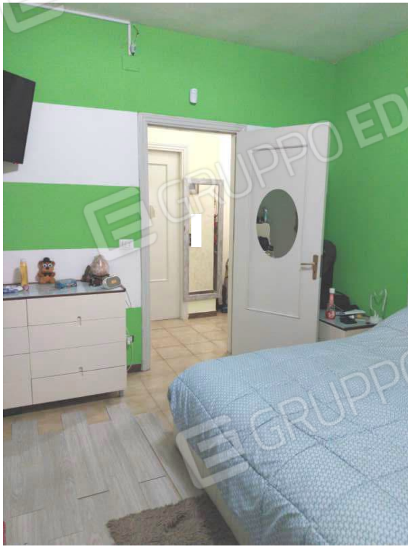
FOTO NN. 36-37: VISTE DELLA CAMERA DA LETTO MATRIMONIALE, SULLO SFONDO LA PORTA D'ACCESSO E IL DISIMPEGNO DISTRIBUTORE