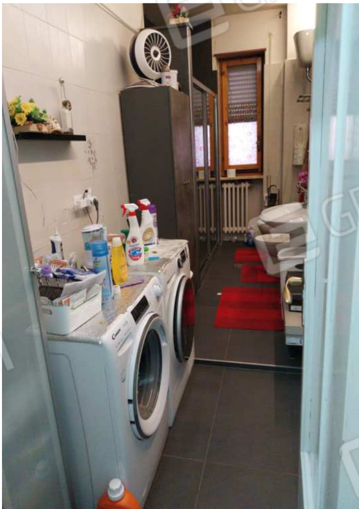
FOTO NN. 51-52-53: VISTE D'INSIEME DEL BAGNO PADRONALE (FOTO IN ALTO); PARTICOLARI (FOTO IN BASSO)