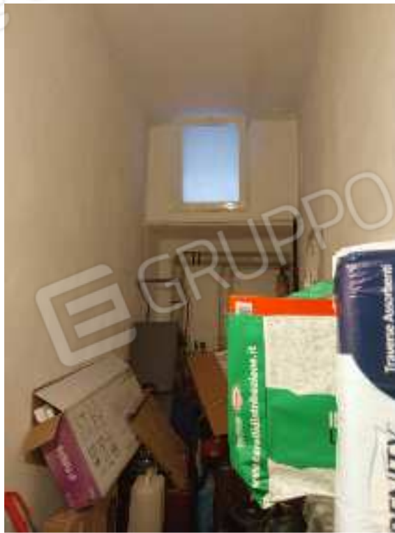
FOTO NN. 81-82-83: VISTE D'INSIEME DELLA SECONDA CANTINOLA PERTINENZIALE (GIA' LOCALE CALDAIA)