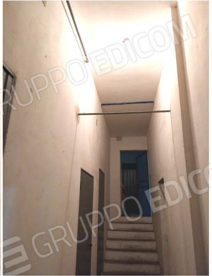
FOTO NN. 58-59-60: SCALE E CORRIDOIO D'ACCESSO ALLE CANTINOLE E BOX PERTINENZIALI ALL'APPARTAMENTO IN STIMA A PIANO SEMTERRATO (FOTO IN ALTO); A SINISTRA LA PORTA D'ACCESSO AL BOX (FOTO IN BASSO)