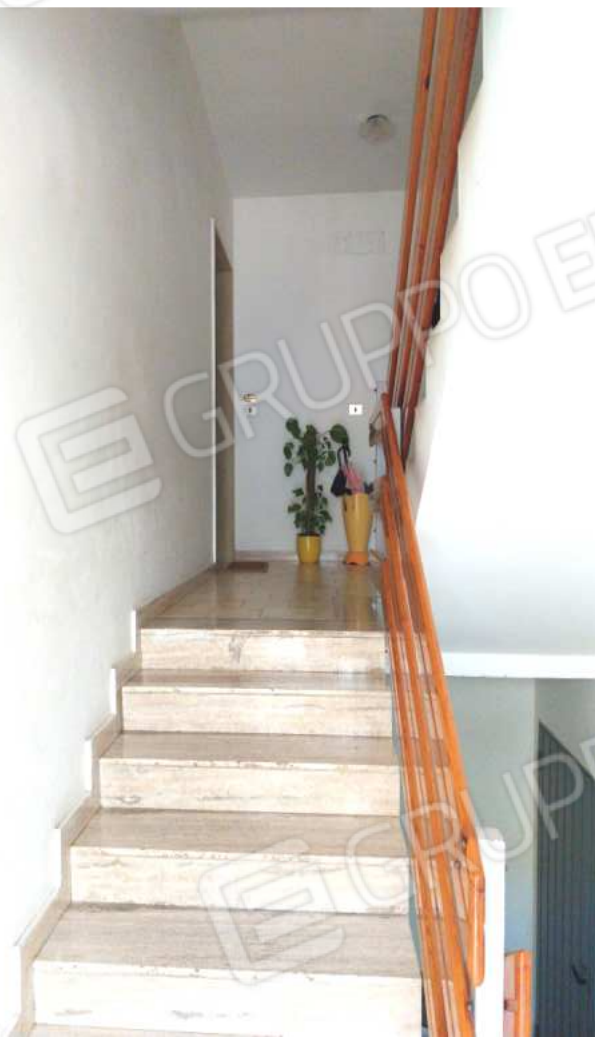
FOTO NN. 9-10: ANDRONE VANO SCALA D'ACCESSO ALLO STABILE CONDOMINIALE CUI APPARTIENE L'IMMOBILE IN STIMA. SULLA DESTRA, RAMPA SCALE D'ACCESSO ALLE CANTINOLE ED AL BOX AUTO.