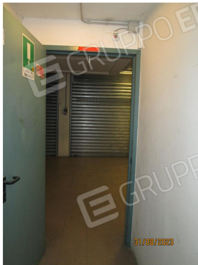
Foto n. 12 e n. 13: Accesso interno al piano interrato dal fabbricato di Via Manfredonia 14/C