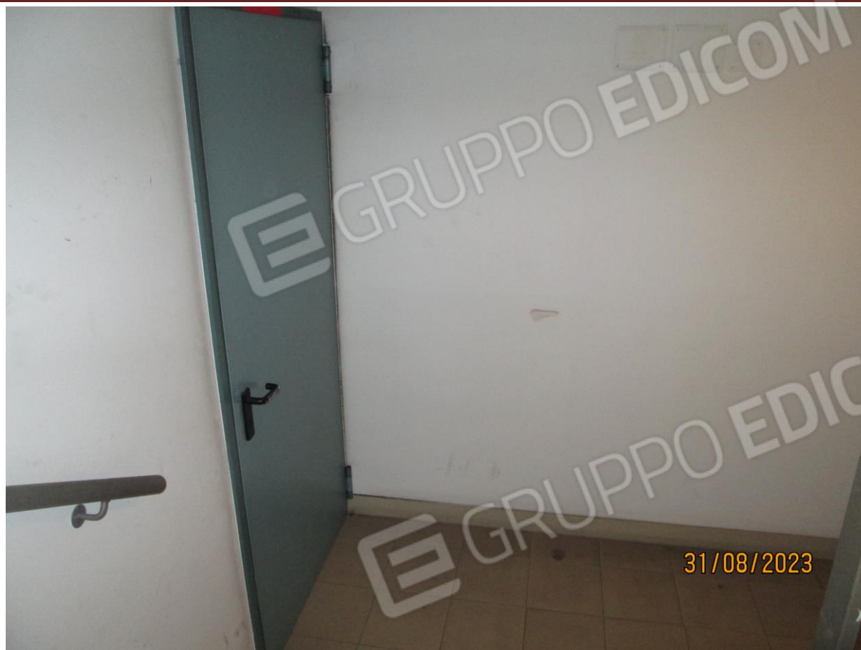
Foto n. 11: Pianerottolo del piano interrato dal fabbricato di Via Manfredonia 14/C