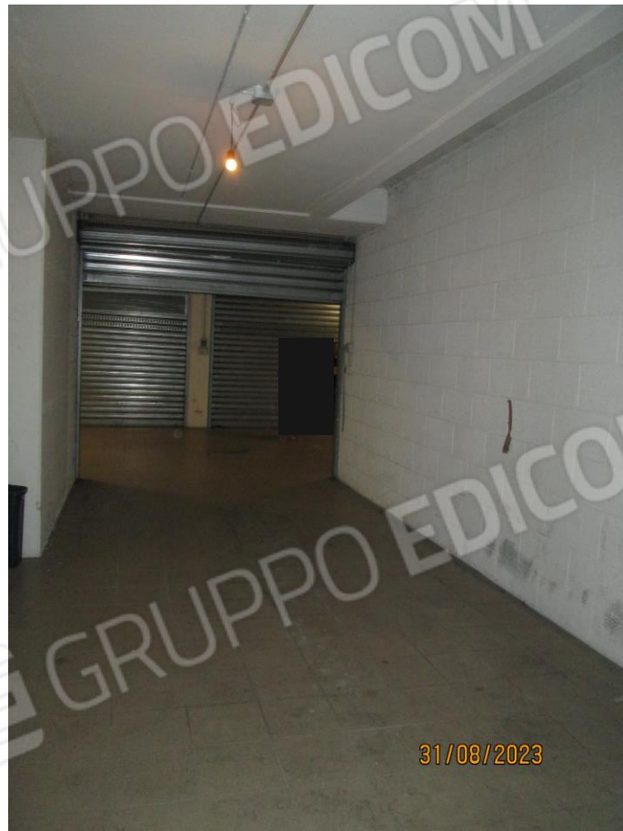
Foto n. 07 e n. 08: Garage con annessa cantina, costituenti il lotto 4