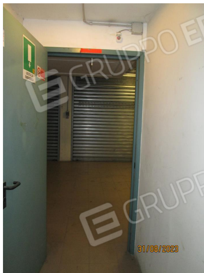
Foto n. 09 e n. 10: Accesso interno al piano interrato dal fabbricato di Via Manfredonia 14/C