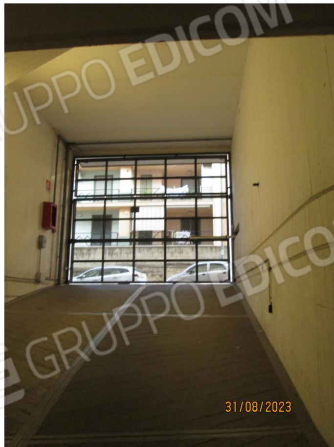
Foto n. 03 e n. 04: Ingresso garage da Via Termoli n. 70, vista esterna e interna