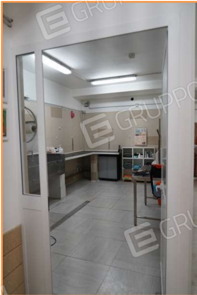
FOTO n° 13. Piano interrato. Accesso al vano toelettatura animali domestici. Vista verso la direzione ovest.