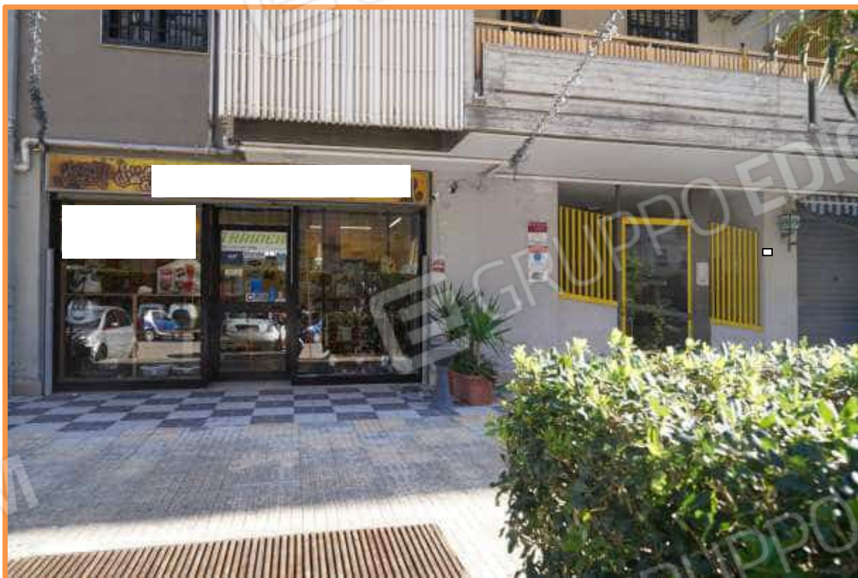
FOTO n° 1. Bari, Loseto. Via G. Giacobelli civico 39. Prospetto principale dell'unità immobiliare staggita. Vista verso la direzione est.