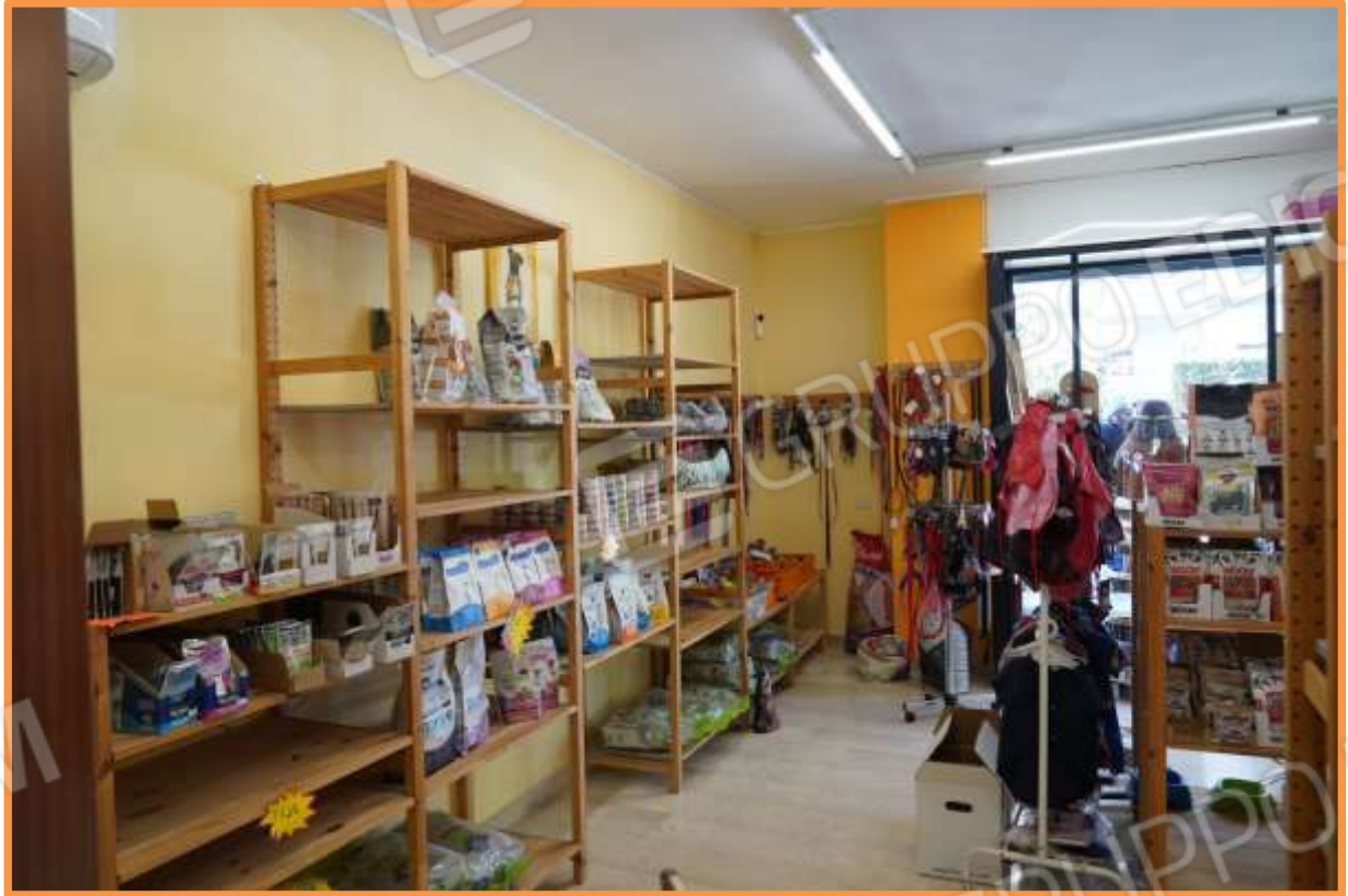
FOTO n° 3. Interno dell'unità staggiata. Vano ingresso e vendita. Vista verso la direzione ovest. Sul fondo è visibile la vetrina di ingresso.