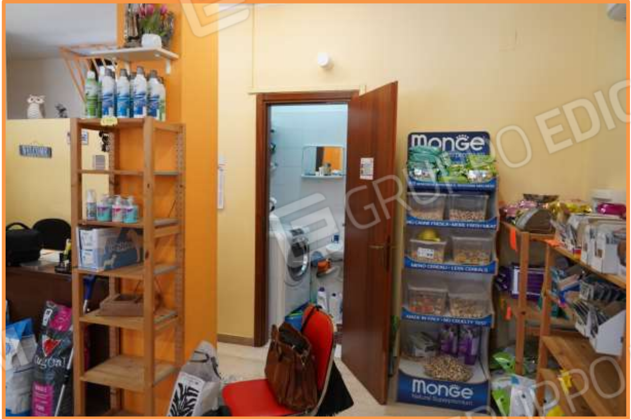
FOTO n° 5. Vista dell'accesso al vano bagno. Vista verso la direzione est.