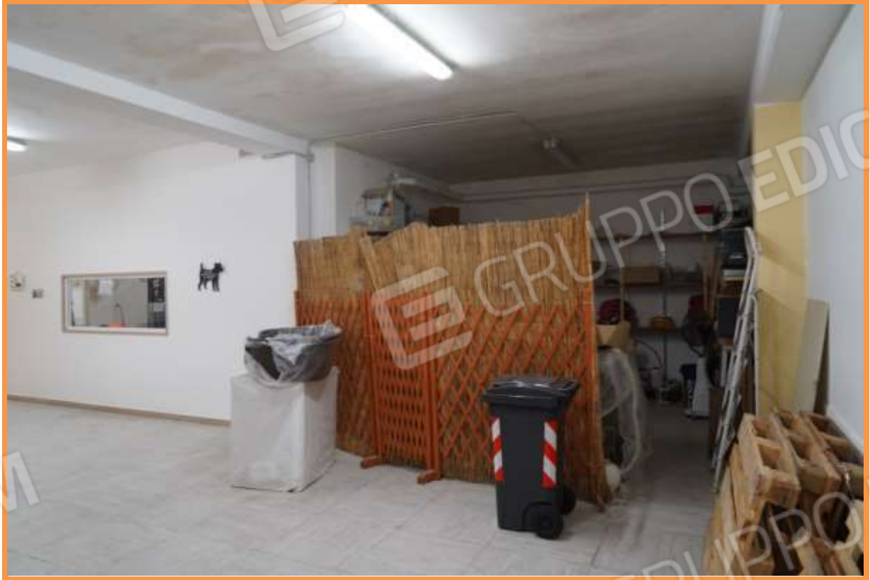
FOTO n° 12. Piano interrato. Vista verso la direzione sud. A sinistra è visibile il vano toelettatura.