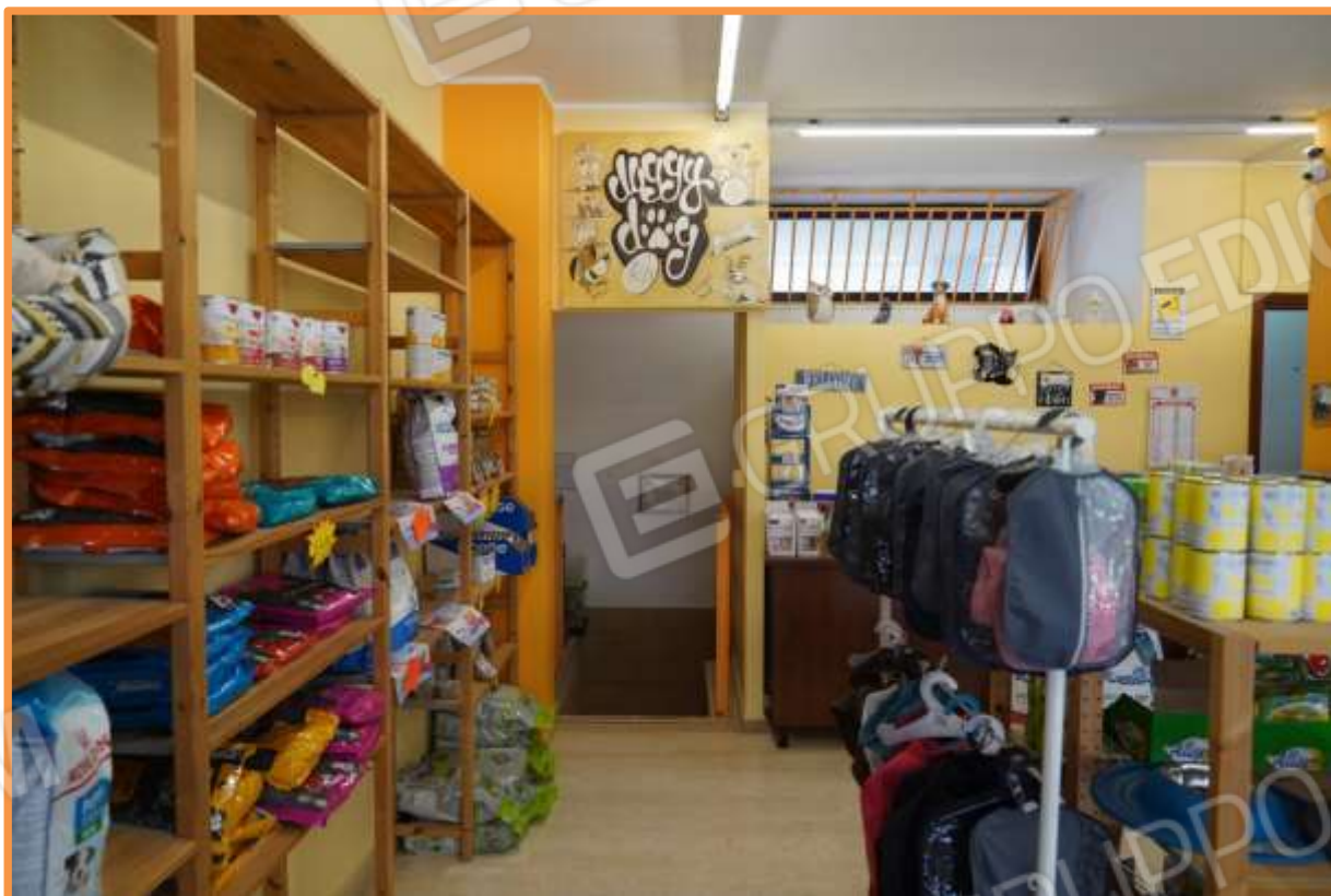
FOTO N° 8. Apertura di accesso al piano interrato. Vista verso la direzione est.