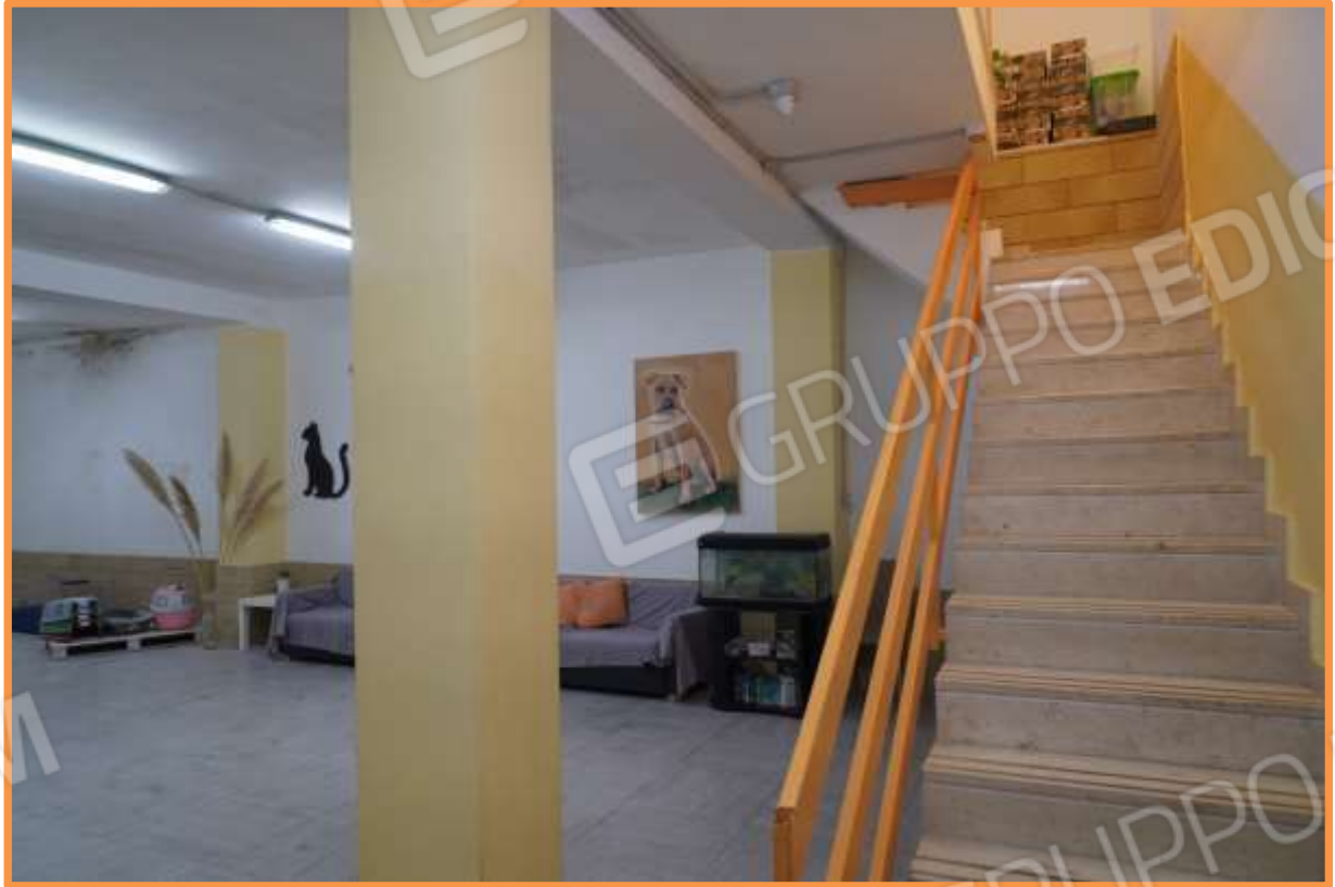
FOTO N° 10 Come foto n° 9. Vista verso la direzione nord di parte del piano interrato.