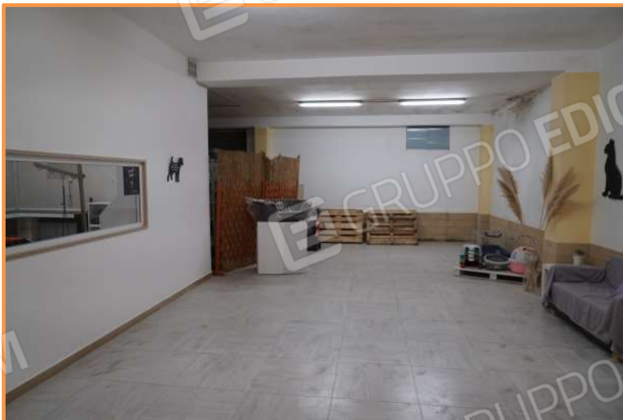
FOTO N° 11 Piano interrato. Vista verso la direzione ovest. A sinistra è visibile parte del vano toelettatura animali domestici.