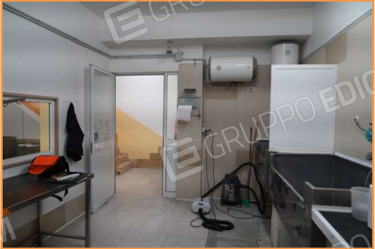
FOTO n° 14. Vano toelettatura. Vista verso la porta di accesso, verso la direzione est. Sul fondo a sinistra, oltre la porta di ingresso, è visibile la parte iniziale della rampa di scala.