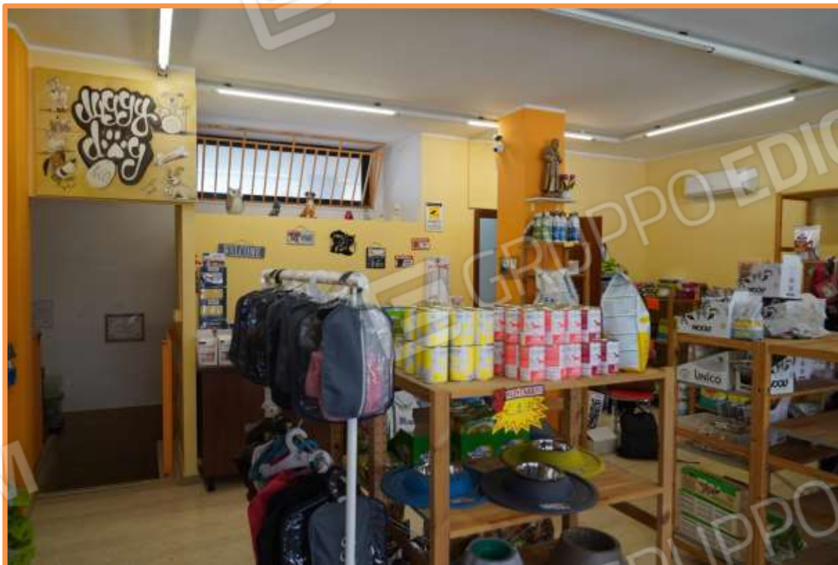
FOTO n° 2. Interno dell'unità staggita. Vano ingresso e di vendita. Vista verso la direzione est. Sul fondo, frontalmente è visibile l'accesso al piano interrato; a destra è posto l'accesso al vano bagno, parzialmente nascosto dal pilastro.