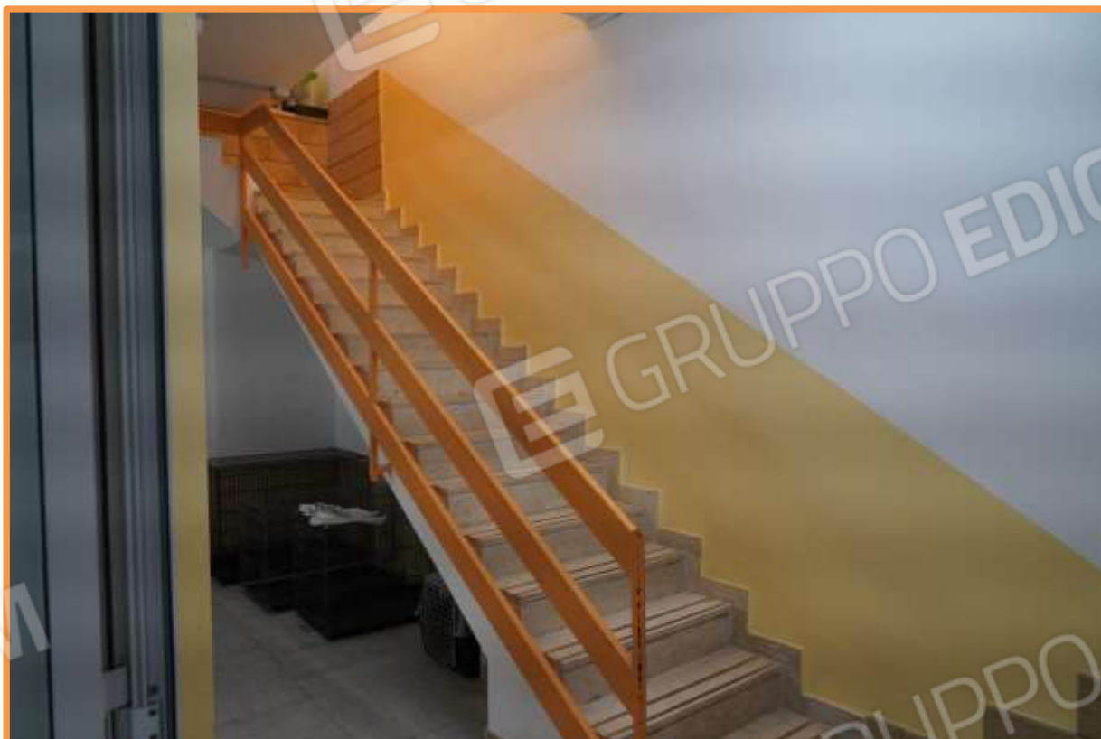
FOTO N° 9. Rampa di scala di accesso al piano interrato posta a ridosso della muratura di confine est.