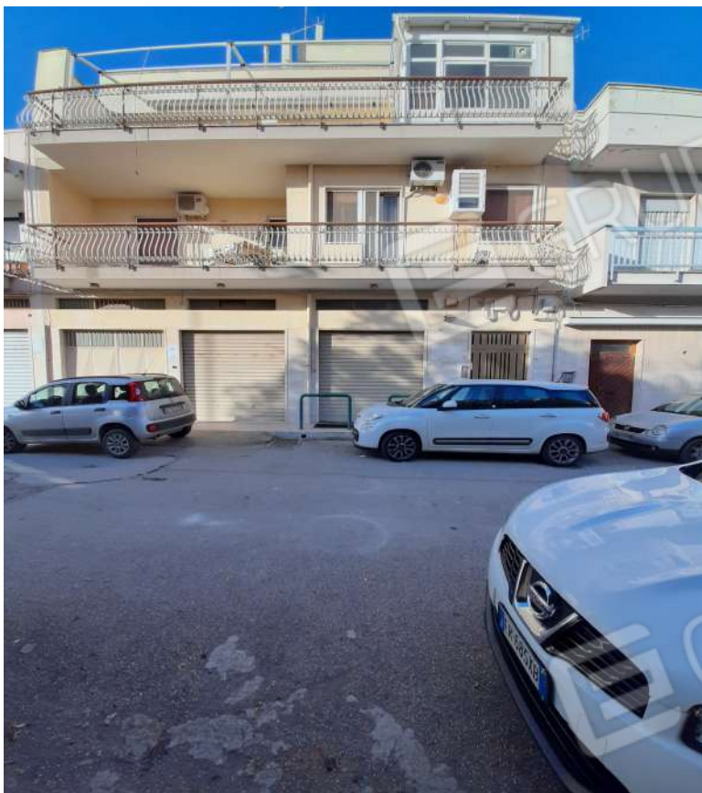
Foto n. 0 Prospetto