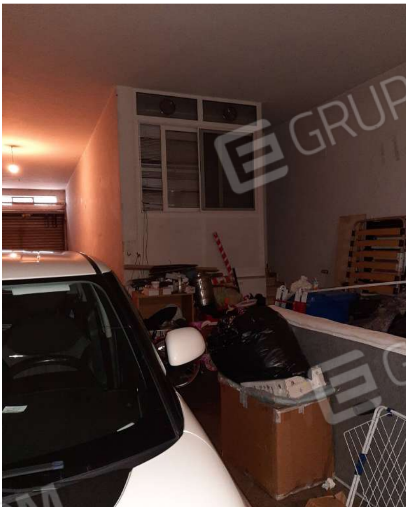
Foto n. 6 Locale su rampa