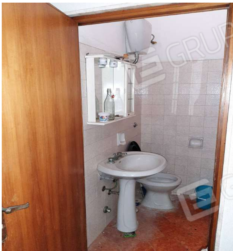
Foto n. 4 Bagno