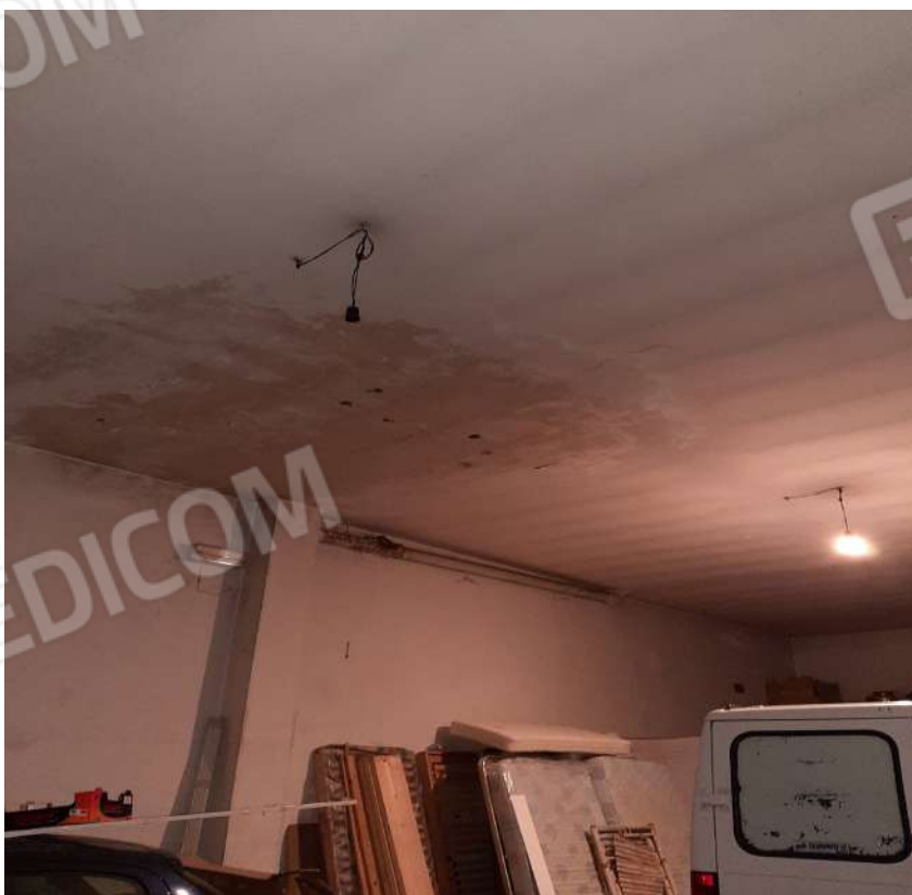
Foto n. 9 Interno locale