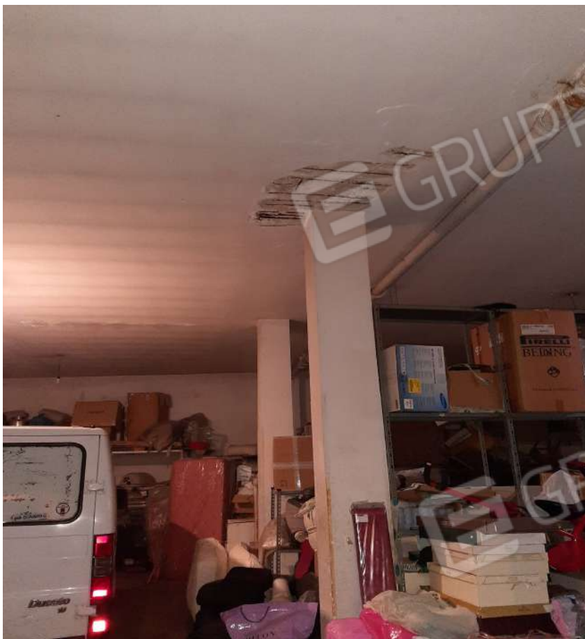
Foto n. 10 Fondo del locale