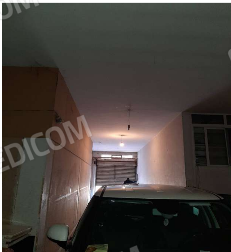
Foto n. 5 Accesso zona locale n.c. 9