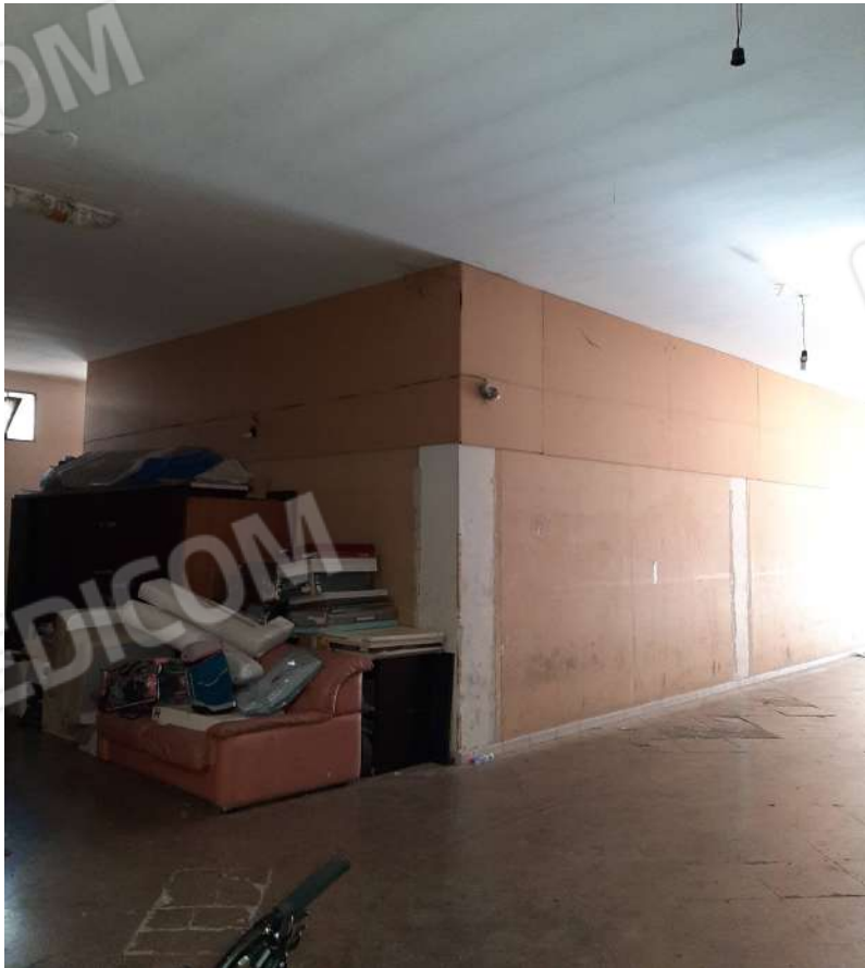
Foto n. 13 Locale con zona delimitata per esposizione