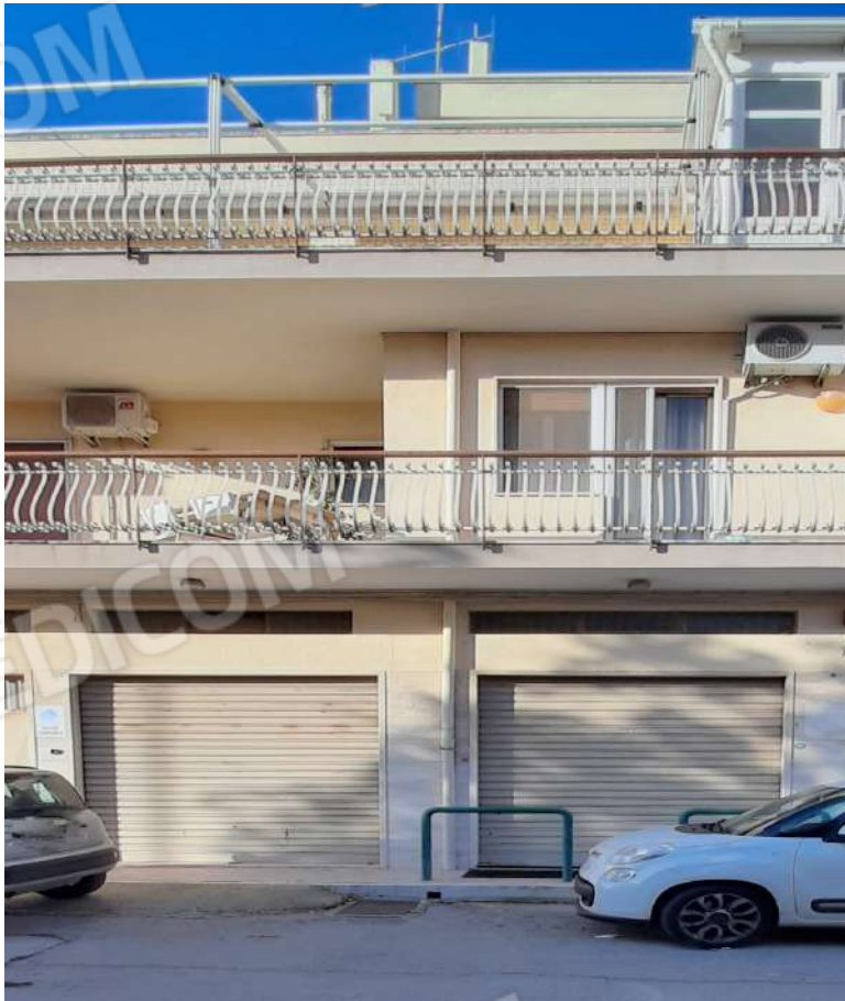
Foto n 1. Accessi nn.cc. 7 - 9