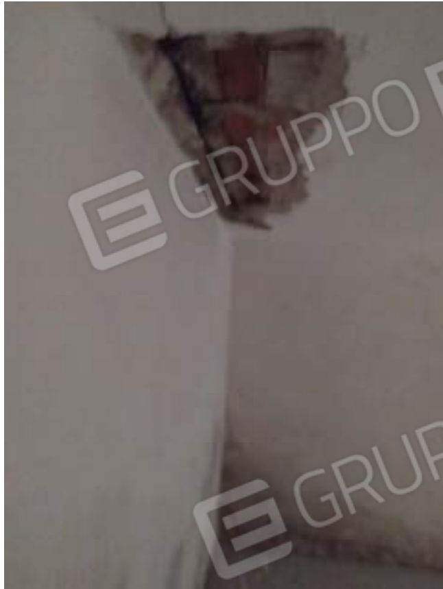
Foto 13 – una delle criticità rilevate: fenomeni d'infiltrazione di acque meteoriche nel soggiorno al piano interrato