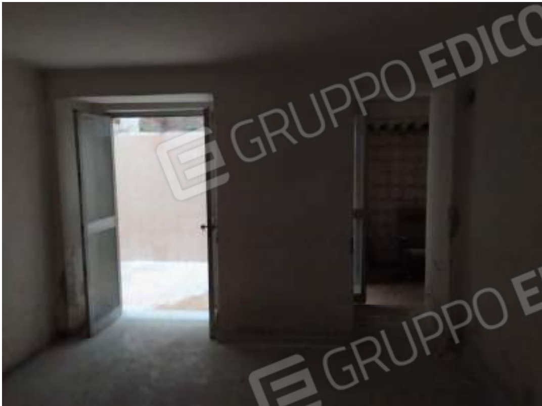
Foto 7 – soggiorno; a sx porta-finestra sulla chiostrina, a dx varco di comunicazione con la cucina