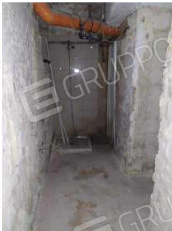
Foto 11 – servizio igienico piano interrato, sullo sfondo piatto doccia