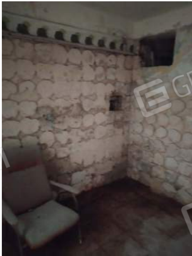
Foto 8 – cucina; evidente stato di fatiscenza e visibile il collante del rivestimento rimosso