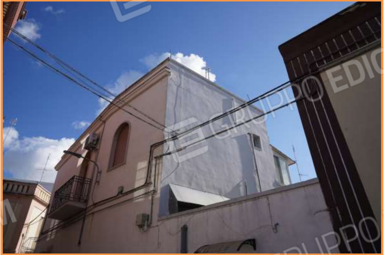
FOTO n° 5. Particolare del prospetto interno ovest, visibile da via Delle Lame. L'immobile staggito è posto al primo piano.