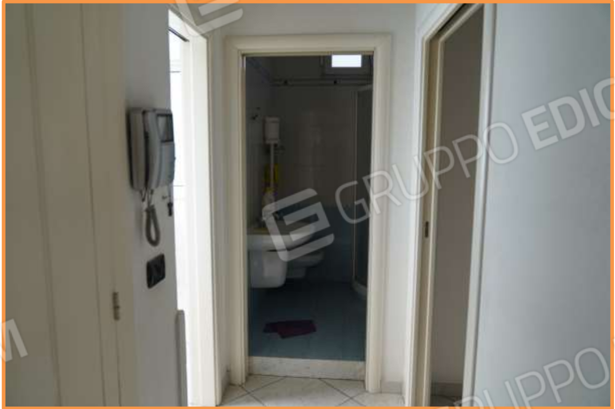
FOTO N° 10 Porzione del corridoio che immette alla zona notte. L'ingresso è posizionato al lato di sinistra di chi osserva. Vista verso la direzione ovest.