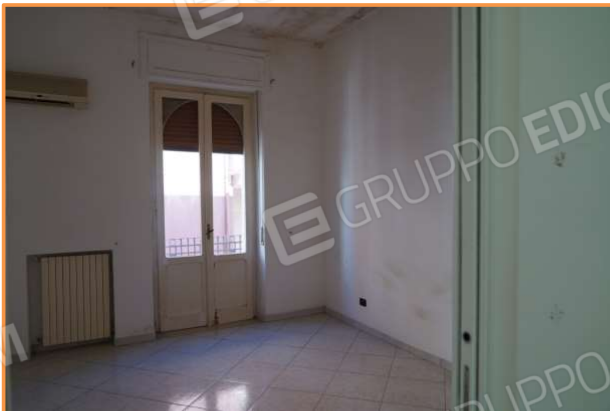
FOTO N° 11 Prima camera a destra di chi percorre il corridoio verso la zona notte. Vista verso la direzione nord.