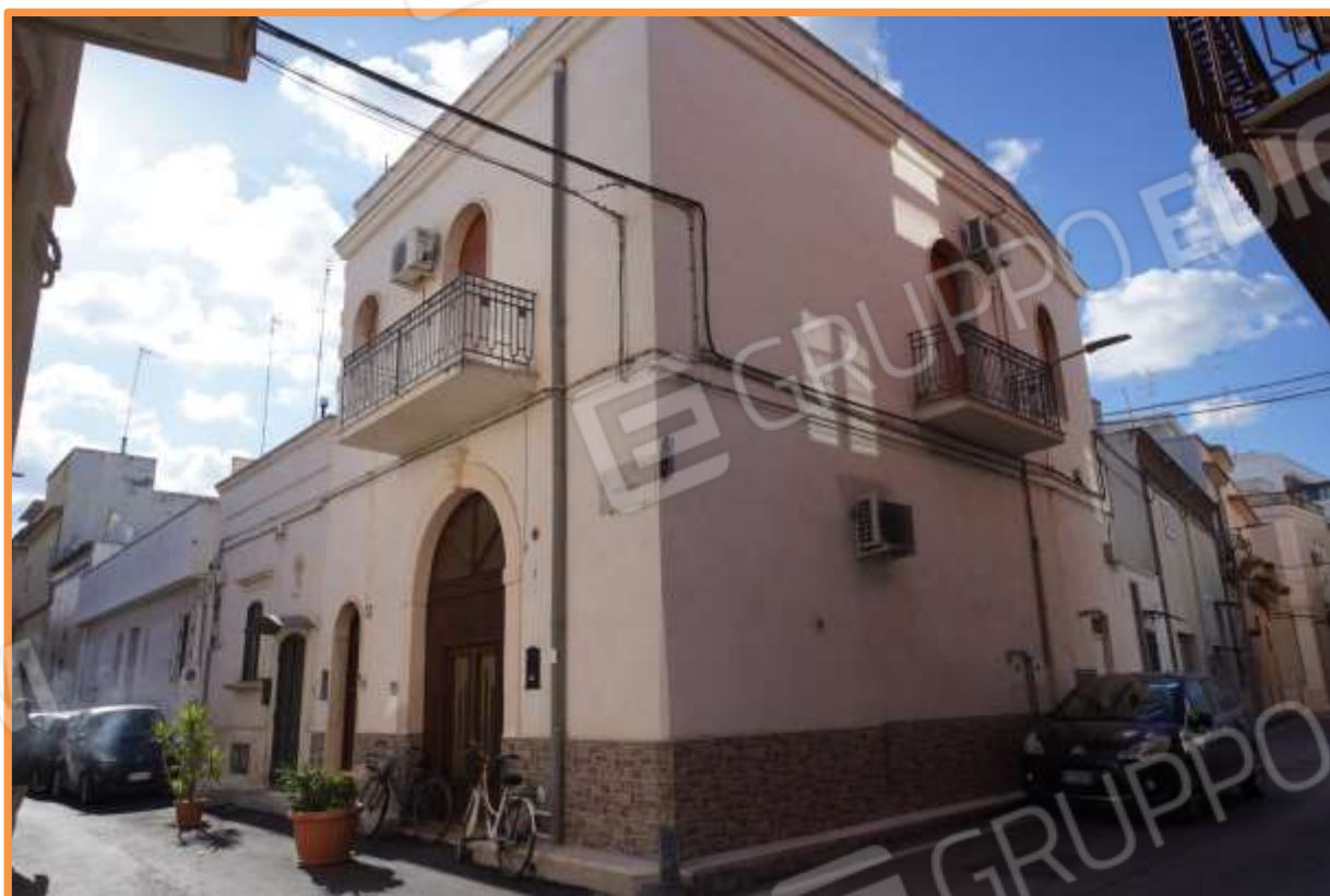
FOTO n° 1. Bari, Carbonara. Via Pollaioli angolo via Delle Lame. L'immobile staggito è costituito dal primo piano e dal lastrico solare dell'edificio ed ha accesso dalla via Pollaioli civico 1/A. Vista verso la direzione sud-ovest dei due prospetti principali. La via Pollaioli è posta a sinistra di chi osserva la fotografia.