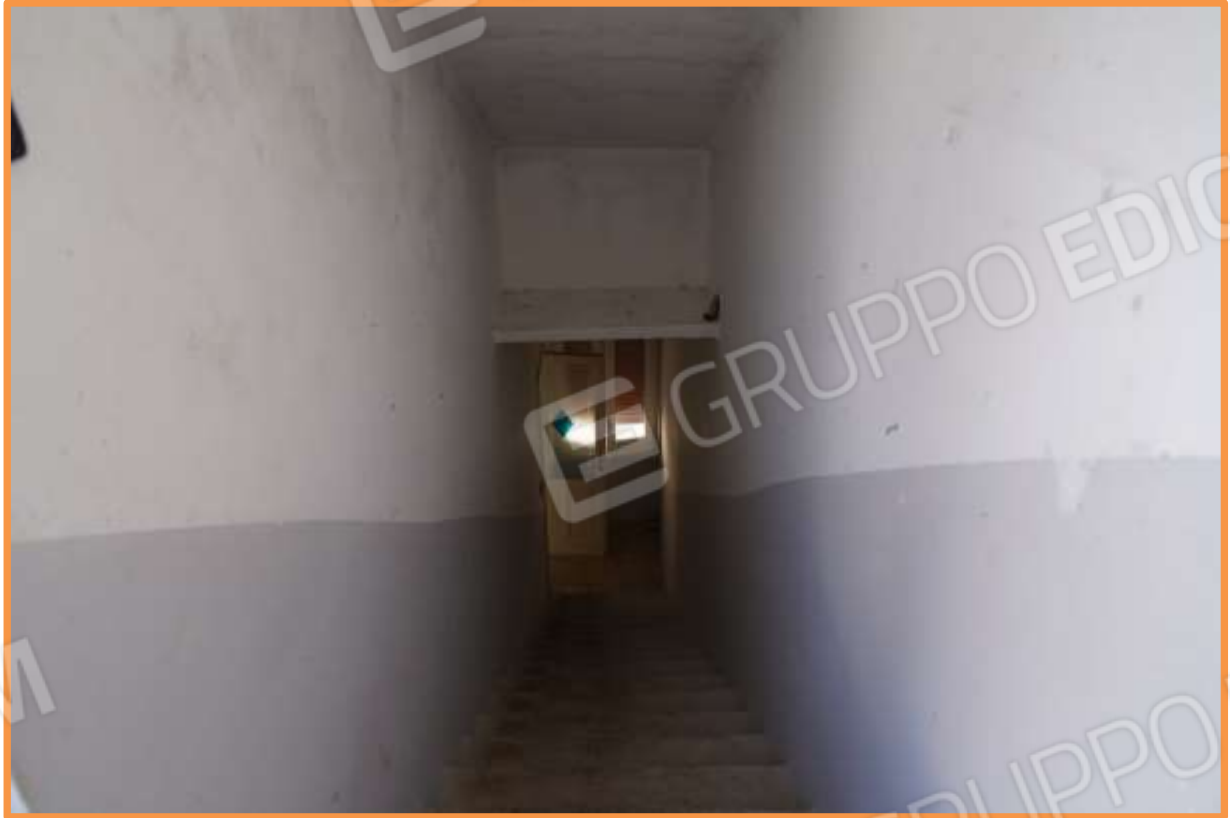
FOTO N° 21 Come foto n° 20. Vista dall'alto verso la direzione est. Sul fondo è visibile la finestra che illumina la zona ballatoio di partenza.