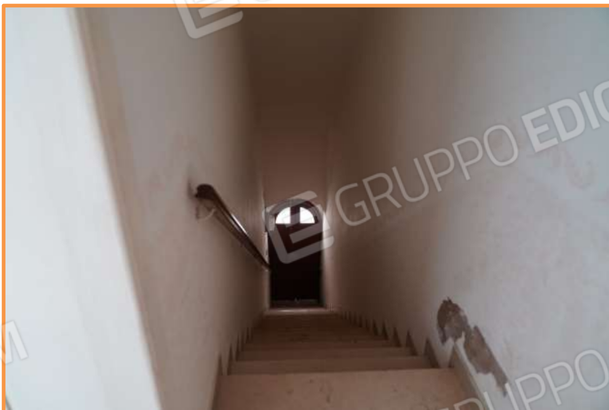
FOTO n° 7. Come foto n° 6. Vista nella direzione opposta, verso est.