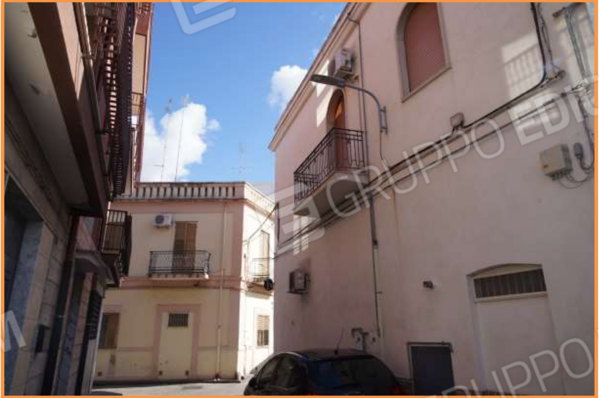
FOTO n° 4. Vista verso la direzione est del prospetto principale dell'edificio sulla via Delle Lame. Il bene staggito è sito al primo piano.