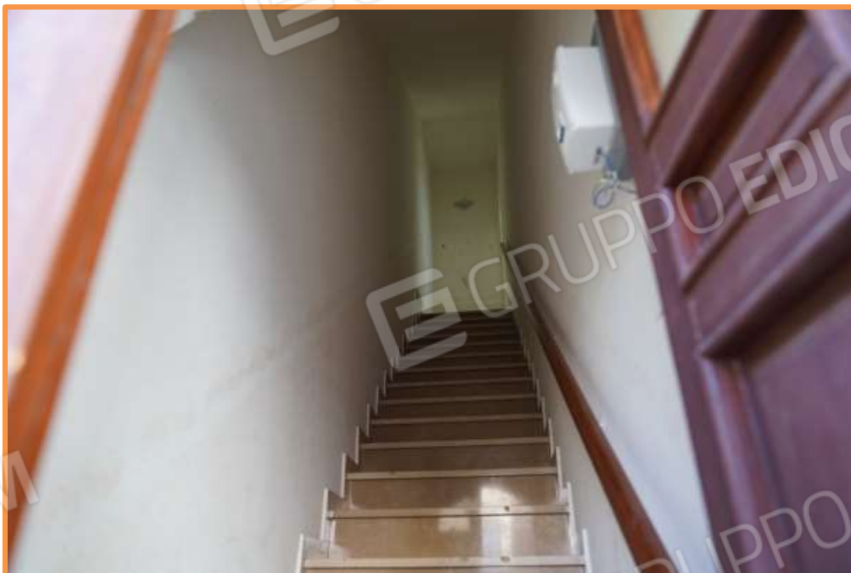
FOTO n° 6. Via Pollaioli civico 1/A. Androne e vano scala di accesso al primo piano. Vista verso la direzione ovest.