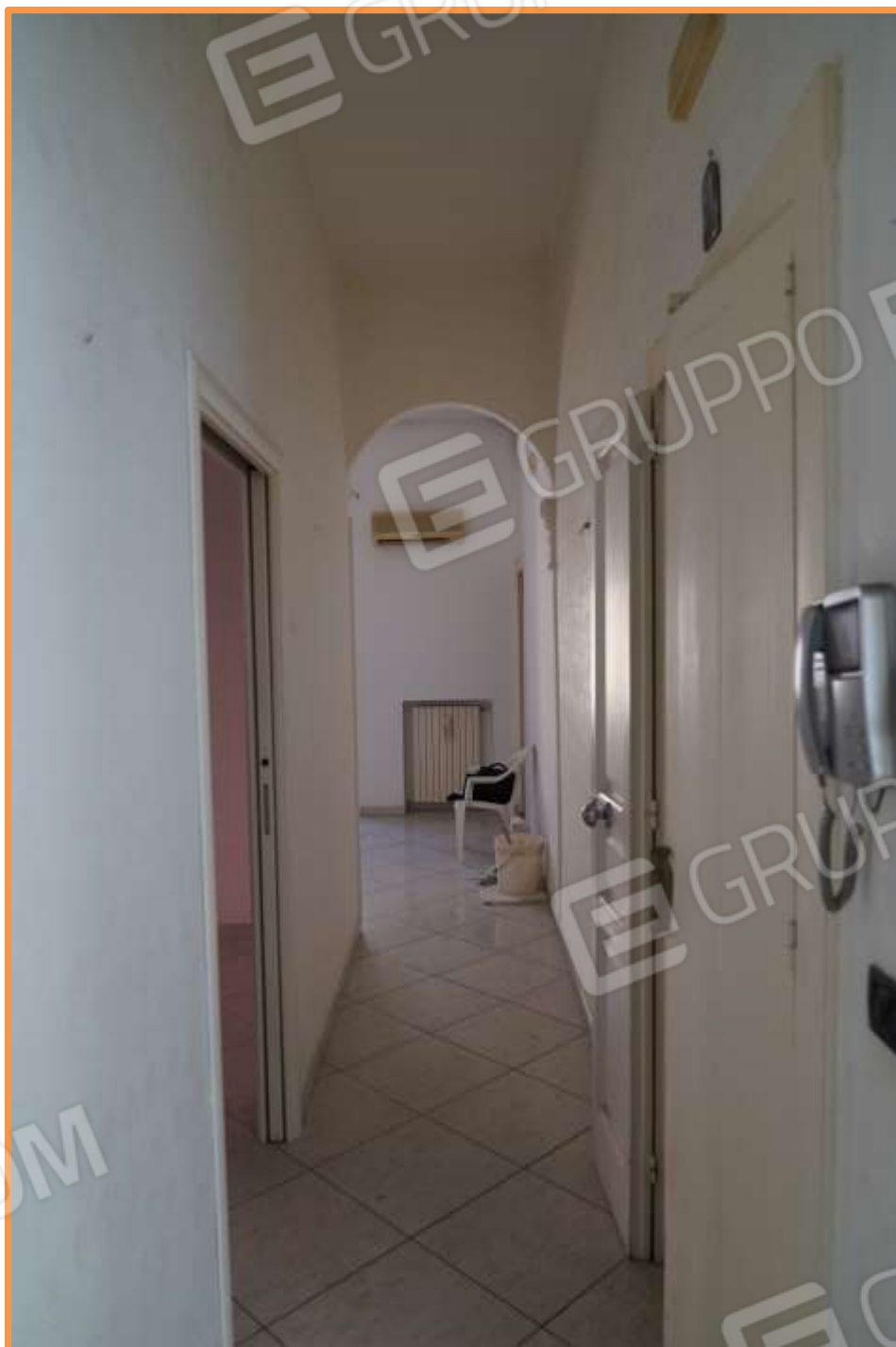
FOTO N° 8. Ingresso e corridoio distributore alla zona notte e alla zona giorno. Vista verso la direzione est, verso la zona giorno. L'ingresso è sito a destra di chi osserva.