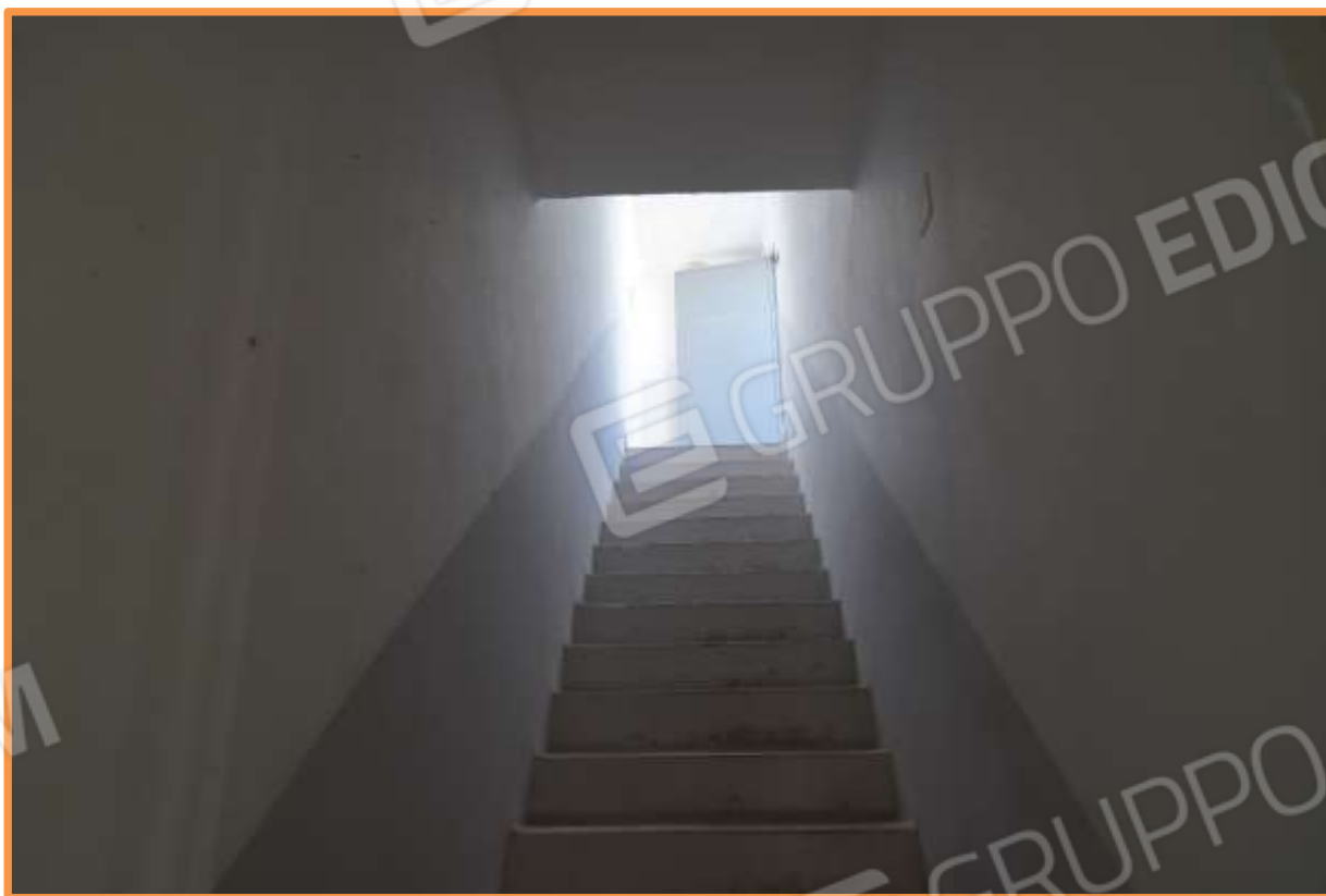
FOTO N° 20 Rampa di scala per l'accesso al lastrico solare. Vista verso la direzione ovest.