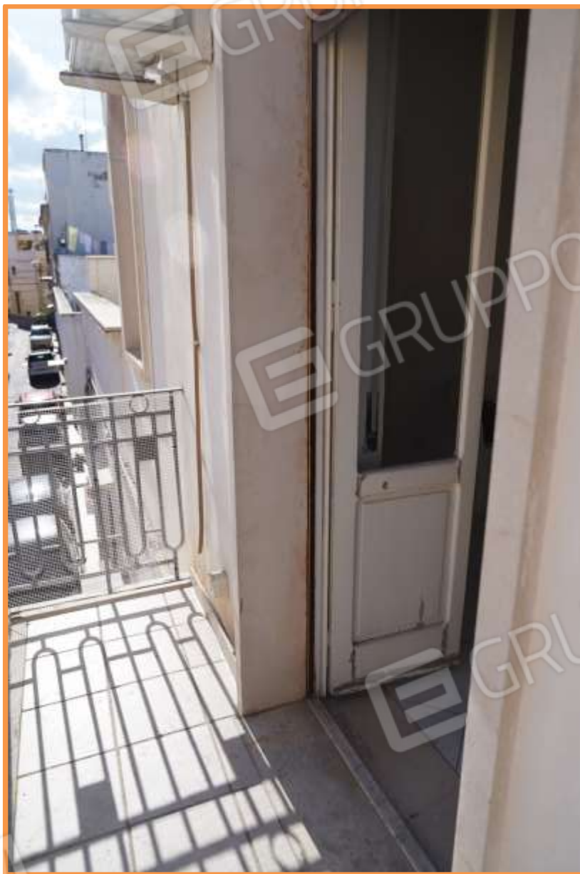
FOTO N° 18. Balcone del vano soggiorno-salone prospiciente sulla via Pollaioli.