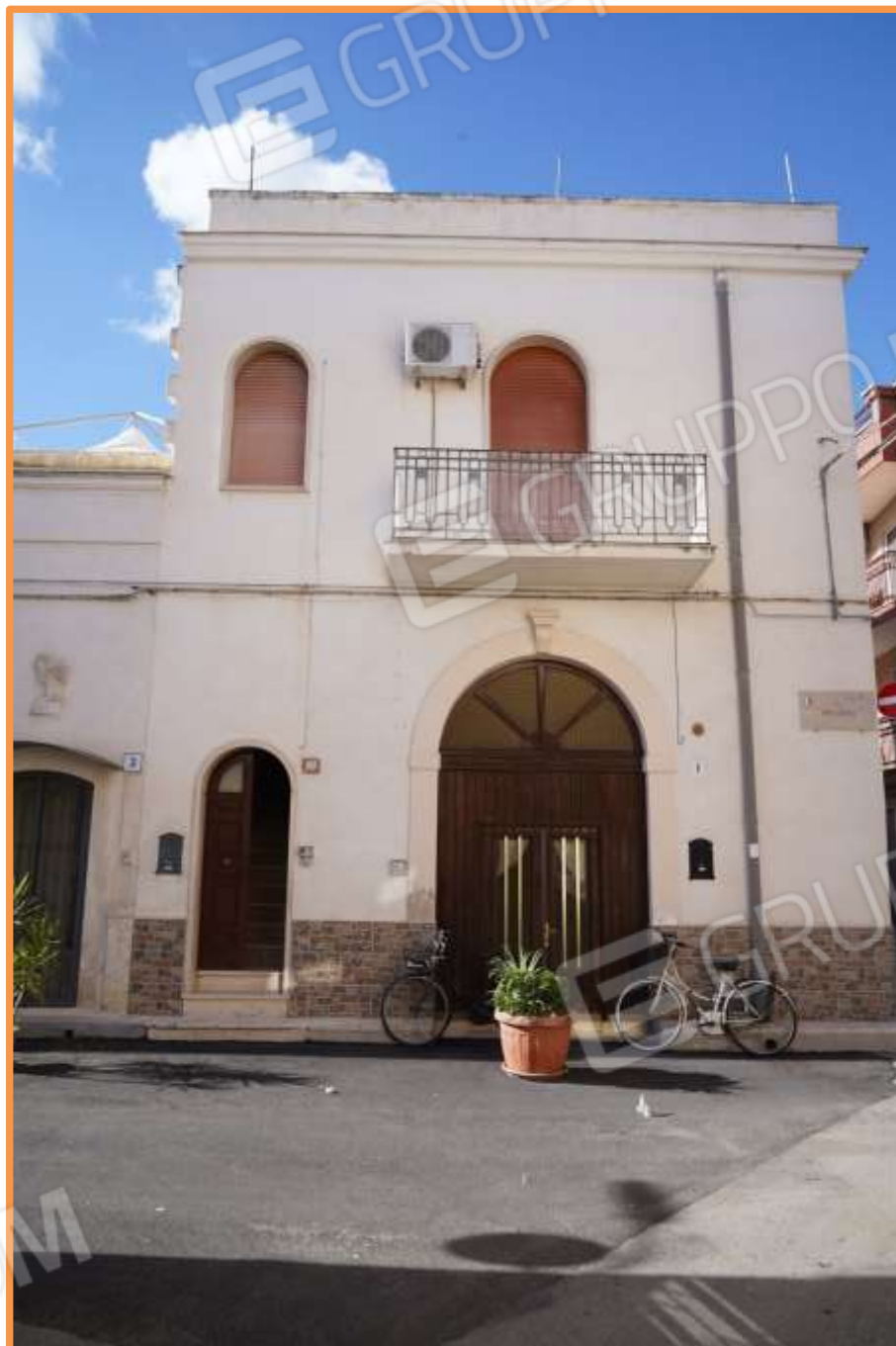
FOTO n° 2. Vista del prospetto principale est dell'edificio in cui è sito al primo piano l'immobile staggito. Il portoncino posto rialzato sui due gradini costituisce l'accesso al piano.