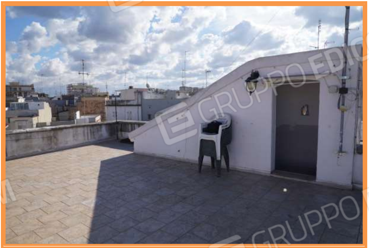
FOTO n° 22. Torrino scala e lastrico solare. Vista verso la direzione sud-est.