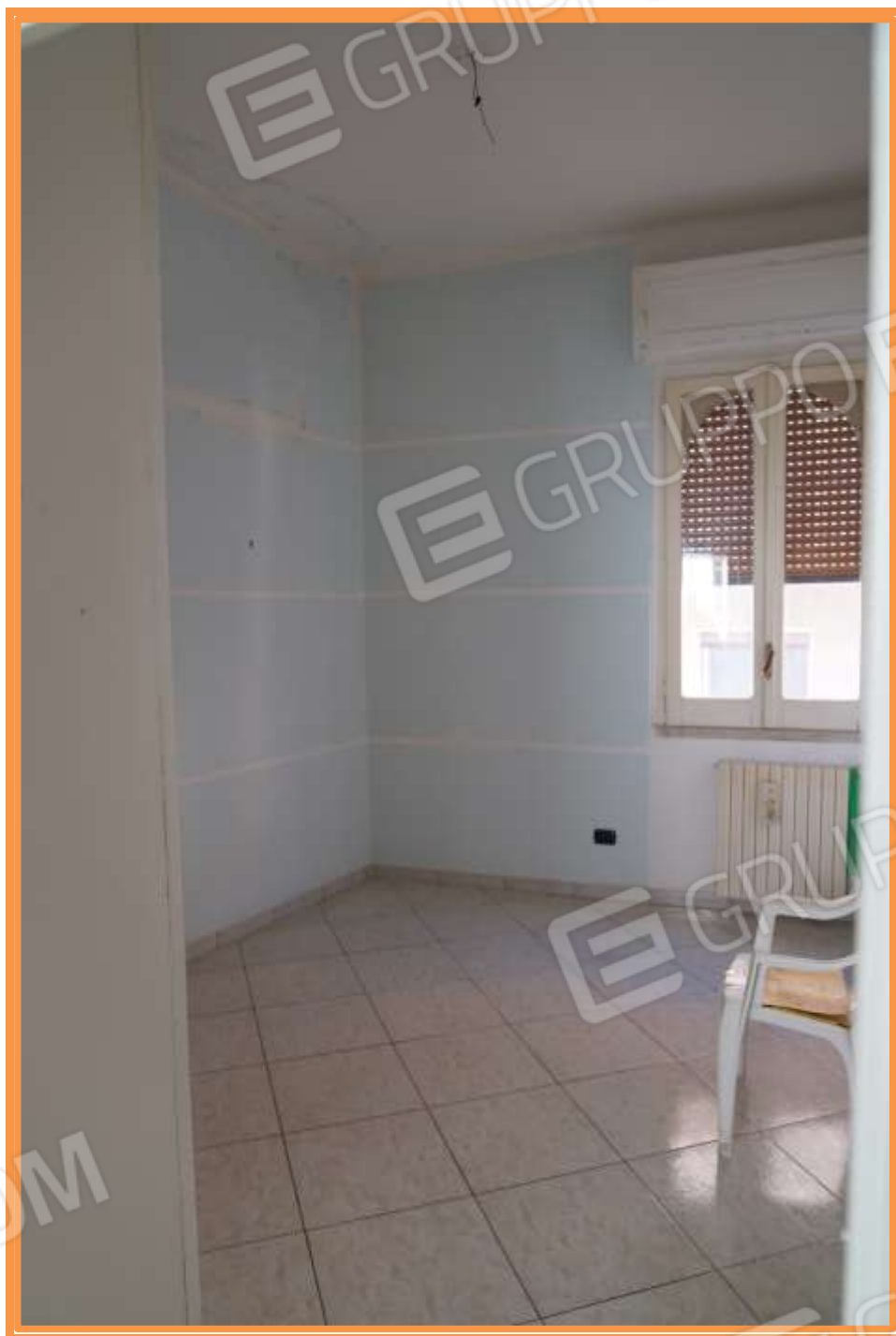
FOTO n° 12. Seconda camera a destra di chi percorre il corridoio verso la zona notte. Vista verso la direzione nord-ovest.