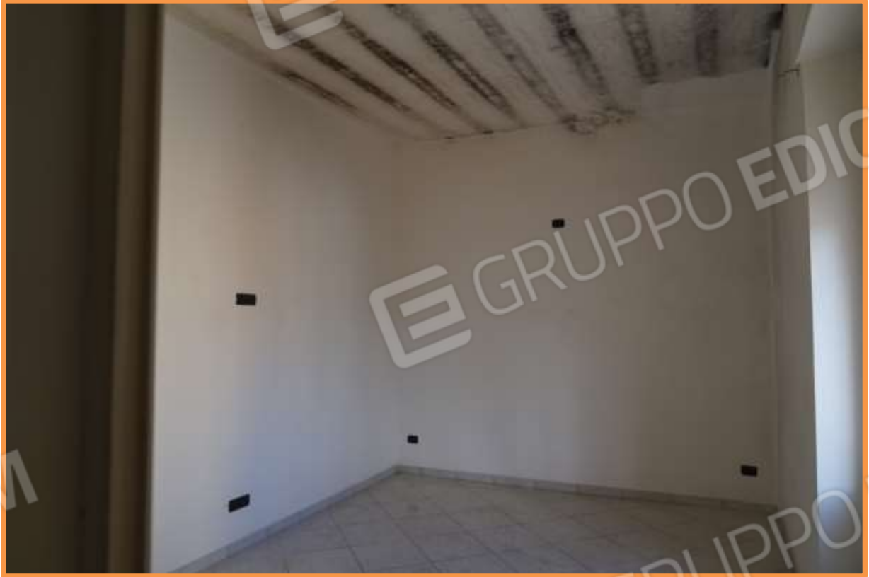
FOTO n° 16. Vano soggiorno-salone. Vista verso la direzione nord-ovest. Si osserva un'elevata formazione di macchie di condensa all'intradosso del solaio di copertura.