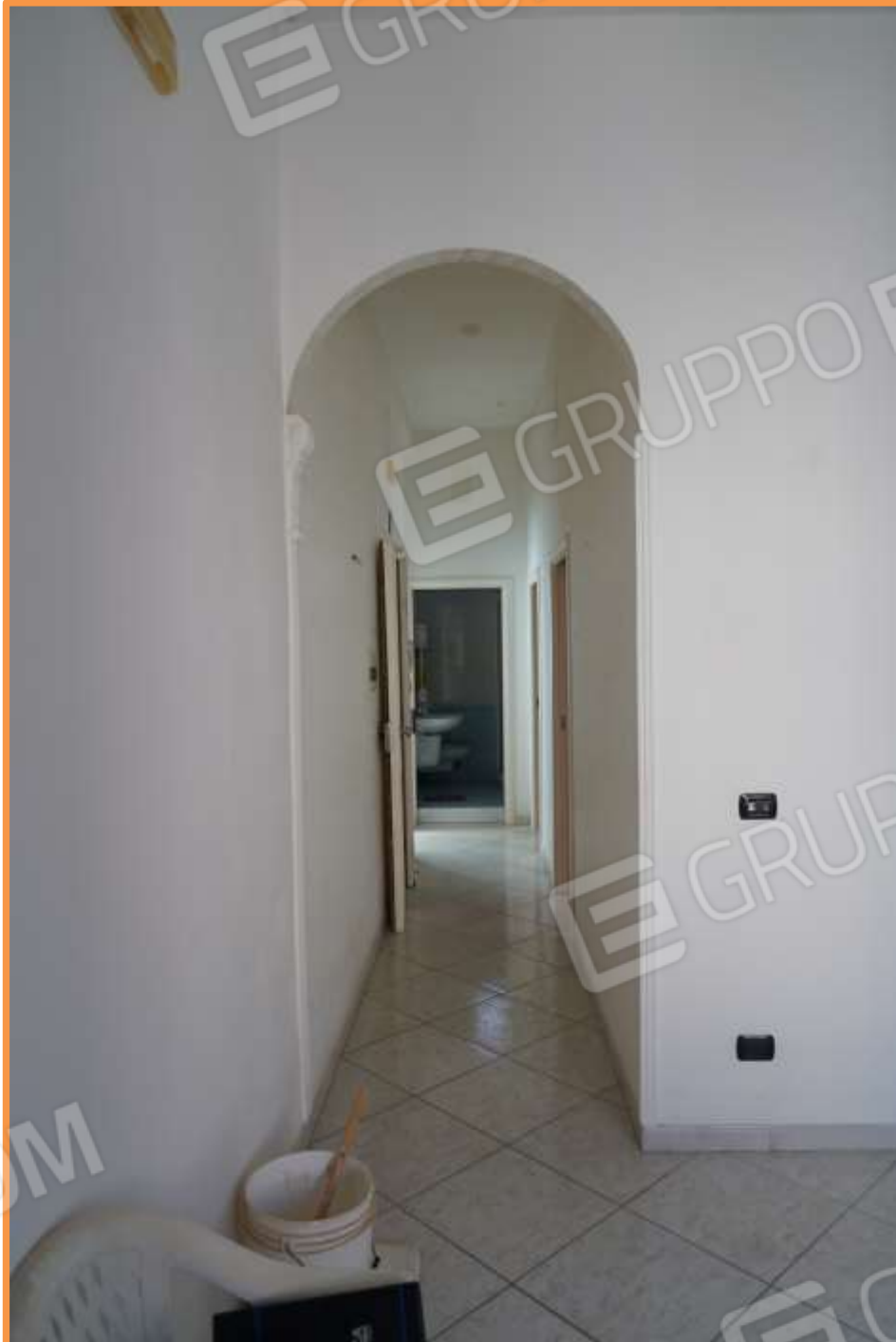
FOTO N° 9. Come foto n° 8, vista verso la direzione ovest, verso la zona notte. L'ingresso è sito a sinistra di chi osserva.