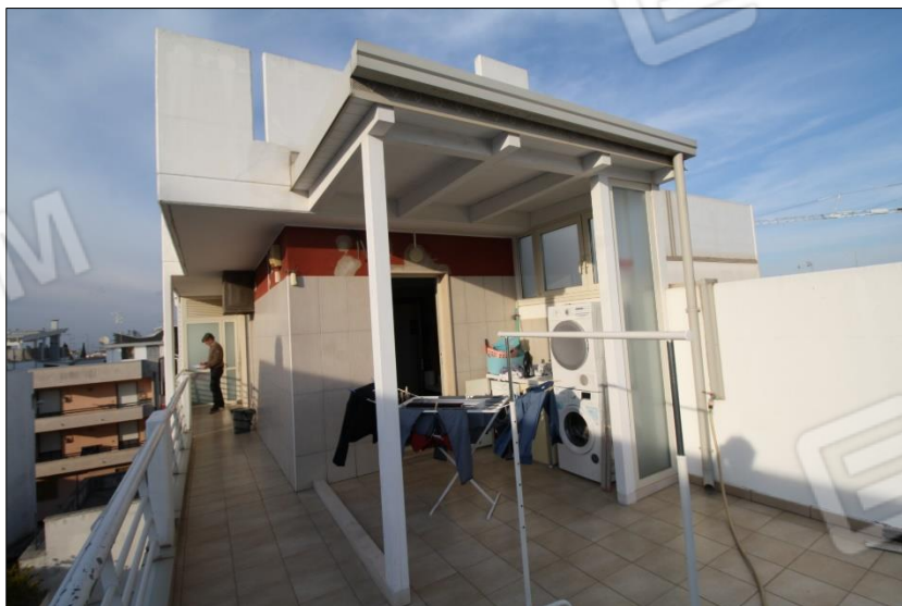
FOTO N.8 TERRAZZO SCOPERTO SUD E BALCONE OVEST