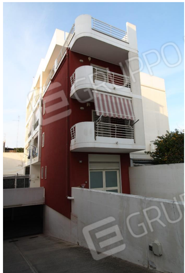
FOTO N.2 PROSPETTO SUD E PROSPETTO OVEST