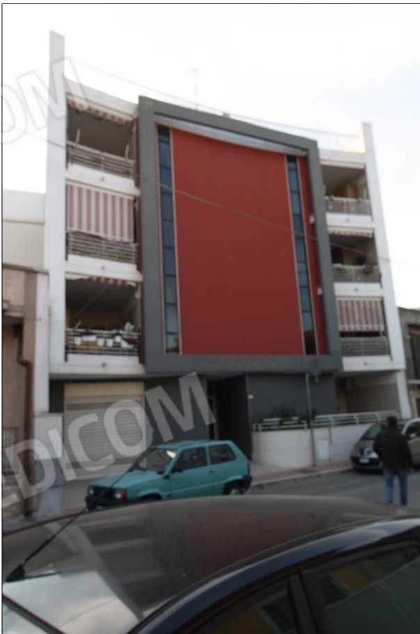
FOTO N.1 PROSPETTO SU VIA XXIV MAGGIO