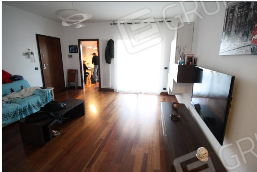
FOTO N.4 SOGGIORNO