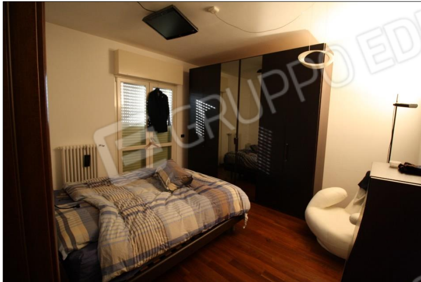
FOTO N.6 VANO LETTO