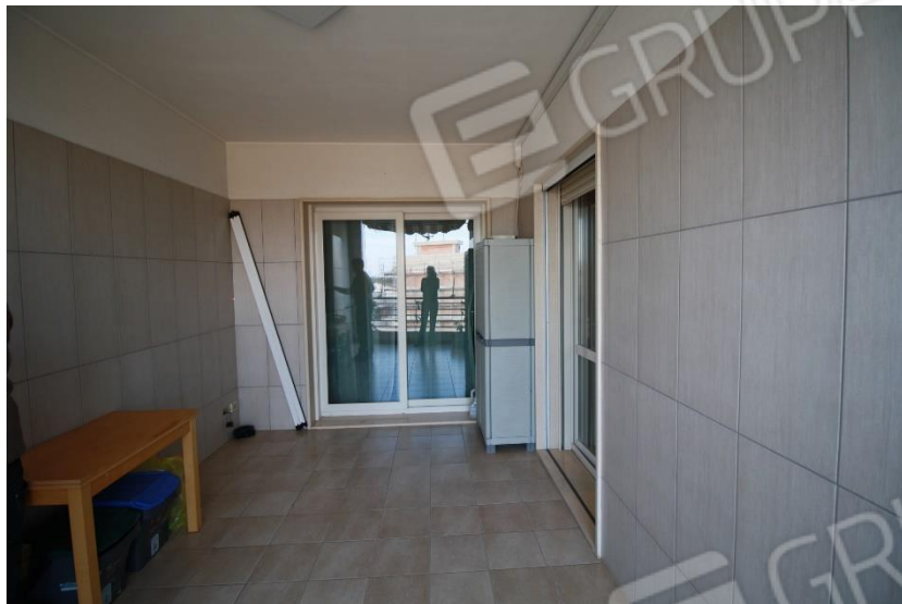
FOTO N.10 TERRAZZO COPERTO