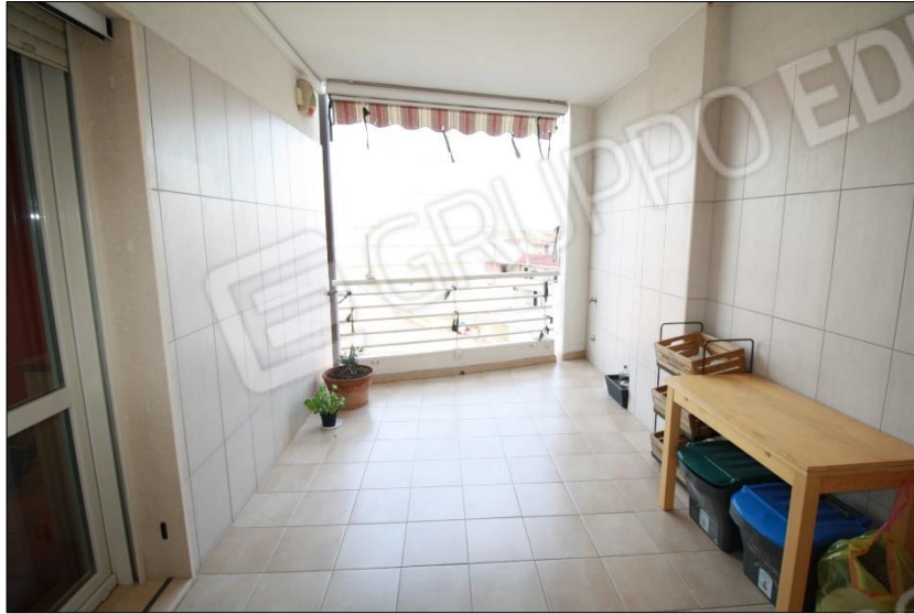
FOTO N.9 TERRAZZO COPERTO