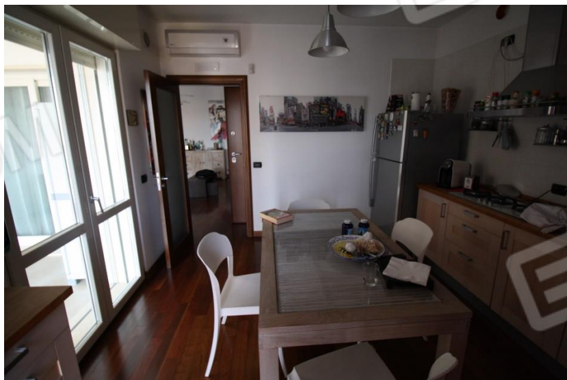
FOTO N.5 CUCINA