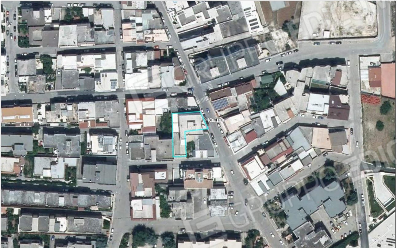
IMMAGINE GOOGLE MAPS