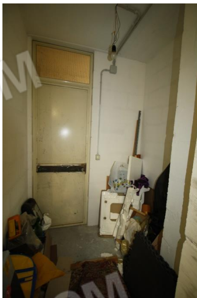
FOTO N.19 CANTINOLA