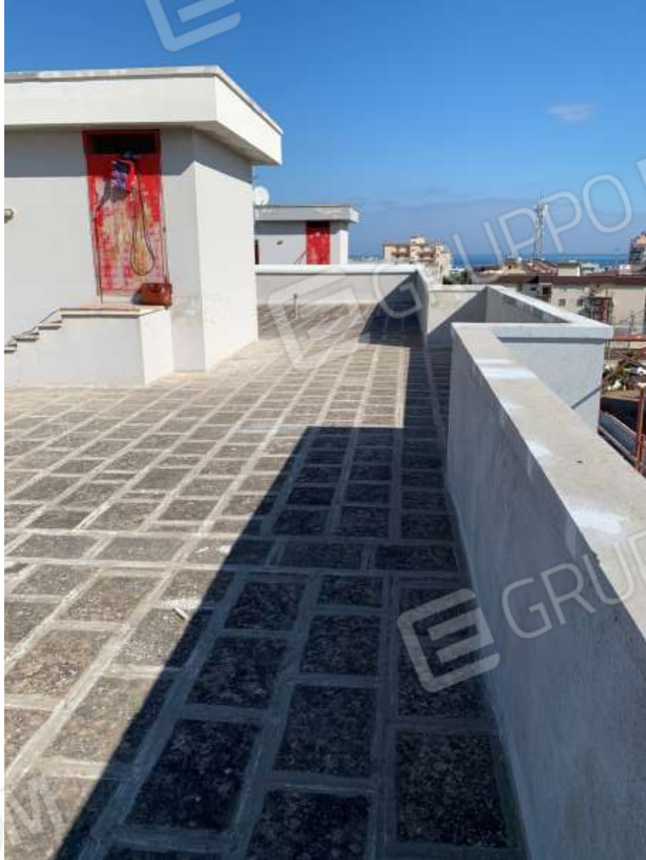
FOTO n° 4. Come foto n° 2 - 3. Vista della parte retrostante il torrino, verso la direzione est.