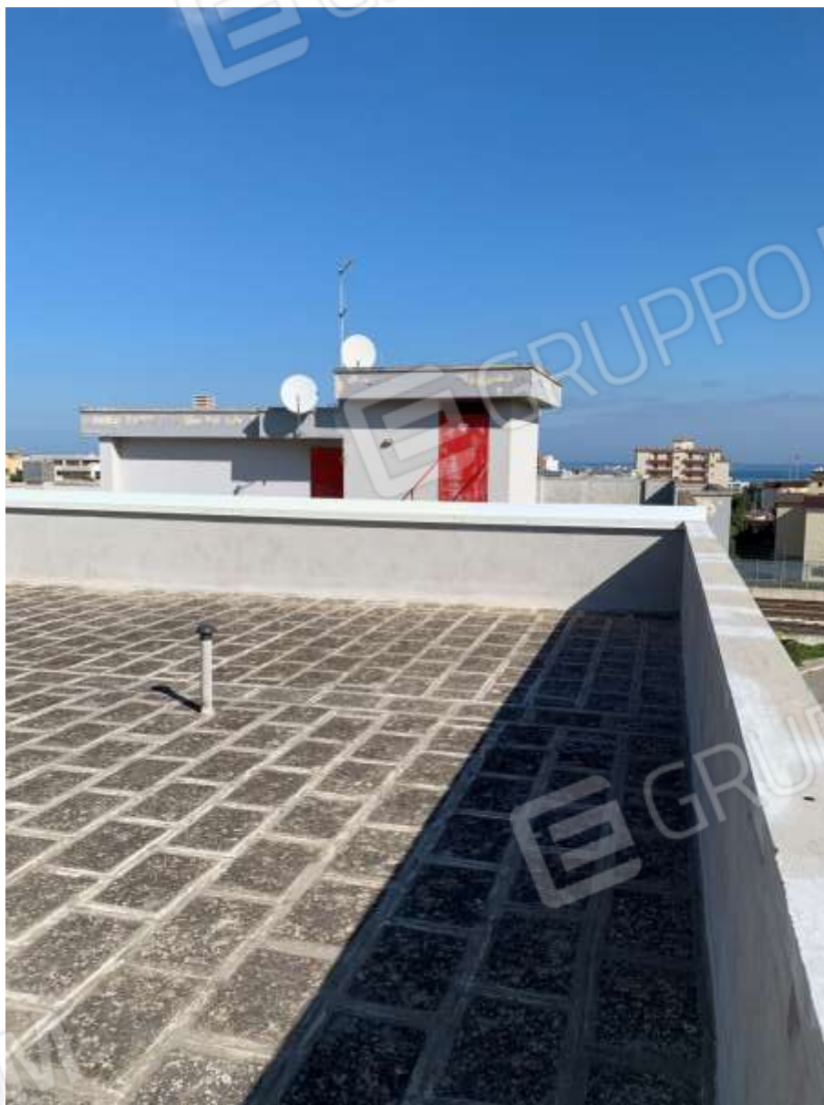
FOTO n° 6. Come foto n° 5.- Vista della porzione sud-est. In secondo piano è visibile il torrino scala del contiguo edificio con accesso dal civico 8 di via Antonelli..