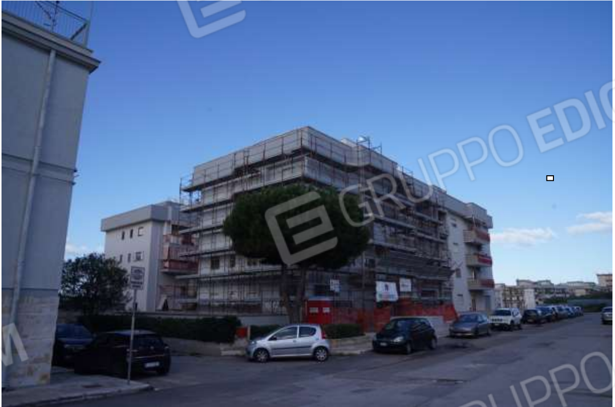
FOTO n° 1. Monopoli. Edificio con accesso dal civico 6 di via G. Antonelli. L'unità immobiliare staggita costituisce il lastrico solare di copertura dell'edificio condominiale pluripiano visibile in primo piano.