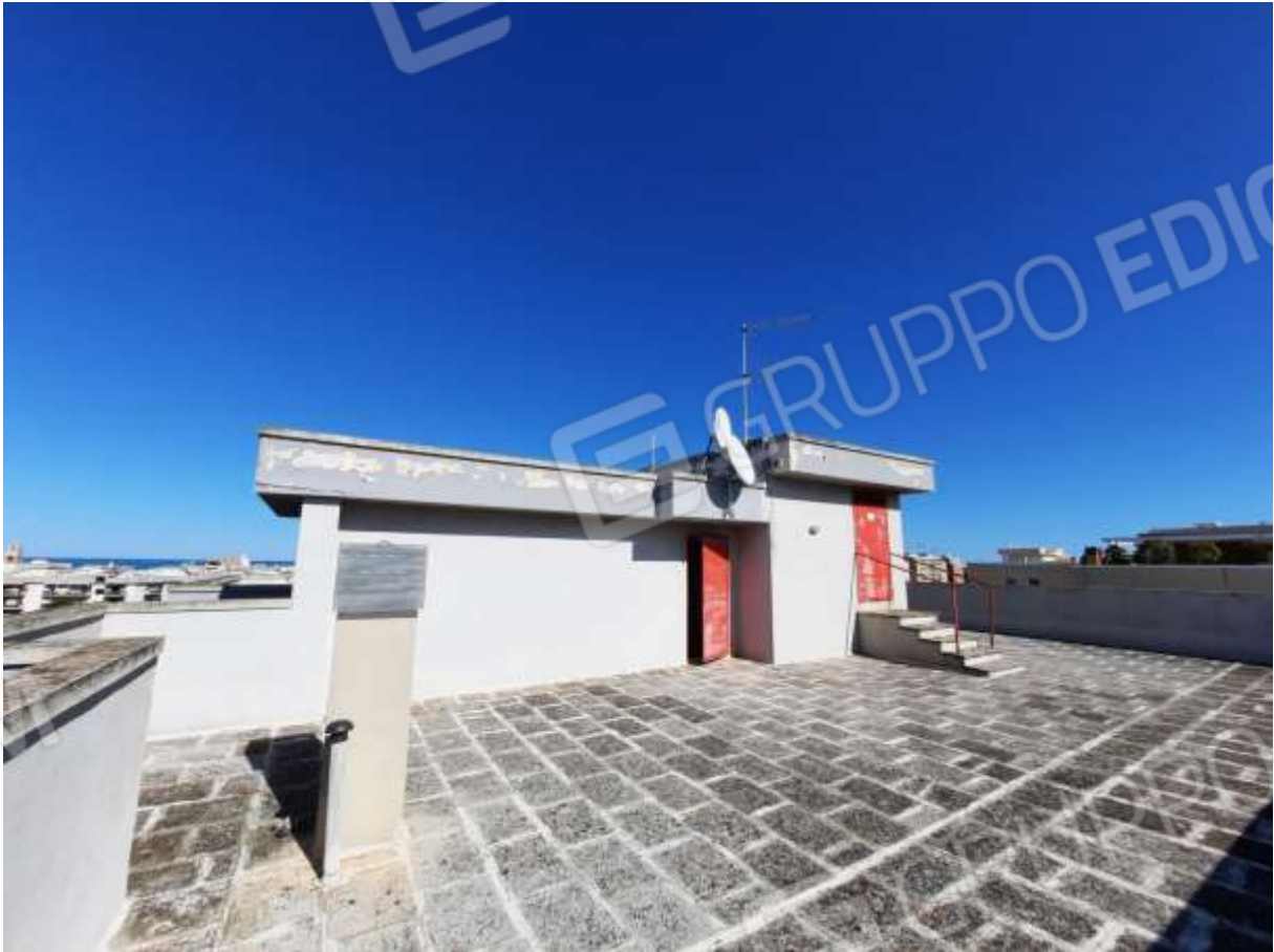
FOTO n° 2. Lastrico solare dell'edificio con accesso dal civico 6 di via G. Antonelli. Vista del torrino scala e del torrino ascensore, verso la direzione est.