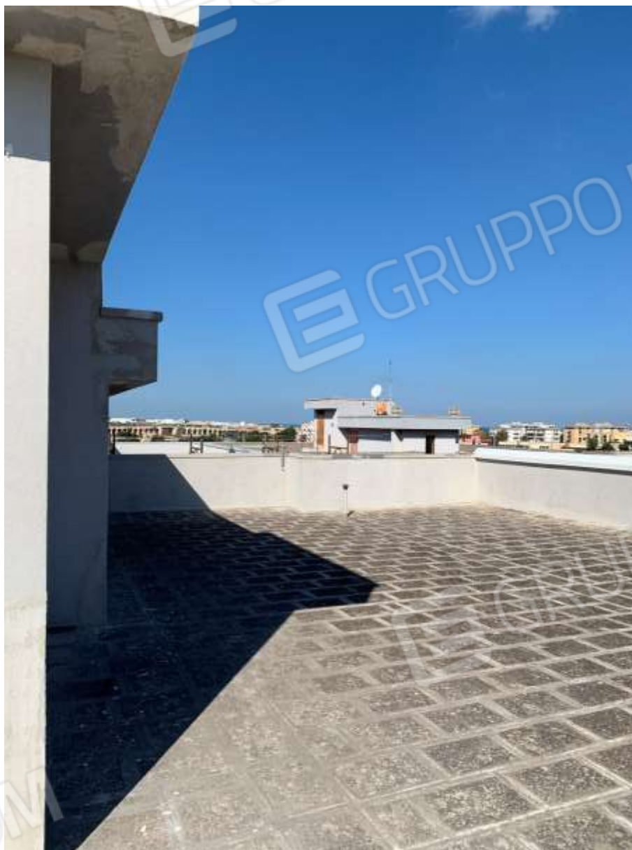
FOTO n° 5. Come foto nn° 2-3-4. Vista della porzione nord-est del lastrico solare.