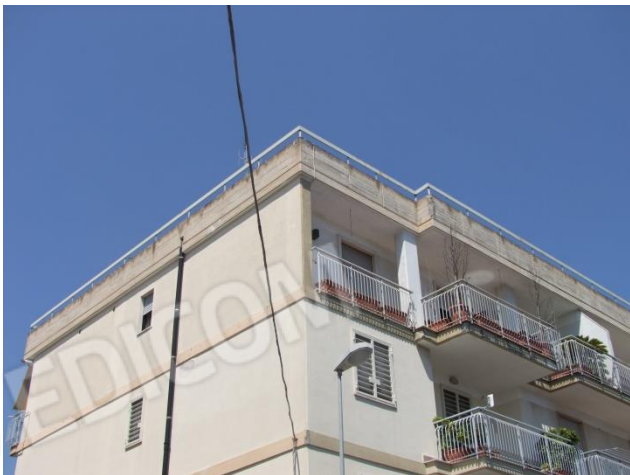
Foto 3 – Particolare prospetto principale, su via Martiri di via Fani, e laterale del Bene, su area condominiale