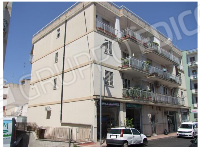
Foto 2 – Vista angolare dell'edificio: prospetto principale su via Martiri di via Fani e prospetto laterale su area condominiale