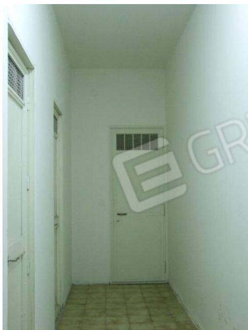
Foto 8 - Vista verso la porta d'ingresso alla cantinola