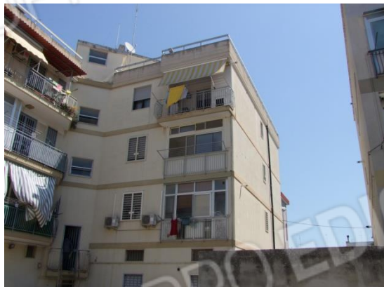
Foto 6 - Vista del prospetto posteriore e laterale Ovest dell'edificio e del Bene ubicato al piano 3°