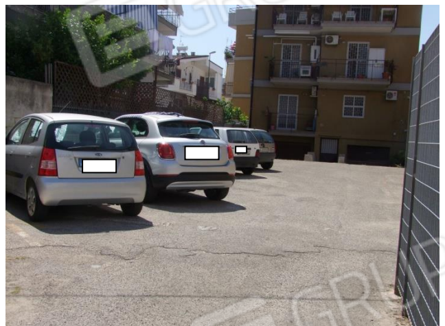
Foto 4 – Vista, dal cancello d'ingresso, del cortile condominiale interno all'edificio