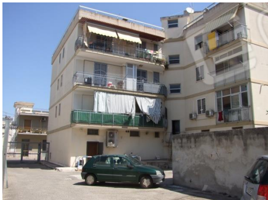
Foto 5 - Vista dei prospetti interni e posteriori dell'edificio