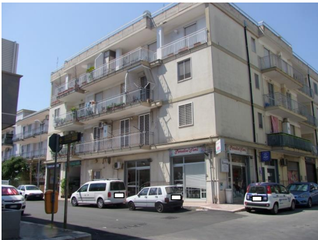
Foto 1 – Vista angolare dell'edificio: prospetto principale su via Martiri di via Fani e prospetto laterale su via Capurso