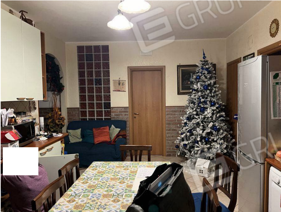
Foto 11 - Vista interna cucina pranzo verso la stanza da letto L1