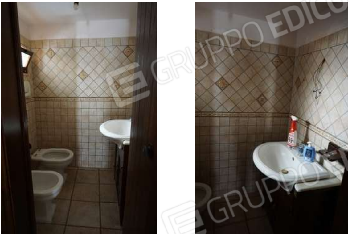
Figg.6-7 – Vista su bagno