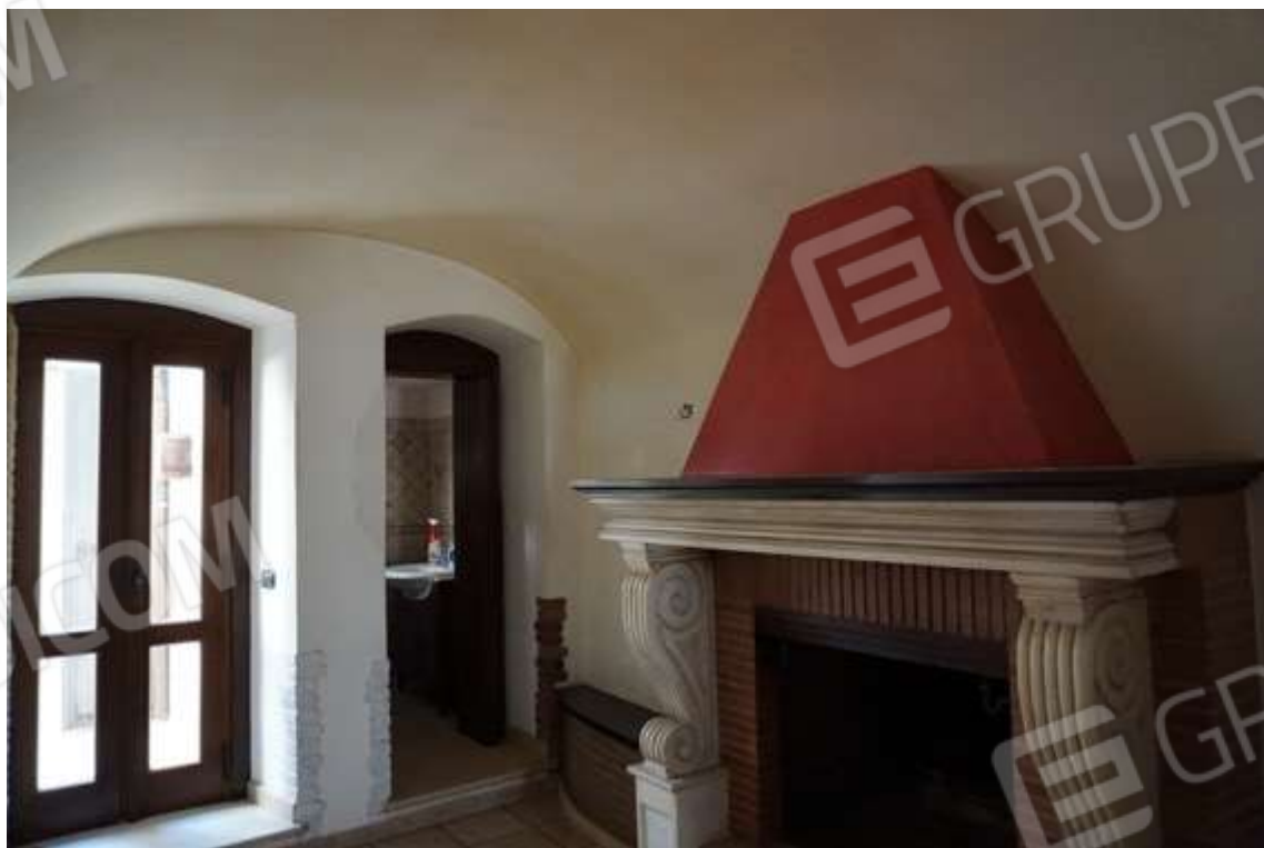
Fig.5 Vano d'ingresso con vista su bagno e cortile esterno