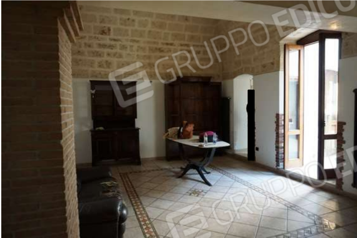
Fig.8 – Vista da ingresso verso vano giorno, con copertura a padiglione, e varchi vano cucina e cortile