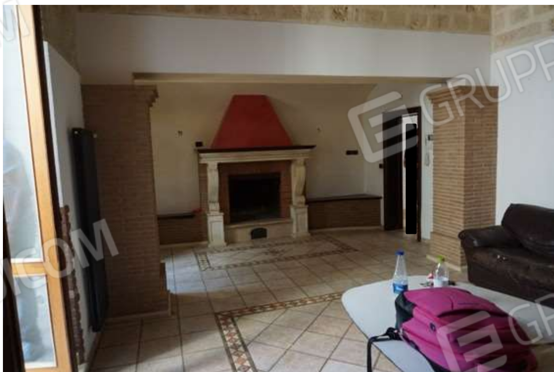
Fig.8 – Vista Ingresso da vano giorno con copertura a padiglione