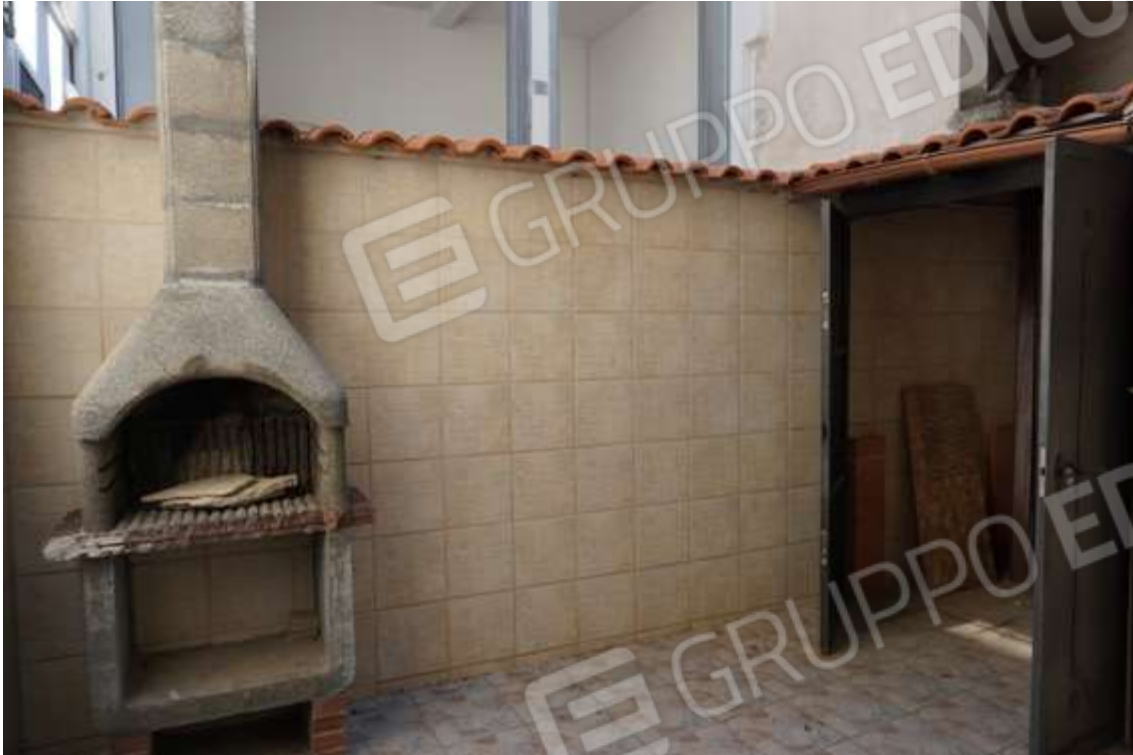
Fig.10 – Vista su cortile