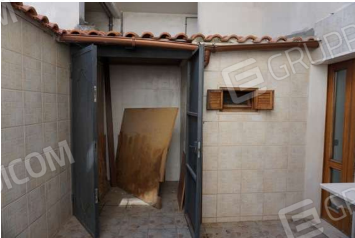
Fig.11 – Vista su cortile di vano bagno e vano uso ripostiglio esterno.