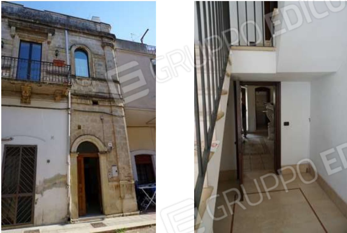
Fig.3-4 – Accesso da civico n.11 di Via Capitano Sauro e porta d'ingresso immobile