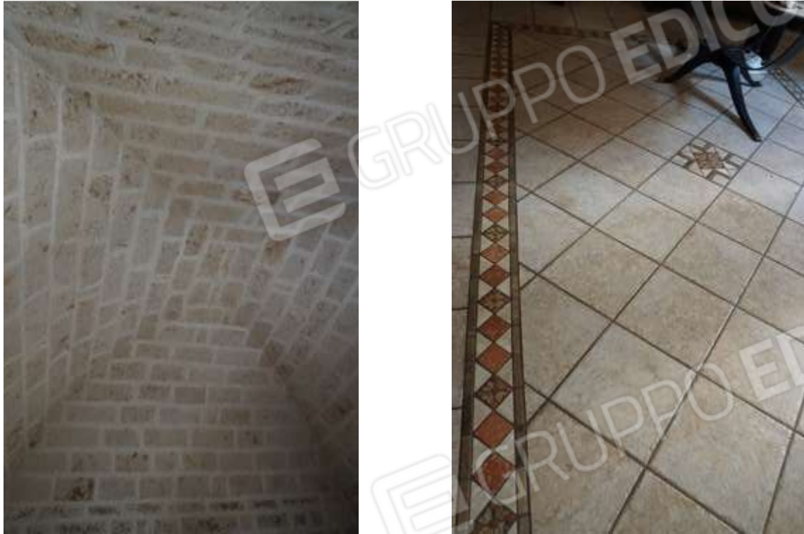
Fig.15-16 – Vista di dettaglio su volta a padiglione e pavimento ceramico del vano giorno uso salone