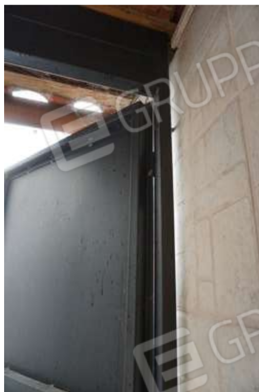
Fig.13-14 – Dettaglio portafinestra cucina che prospetta su cortile e infisso di chiusura vano uso ripostiglio