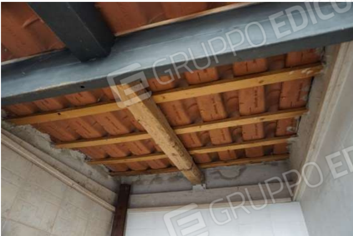
Fig.12 – Vista interna vano uso ripostiglio esterno.