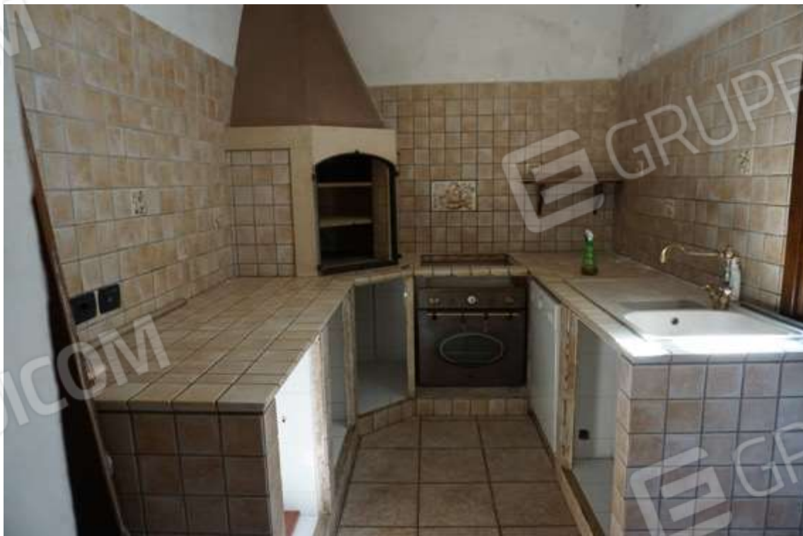
Fig.9 – Vista su cucina.