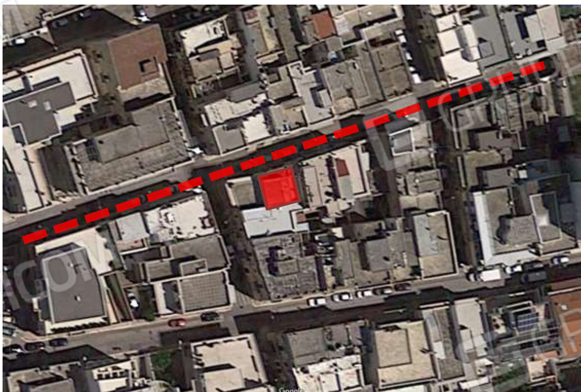
Fig.2 – Vista dall’alto dell’Immobile con individuazione asse viario di Via C. Sauro