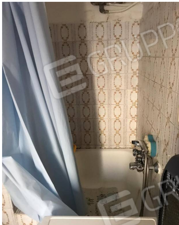
Veduta verso via Ludovico Ariosto. Bagno.

Tribunale di Bari - Sez. Esecuzioni Imm.ri - Procedura n. R.G.E. 90/2023- G.E. Dott.ssa Cavallo.