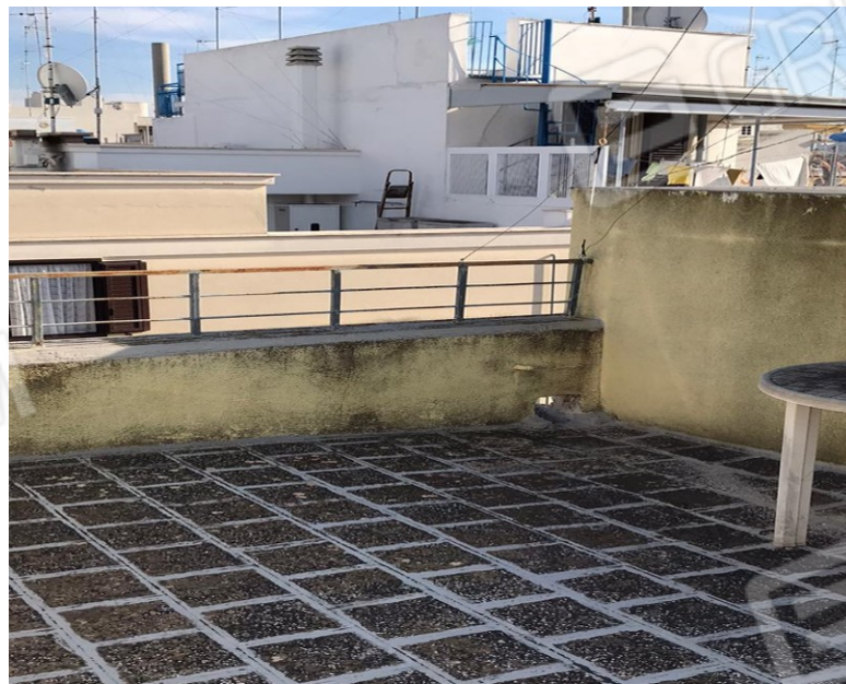
Vedute del lastrico solare.

Tribunale di Bari - Sez. Esecuzioni Imm.ri - Procedura n. R.G.E. 90/2023- G.E. Dott.ssa Cavallo.