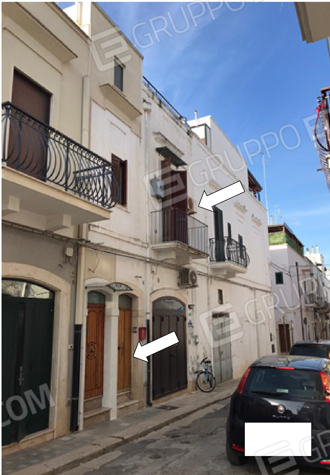
Veduta panoramica del prospetto su via L. Ariosto. Le frecce indicano il portoncino esclusivo di accesso e il balcone.

E.mail: danielepicerno@libero.it - PEC: daniele.picerno7172@pec.ordingbari.it