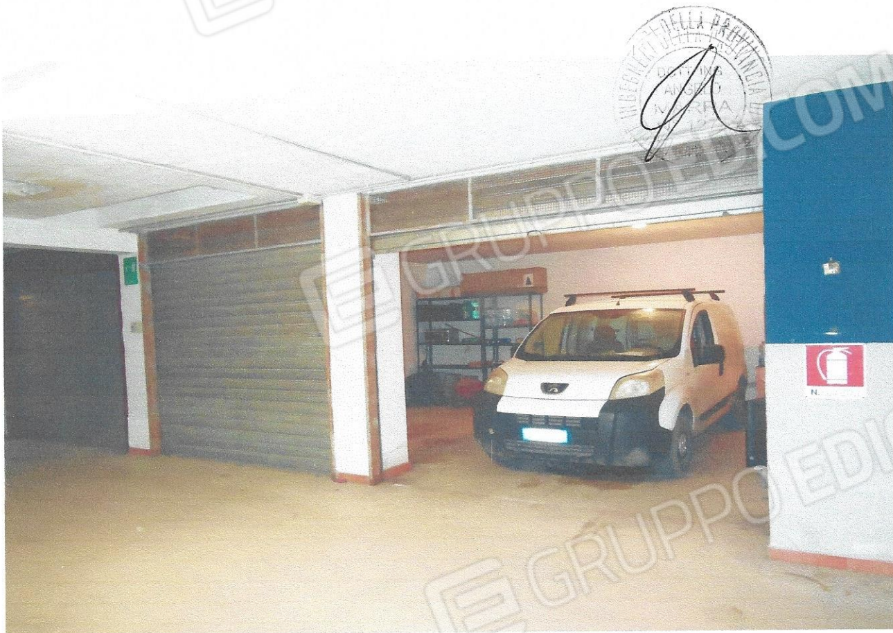
15 – Part. box (livello interrato edificio)