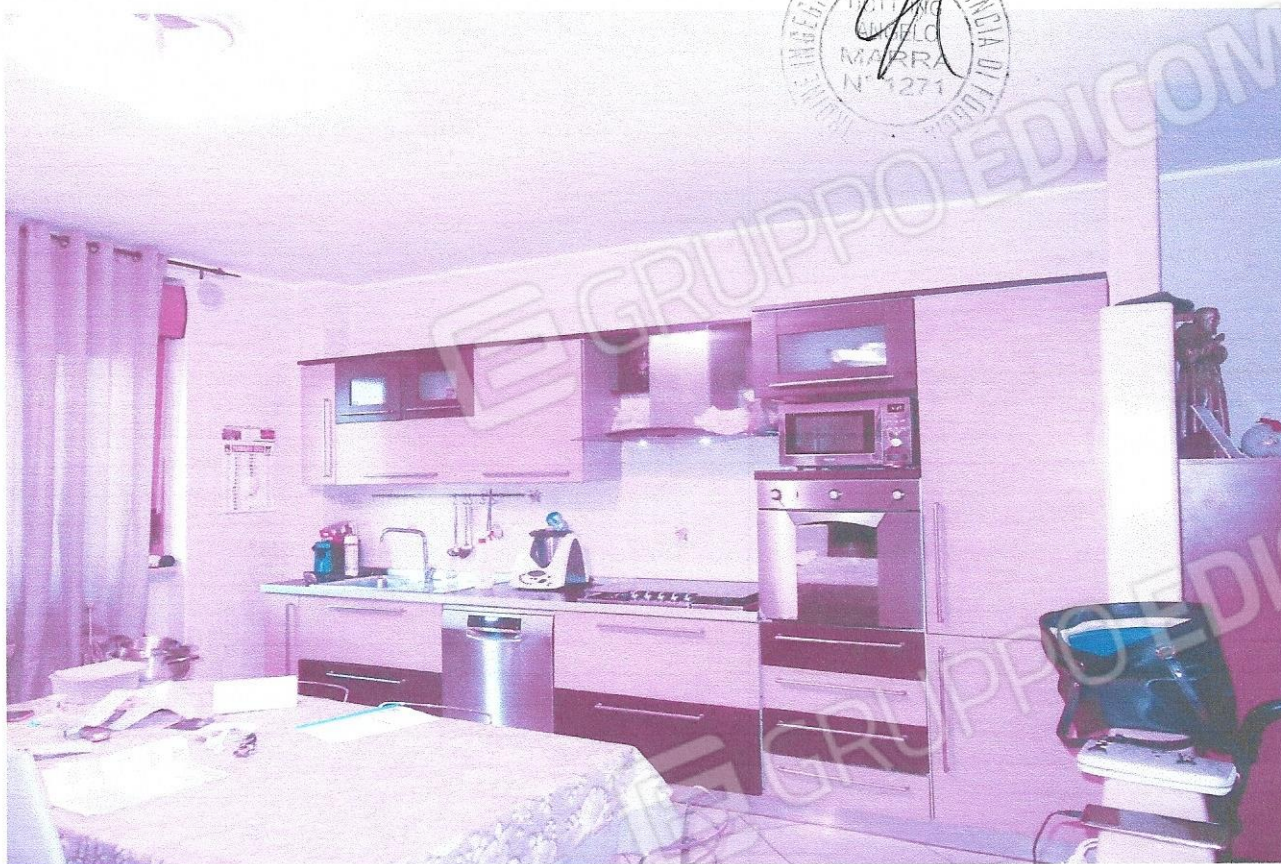
3 – Part. ambiente cucina ( primo livello appart.)