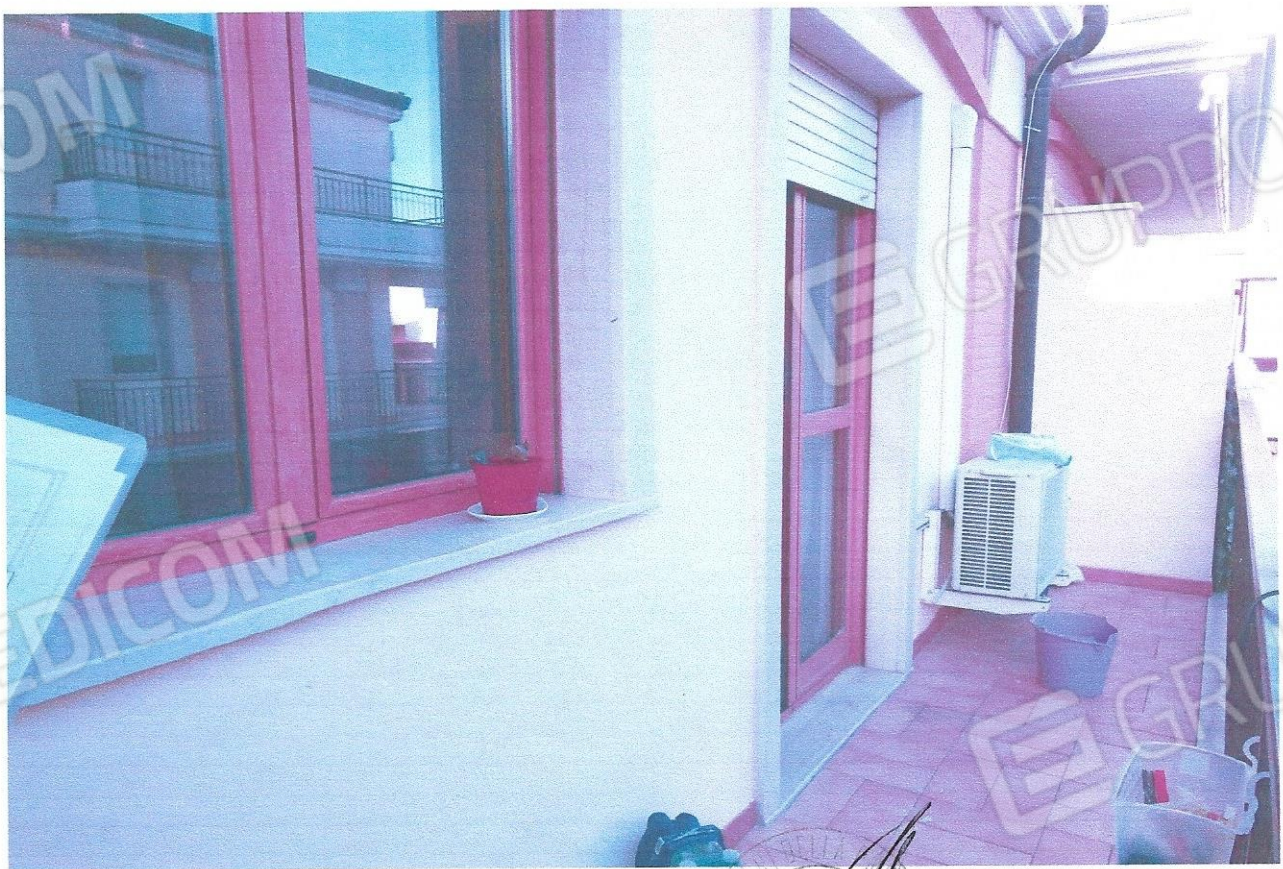
6 – Part. balcone (primo livello appart.)