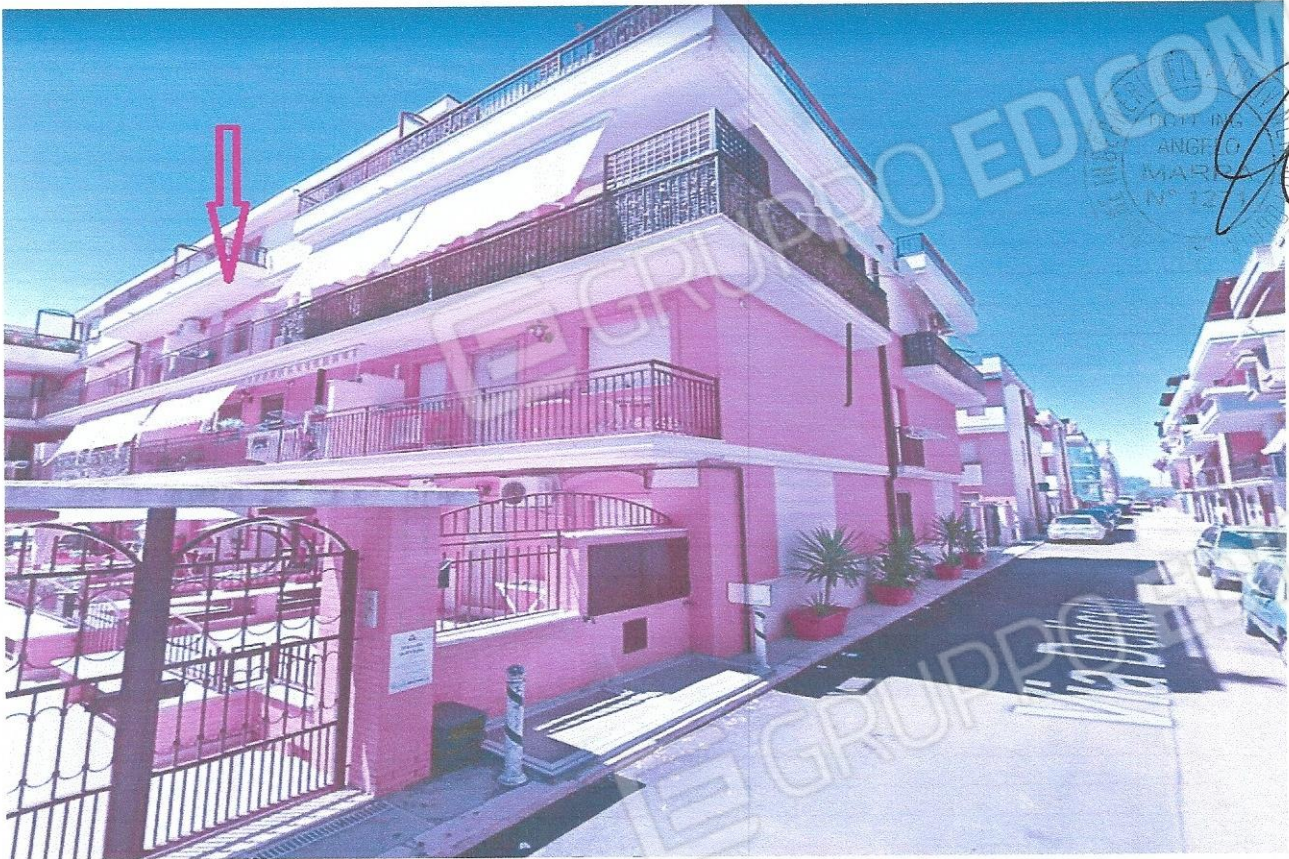
1 – Part. prospetto edificio (appart. + box) via Deliceto n. 1/D