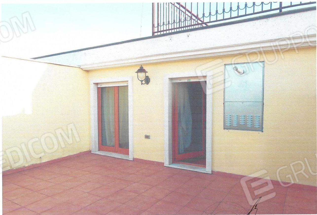
14 – Part. terrazzo (secondo livello appart.)