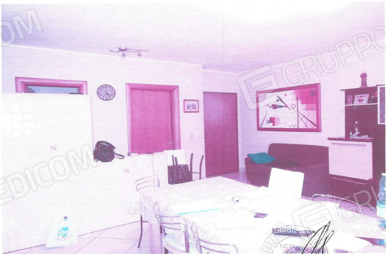
2 – Part. ambiente soggiorno-pranzo (primo livello appart.)