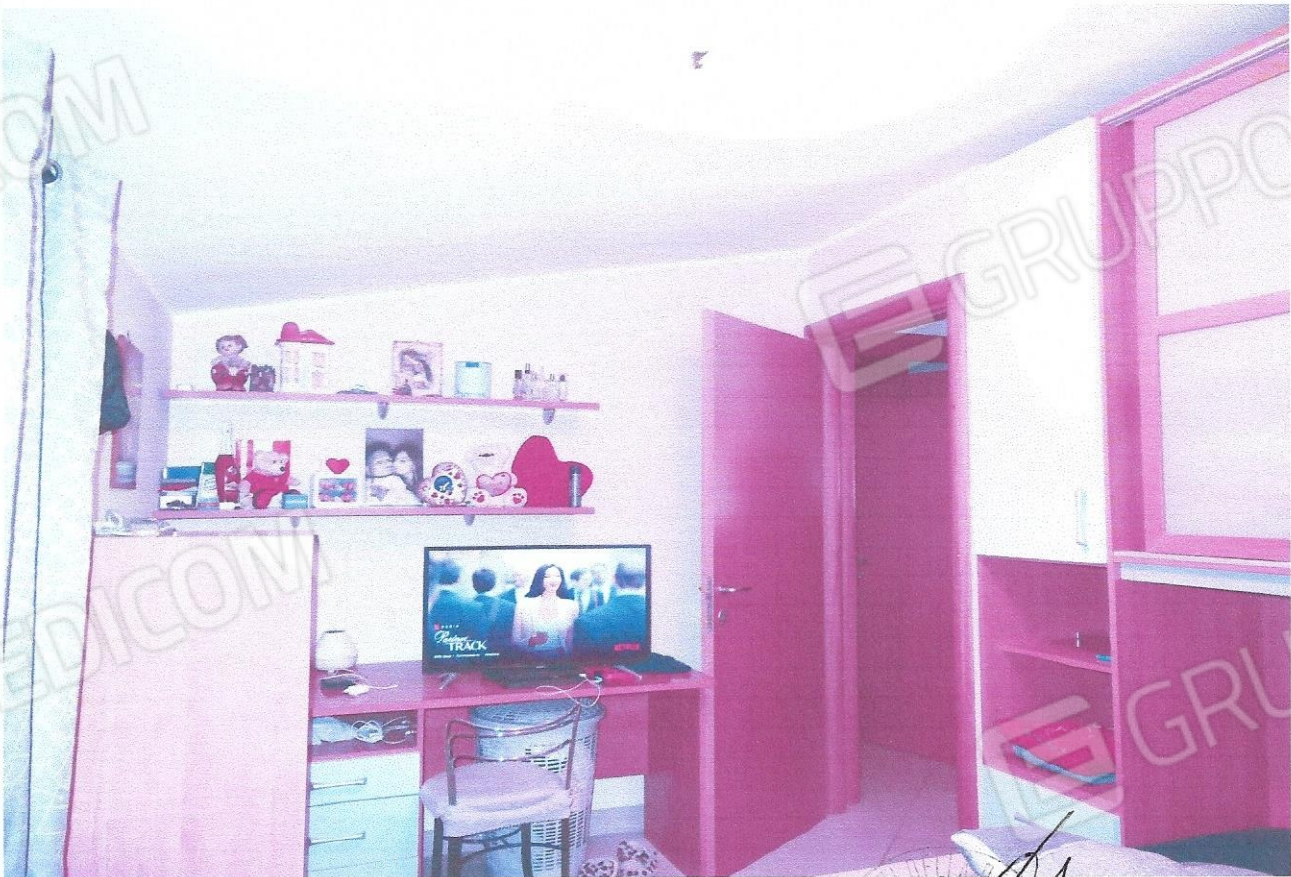
10 – Part. cameretta (secondo livello appart.)