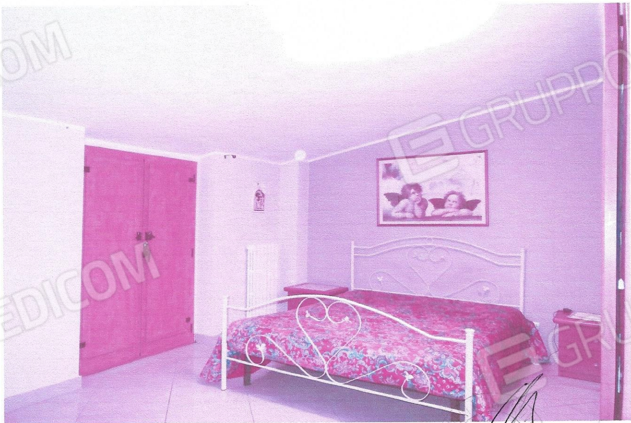
8 – Part. camera da letto matrimoniale (secondo livello appart.)

INGEGNERIA DOTT. ING. ANGELO MARRA N° 1271