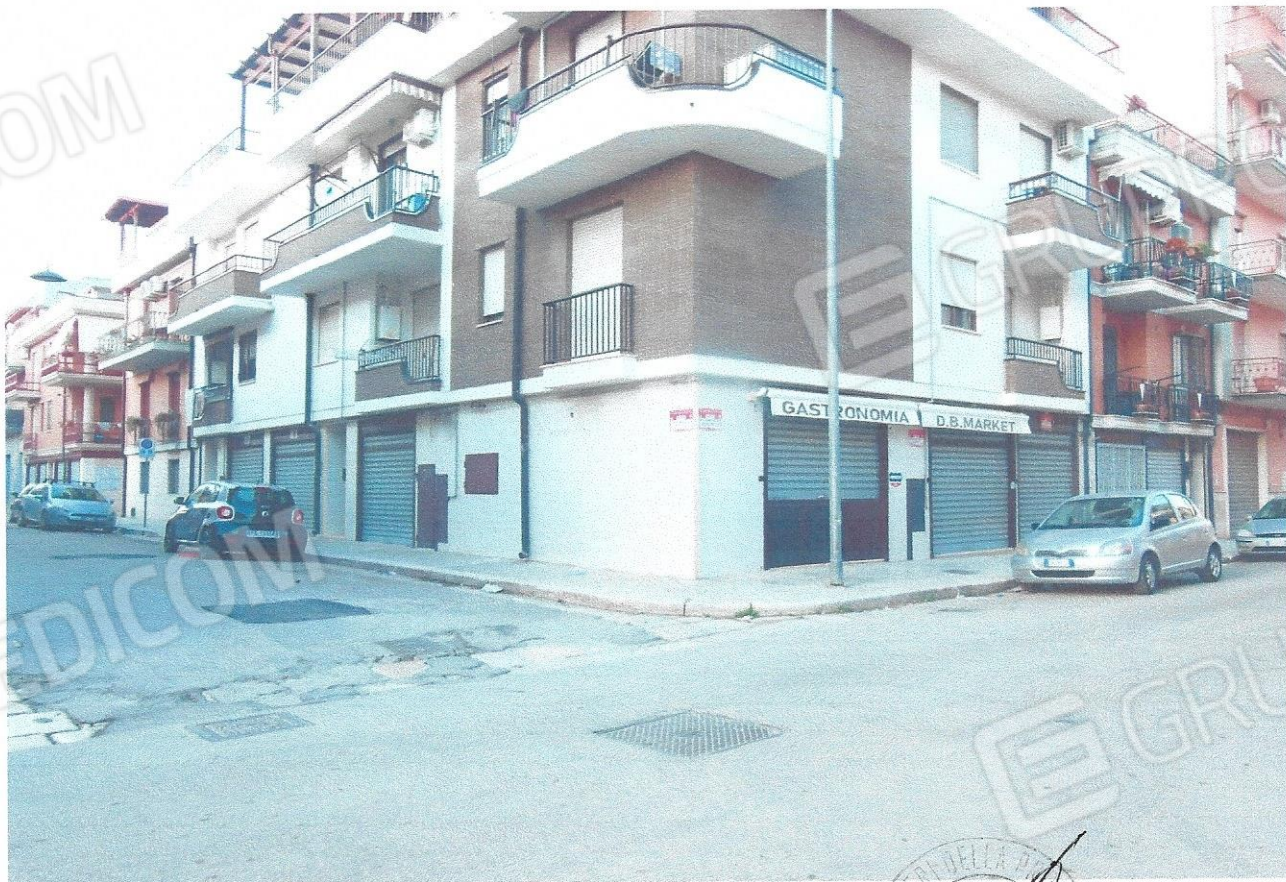
16 – Part. prospetto edificio (negozi) via Rodi n. 13