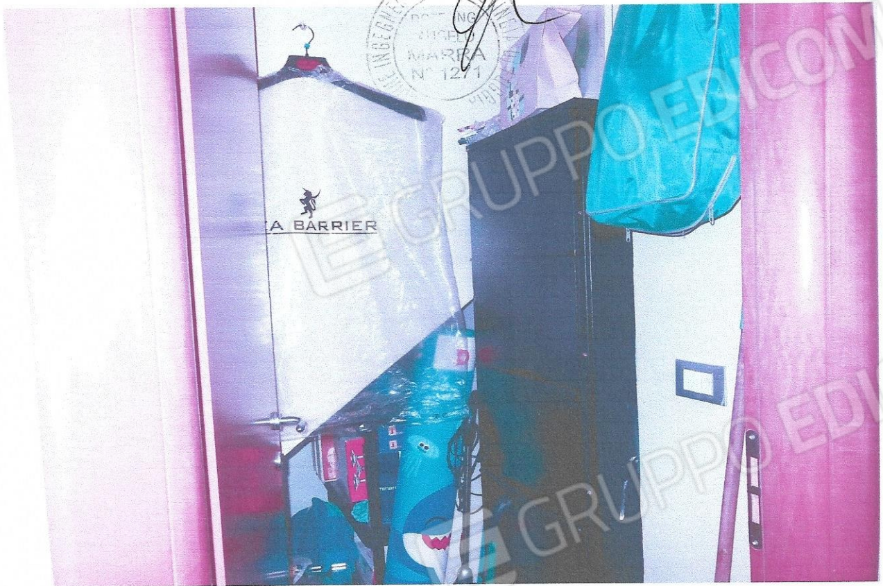
5 – Part. locale ripostiglio (primo livello appart.)