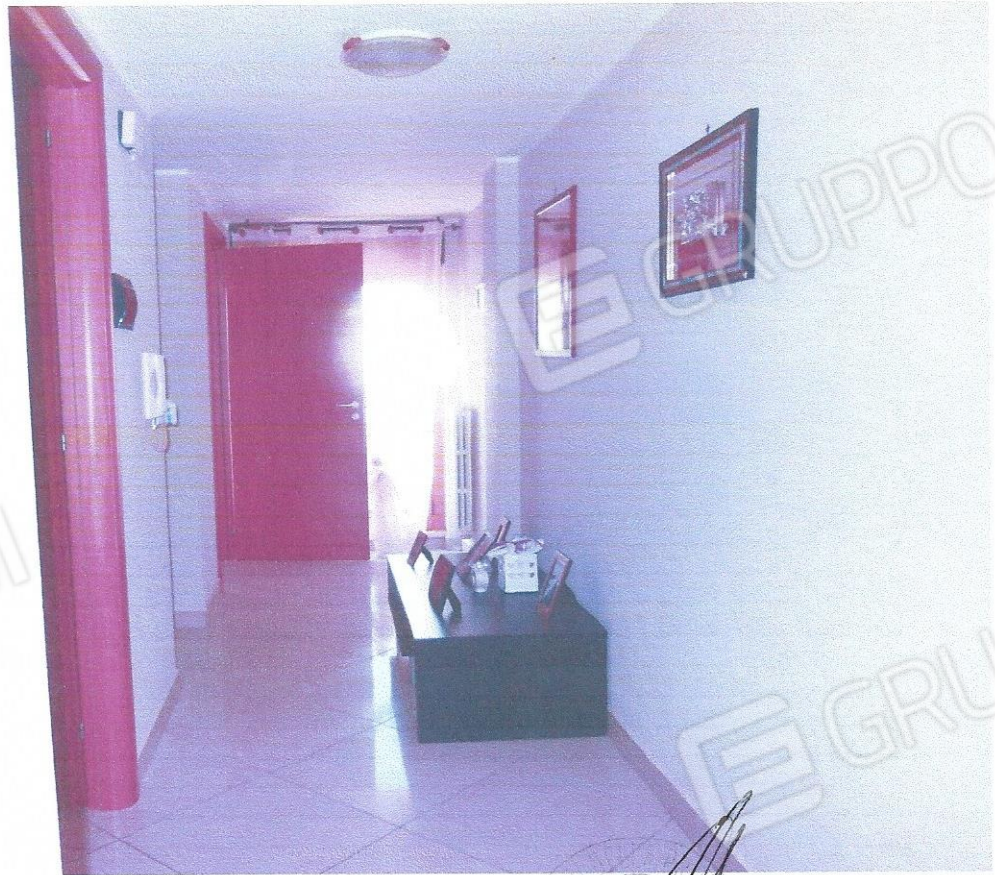
12 – Part. disimpegno (secondo livello appart.)