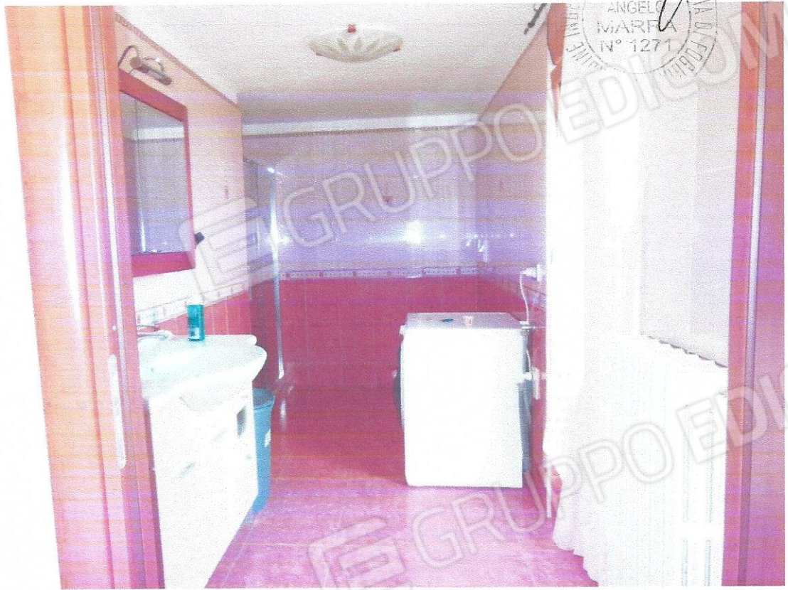
11 – Part. bagno padronale (secondo livello appart.)