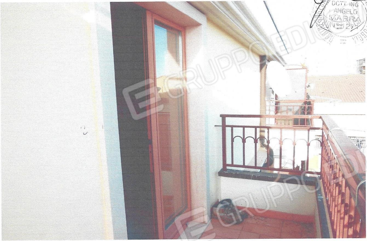
13 – Part. balcone tipo (secondo livello appart.)