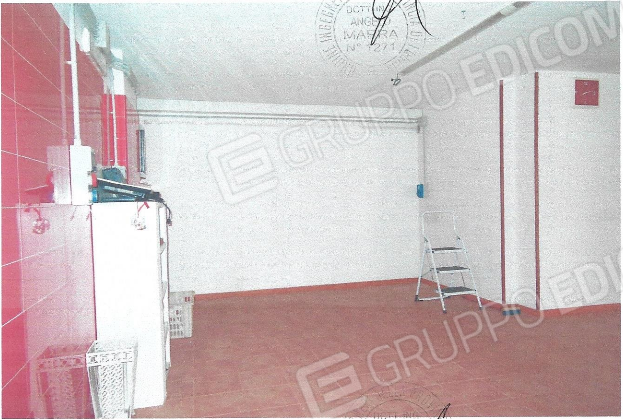
17 – Part. interno locale negozio