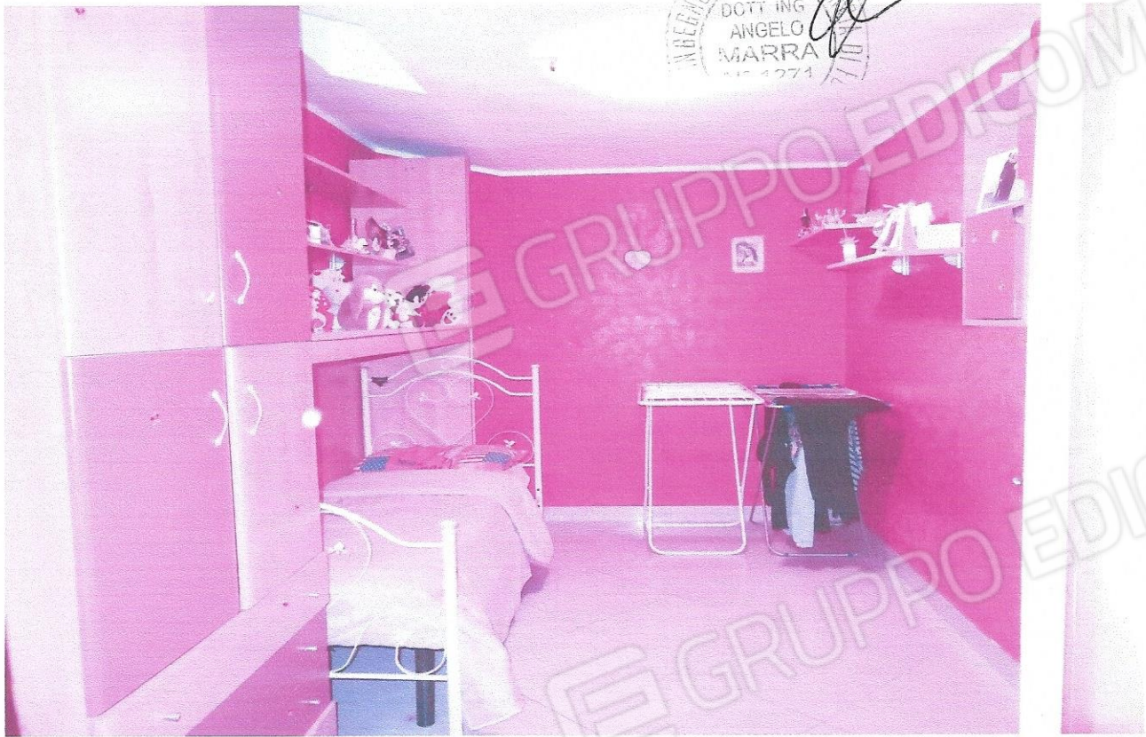
9 – Part. cameretta con lucernario (secondo livello appart.)