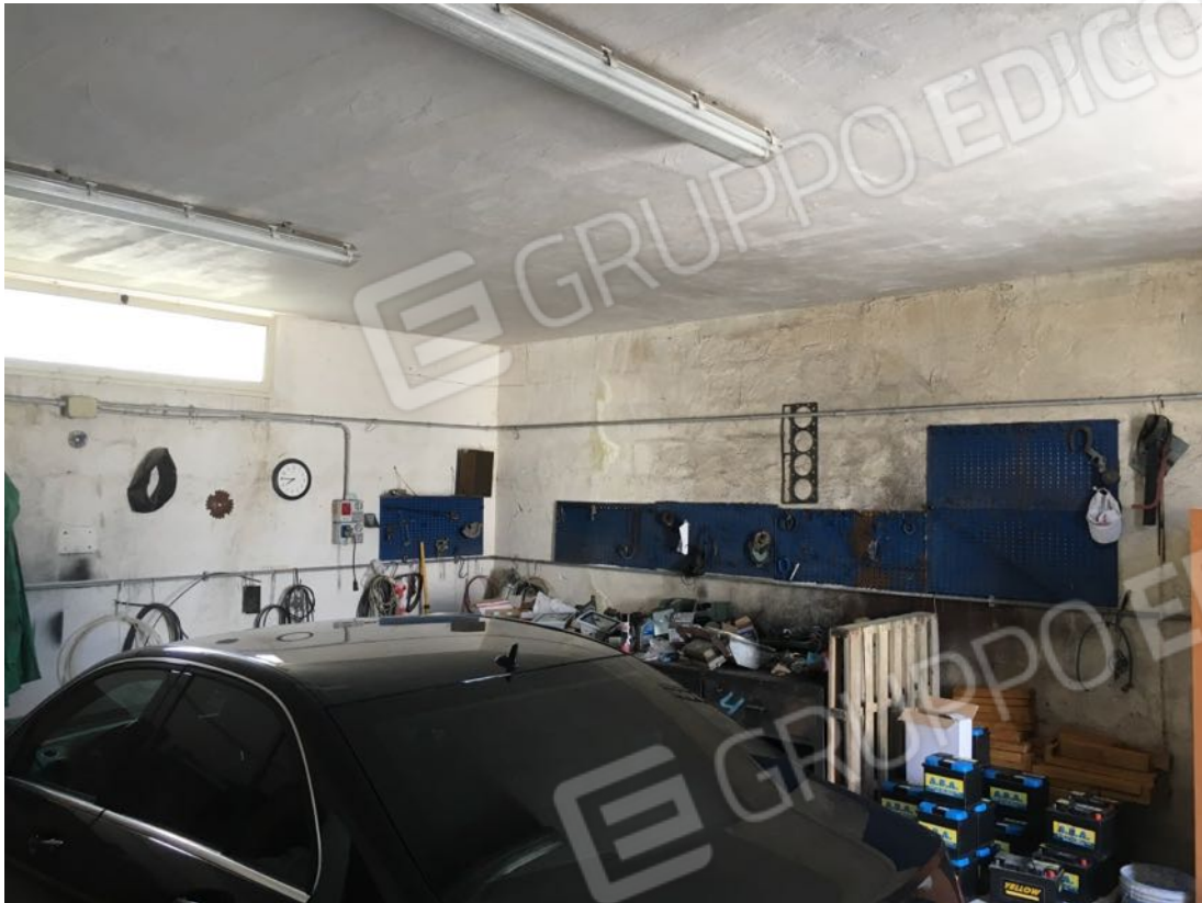
Località Calma n. 10 – Deposito A3 – interno officina (ingresso centrale)