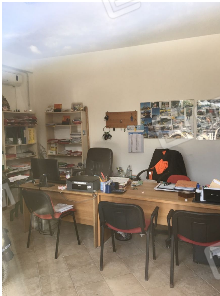
Località Calma n. 10 - (interni ufficio B)