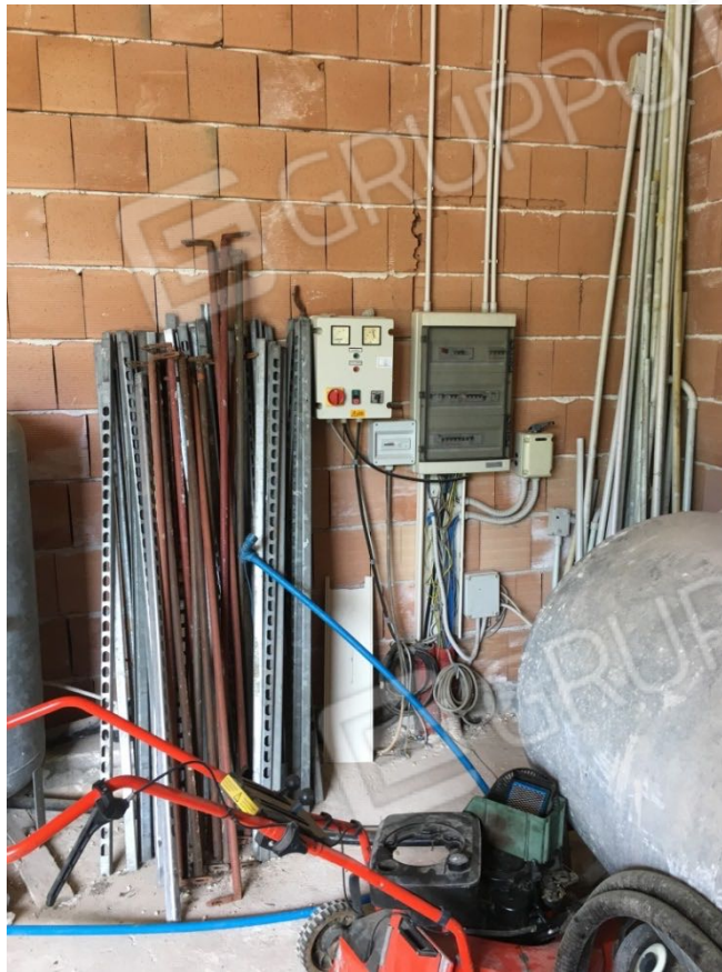
Località Calma n. 10 - Interni (fabbricato Deposito A1 su plan. catastale)