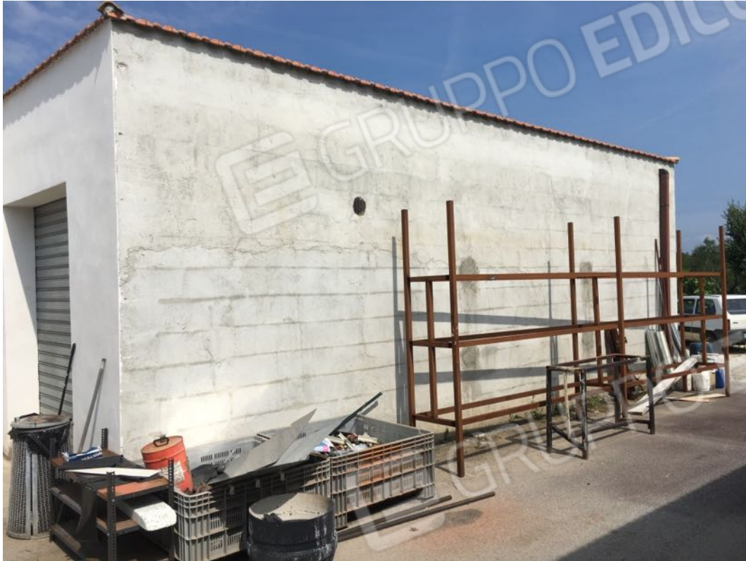
Località Calma n. 10 – Deposito A2 – Facciata nord-est