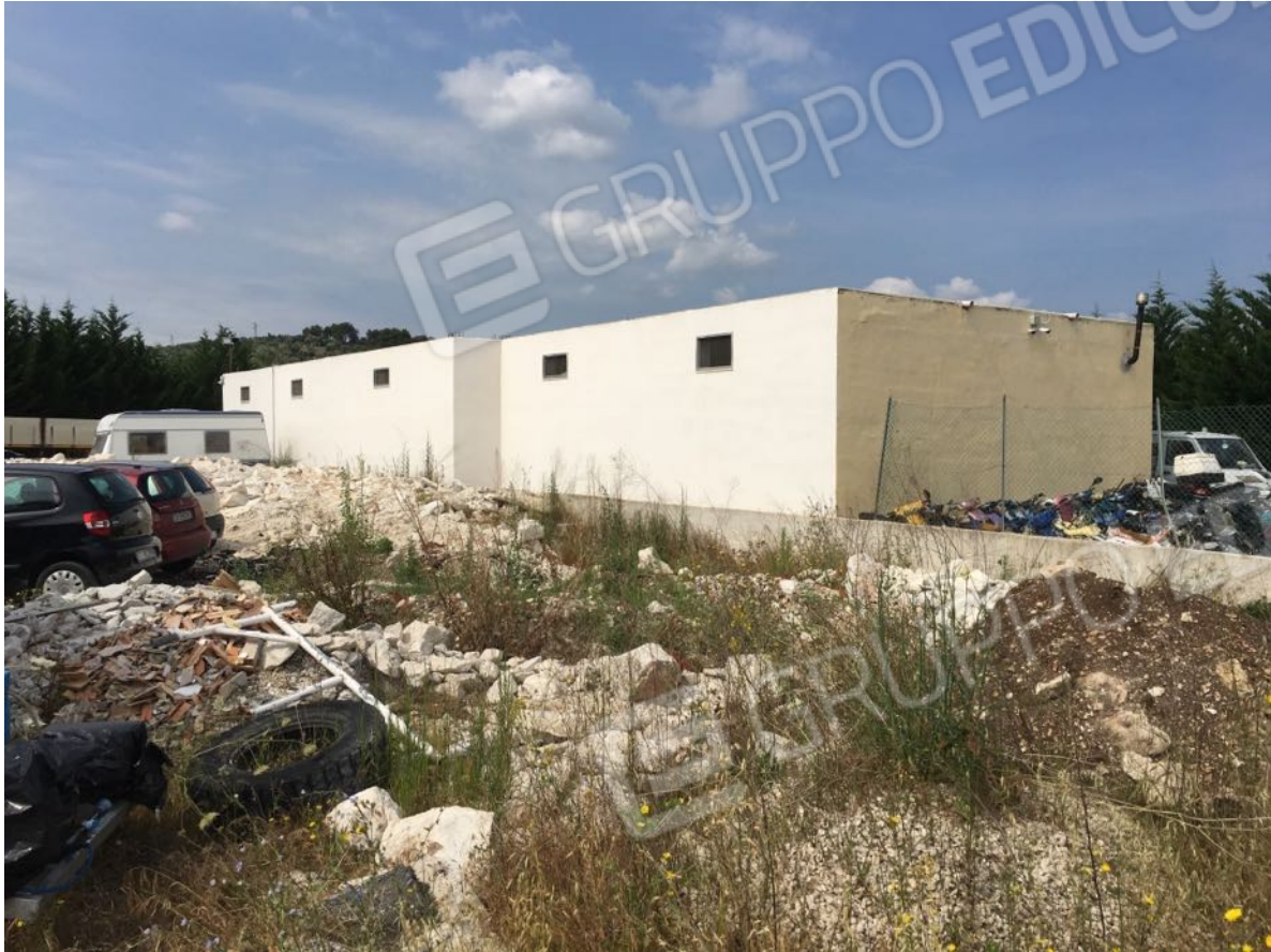
Località Calma n. 10 - Facciata Nord - Est (fabbricato Deposito A1 su plan. catastale)