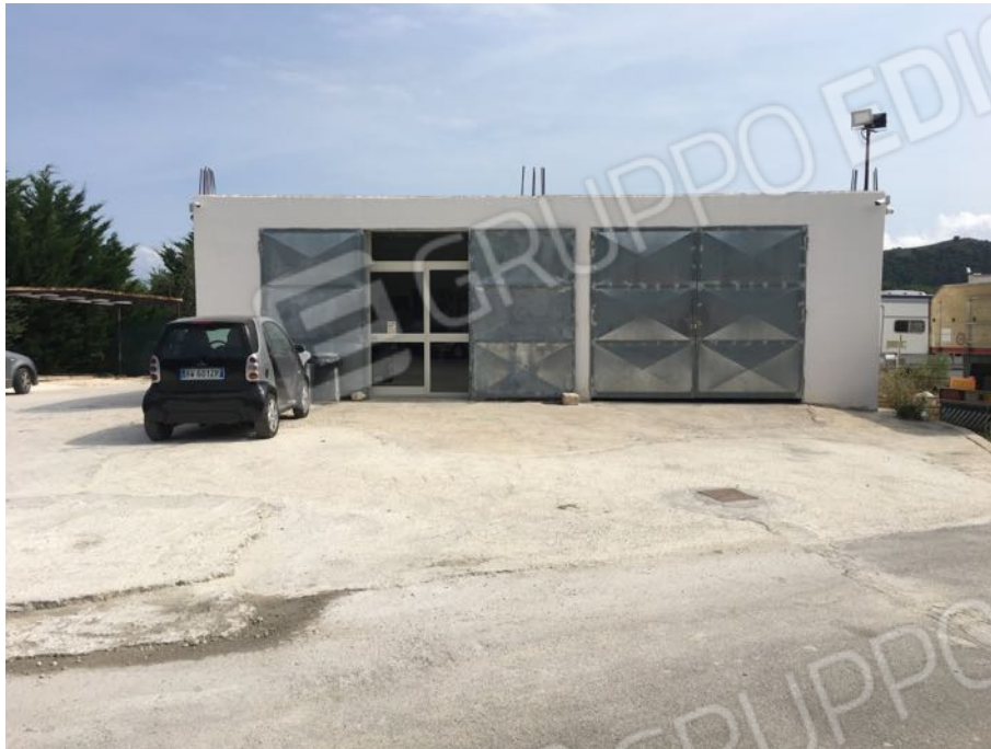
Località Calma n. 10 - Facciata Sud-Ovest (fabbricati Deposito A1 e Ufficio B su plan. catastale)