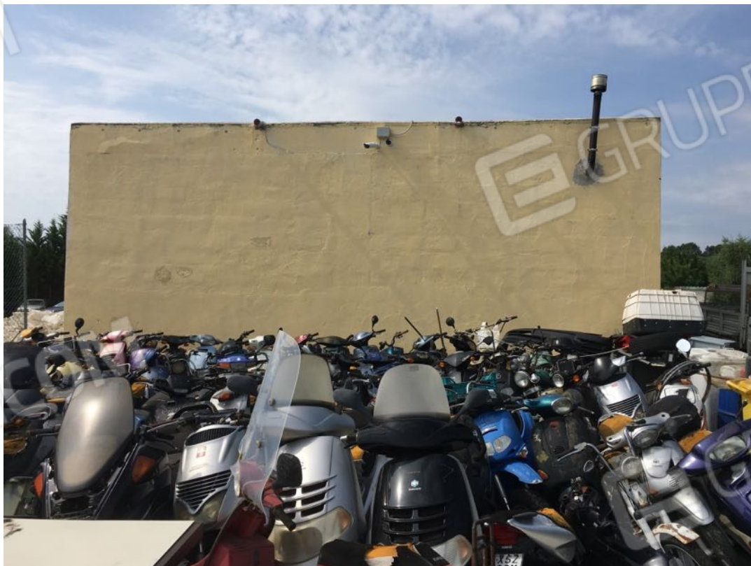
Località Calma n. 10 - Facciata Nord (fabbricato Deposito A1 su plan. catastale)