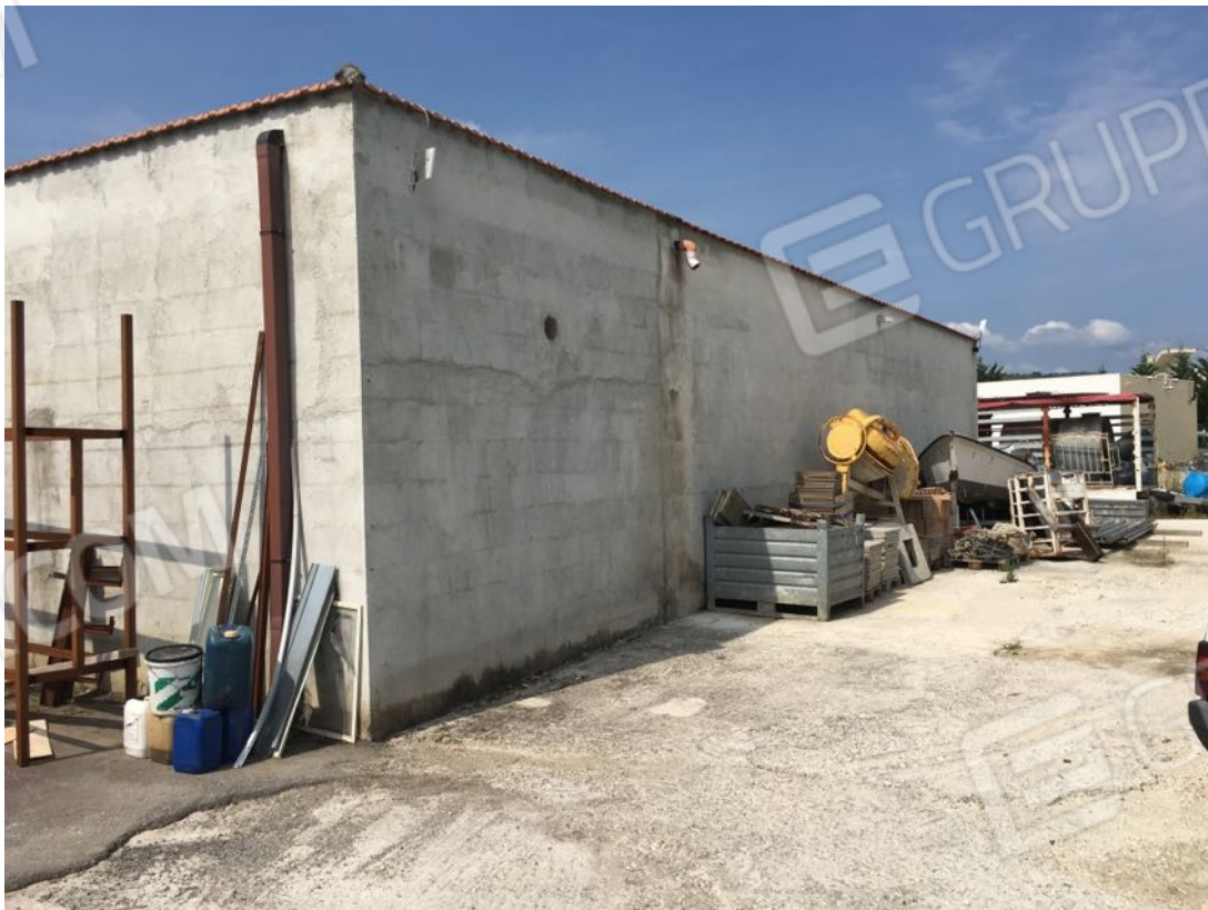
Località Calma n. 10 – Deposito A2 – Facciata nord