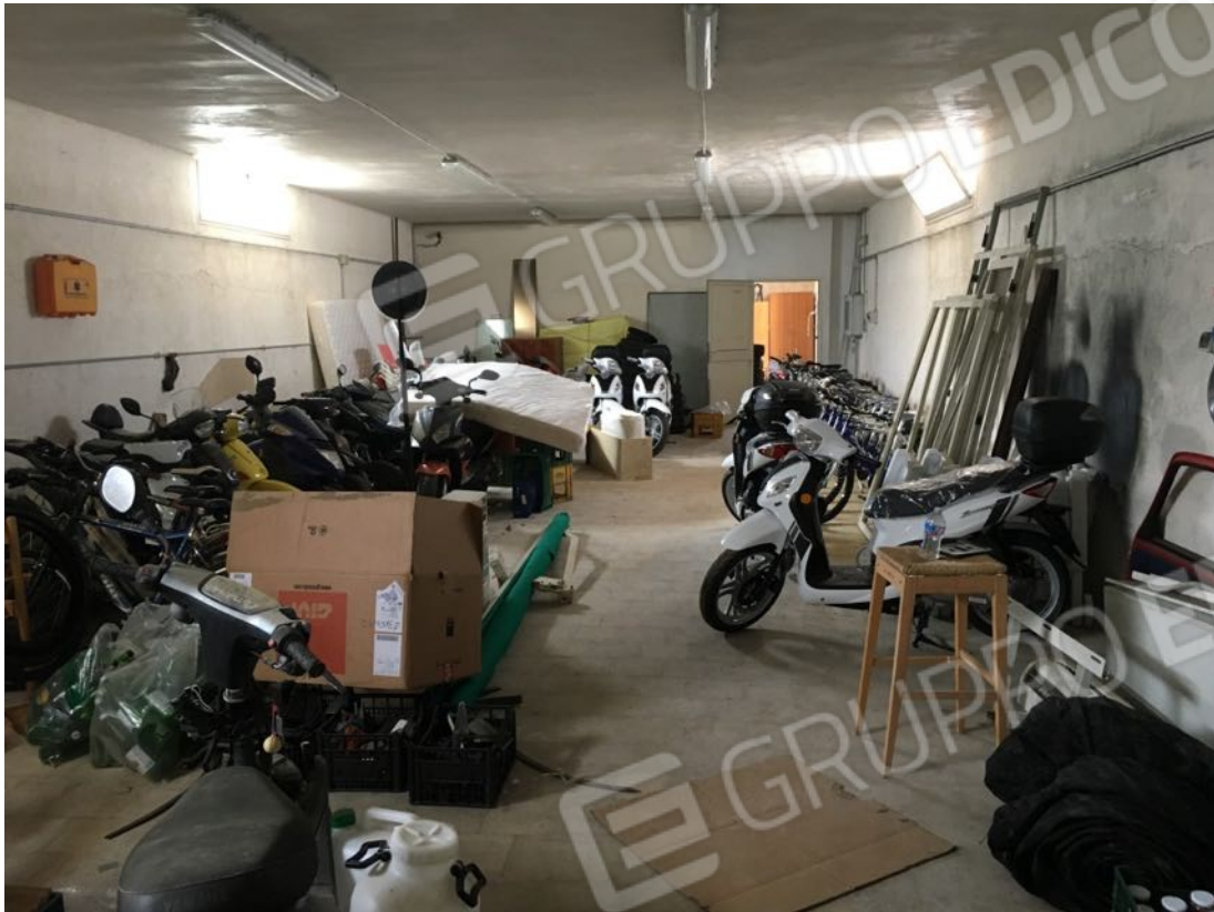
Località Calma n. 10 – Deposito A3 – interno zona centrale