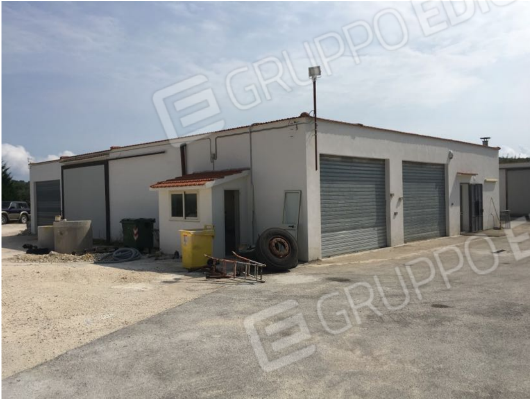
Località Calma n. 10 – Deposito A2 – Facciata sud-ovest

Località Calma n. 10 - Interni (fabbricato Deposito A1 su plan. catastale)