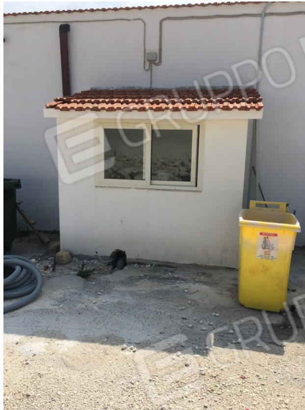
Località Calma n. 10 – Deposito A2 – esterno gabbiotto in costruzione