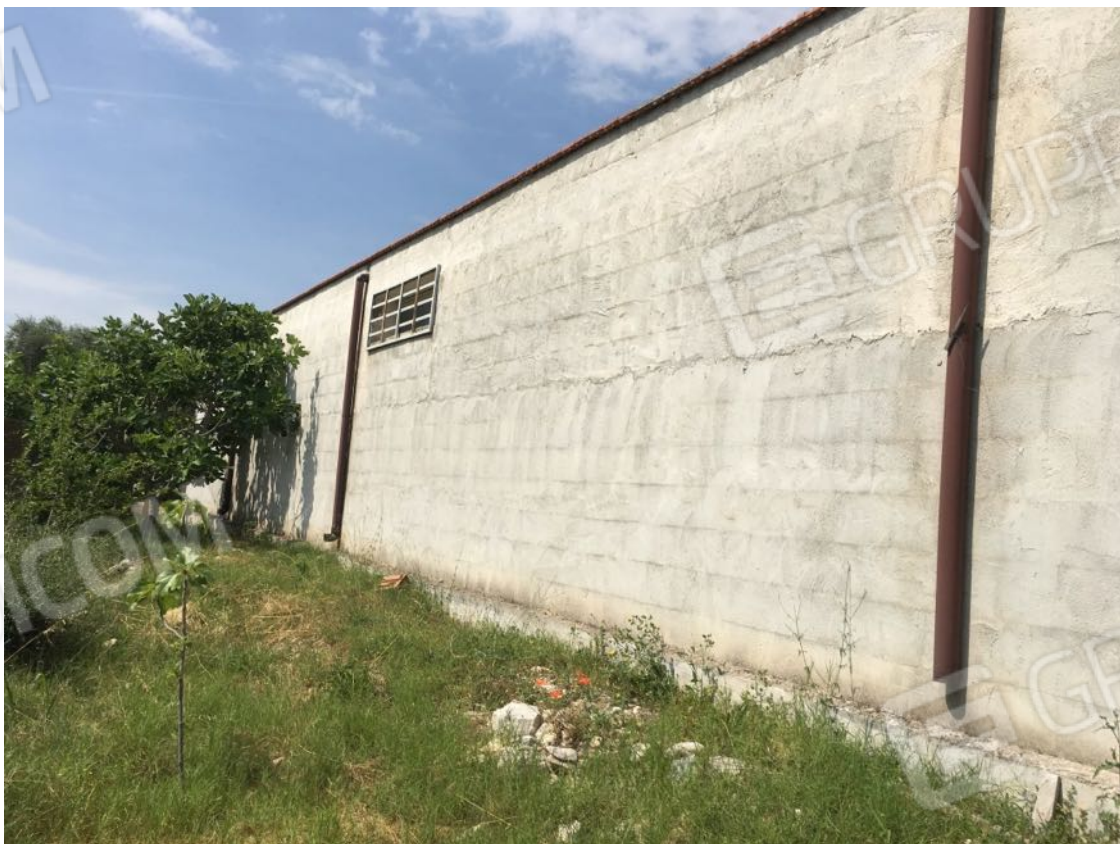
Località Calma n. 10 – Deposito A3 – facciata est