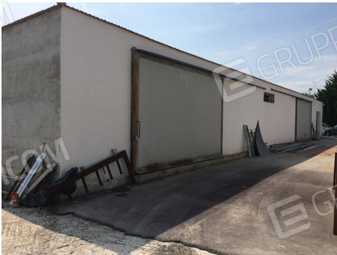
Località Calma n. 10 – Deposito A3 – facciata ovest (visuale completa)