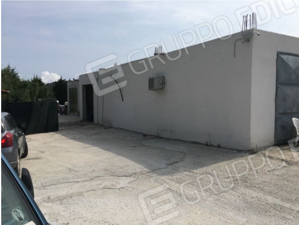
Località Calma n. 10 - Facciata Ovest (fabbricati Deposito A1 e Ufficio B su plan. catastale)