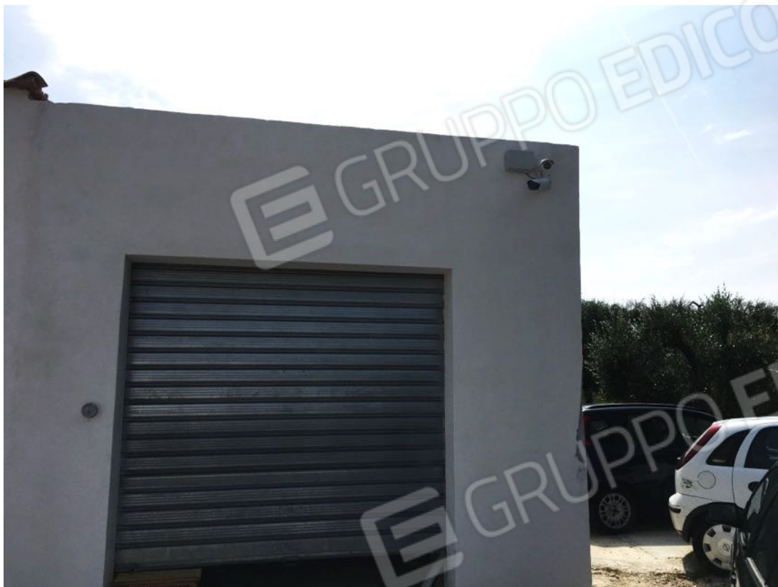
Località Calma n. 10 – Deposito A3 – facciata ovest (particolare impianto videosorveglianza)