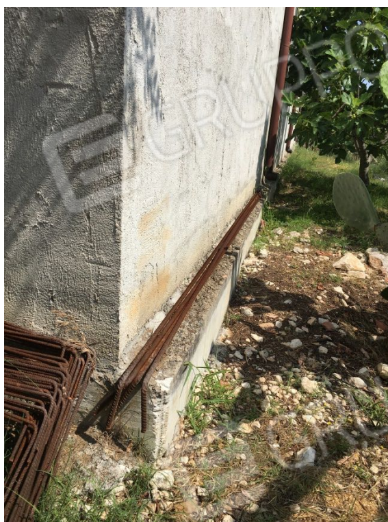
Località Calma n. 10 – Deposito A3 – facciata est (particolare fondazioni)