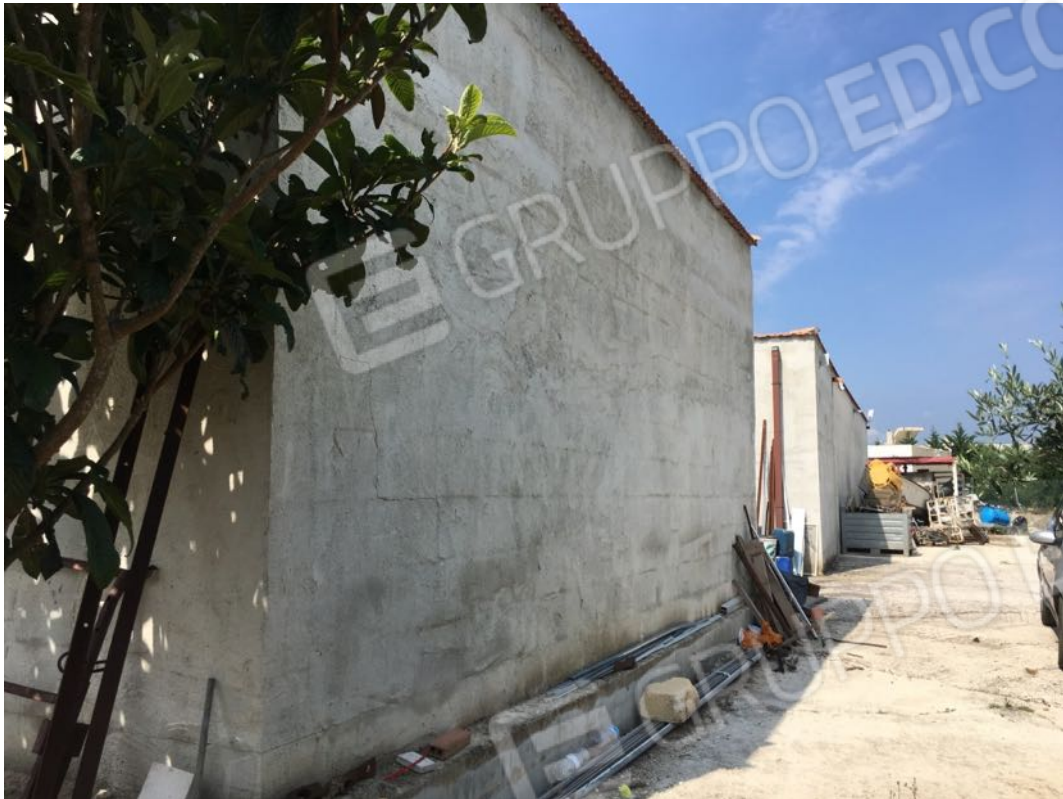
Località Calma n. 10 – Deposito A3 – facciata nord