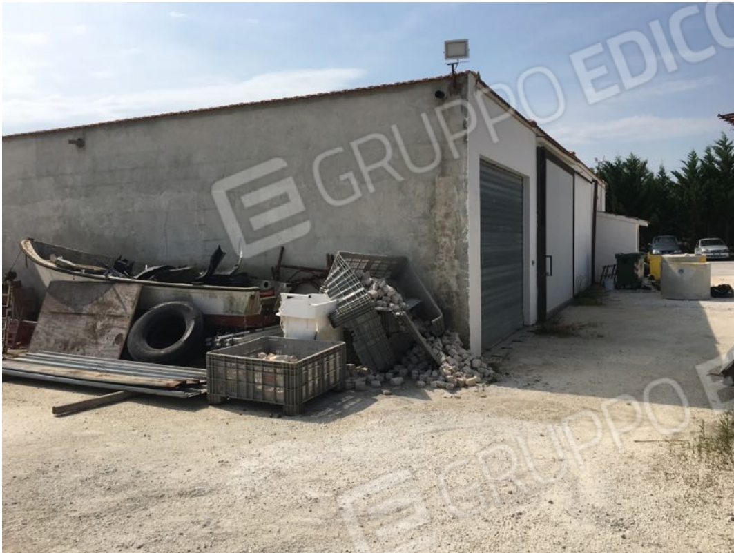
Località Calma n. 10 – Deposito A2 – Facciata nord-ovest