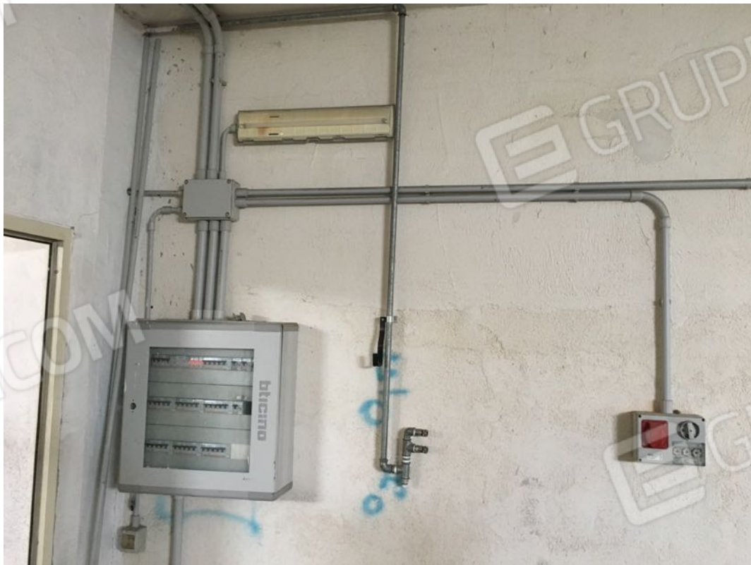
Località Calma n. 10 – Deposito A3 – particolare impianto elettrico