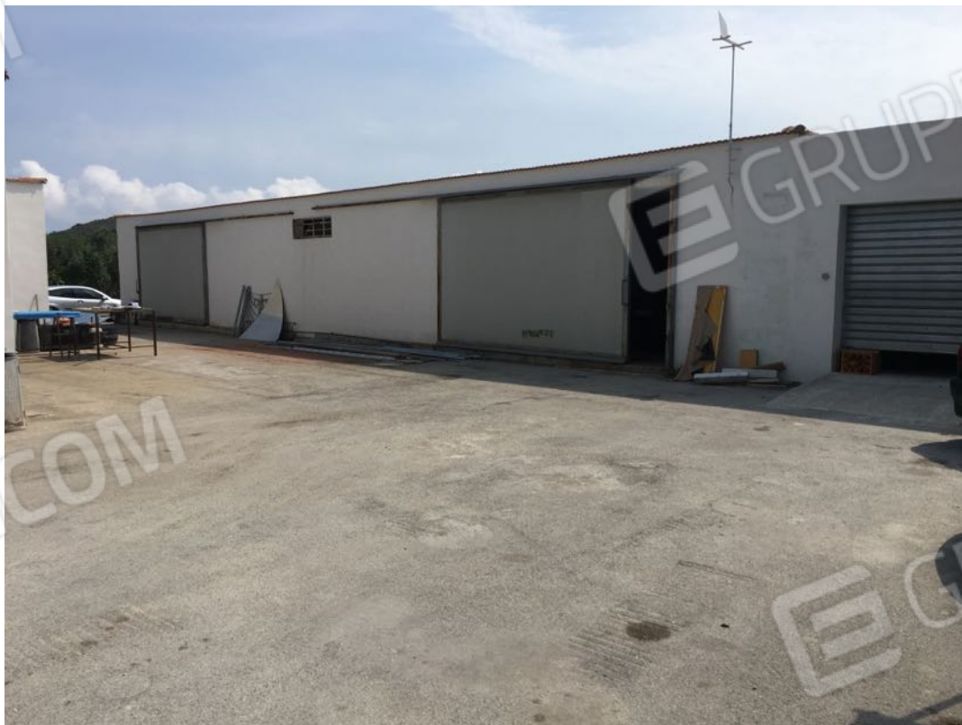
Località Calma n. 10 – Deposito A3 – facciata ovest