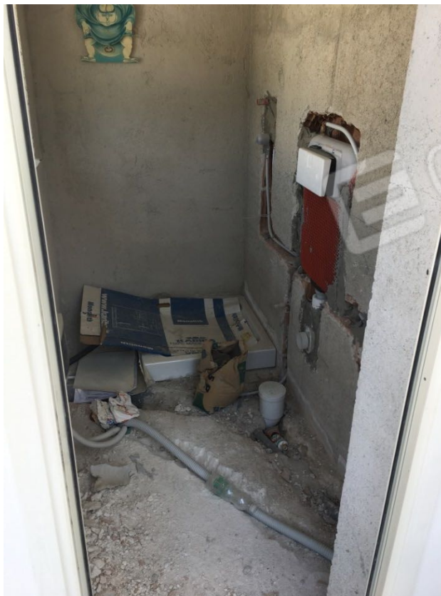
Località Calma n. 10 – Deposito A2 – interno gabbiotto in costruzione