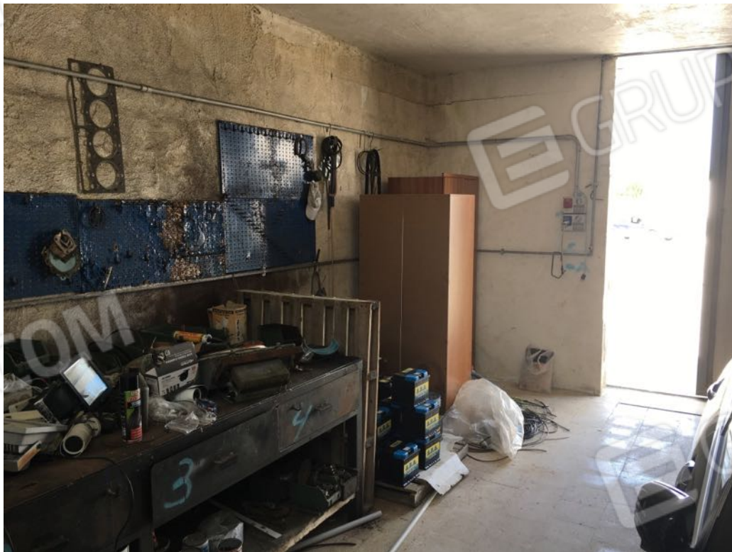
Località Calma n. 10 – Deposito A3 – interno officina (ingresso centrale)