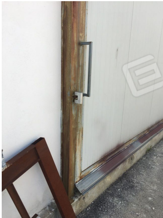
Località Calma n. 10 – Deposito A3 – (ingressi chiusi con lucchetto)