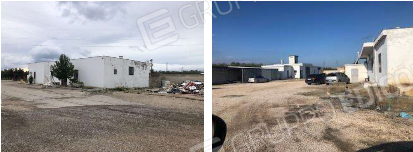
Vista da est e da sud ovest dell'edificio abusivo posto centralmente al lotto. Nella foto di destra si vede sulla sinistra anche l'edificio abusivo posto al vertice nord ovest.

c.f. FRZNN81R57A471W - Partita I.V.A. 04284360288