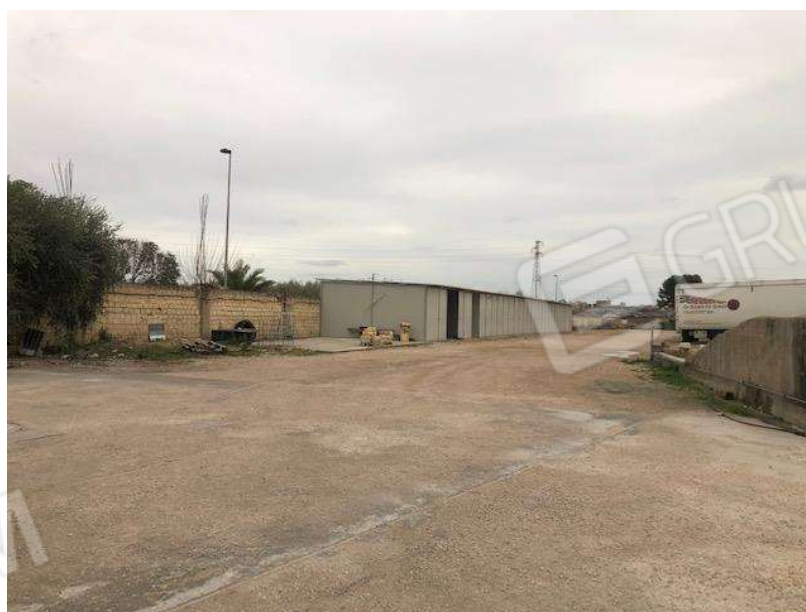
Container presenti lungo il confine nord