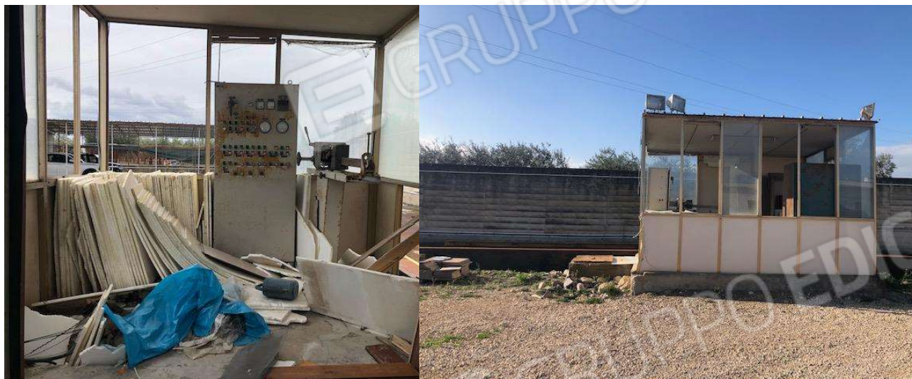
Pesa abbandonata presente lungo il confine ovest

c.f. FRZNN81R57A471W - Partita I.V.A. 04284360288