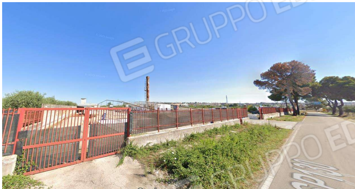
Vista dalla SP 130

c.f. FRZNN81R57A471W - Partita I.V.A. 04284360288