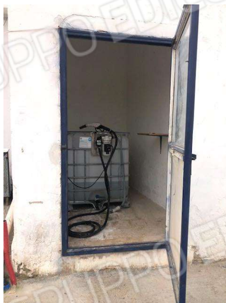
Ambienti del fabbricato abusivo posto sul vertice nord ovest del lotto