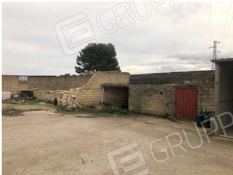
Manufatti diruti presenti all'estremità est del lotto

c.f. FRZNN81R57A471W - Partita I.V.A. 04284360288