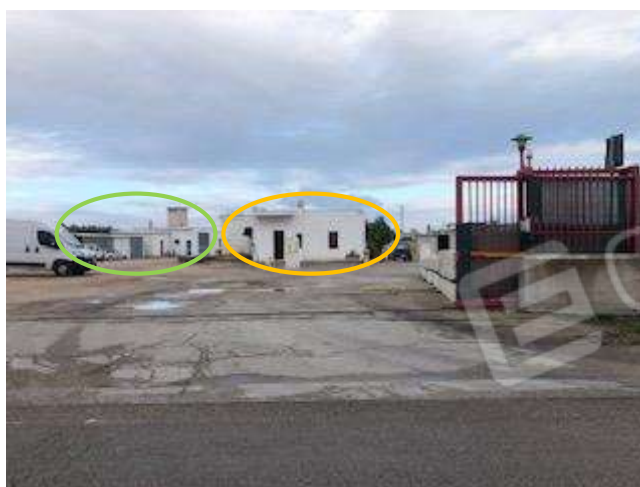
Vista da sud ovest dell'edificio abusivo posto centralmente al lotto. Nella foto si vede sulla sinistra anche l'edificio abusivo posto al vertice nord ovest