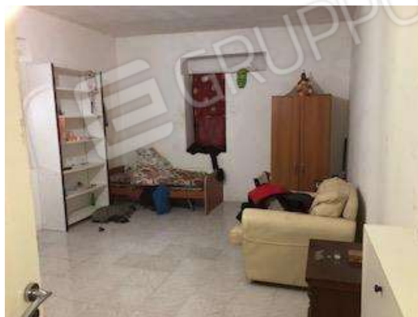
Ambienti interni del fabbricato abusivo posto centralmente al lotto