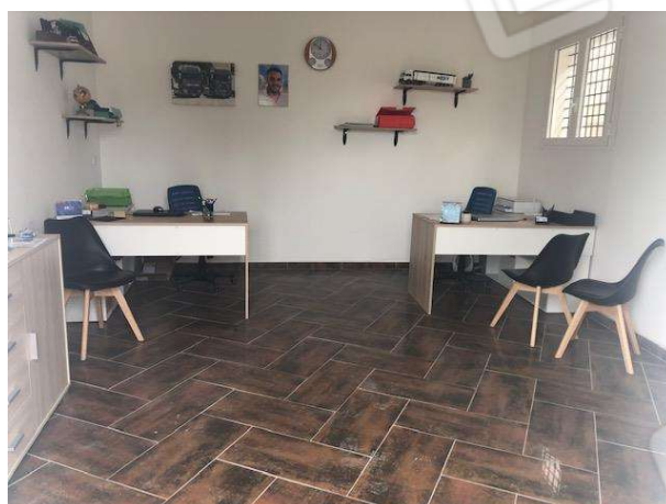
Ambienti del fabbricato abusivo posto sul vertice nord ovest del lotto