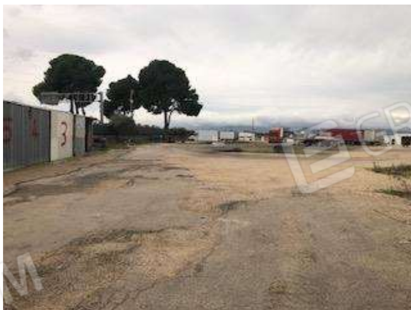
Container presenti lungo il confine sud