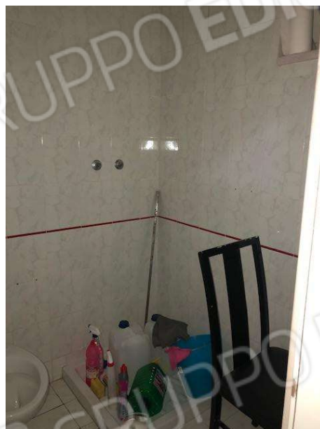
Servizi igienici del fabbricato abusivo posto centralmente al lotto