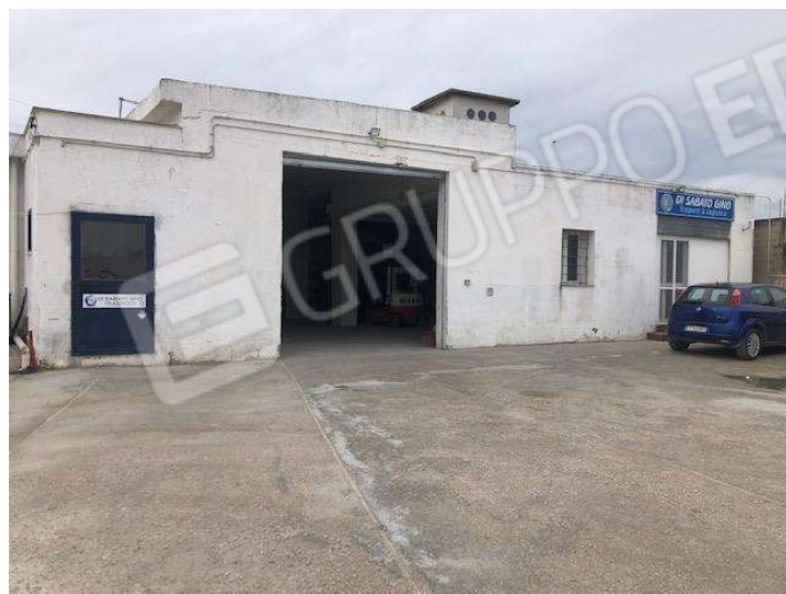
Edificio abusivo posto sul vertice nord ovest della proprietà