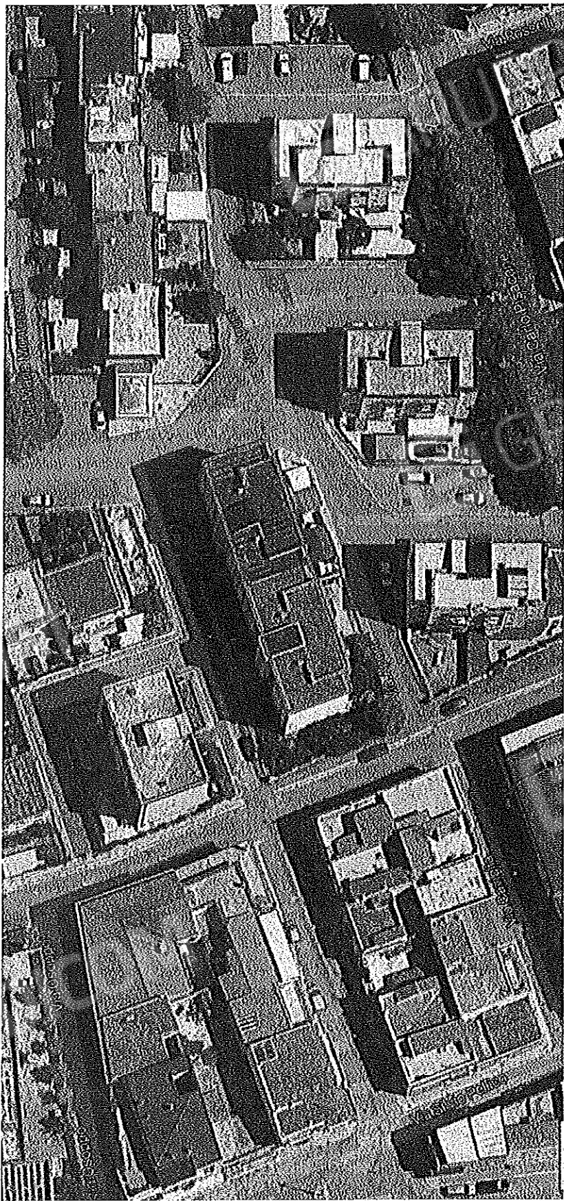
San Severo Foglio 31 particella 10752