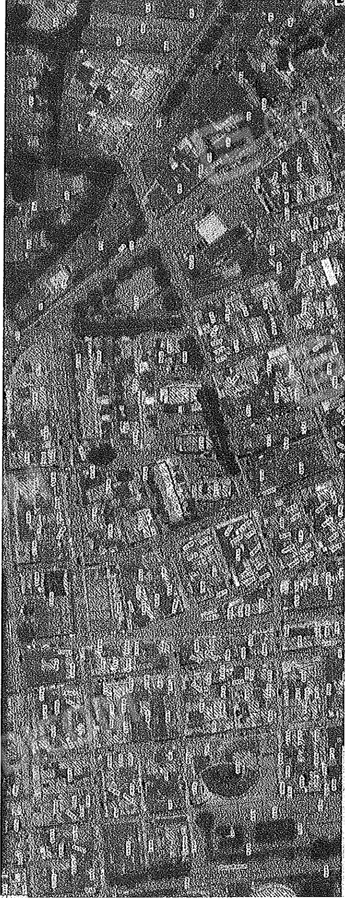
Sovrapposizione catastale con aerofoto San Severo Foglio 31 particella 10752