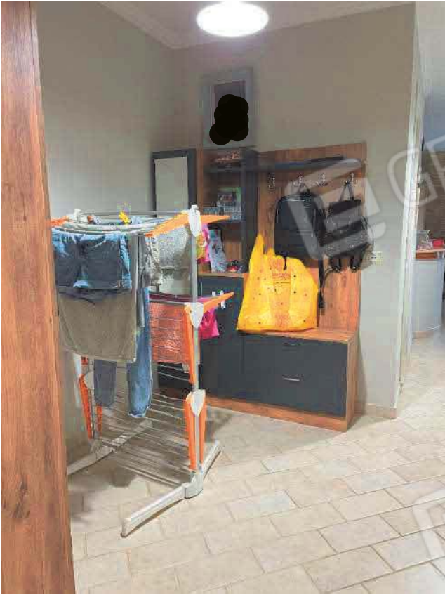
Figura 29. LOTTO UNICO: Immobile pignorato al F. 57, P.IIa 2660, Sub. 5 ubicato in San Giovanni Rotondo alla Via E. Mandes n. 27 (disimpegno).