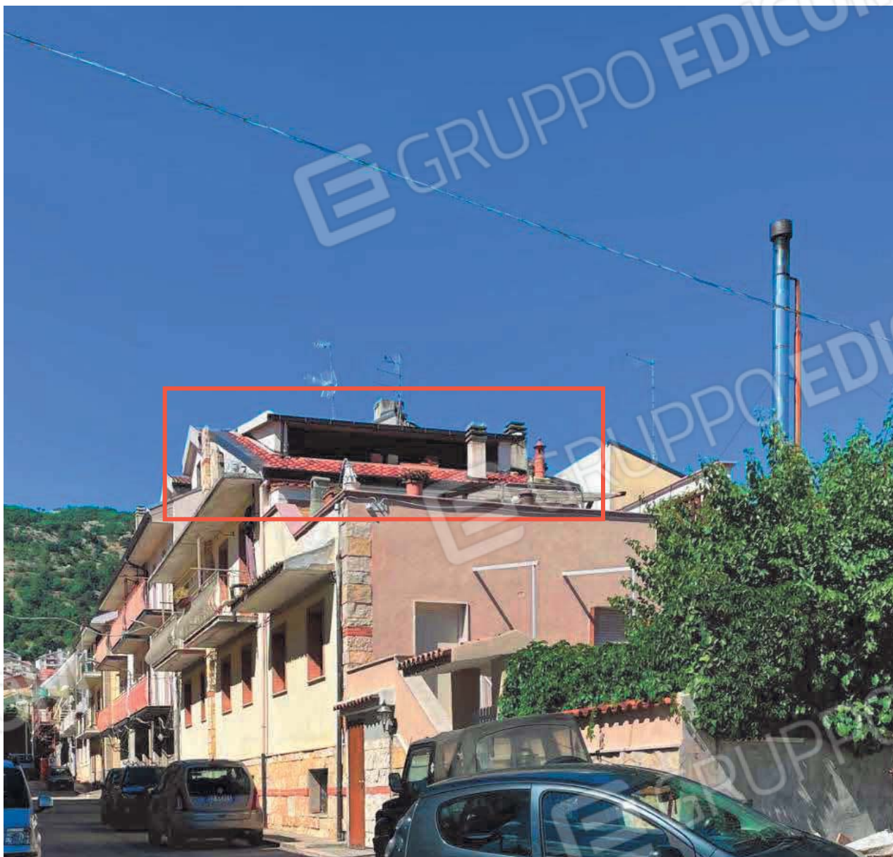
Figura 33. LOTTO UNICO: Immobile pignorato non accatastato ubicato in San Giovanni Rotondo alla Via E. Mandes n. 27 (sottotetto).