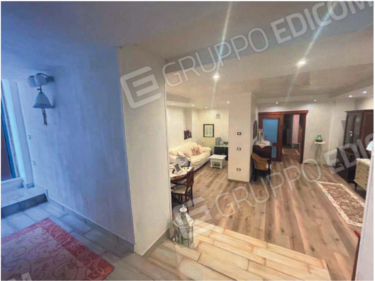
Figura 7. LOTTO UNICO: Immobile pignorato al F. 57, P.IIa 2660, Sub. 3 ubicato in San Giovanni Rotondo alla Via E. Mandes n. 25 (soggiorno).