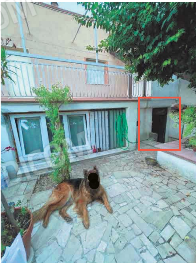
Figura 16. LOTTO UNICO: Immobile pignorato al F. 57, P.IIa 2660, Sub. 3 ubicato in San Giovanni Rotondo alla Via E. Mandes n. 27 (ingresso al vano tecnico mediante il B.C.N.C. individuato al sub. 1).