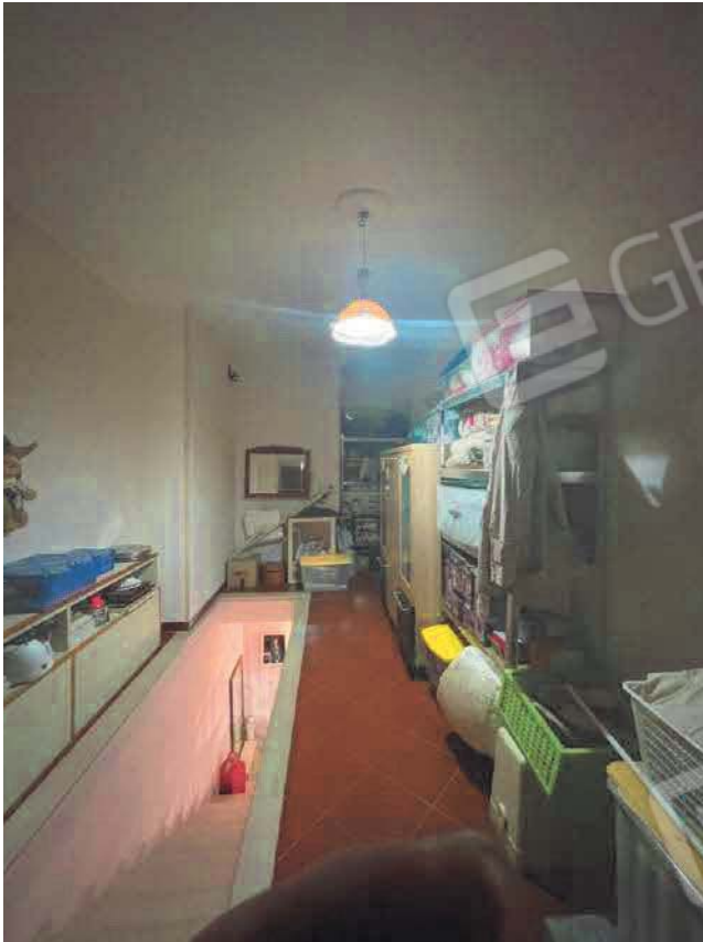
Figura 15. LOTTO UNICO: Immobile pignorato al F. 57, P.IIa 2660, Sub. 4 ubicato in San Giovanni Rotondo alla Via E. Mandes n. 25 (ripostiglio posto al piano primo individuato al sub. 4 ed accorpato al sub. 3).