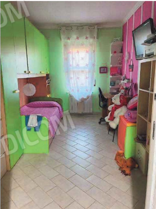
Figura 30. LOTTO UNICO: Immobile pignorato al F. 57, P.IIa 2660, Sub. 5 ubicato in San Giovanni Rotondo alla Via E. Mandes n. 27 (camera).