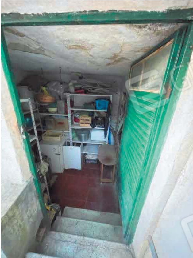
Figura 17. LOTTO UNICO: Immobile pignorato al F. 57, P.IIa 2660, Sub. 3 ubicato in San Giovanni Rotondo alla Via E. Mandes n. 27 (vano tecnico).