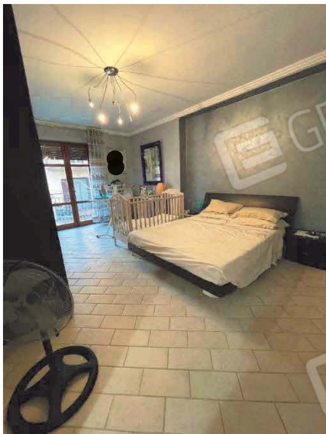
Figura 31. LOTTO UNICO: Immobile pignorato al F. 57, P.IIa 2660, Sub. 5 ubicato in San Giovanni Rotondo alla Via E. Mandes n. 27 (camera).