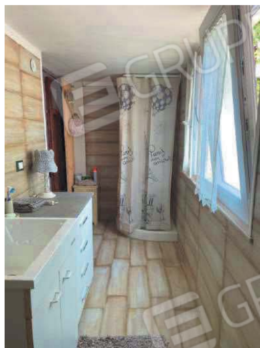
Figura 6. LOTTO UNICO: Immobile pignorato al F. 57, P.Ila 2660, Sub. 3 ubicato in San Giovanni Rotondo alla Via E. Mandes n. 25 (bagno – ampliamento).