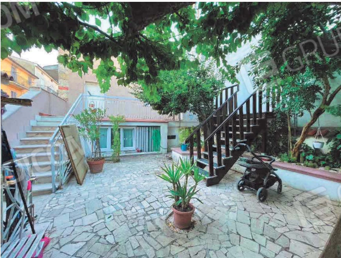
Figura 36. LOTTO UNICO: Immobile pignorato al F. 57, P.IIa 2660, Sub. 1 ubicato in San Giovanni Rotondo alla Via E. Mandes n. 27 (corte di accesso agli immobili - bene comune non censibile).