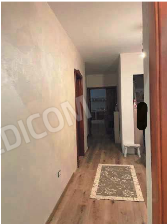
Figura 8. LOTTO UNICO: Immobile pignorato al F. 57, P.IIa 2660, Sub. 3 ubicato in San Giovanni Rotondo alla Via E. Mandes n. 25 (disimpegno).