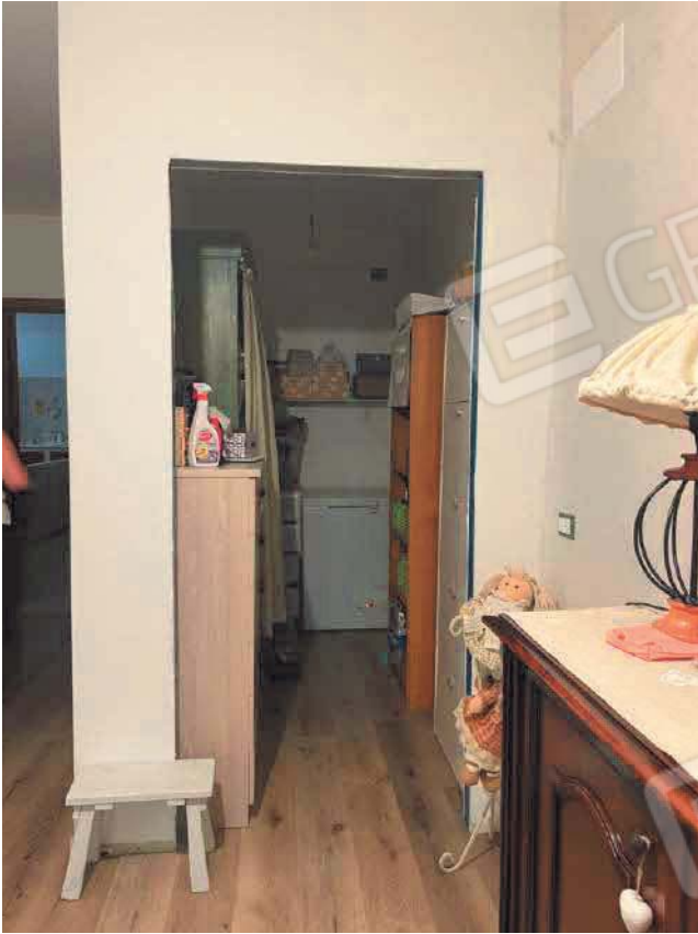
Figura 9. LOTTO UNICO: Immobile pignorato al F. 57, P.IIa 2660, Sub. 3 ubicato in San Giovanni Rotondo alla Via E. Mandes n. 25 (ripostiglio).