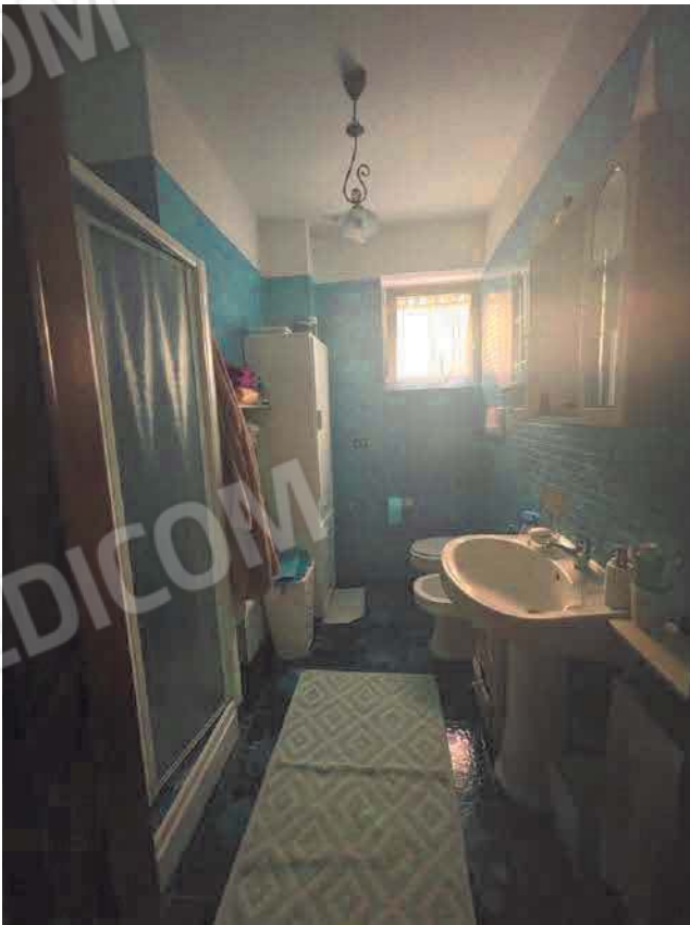
Figura 12. LOTTO UNICO: Immobile pignorato al F. 57, P.IIa 2660, Sub. 3 ubicato in San Giovanni Rotondo alla Via E. Mandes n. 25 (bagno).