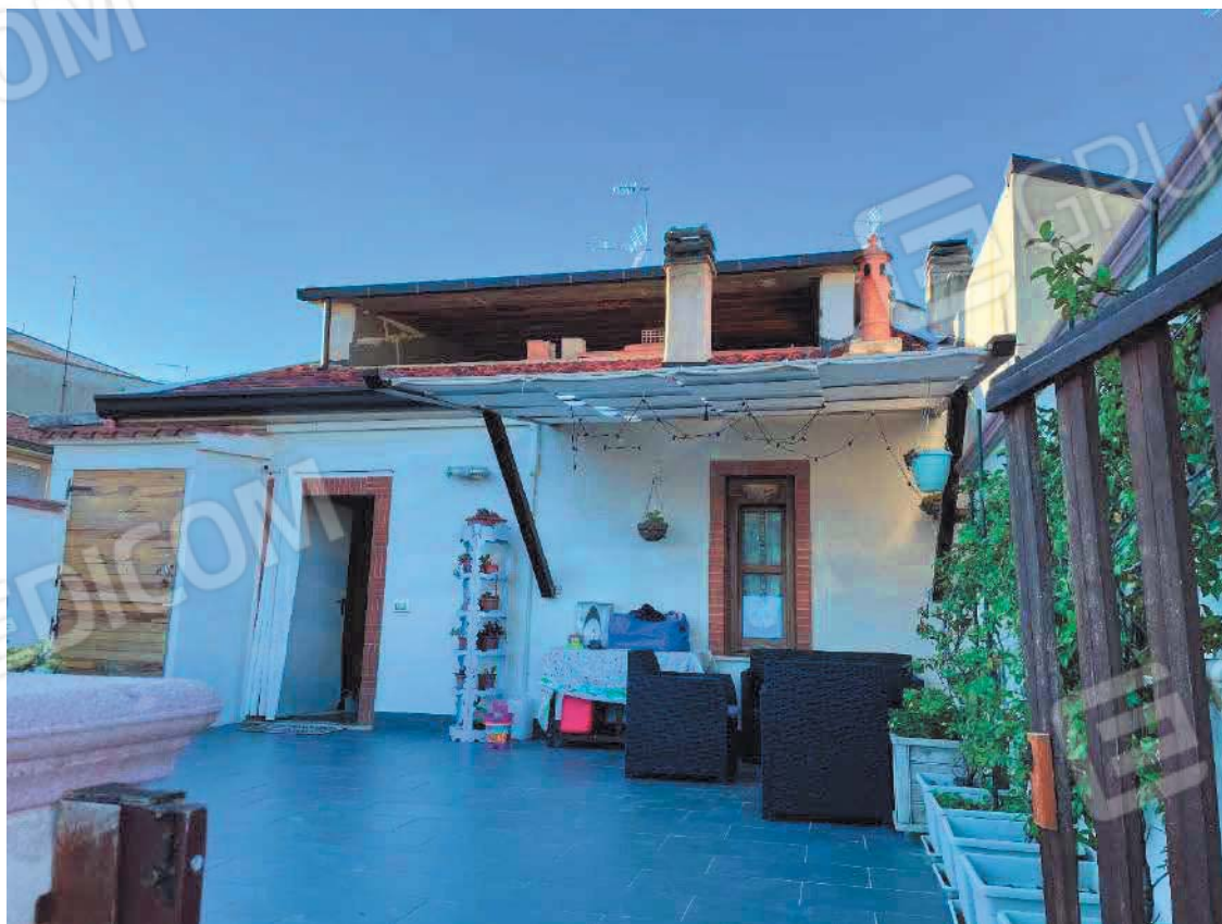
Figura 32. LOTTO UNICO: Immobile pignorato al F. 57, P.IIa 2660, Sub. 5 ubicato in San Giovanni Rotondo alla Via E. Mandes n. 27 (terrazza).