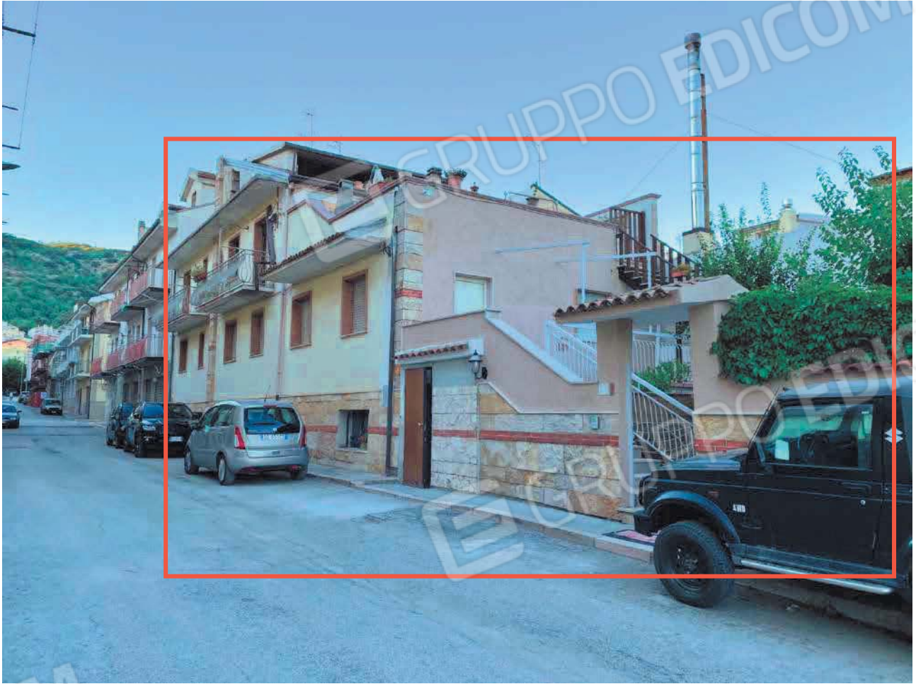
Figura 3. LOTTO UNICO: Fabbricato in cui si trovano gli immobili pignorati al F. 57, P.IIa 2660, Sub. 1-2-3-4-5 ubicati in San Giovanni Rotondo alla Via E. Mandes n. 25 e 27.