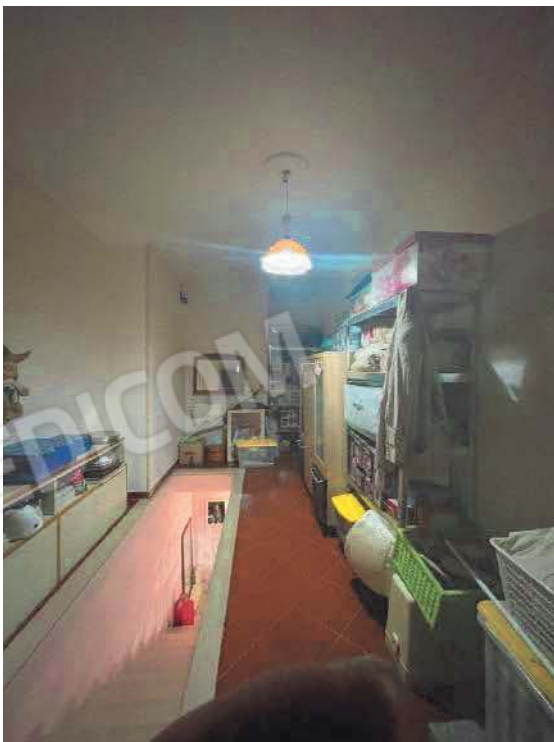
Figura 24. LOTTO UNICO: Immobile pignorato al F. 57, P.IIa 2660, Sub. 4 ubicato in San Giovanni Rotondo alla Via E. Mandes n. 27 (ripostiglio accorpato al sub. 3).