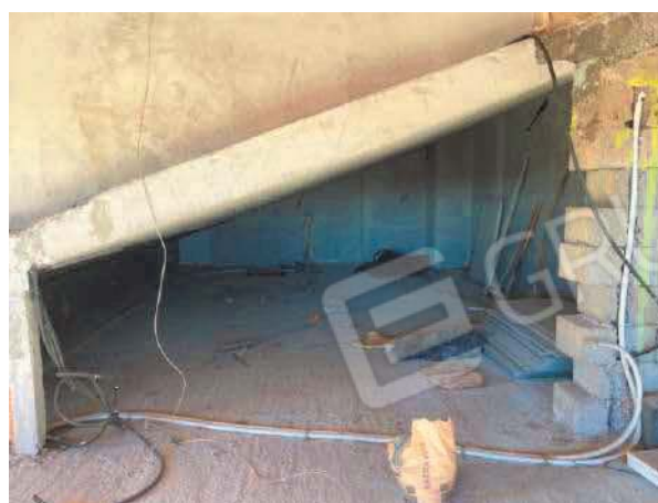
Figura 34. LOTTO UNICO: Immobile pignorato non accatastato ubicato in San Giovanni Rotondo alla Via E. Mandes n. 27 (interno sottotetto).