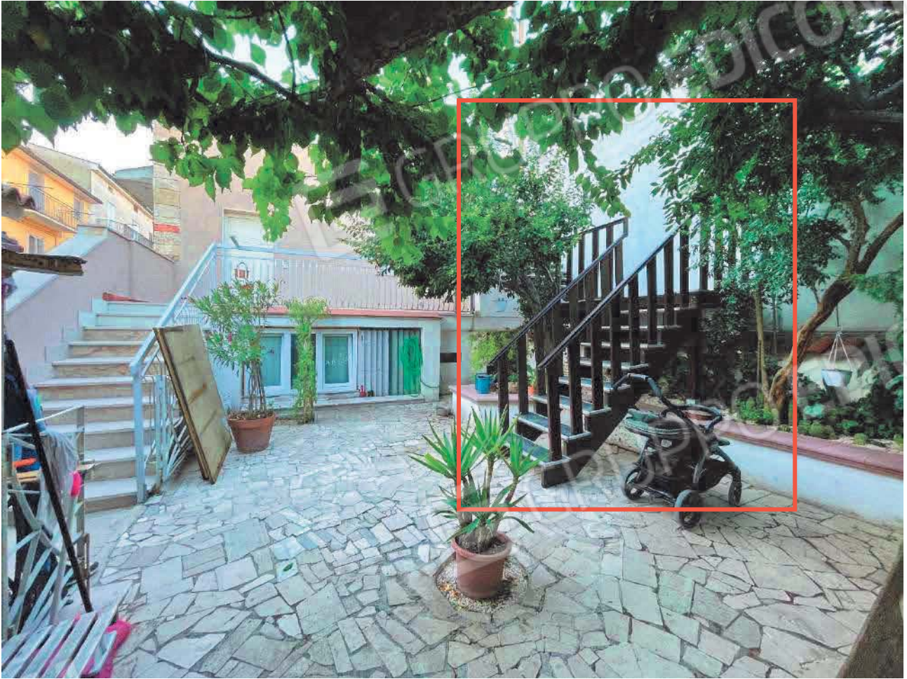
Figura 25. LOTTO UNICO: Immobile pignorato al F. 57, P.Ila 2660, Sub. 5 ubicato in San Giovanni Rotondo alla Via E. Mandes n. 27 (accesso dal bene comune non censibile censito al sub. 1).