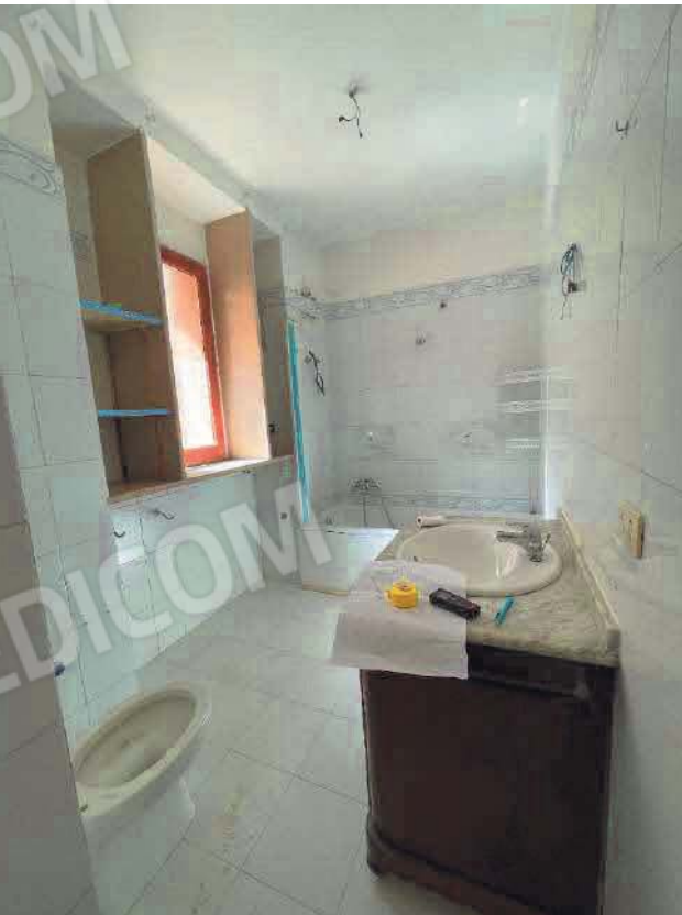
Figura 22. LOTTO UNICO: Immobile pignorato al F. 57, P.IIa 2660, Sub. 4 ubicato in San Giovanni Rotondo alla Via E. Mandes n. 27 (bagno).