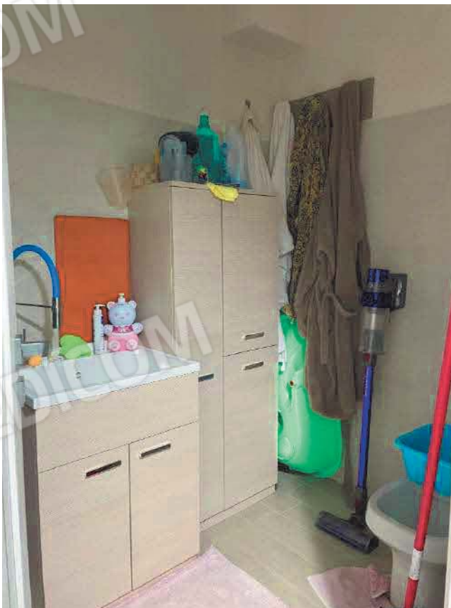
Figura 28. LOTTO UNICO: Immobile pignorato al F. 57, P.IIa 2660, Sub. 5 ubicato in San Giovanni Rotondo alla Via E. Mandes n. 27 (bagno di servizio).