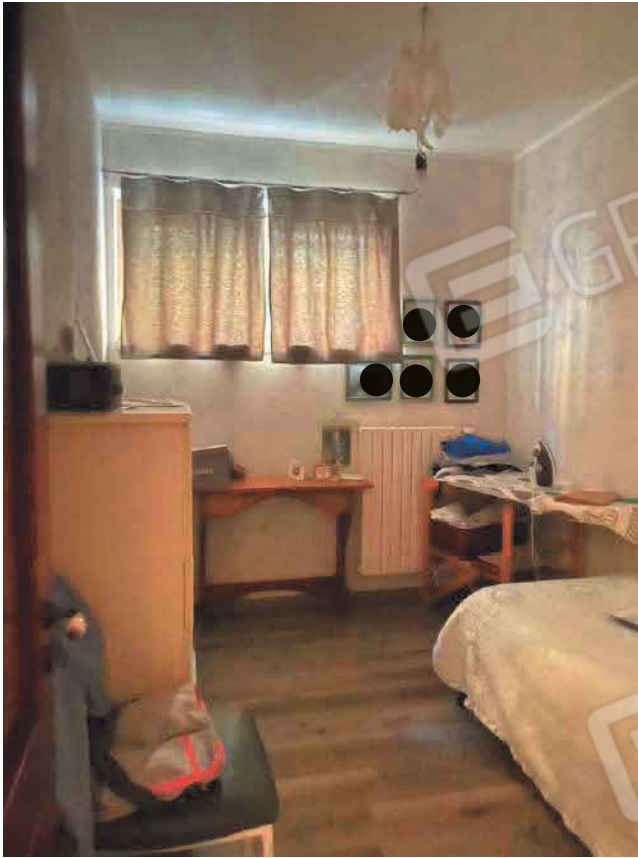
Figura 11. LOTTO UNICO: Immobile pignorato al F. 57, P.IIa 2660, Sub. 3 ubicato in San Giovanni Rotondo alla Via E. Mandes n. 25 (camera).