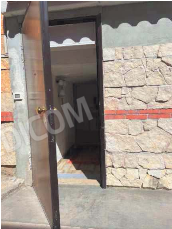
Figura 4. LOTTO UNICO: Immobile pignorato al F. 57, P.IIa 2660, Sub. 3 ubicato in San Giovanni Rotondo alla Via E. Mandes n. 25 (portoncino d'ingresso).