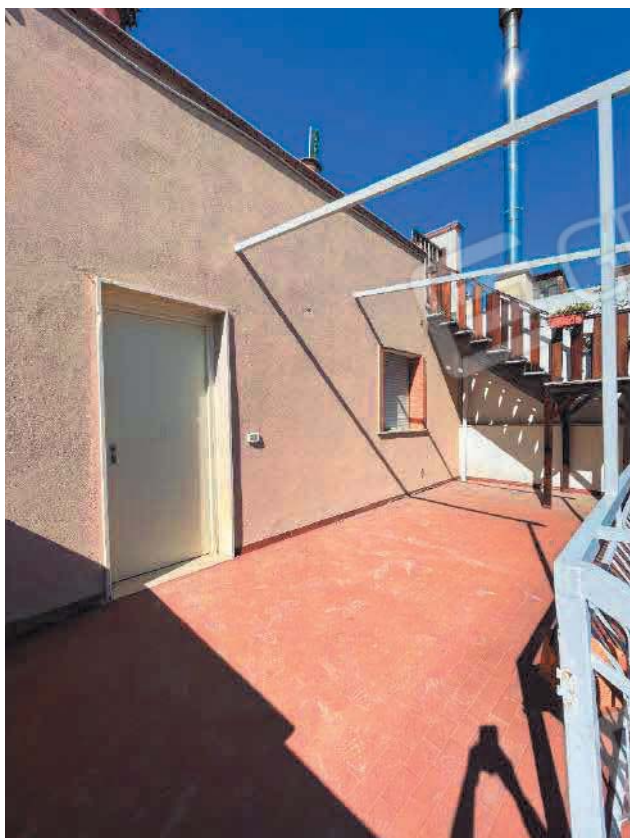
Figura 19. LOTTO UNICO: Immobile pignorato al F. 57, P.IIa 2660, Sub. 4 ubicato in San Giovanni Rotondo alla Via E. Mandes n. 27 (ingresso).