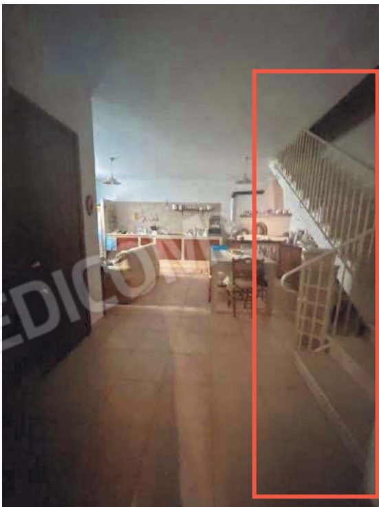
Figura 14. LOTTO UNICO: Immobile pignorato al F. 57, P.Ila 2660, Sub. 3 ubicato in San Giovanni Rotondo alla Via E. Mandes n. 25 (scala di accesso al ripostiglio posto al piano primo).