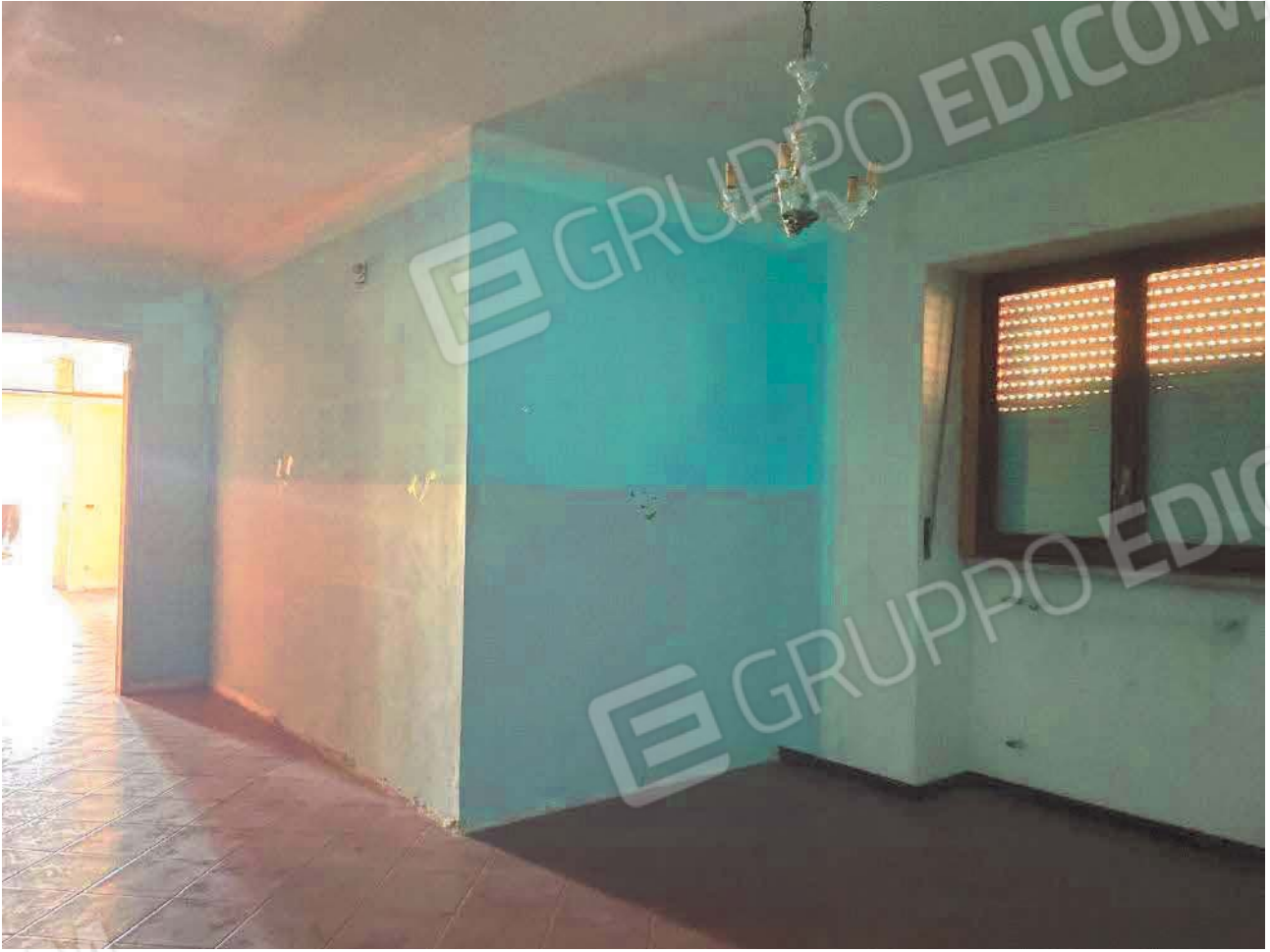
Figura 23. LOTTO UNICO: Immobile pignorato al F. 57, P.IIa 2660, Sub. 4 ubicato in San Giovanni Rotondo alla Via E. Mandes n. 27 (camera).