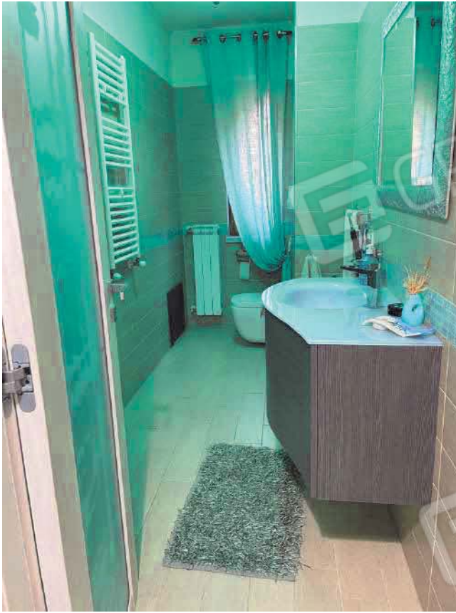
Figura 27. LOTTO UNICO: Immobile pignorato al F. 57, P.IIa 2660, Sub. 5 ubicato in San Giovanni Rotondo alla Via E. Mandes n. 27 (bagno).