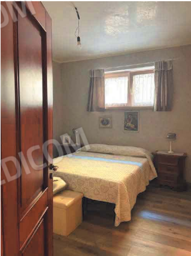
Figura 10. LOTTO UNICO: Immobile pignorato al F. 57, P.IIa 2660, Sub. 3 ubicato in San Giovanni Rotondo alla Via E. Mandes n. 25 (camera).