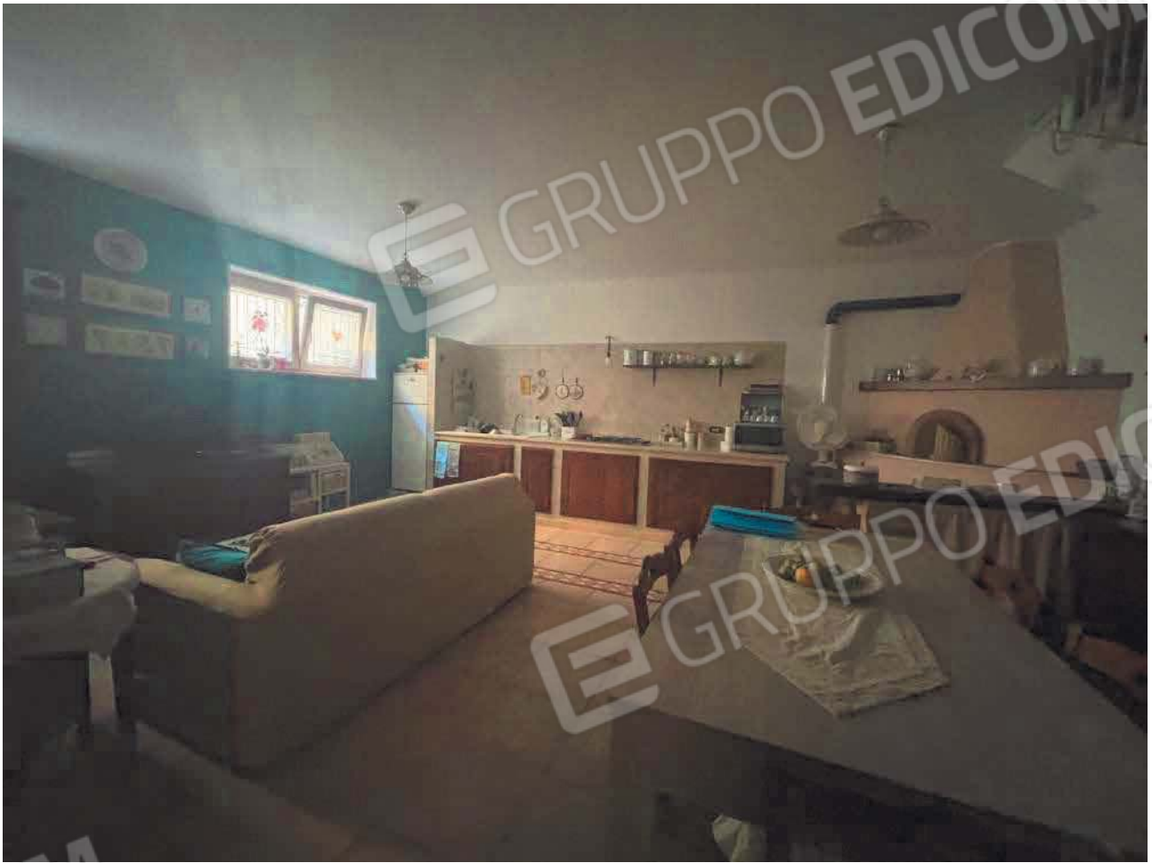
Figura 13. LOTTO UNICO: Immobile pignorato al F. 57, P.Ila 2660, Sub. 3 ubicato in San Giovanni Rotondo alla Via E. Mandes n. 25 (cucina).