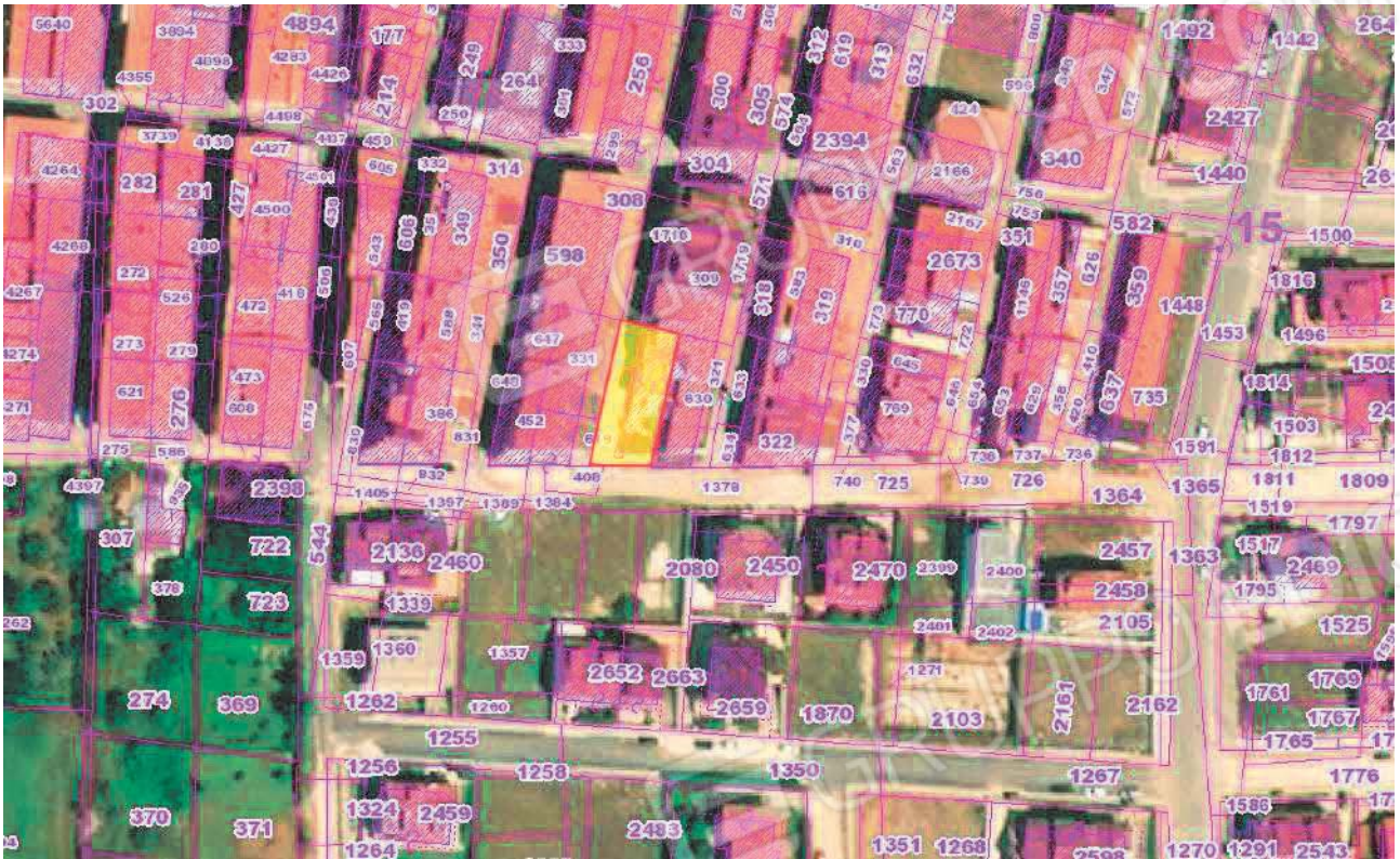
Figura 1. LOTTO UNICO: Ortofoto catastale degli immobili pignorati al F. 57, P.IIa 2660, Sub. 1-2-3-4-5 ubicati in San Giovanni Rotondo alla Via E. Mandes n. 25 e 27.