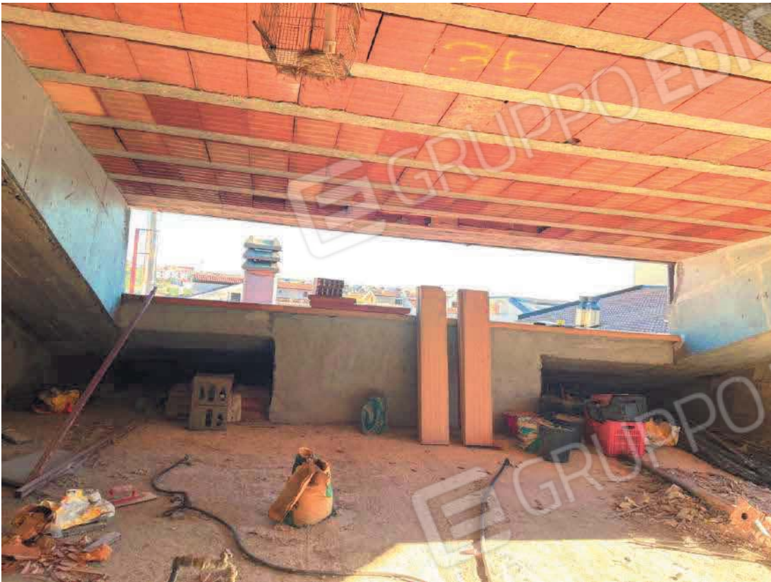
Figura 35. LOTTO UNICO: Immobile pignorato non accatastato ubicato in San Giovanni Rotondo alla Via E. Mandes n. 27 (interno sottotetto).