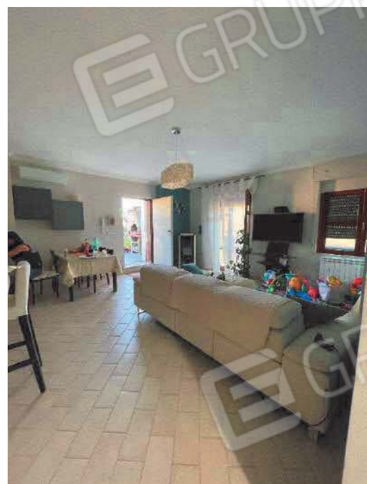
Figura 26. LOTTO UNICO: Immobile pignorato al F. 57, P.Ila 2660, Sub. 5 ubicato in San Giovanni Rotondo alla Via E. Mandes n. 27 (soggiorno/pranzo).