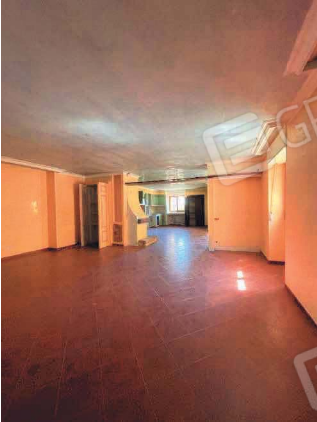
Figura 21. LOTTO UNICO: Immobile pignorato al F. 57, P.IIa 2660, Sub. 4 ubicato in San Giovanni Rotondo alla Via E. Mandes n. 27 (soggiorno e cucina).