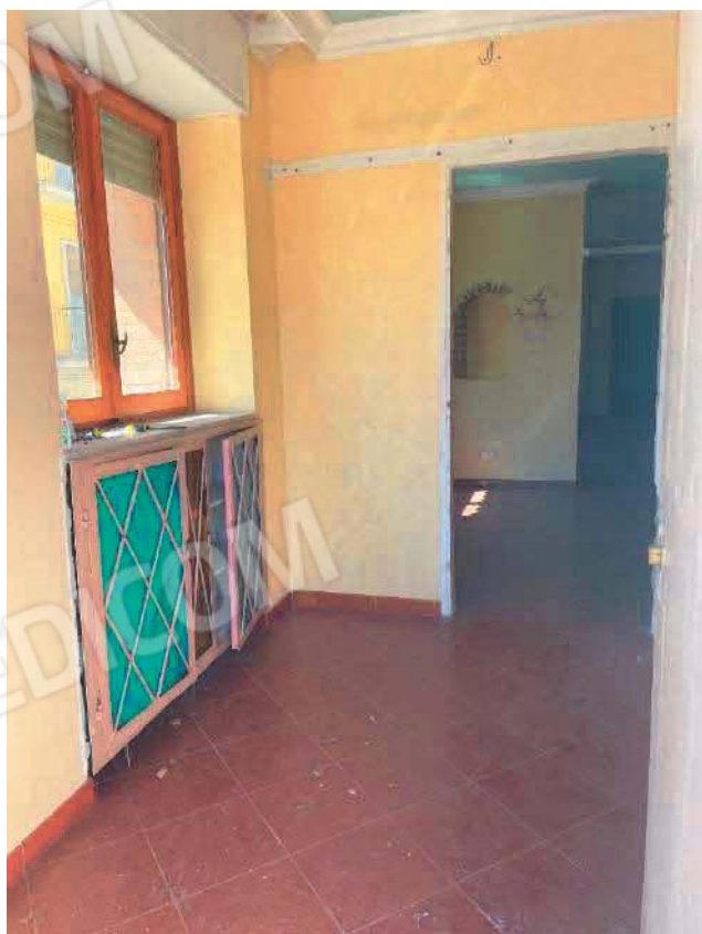
Figura 20. LOTTO UNICO: Immobile pignorato al F. 57, P.IIa 2660, Sub. 4 ubicato in San Giovanni Rotondo alla Via E. Mandes n. 27 (disimpegno).