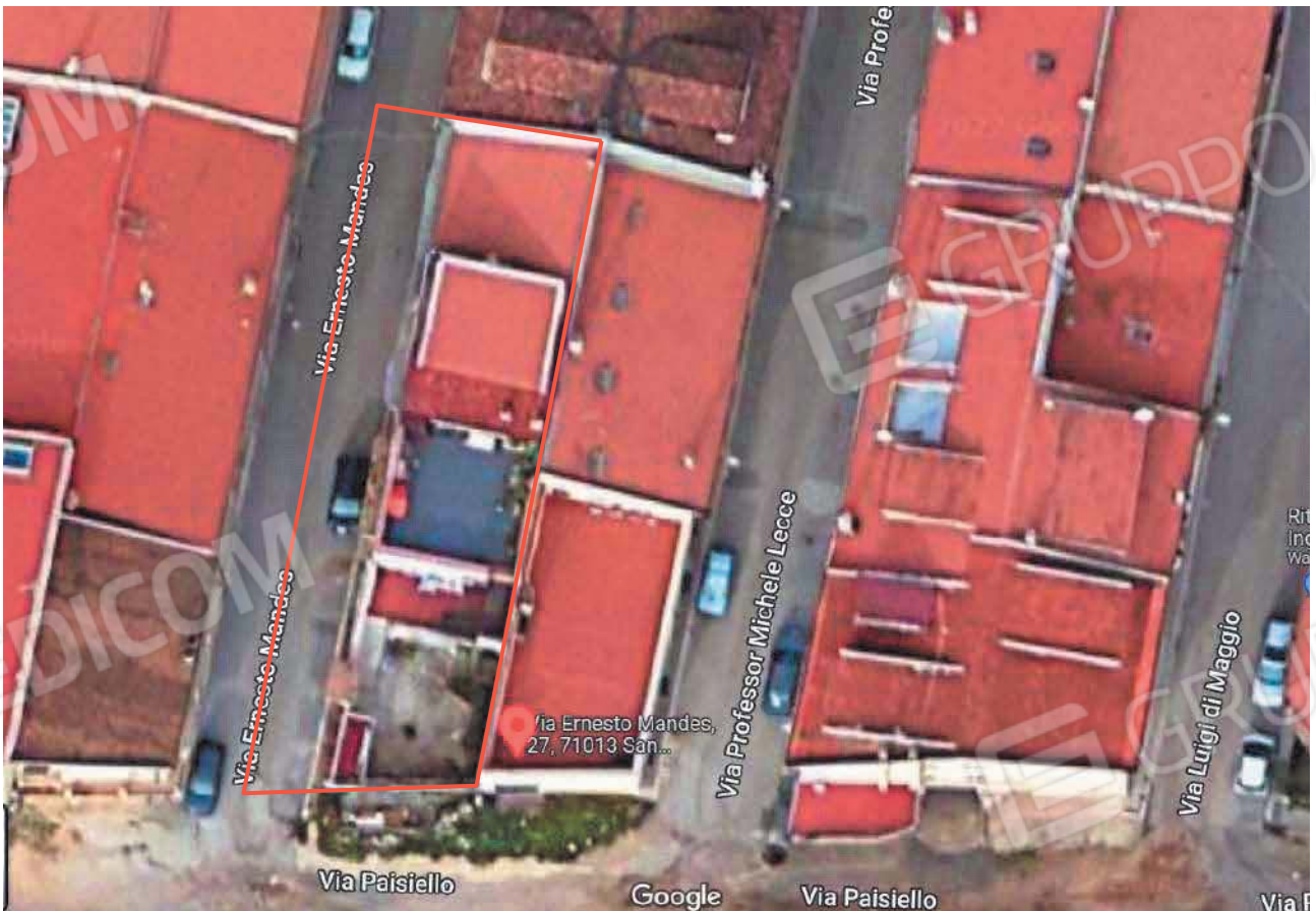
Figura 2. LOTTO UNICO: Ortofoto degli immobili pignorati al F. 57, P.IIa 2660, Sub. 1-2-3-4-5 ubicati in San Giovanni Rotondo alla Via E. Mandes n. 25 e 27.