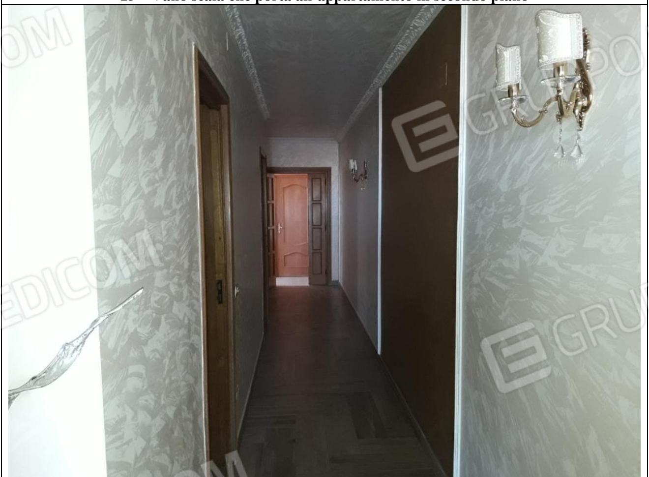
16 – Appartamento in secondo piano: veduta, dall'ingresso, del corridoio