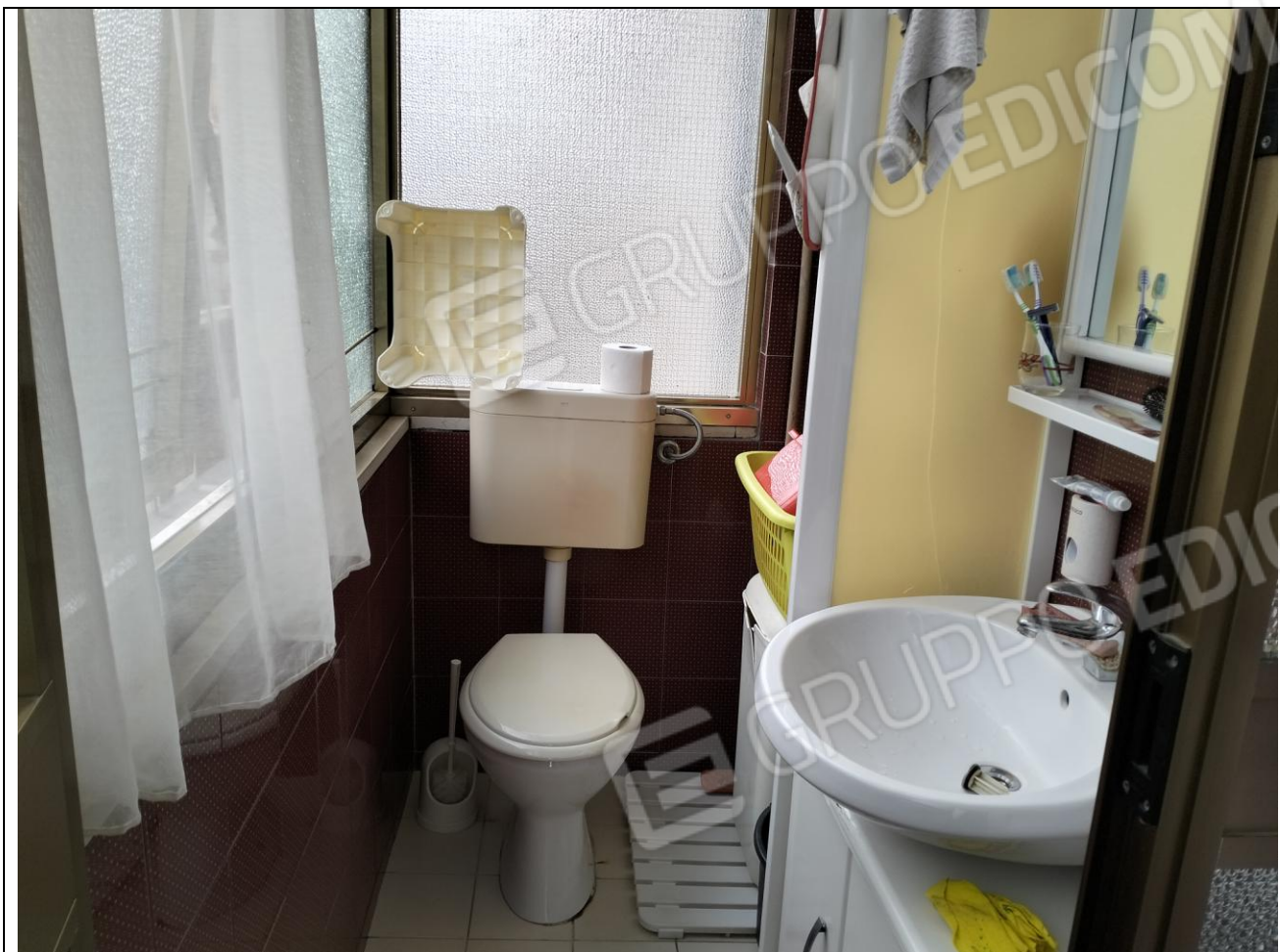
23 – Appartamento in primo piano: abuso edilizio non sanabile che consiste nella realizzazione del w.c. in primo piano, sul balcone, uscendo a destra, dalla cucina, che andrà smontato