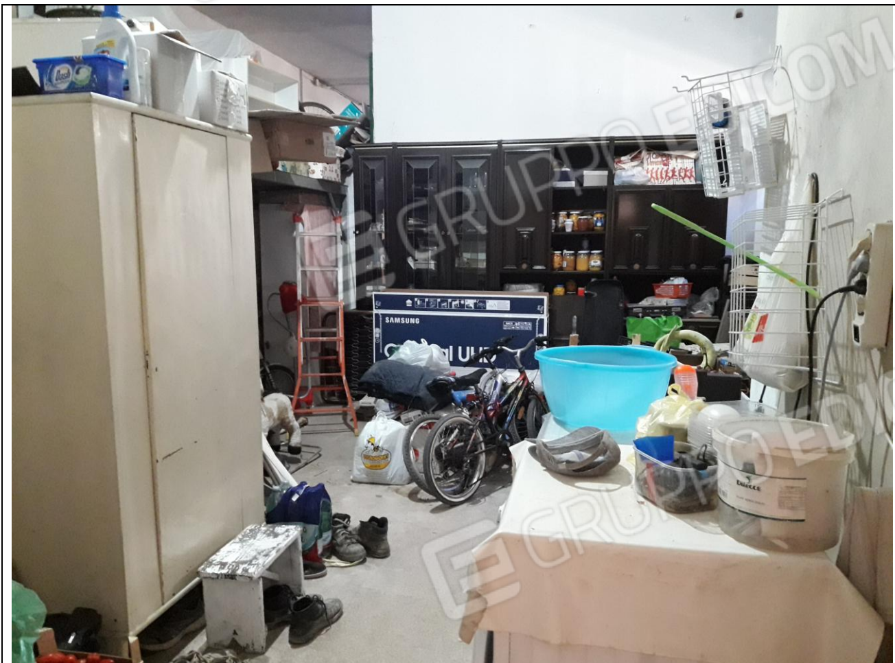
5 – Interno magazzino