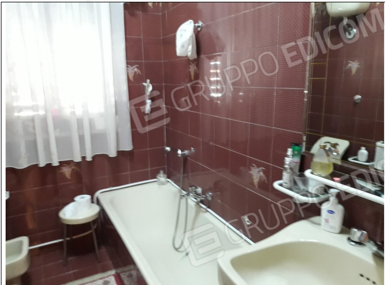
13 – Appartamento in primo piano: bagno