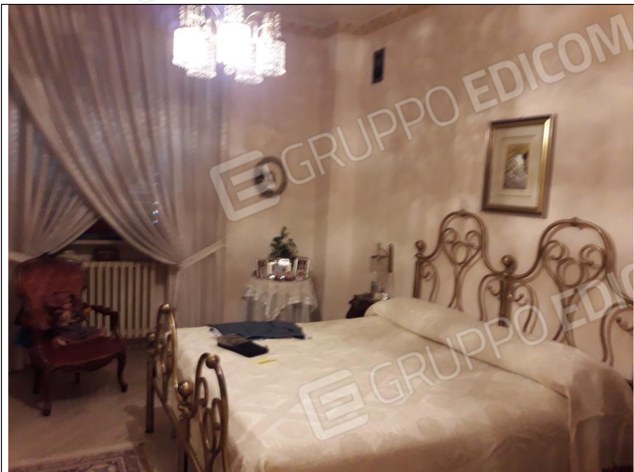
11 – Appartamento in primo piano: camera da letto matrimoniale