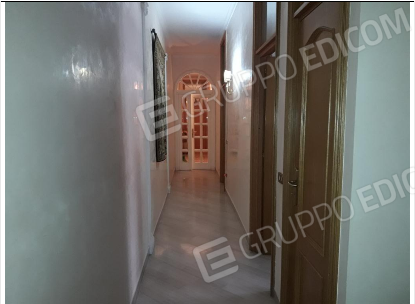
7 – Appartamento in primo piano: veduta, dall'ingresso, del corridoio