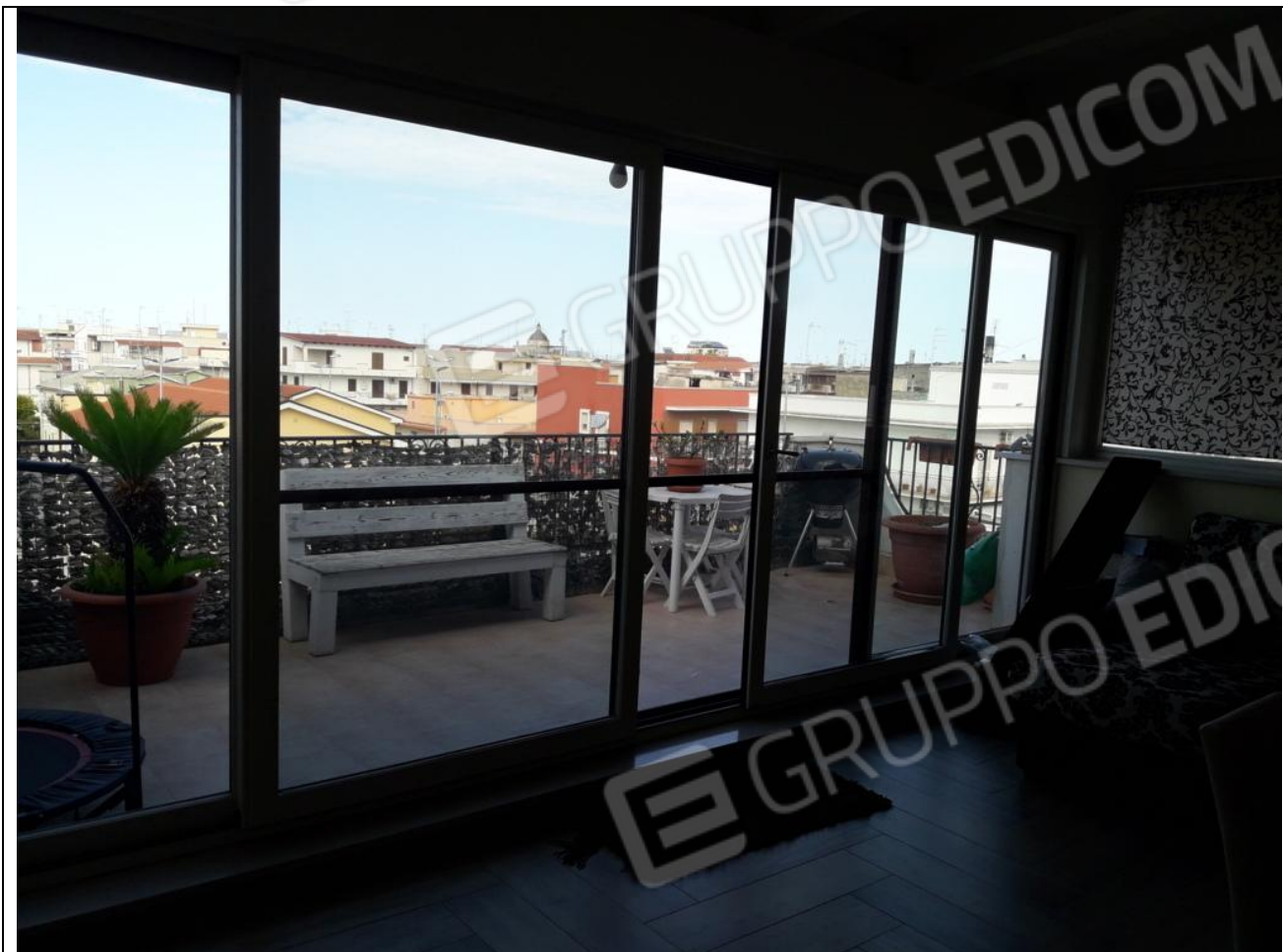
21 – Appartamento in secondo piano: creazione di vano chiuso abusivo, trattandosi di tettoia in legno aperta, come da progetto che si allega. Andranno smontate le porte-finestre