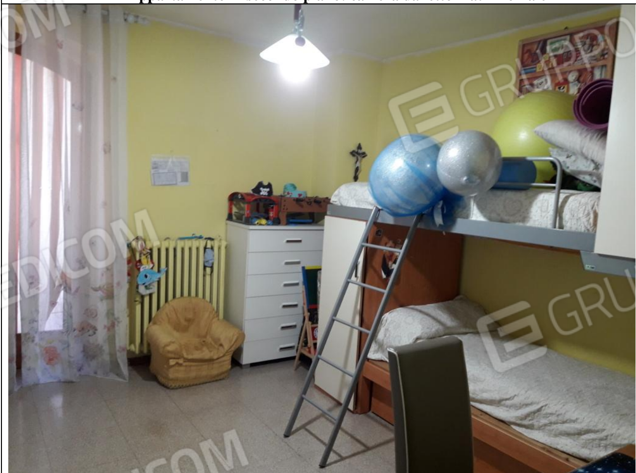
18 – Appartamento in secondo piano: cameretta