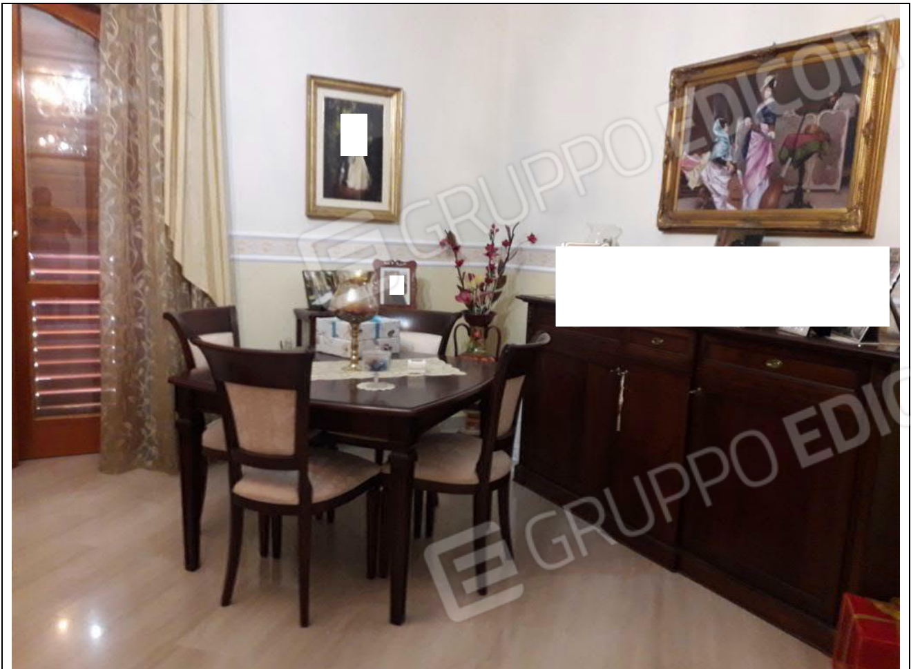
9, 10 – Appartamento in primo piano: salone