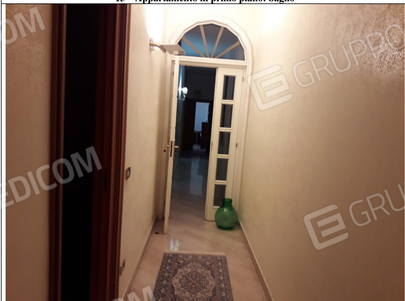
14 – Appartamento in primo piano: veduta, dal bagno, del corridoio e dell'ingresso