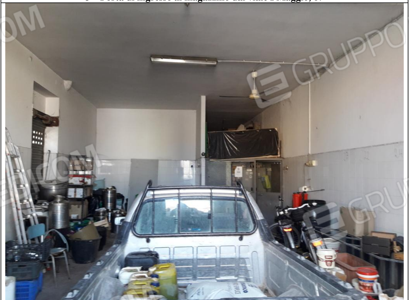
4 – Interno magazzino