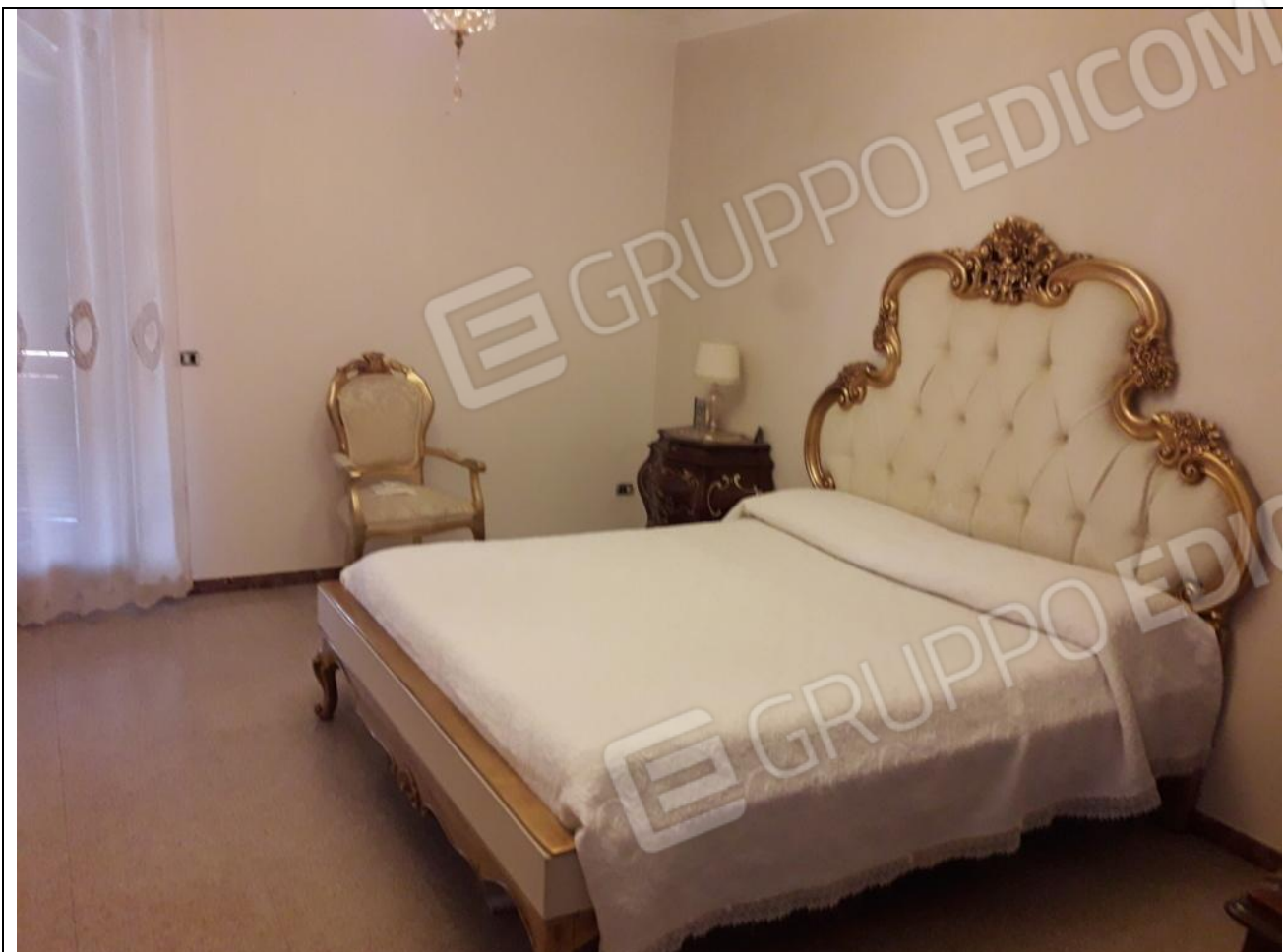
17 – Appartamento in secondo piano: camera da letto matrimoniale