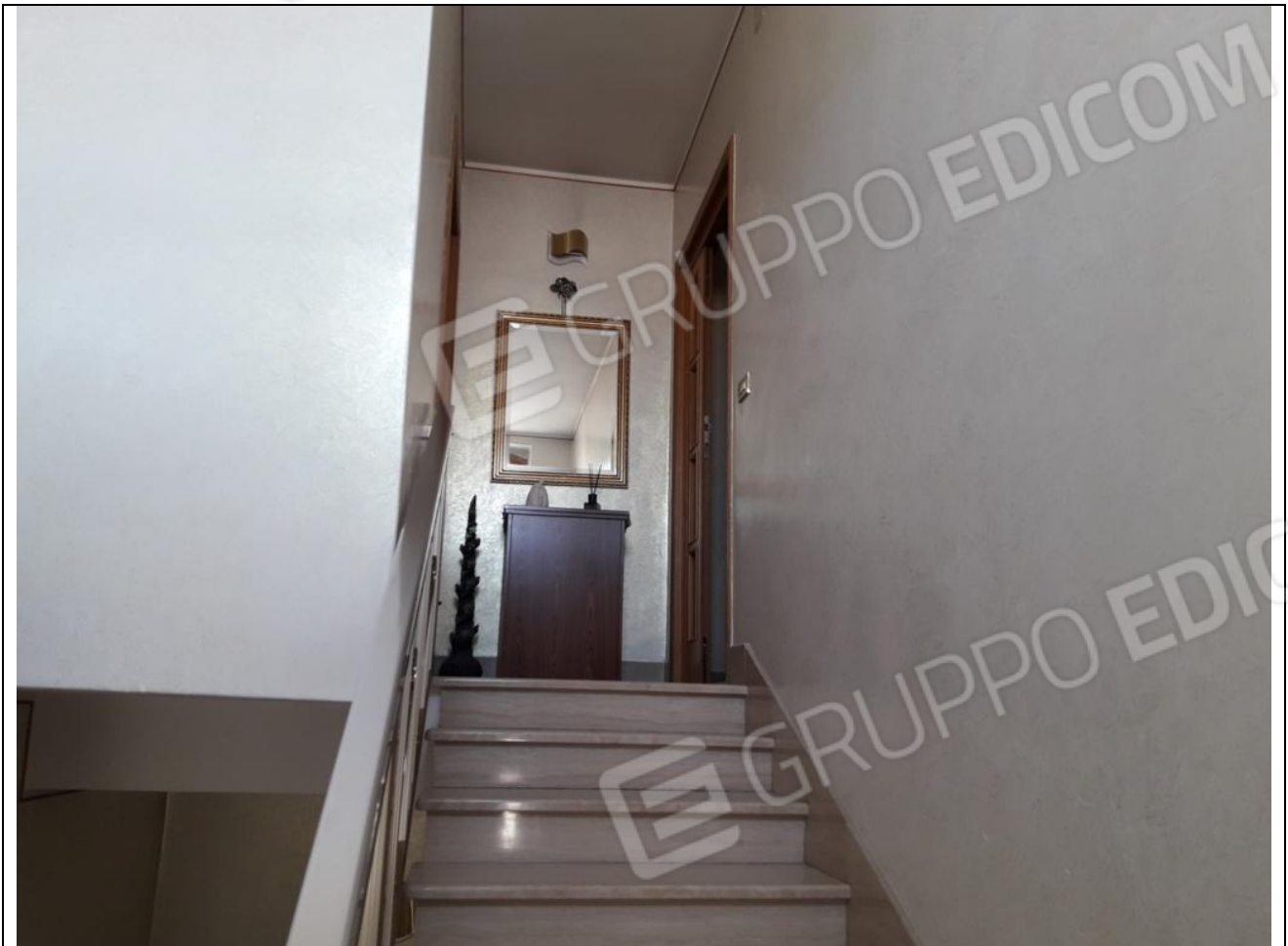
15 – Vano scala che porta all'appartamento in secondo piano