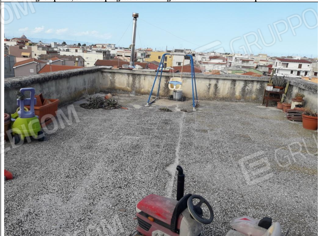
22 – Accesso al lastrico solare da botola, sita nel vano alla sinistra dell'appartamento in 2° p.