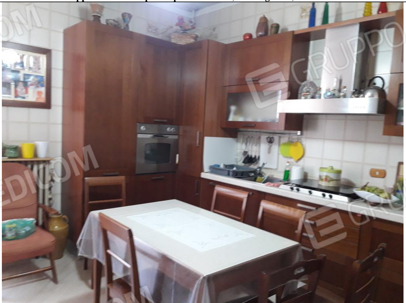
8 – Appartamento in primo piano: cucina