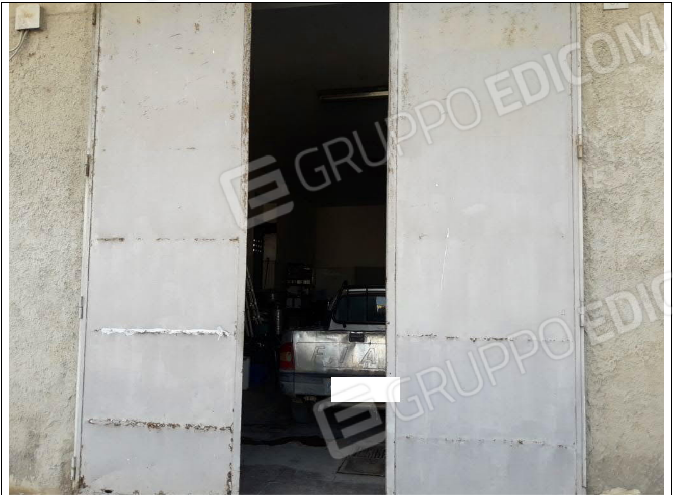
3 – Porta di ingresso al magazzino dal viale I Maggio, 67