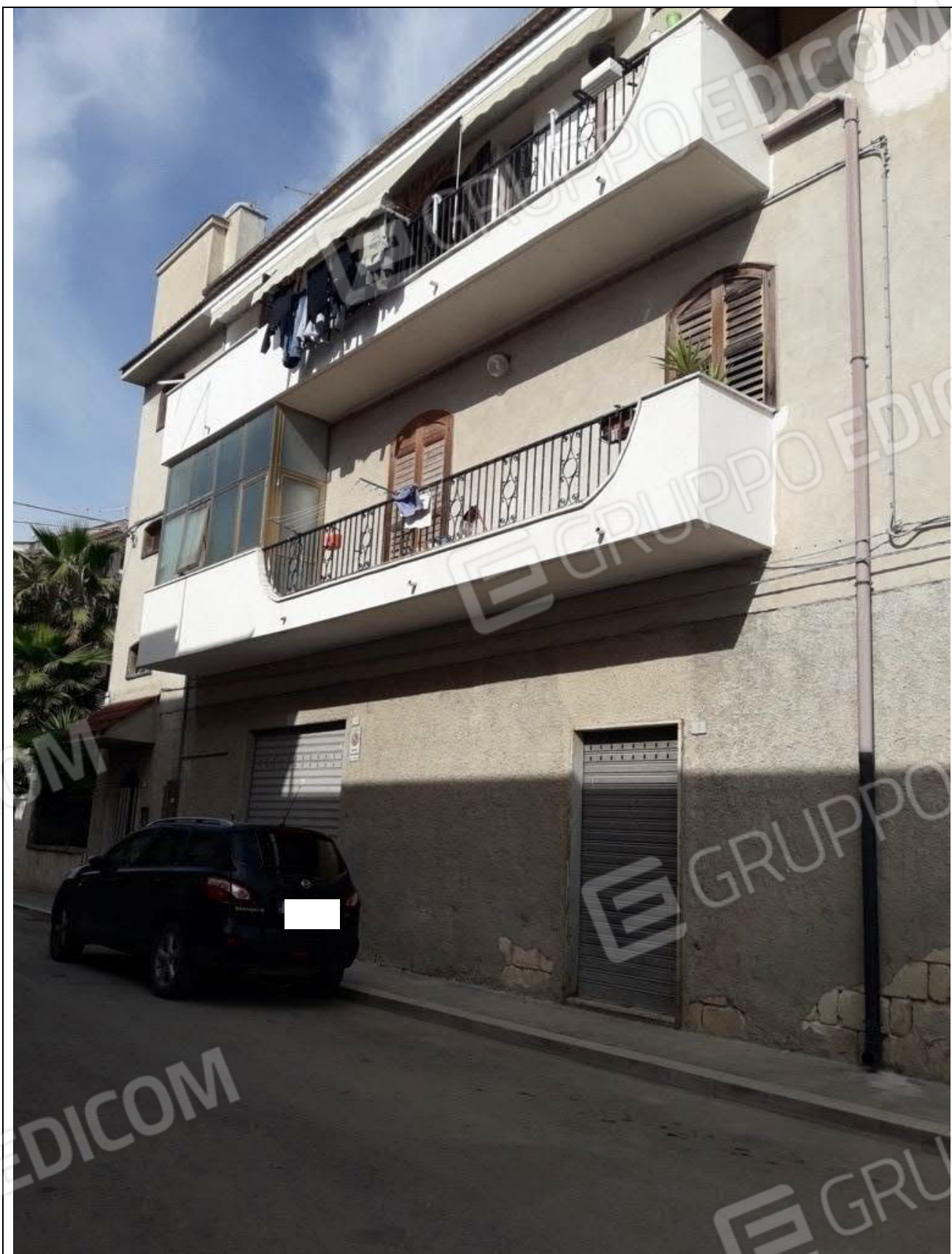
1 – Immobile sito in Trinitapoli alla via Carlo Levi civici 2, 4, 6, angolo viale I Maggio, 67