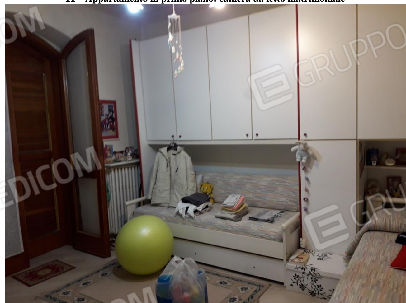
12 – Appartamento in primo piano: cameretta