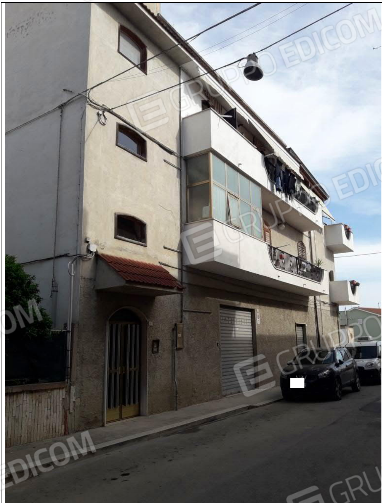
2 – Immobile sito in Trinitapoli alla via Carlo Levi civici 2, 4, 6, angolo viale I Maggio, 67