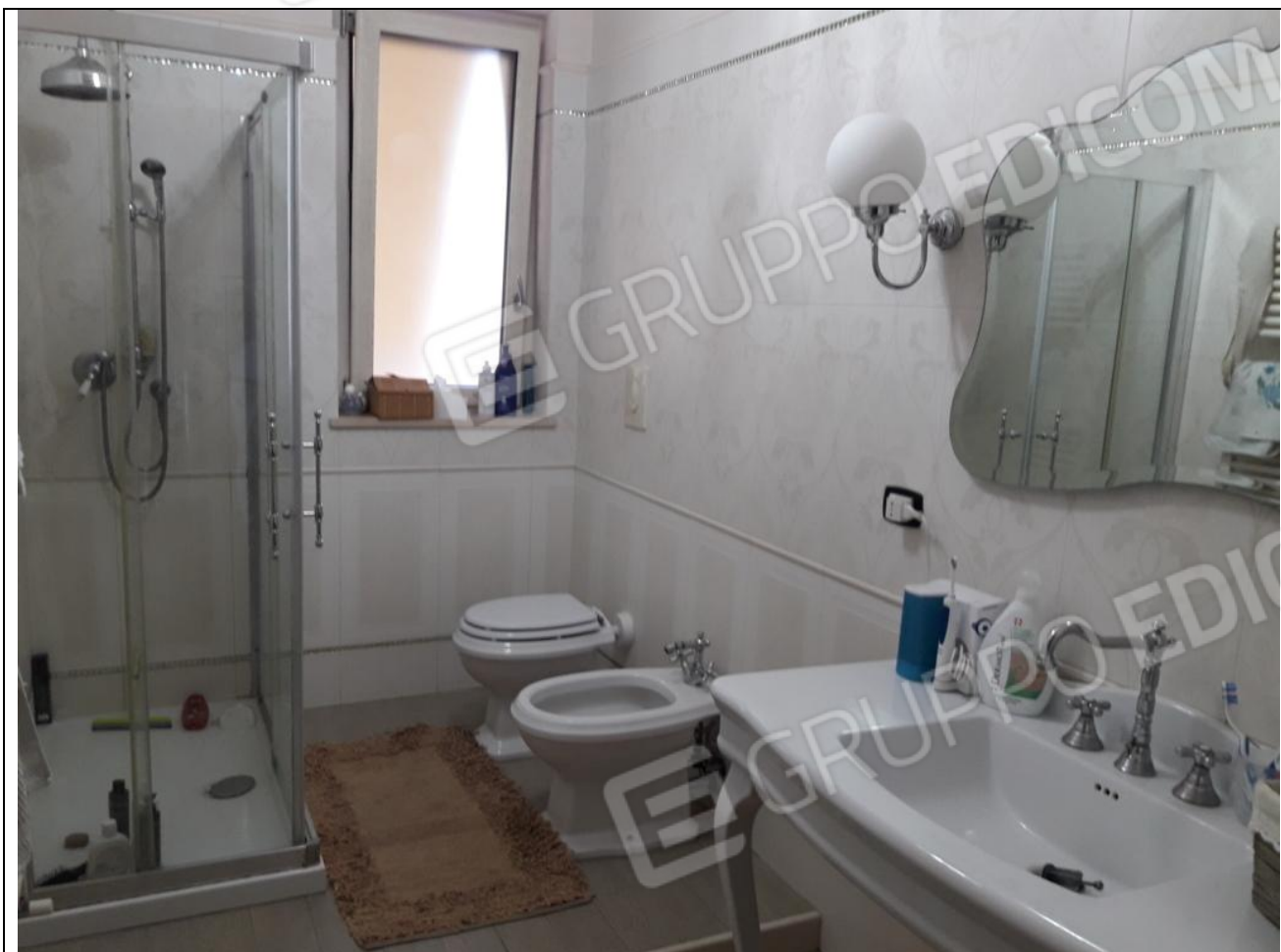
19 – Appartamento in secondo piano: bagno