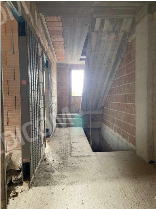
Figura 7. LOTTO UNICO: Immobile pignorato al F. 8, P.Ila 3929, Sub. 1 ubicato in San Ferdinando di Puglia (BT) alla Via V. Bachelet n. 4 (disimpegno al piano primo).