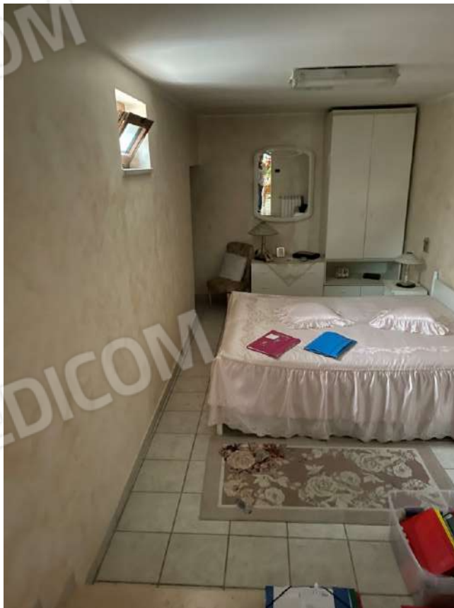
Figura 17. LOTTO UNICO: Immobile pignorato al F. 8, P.IIa 3929, Sub. 2 ubicato in San Ferdinando di Puglia (BT) alla Via V. Bachelet n. 2 (camera ricavata sotto il giardino prospiciente la Via V. Bachelet).