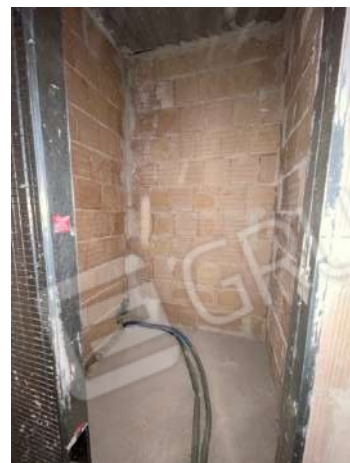
Figura 5. LOTTO UNICO: Immobile pignorato al F. 8, P.I.a 3929, Sub. 1 ubicato in San Ferdinando di Puglia (BT) alla Via V. Bachelet n. 4 (vano unico più accessori posti al piano terra).