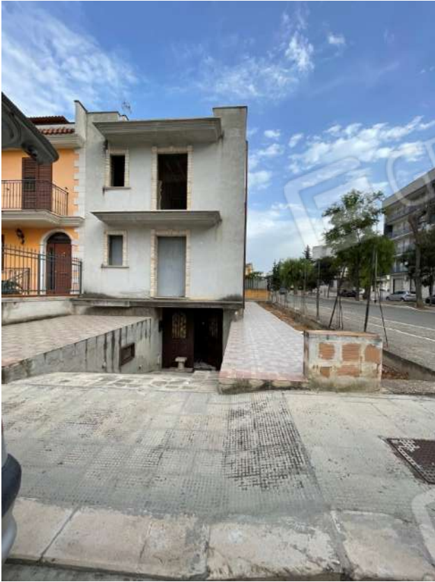
Figura 3. LOTTO UNICO: Fabbricato unifamiliare in cui si trovano gli immobili pignorati al F. 8, P.Ila 3929, Sub. 1 e 2 ubicati in San Ferdinando di Puglia (BT) alla Via V. Bachelet n. 2 e 4 (facciata prospiciente la Via V. Bachelet).