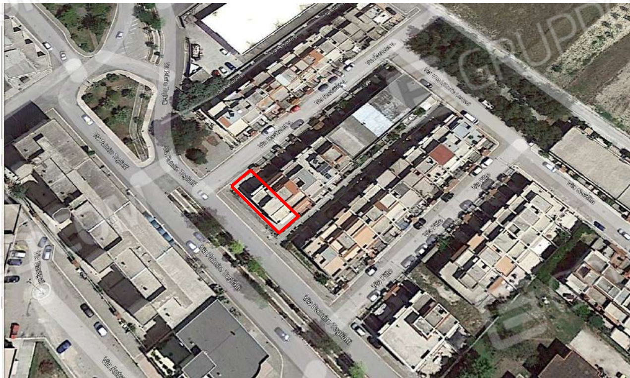
Figura 2. LOTTO UNICO: Ortofoto degli immobili pignorati al F. 8, P.Illa 3929, Sub. 1 e 2 ubicati in San Ferdinando di Puglia (BT) alla Via V. Bachelet n. 2 e 4.