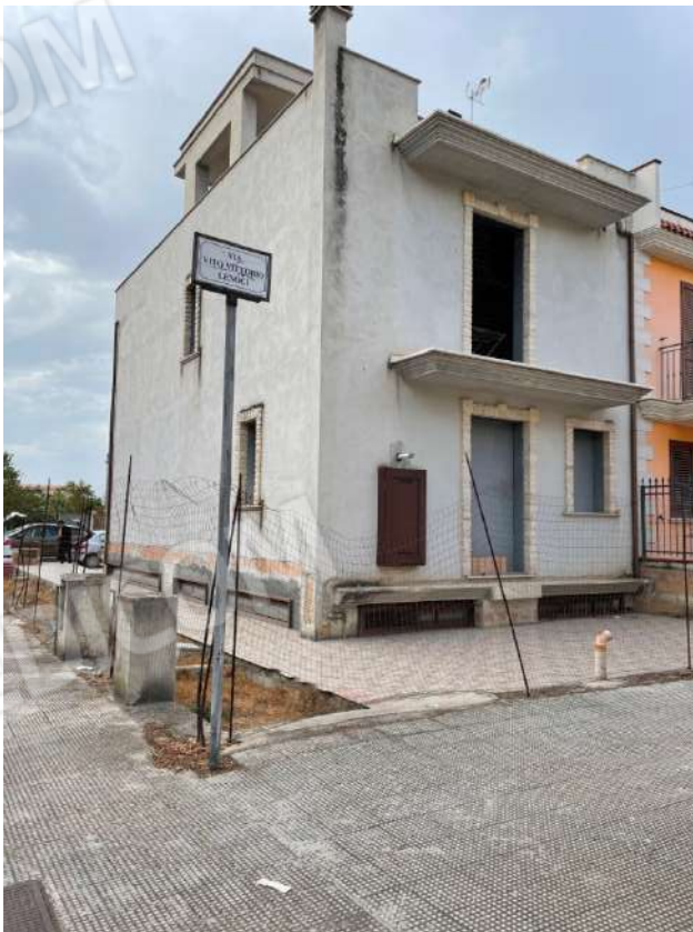
Figura 4. LOTTO UNICO: Fabbricato unifamiliare in cui si trovano gli immobili pignorati al F. 8, P.Ila 3929, Sub. 1 e 2 ubicati in San Ferdinando di Puglia (BT) alla Via V. Bachelet n. 2 e 4 (facciata prospiciente la Via V. Lenoci).