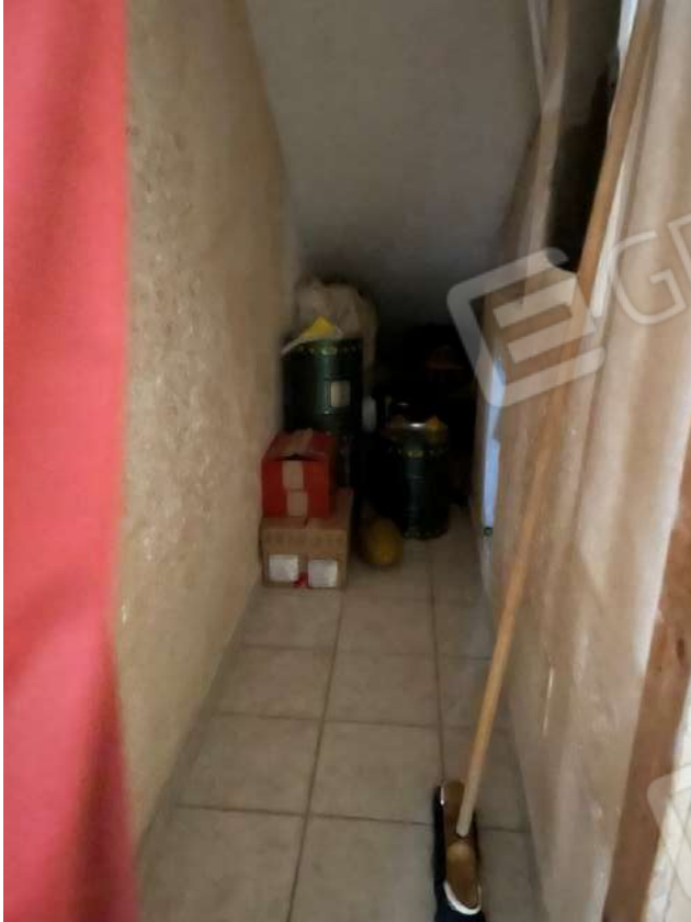
Figura 16. LOTTO UNICO: Immobile pignorato al F. 8, P.IIa 3929, Sub. 2 ubicato in San Ferdinando di Puglia (BT) alla Via V. Bachelet n. 2 (ripostiglio).