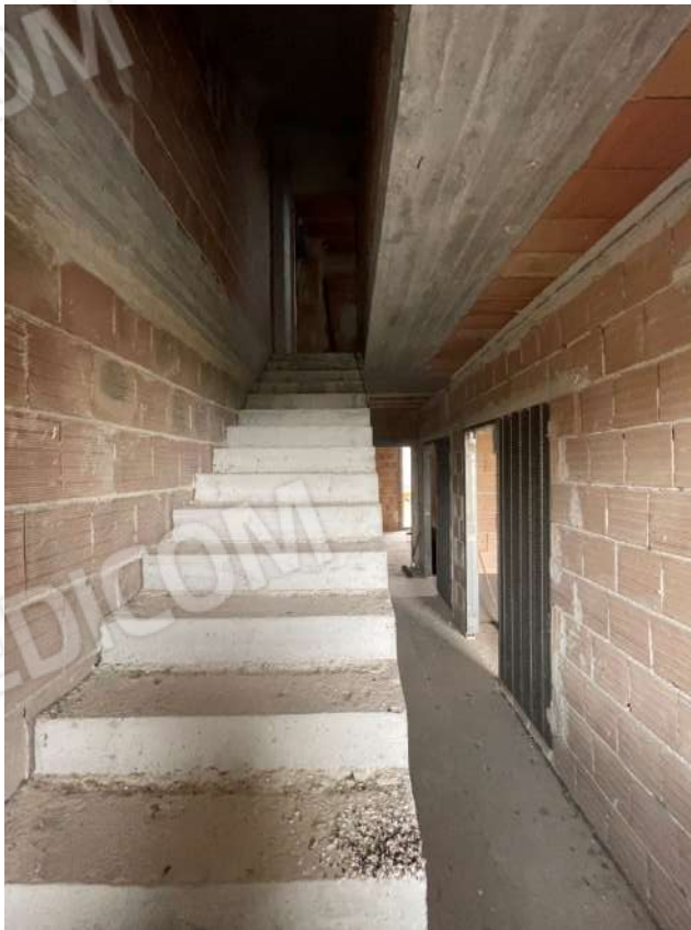
Figura 11. LOTTO UNICO: Immobile pignorato al F. 8, P.Ila 3929, Sub. 1 ubicato in San Ferdinando di Puglia (BT) alla Via V. Bachelet n. 4 (scala interna di accesso al piano secondo).