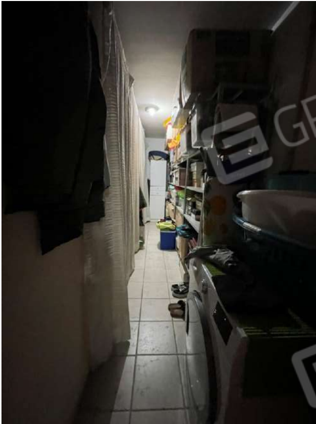
Figura 22. LOTTO UNICO: Immobile pignorato al F. 8, P.Ia 3929, Sub. 2 ubicato in San Ferdinando di Puglia (BT) alla Via V. Bachelet n. 2 (ripostiglio ricavato al piano primo sottostrada in corrispondenza della particella 3402 non pignorata proprietà degli esecutati).