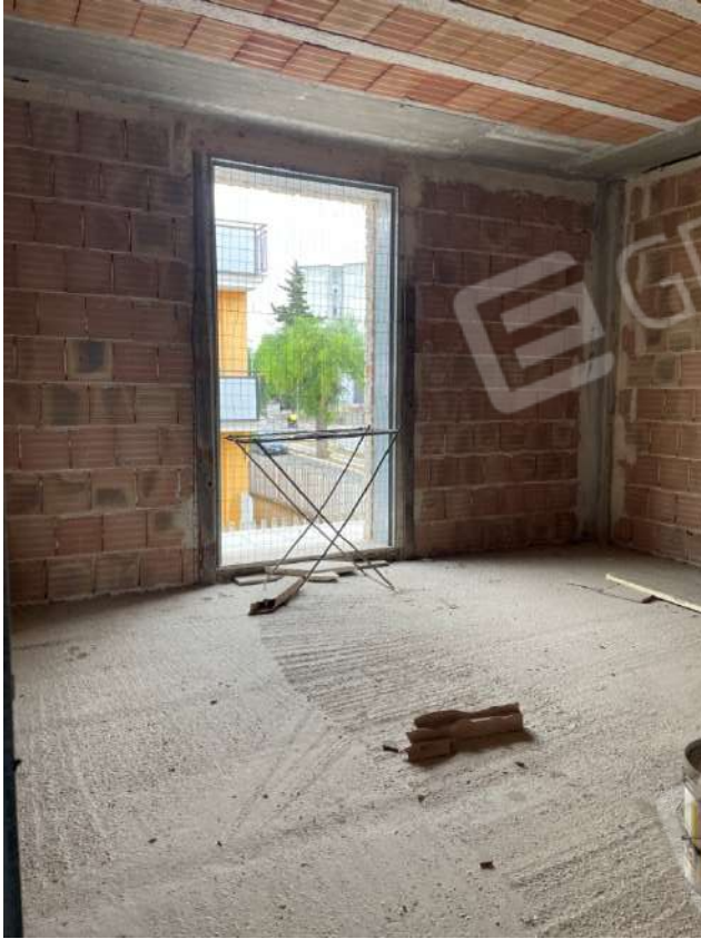
Figura 10. LOTTO UNICO: Immobile pignorato al F. 8, P.Ila 3929, Sub. 1 ubicato in San Ferdinando di Puglia (BT) alla Via V. Bachelet n. 4 (vano prospiciente la Via V. Lenoci posto al piano primo).