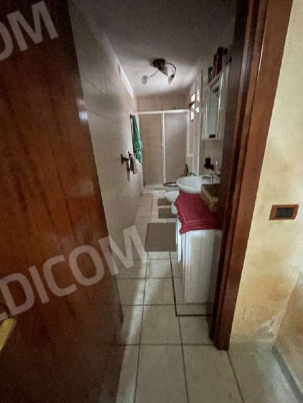
Figura 21. LOTTO UNICO: Immobile pignorato al F. 8, P.Illa 3929, Sub. 2 ubicato in San Ferdinando di Puglia (BT) alla Via V. Bachelet n. 2 (bagno ricavato al piano primo sottostrada in corrispondenza della particella 3398 non pignorata proprietà degli esecutati).