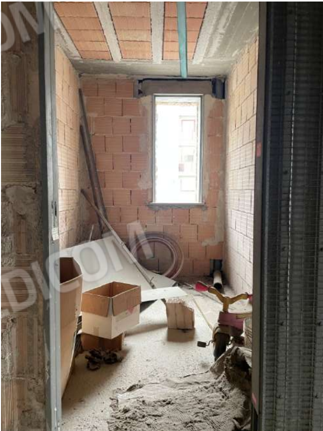
Figura 9. LOTTO UNICO: Immobile pignorato al F. 8, P.Ila 3929, Sub. 1 ubicato in San Ferdinando di Puglia (BT) alla Via V. Bachelet n. 4 (bagno posto al piano primo).