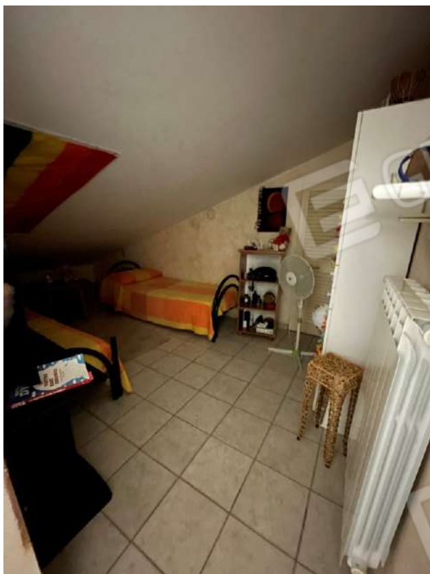
Figura 18. LOTTO UNICO: Immobile pignorato al F. 8, P.Illa 3929, Sub. 2 ubicato in San Ferdinando di Puglia (BT) alla Via V. Bachelet n. 2 (camera ricavata sottola rampa di discesa al box-auto prospiciente la Via V. Bachelet).