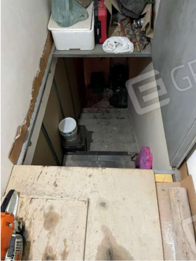
Figura 14. LOTTO UNICO: Immobile pignorato al F. 8, P.IIa 3929, Sub. 1 e 2 ubicato in San Ferdinando di Puglia (BT) alla Via V. Bachelet n. 2 e 4 (botola e scala interna di collegamento tra box-auto e appartamento).