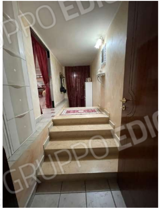
Figura 20. LOTTO UNICO: Immobile pignorato al F. 8, P.Illa 3929, Sub. 2 ubicato in San Ferdinando di Puglia (BT) alla Via V. Bachelet n. 2 (disimpegno ricavato al piano primo sottostrada in corrispondenza della particella 3398 non pignorata proprietà degli esecutati).