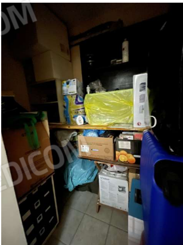
Figura 19. LOTTO UNICO: Immobile pignorato al F. 8, P.Illa 3929, Sub. 2 ubicato in San Ferdinando di Puglia (BT) alla Via V. Bachelet n. 2 (ripostiglio ricavato al piano primo sottostrada in corrispondenza della particella 3398 non pignorata proprietà degli esecutati).