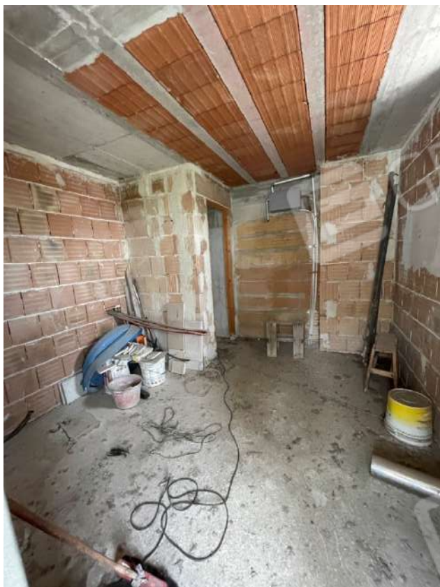
Figura 12. LOTTO UNICO: Immobile pignorato al F. 8, P.Ila 3929, Sub. 1 ubicato in San Ferdinando di Puglia (BT) alla Via V. Bachelet n. 4 (torrino posto al piano secondo).