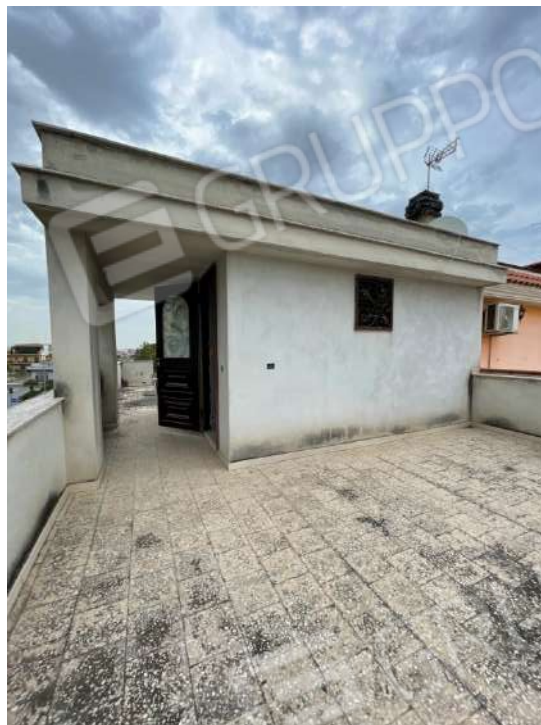
Figura 13. LOTTO UNICO: Immobile pignorato al F. 8, P.Ila 3929, Sub. 1 ubicato in San Ferdinando di Puglia (BT) alla Via V. Bachelet n. 4 (terrazzo posto al piano secondo).