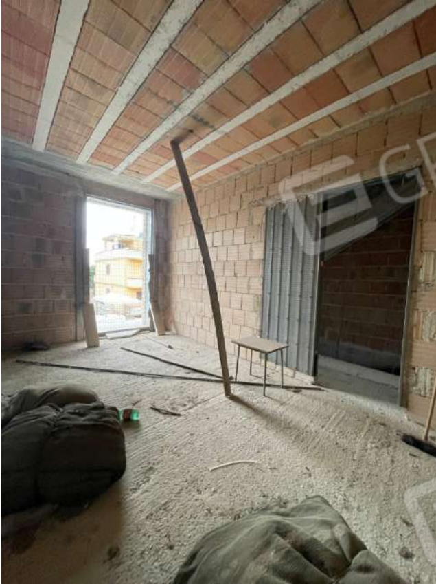
Figura 8. LOTTO UNICO: Immobile pignorato al F. 8, P.Ila 3929, Sub. 1 ubicato in San Ferdinando di Puglia (BT) alla Via V. Bachelet n. 4 (vano prospiciente la Via V. Bachelet posto al piano primo).