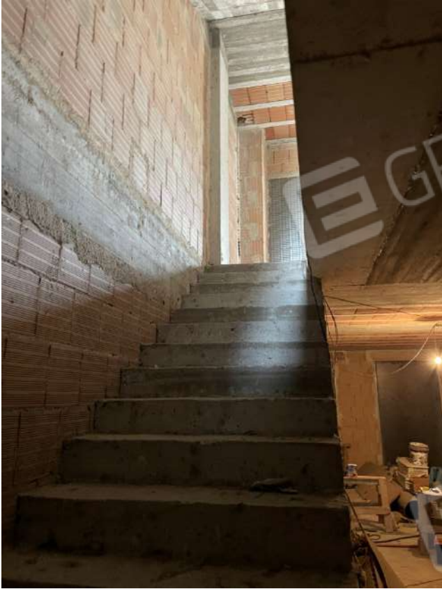
Figura 6. LOTTO UNICO: Immobile pignorato al F. 8, P.Ila 3929, Sub. 1 ubicato in San Ferdinando di Puglia (BT) alla Via V. Bachelet n. 4 (scala interna di accesso al piano primo).