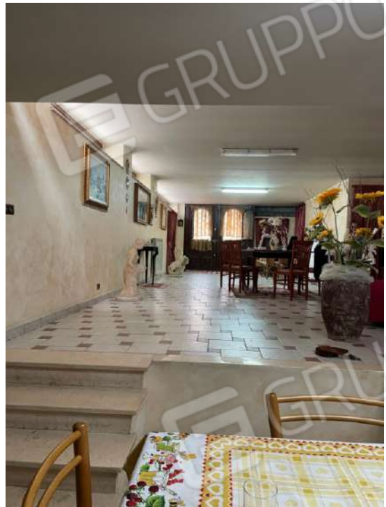
Figura 15. LOTTO UNICO: Immobile pignorato al F. 8, P.IIa 3929, Sub. 2 ubicato in San Ferdinando di Puglia (BT) alla Via V. Bachelet n. 2 (garage adibito ad abitazione – soggiorno e cucina).