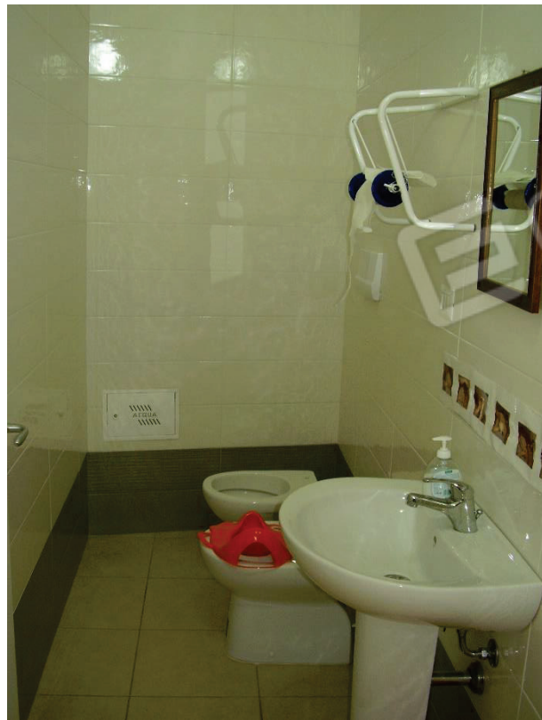
Figura 7 - Servizio igienico