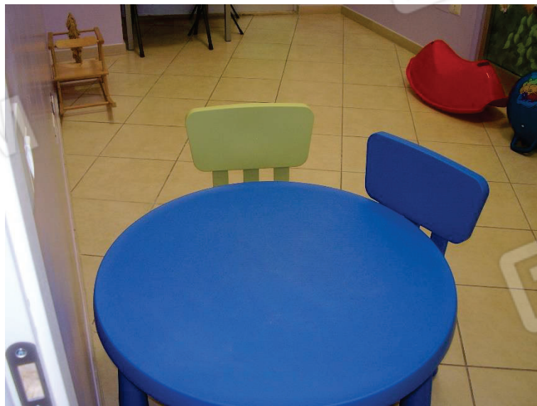
Figura 10 - Aula