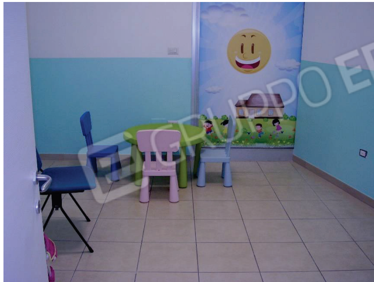
Figura 8 – Aula