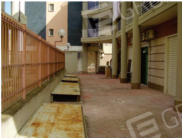
Figura 4 - Cortile interno recintato