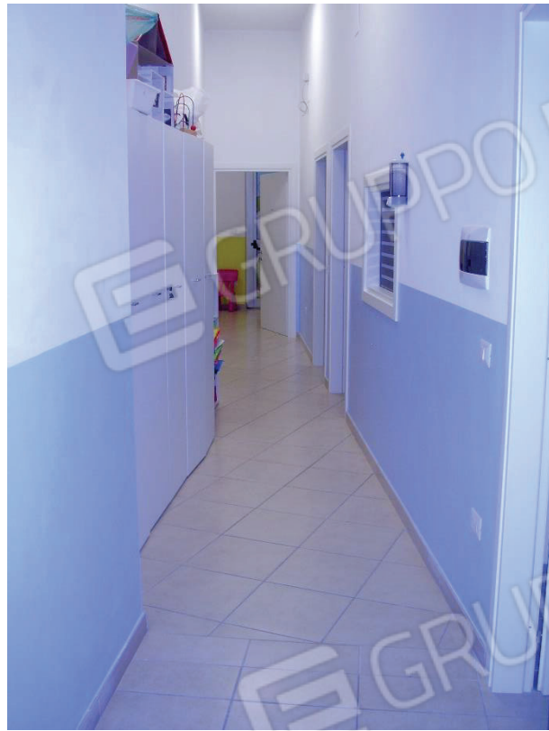
Figura 6 - Disimpegno/corridoio