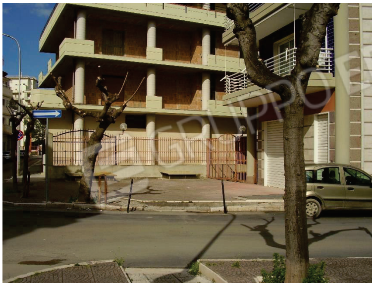
Figura 3 - Corte esclusiva esterna