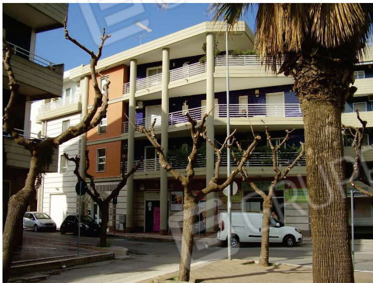
Figura 1 - Edificio condominiale di Via Trento, 27 – Cerignola