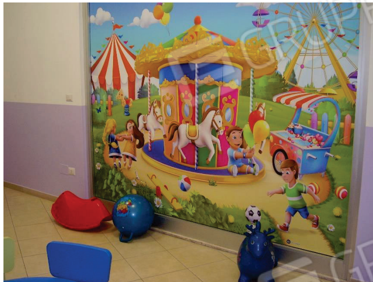
Figura 9 – Aula