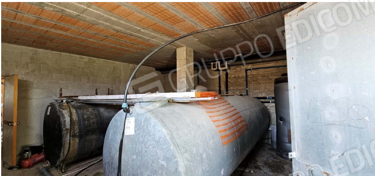
Vano difforme: deposito per riserve idriche, piano terra