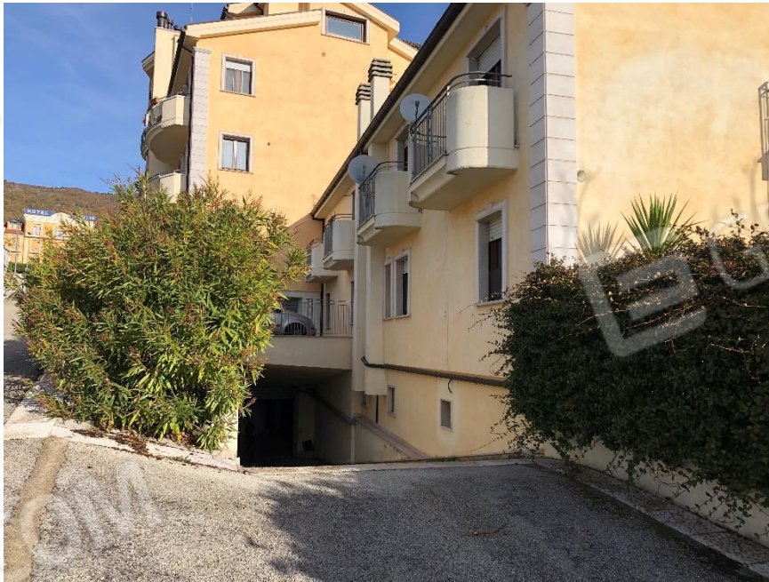
Foto n. 2: Ingresso bene oggetto di stima piano secondo sottostrada