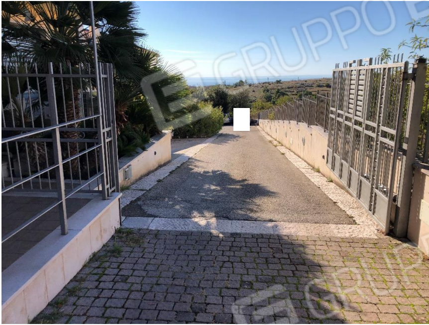
Foto n. 1: Ingresso bene oggetto di stima – Viale Aldo Moro n. 163