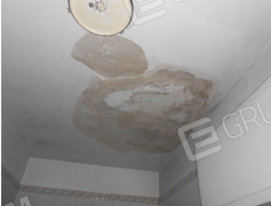
(g) Fotografie dell'abitazione a piano rialzato: salotto (a); cucina (b); ripostiglio (c); bagni (d); corridoio (e); camere (f); rivestimenti danneggiati da fenomeni di umidità (g).