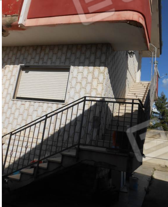
Fotografie della palazzina di cui fanno parte i cespiti staggiati: facciate (a); rampa di discesa al seminterrato (b); rampe di scale di accesso al piano rialzato (c); scalinate di accesso al piano 1 (d).