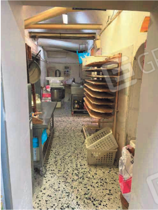
Figura 7. LOTTO UNO: Immobile pignorato al F. 31, P.IIa 3349, Sub. 5 ubicato in San Severo alla Via Francesco De Ambrosio n. 14 (retro vano).