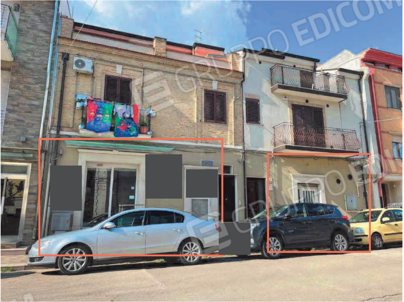
Figura 3. LOTTO UNO: Fabbricati in cui si trovano gli immobili pignorati al F. 31, P.Illa 3348, Sub. 4 e P.Illa 3349, Sub. 5 ubicati in San Severo alla Via Francesco De Ambrosio n. 6, 8 e 14.