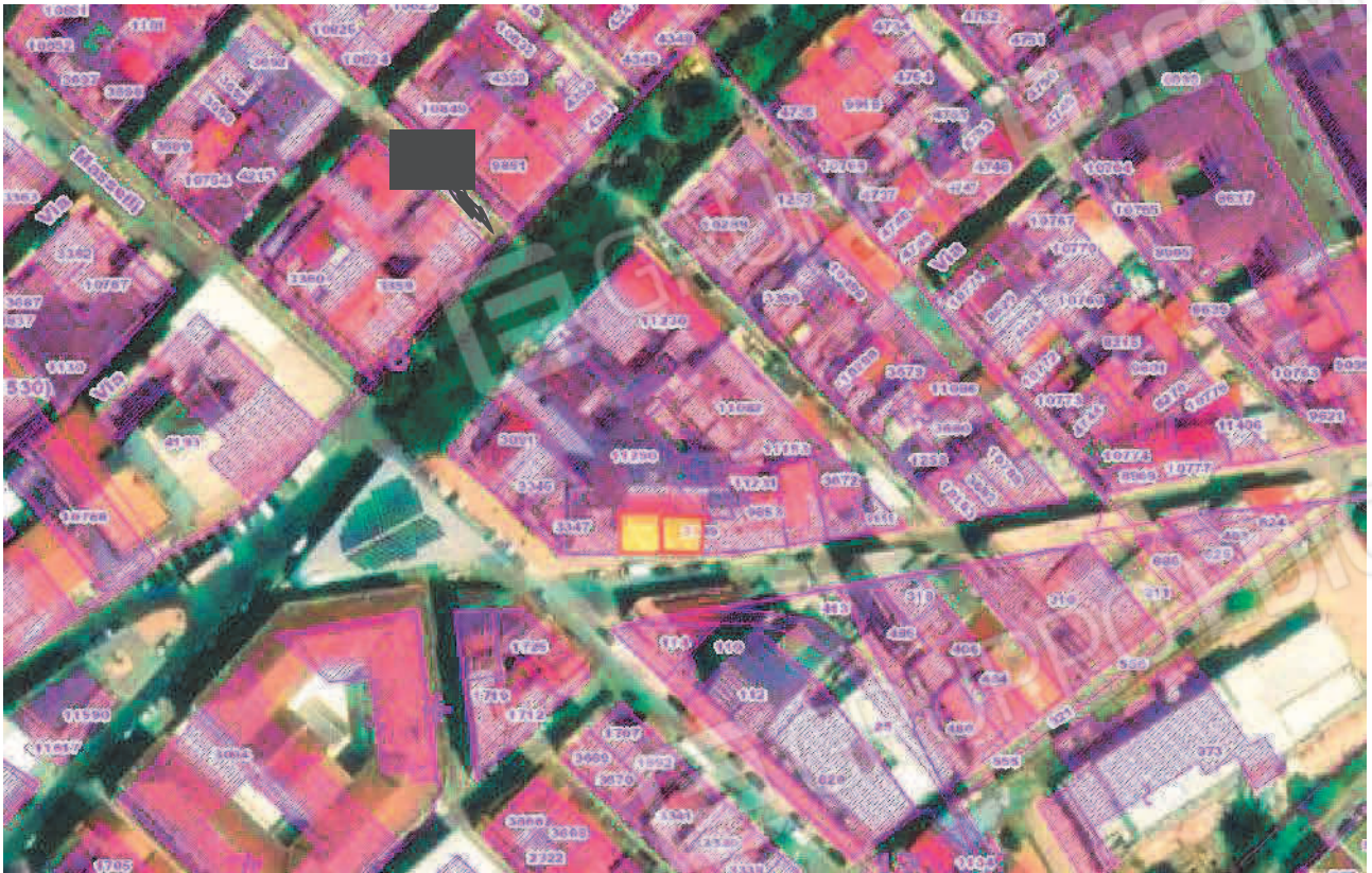
Figura 1. LOTTO UNO: Ortofoto catastale degli immobili pignorati al F. 31, P.Illa 3348, Sub. 4 e P.Illa 3349, Sub. 5 ubicati in San Severo alla Via Francesco De Ambrosio n. 6, 8 e 14.