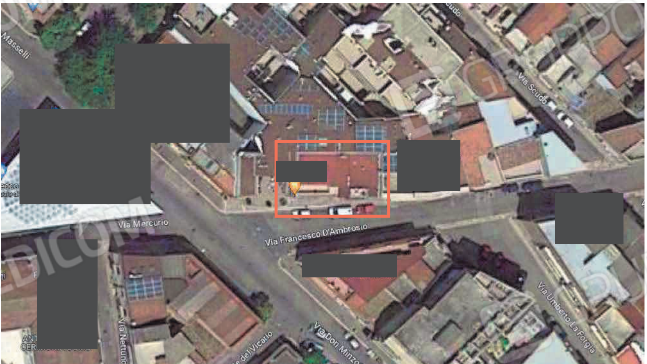
Figura 2. LOTTO UNO: Ortofoto degli immobili pignorati al F. 31, P.Illa 3348, Sub. 4 e P.Illa 3349, Sub. 5 ubicati in San Severo alla Via Francesco De Ambrosio n. 6, 8 e 14.