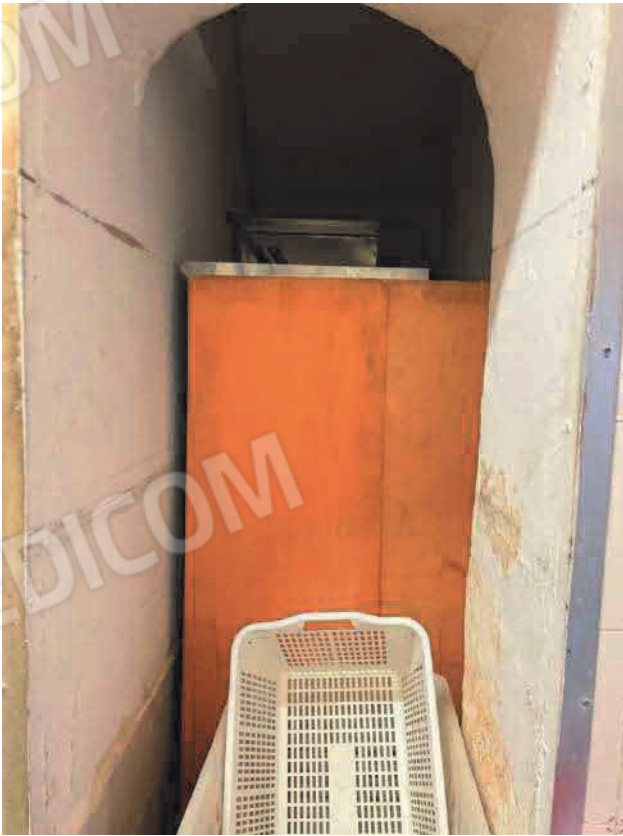
Figura 8. LOTTO UNO: Immobile pignorato al F. 31, P.IIa 3349, Sub. 5 ubicato in San Severo alla Via Francesco De Ambrosio n. 14 (sottoscala).