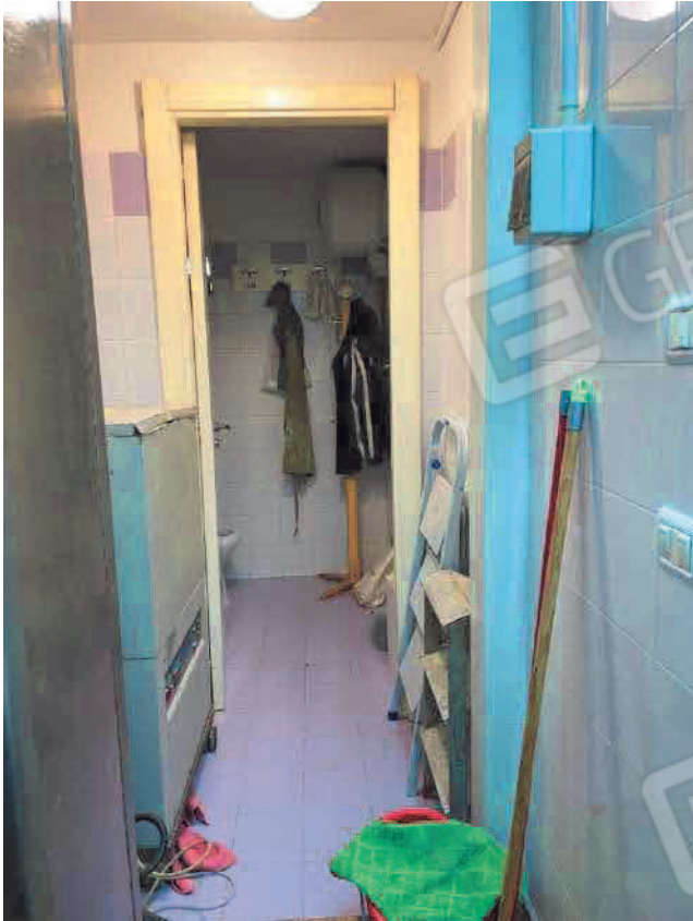
Figura 9. LOTTO UNO: Immobile pignorato al F. 31, P.IIa 3349, Sub. 5 ubicato in San Severo alla Via Francesco De Ambrosio n. 14 (disimpegno, anti-bagno e bagno).