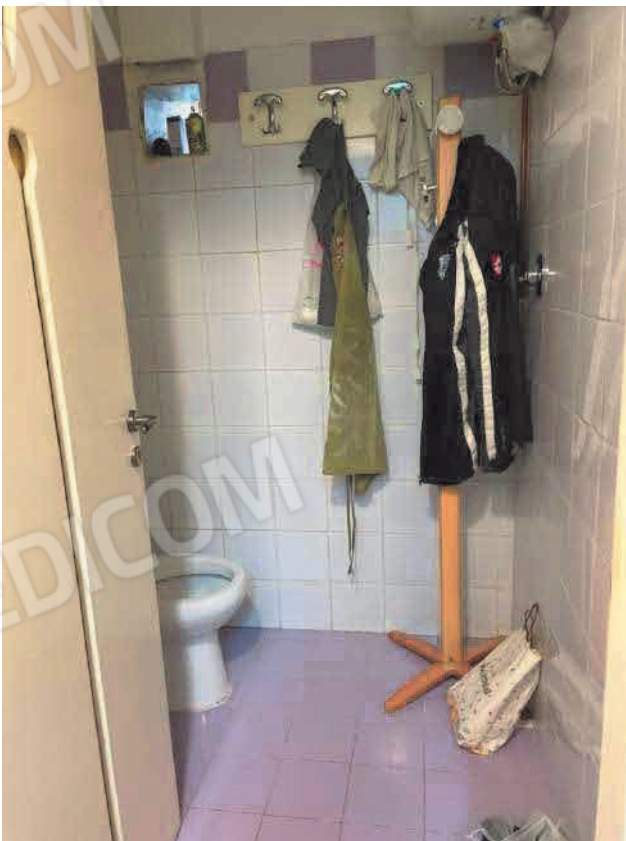
Figura 10. LOTTO UNO: Immobile pignorato al F. 31, P.IIa 3349, Sub. 5 ubicato in San Severo alla Via Francesco De Ambrosio n. 14 (bagno).