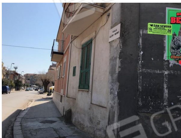
Vista degli esterni da Via Piave e Via Aldo Moro