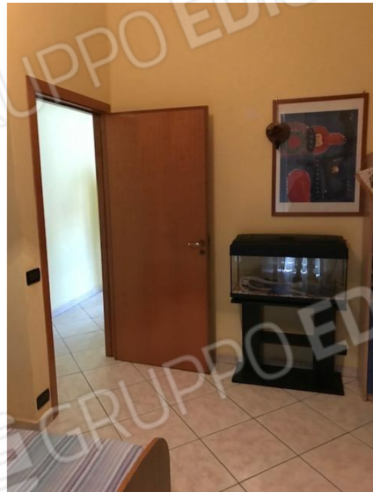
Camera da letto della porzione nord dell'appartamento