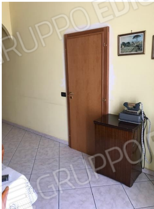
Particolare della cucina e a destra la porta che porta al vano scale che conduce al piano secondo