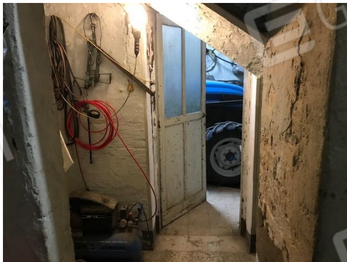
Rimessa nord del piano terra