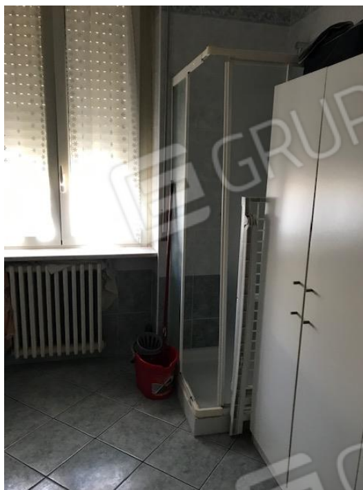
Sala da bagno della porzione nord dell'appartamento