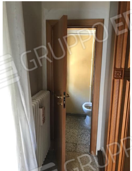
Camera da letto e servizio igienico comunicante