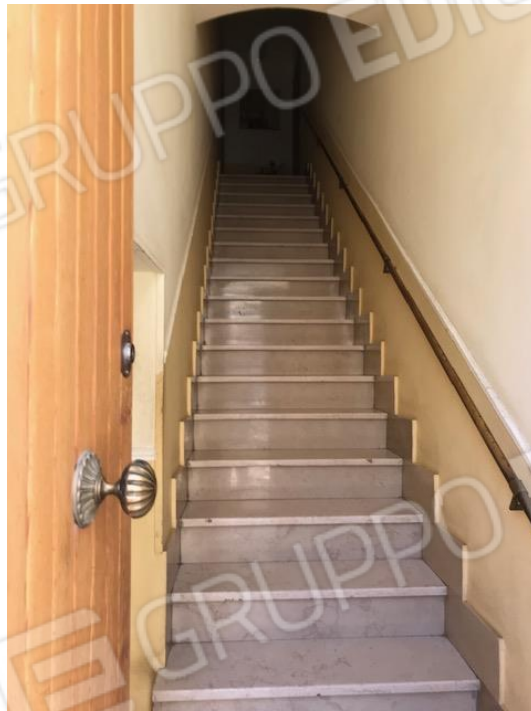
Portone e Scalinata di ingresso