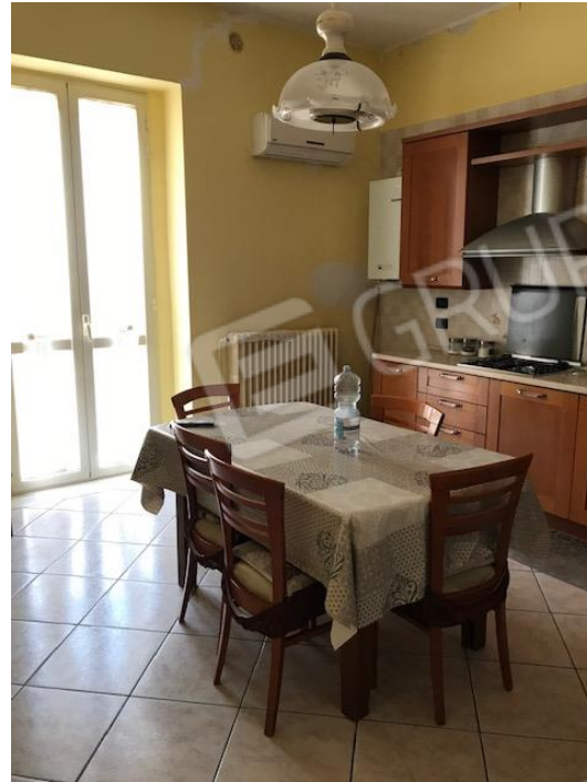
Corridoio e cucina della porzione nord dell'appartamento