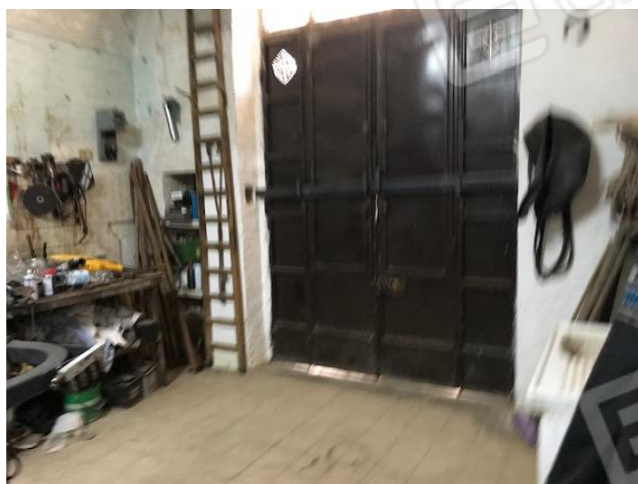
Rimessa sud del piano terra