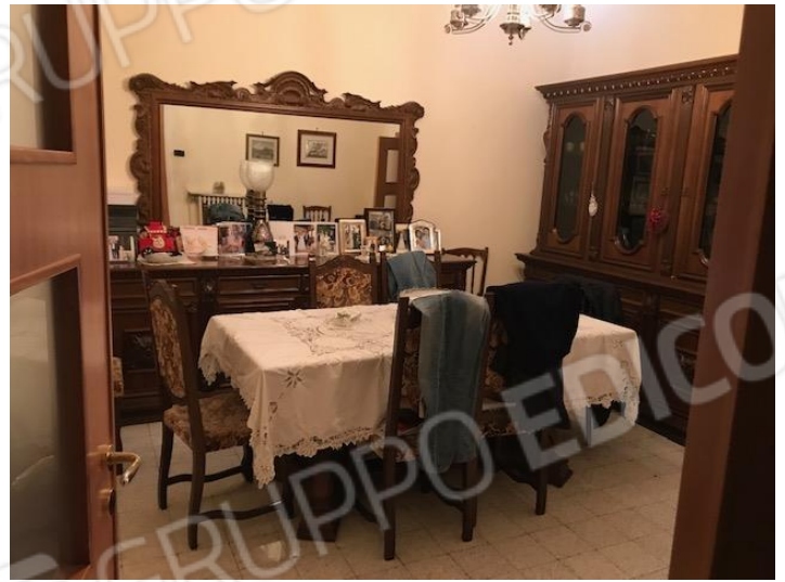
Ingresso alla porzione sud dell'appartamento