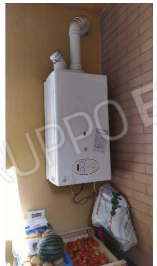
FOTO N° 13-14 -15 – Zona ex terrazzino sottotetto e balcone al p. 3.