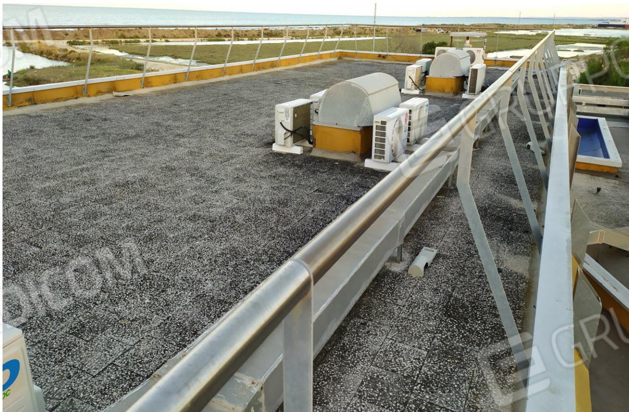
FOTO Imp.10: in evidenza, esternamente sulle coperture piane, parte degli impianti tecnologici di climatizzazione.