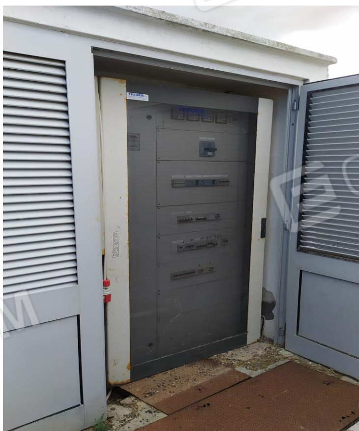
FOTO Imp.8: in evidenza, esternamente a sud e nei pressi dell'Hotel internamente all'area recintata, i quadri elettrici annessi al gruppo elettrogeno contiguo.