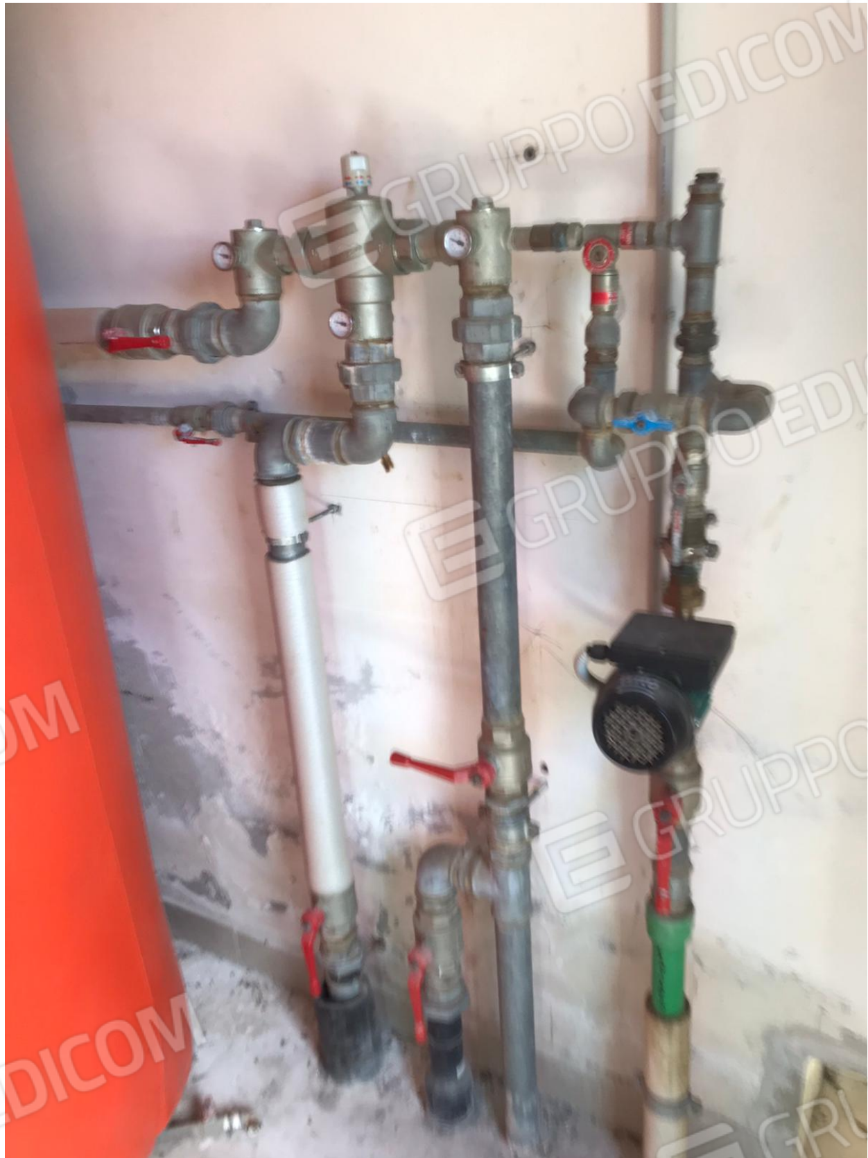
FOTO Imp.5: in evidenza, nel vano Centrale Termica parte degli impianti di riscaldamento ed acqua calda sanitaria.