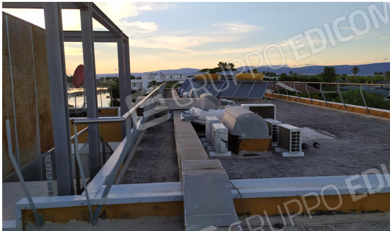
FOTO Imp.11: in evidenza, esternamente sulle coperture piane, parte degli impianti tecnologici di climatizzazione ed i pannelli solari per l'acqua calda sanitaria con serbatoi di accumulo.