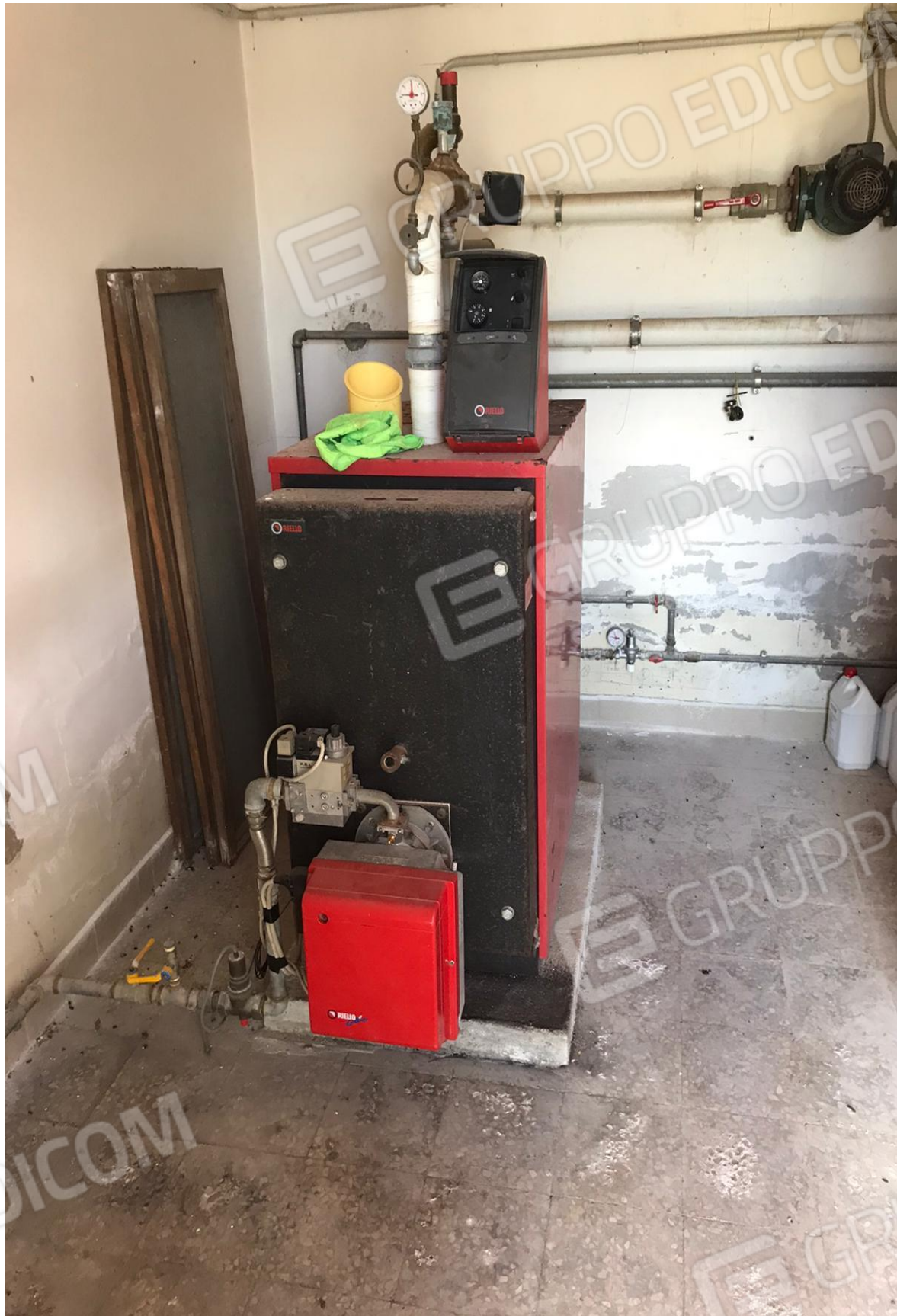
FOTO Imp.3: in evidenza, nel vano Centrale Termica il generatore termico e parte degli impianti di riscaldamento ed acqua calda sanitaria.