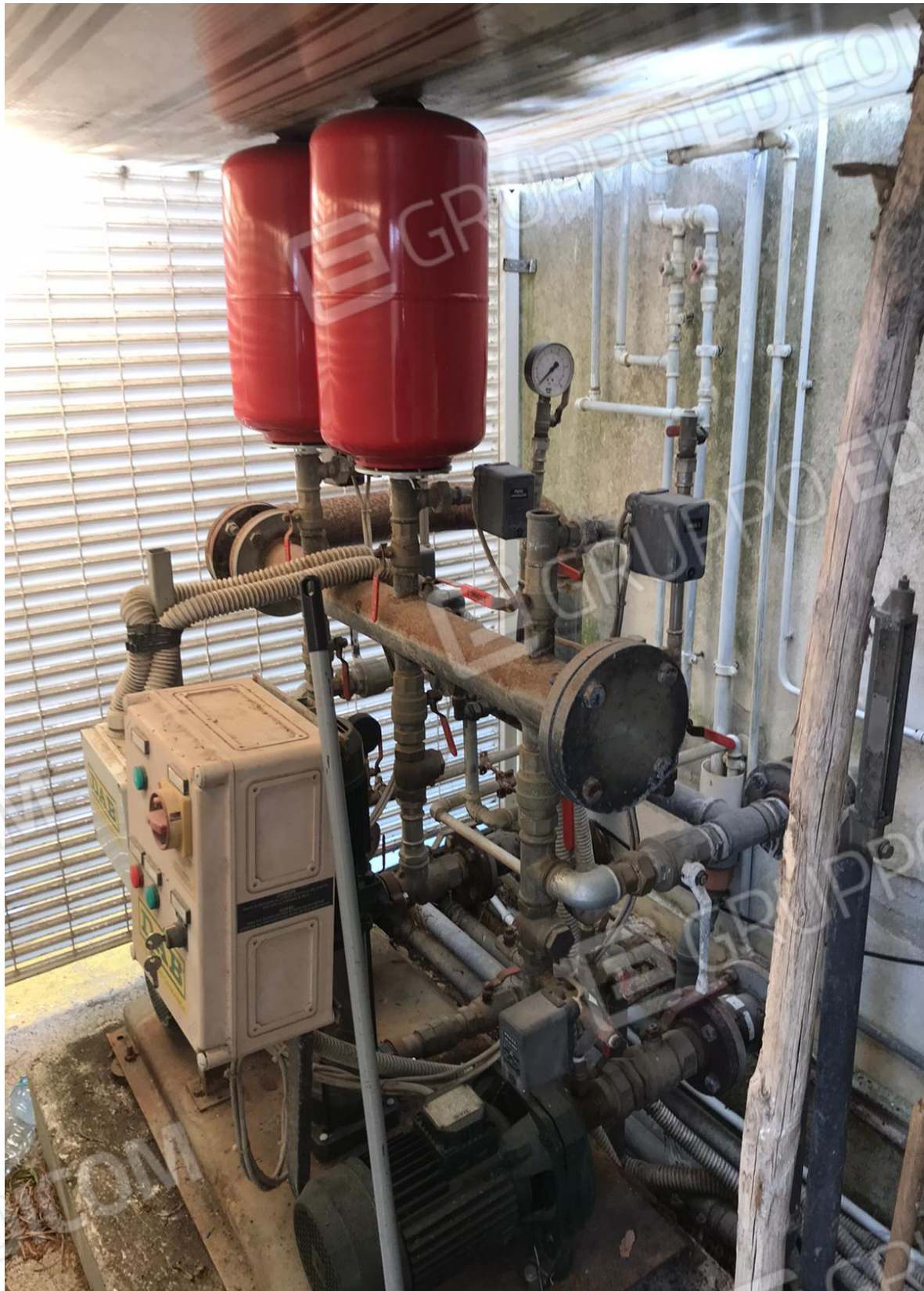
FOTO Imp.1: in evidenza, nel vano contiguo la Centrale Termica parte degli impianti di autoclave/antincendio.