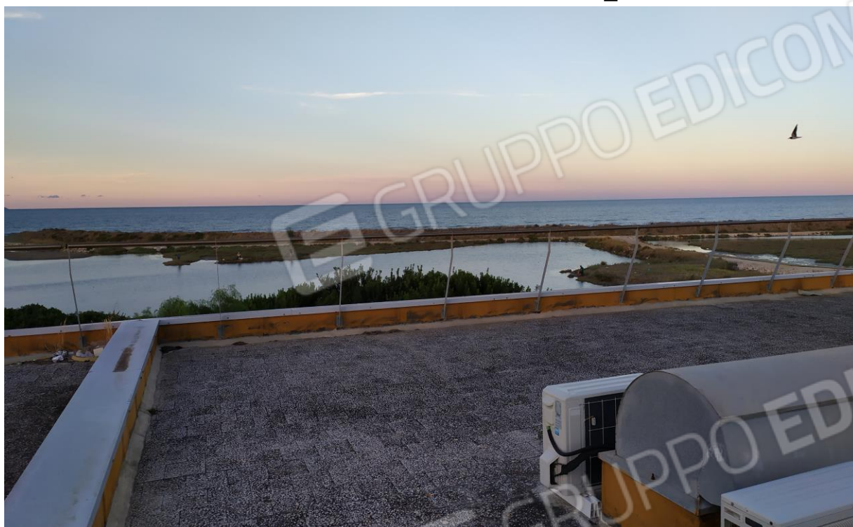
FOTO Imp.13: in evidenza, esternamente sulle coperture piane, parte degli impianti tecnologici di climatizzazione e l'ampia veduta panoramica verso il mare.