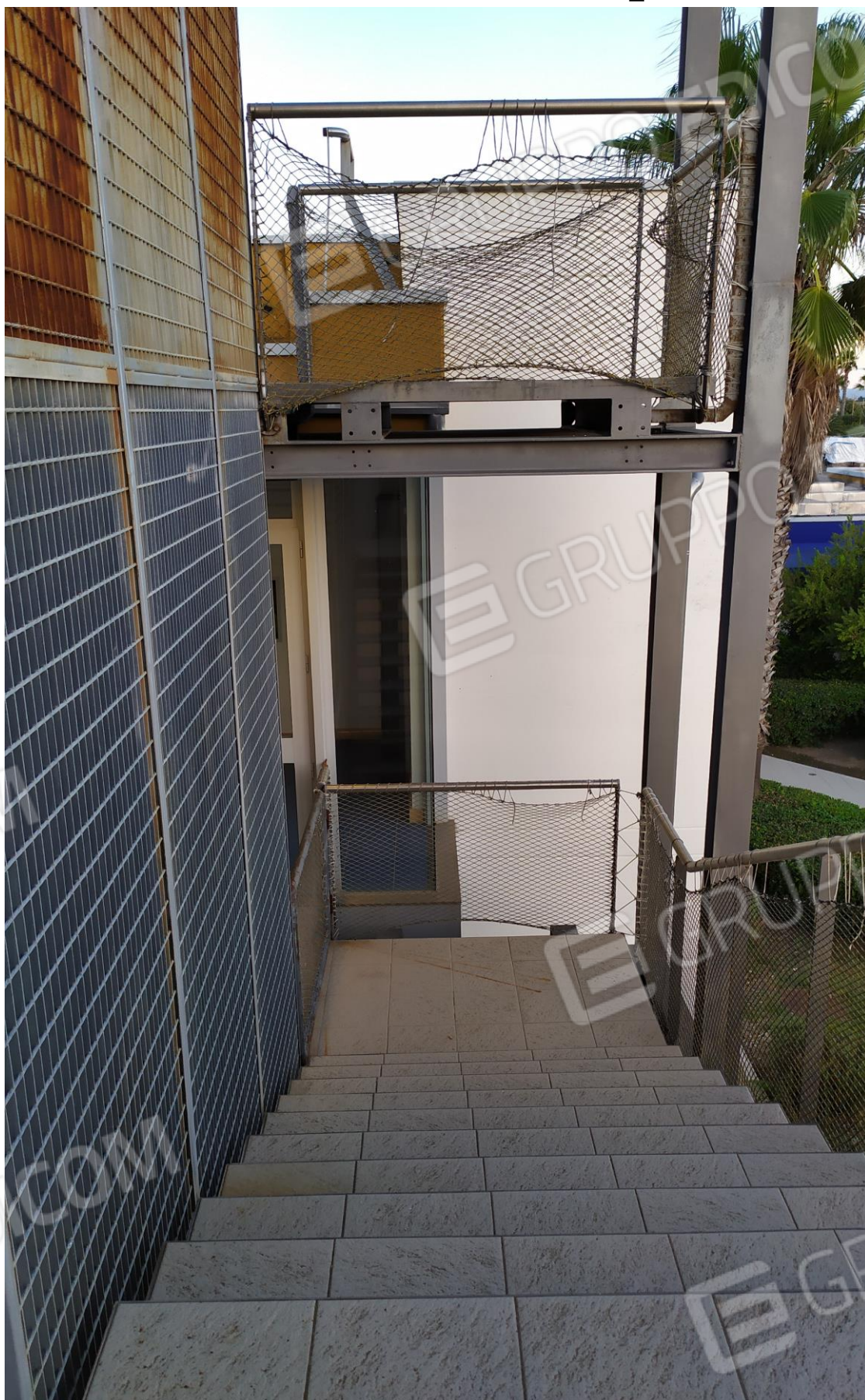
FOTO Imp.20: in evidenza, la scala metallica prefabbricata che consente l'accesso esternamente sulle coperture piane per la manutenzione delle stesse e degli impianti tecnologici ivi installati.