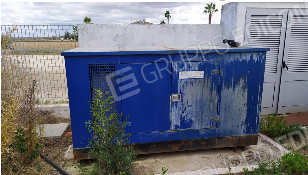
FOTO Imp.7: in evidenza, esternamente a sud e nei pressi dell'Hotel internamente all'area recintata, il gruppo elettrogeno ed i contigui quadri elettrici.