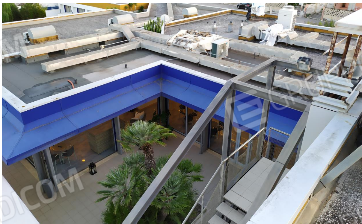
FOTO Imp.14: in evidenza, esternamente sulle coperture piane, parte degli impianti tecnologici di climatizzazione.