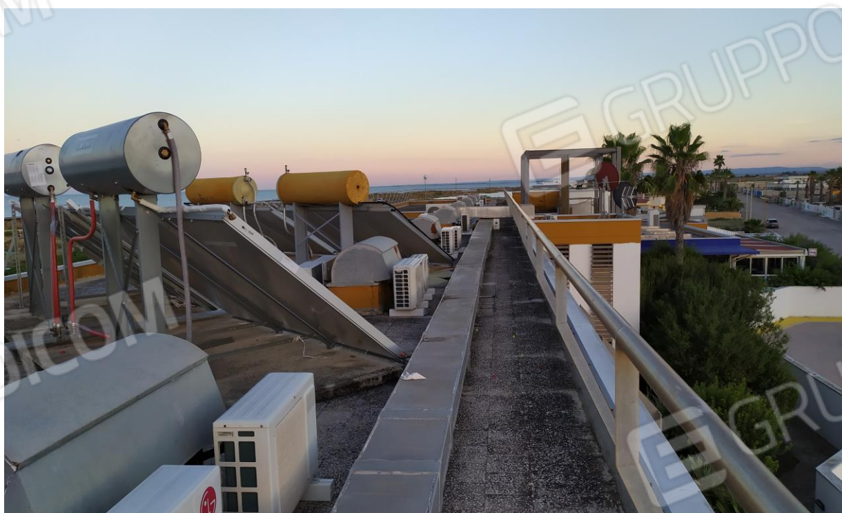
FOTO Imp.16: in evidenza, esternamente sulle coperture piane, parte degli impianti tecnologici di climatizzazione ed i pannelli solari per l'acqua calda sanitaria con serbatoi di accumulo.