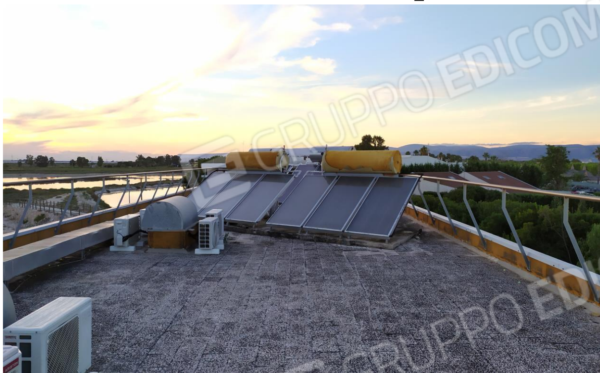
FOTO Imp.17: in evidenza, esternamente sulle coperture piane, parte degli impianti tecnologici di climatizzazione ed i pannelli solari per l'acqua calda sanitaria con serbatoi di accumulo.