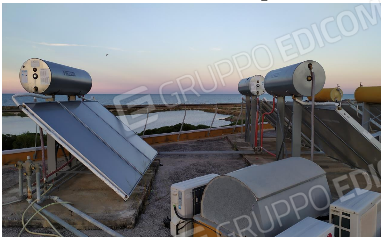
FOTO Imp.15: in evidenza, esternamente sulle coperture piane, parte degli impianti tecnologici di climatizzazione ed i pannelli solari per l'acqua calda sanitaria con serbatoi di accumulo.