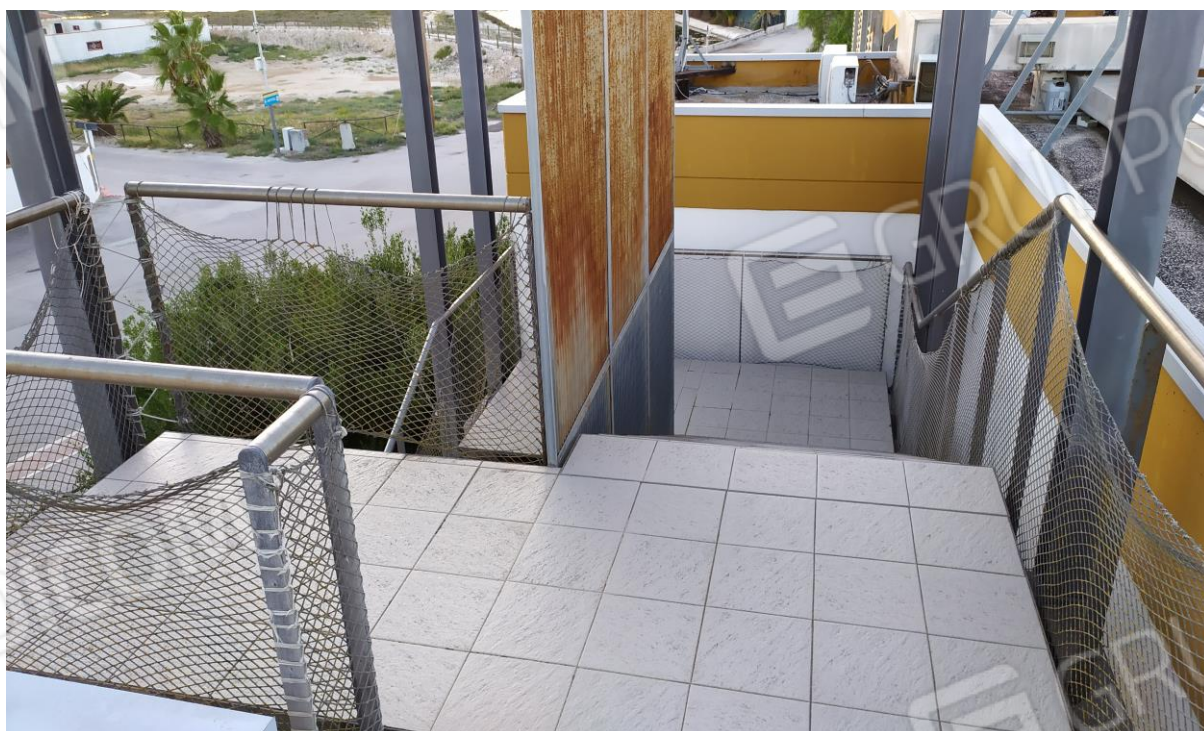
FOTO Imp.18: in evidenza, la scala metallica prefabbricata che consente l'accesso esternamente sulle coperture piane per la manutenzione delle stesse e degli impianti tecnologici ivi installati.