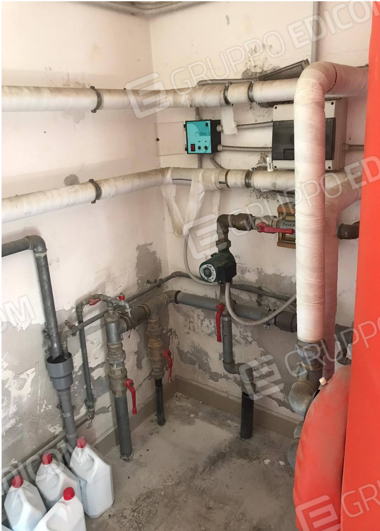
FOTO Imp.4: in evidenza, nel vano Centrale Termica parte degli impianti di riscaldamento ed acqua calda sanitaria.