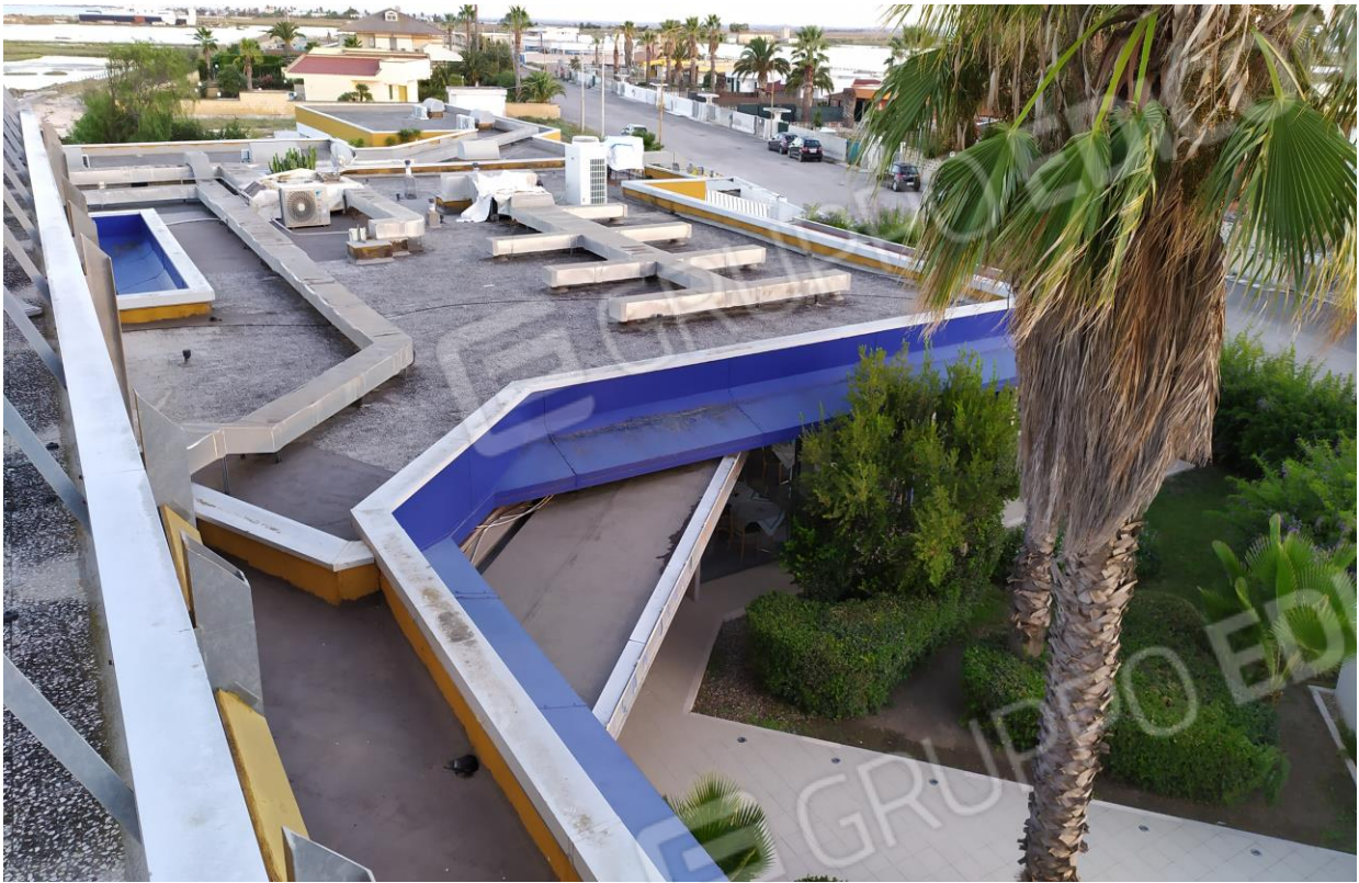
FOTO Imp.9: in evidenza, esternamente sulle coperture piane, parte degli impianti tecnologici di climatizzazione.