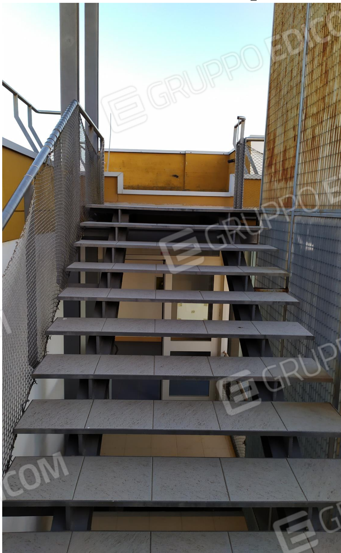
FOTO Imp.19: in evidenza, la scala metallica prefabbricata che consente l'accesso esternamente sulle coperture piane per la manutenzione delle stesse e degli impianti tecnologici ivi installati.