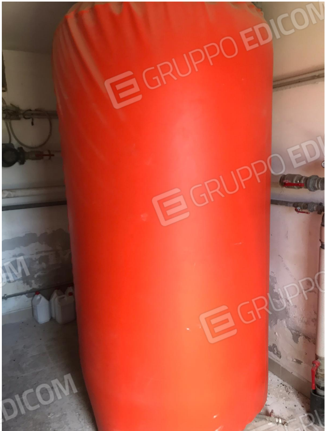
FOTO Imp.6: in evidenza, nel vano Centrale Termica parte degli impianti di riscaldamento ed acqua calda sanitaria ed il serbatoio di accumulo della stessa.