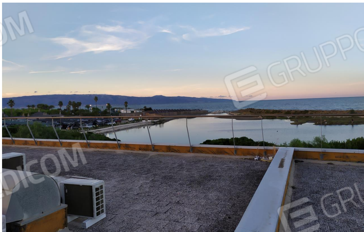
FOTO Imp.12: in evidenza, esternamente sulle coperture piane, parte degli impianti tecnologici di climatizzazione e l'ampia veduta panoramica verso il mare.